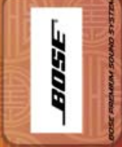
BOSE PREMIUM SOUND SYSTEM