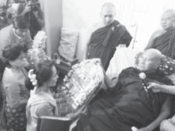
လူထုခေါင်းဆောင်ဒေါ်အောင်ဆန်းစုကြည် မဟာမုနိဘုရားကြီးသို့ ဝင်ရောက်ဖူးမြော်ကြည့်ည့်စဉ်(ဝဲ)နှင့် ရွှေကျင်သာသနာပိုင် ဝါဆိုဆရာတော် ဘဒ္ဒန္တအင်္ဂုယအား လှူဖွယ်ပစ္စည်းများဆက်ကပ်လှူဒါန်းစဉ်။

ကံတက်ကုန်း မစိုးရိမ်ကျောင်းတိုက်တွင် ဗိုလ် ချုပ်အောင်ဆန်းနှစ်(၁၀၀)ပြည့် အထိမ်းအမှတ် လူထု ခေါင်းဆောင်ဒေါ်အောင်ဆန်းစုကြည်သည် ဆရာတော်ကြီးများထံမှ ဩဝါဒခံယူပြီး သင်္ကန်း နှင့်တကွ လှူဖွယ်ပစ္စည်းများ ကပ်လှူကာ နေ့ဆွမ်း ဆက်ကပ်လှူဒါန်းသည်။ လှူဖွယ်များကပ်လှူအပြီး ကံတက်ကုန်းမစိုးရိမ်ကျောင်းတိုက် ဘုန်းတော်ကြီး သင် ပညာရေးကျောင်းမှ ကျောင်းသားကျောင်းသူ လေးများအား ပညာရေးနှင့် ပတ်သက်သည့် အကြောင်းအရာများကို ဟောပြောခဲ့သည်။