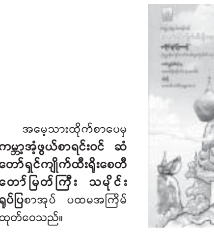
အမေသားထိုက်စာပေမှ ကမ္ဘာ့အံ့ဖွယ်စာရင်းဝင် ဆံတော်ရှင်ကျိုက်ထီးရိုးစေတီတော် ဖြတ်ကြီး သင်္ဂိုင်း ရုပ်ပြစာအုပ် ပထမအကြိမ် ထုတ်ဝေသည်။