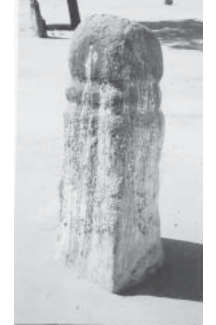
ရတနာပုံမိဖုရား တည်ထားသောသိမ်မှ ရှေးဟောင်းသိမ်တိုင်