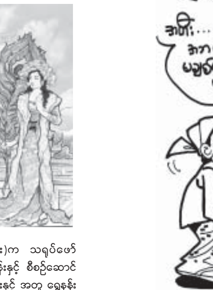
အမေသားထိုက်စာပေမှ ကမ္ဘာ့အံ့ဖွယ်စာရင်းဝင် ဆံတော်ရှင်ကျိုက်ထီးရိုးစေတီတော် ဖြတ်ကြီး သင်္ဂိုင်း ရုပ်ပြစာအုပ် ပထမအကြိမ် ထုတ်ဝေသည်။

“သူလာဖို့ သုံးကြိမ်သုံးခါ ပျက်ကွက်ပါတယ်။ တရားရုံးက နှစ်နာကြေးပေးလျော်ဖို့ ပြောပေမယ့် မရပါဘူး။ ဒါကြောင့် သူ့အိမ်နဲ့မြေကို ကြမ်းခင်း