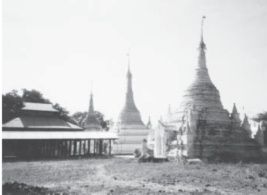
လင်းယဉ်ရွာတွင် ရတနာပုံမိဖုရားတည်ထားခဲ့တဲ့ သက်တော်ရဘုရား (ဘုရားသုံးဆူအနက် အလယ်တစ်ဆူဖြစ်ပါသည်)

မိဘနှစ်ပါး ကျေးဇူးအပ်တဲ့ ရတနာပုံမိဖုရား vifယဉ်မိဖုရား(ရတနာပုံ) ဘုရားတည် တော့လင်းယဉ်တစ်ရွာတည်းမှာမဟုတ်ဘူး။ မိဖုရားက သူ့အဖေရွာမှာ တစ်ဆူ၊ အမေရွာမှာ တစ်ဆူ၊ ဘုရားနှစ်ဆူ ပြိုင်တူတည်တယ်လို့ ဆိုပါတယ်။ အဲဒီဘုရားနှစ်ဆူစလုံးကို သက်တော်ရ ဆုတောင်း ပြည့်ဘုရားဆိုပြီး ဘွဲ့တော်ချီးပေးပါတယ်။ သက်ကြီးစကား သက်ငယ်ကြားဆိုသလို လင်းယဉ်ရွာနဲ့ မိုးသောက်ရွာက လူကြီးသူမတွေ ပြောတာကတော့ အဖေက လင်းယဉ်ရွာသားဖြစ်ပြီး မိခင်က ဘောက်သောက်ရွာသူလို့ ဆိုပါတယ်။ အဲဒီအချိန်က ဘောက်သောက်ရွာလို့ ခေါ်ခဲ့ပေမယ့်၊ အခုတော့ မိုးသောက်ရွာဆိုပြီး ပြောင်းခေါ်လာကြောင်း လေ့လာတွေ့ရှိရပါတယ်။