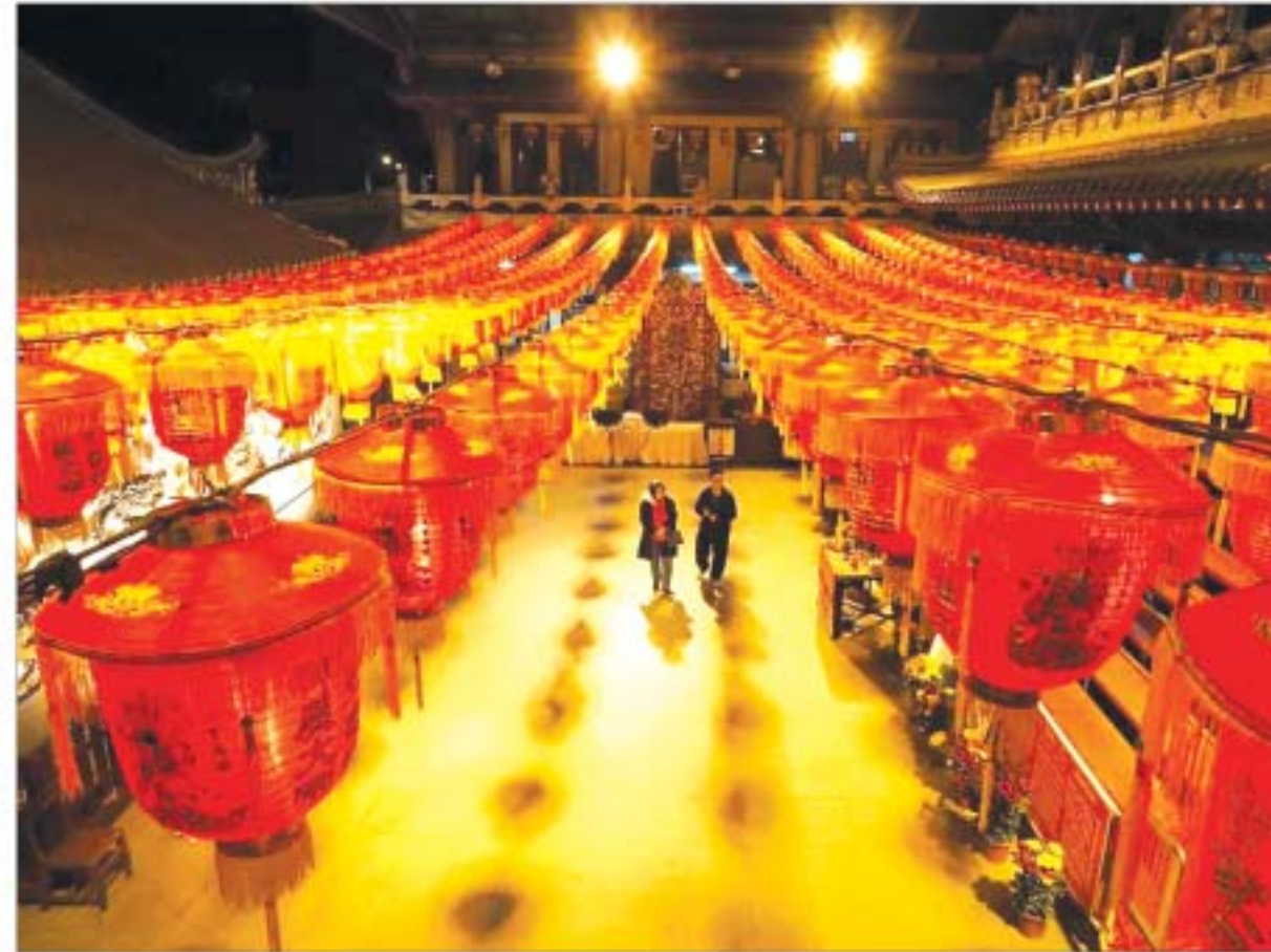
တရုတ်လူမျိုးတို့၏ နှစ်သစ်ကူးပွဲတော်တွင် သီတဲနစ်သို့ ကူးပြောင်းခြင်းအထိမ်းအမှတ်ပွဲ (၂၀၁၅ ခုနှစ် လေထဲပိရီ ၁၉ ရက်) ကို တွေ့မြင်ရစဉ်

- EG ရုပ်ရှင် [ ef-b mo my e f i k o n f