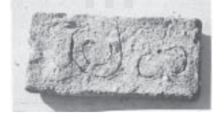
လင်းယဉ်ရွာသူမိဖုရား(ရတနာပုံ)တည်တဲ့ သက်တော်ရဘုရားပရိဝုဏ်အတွင်းမှ တွေ့ရှိသော ရှေးဟောင်းအုတ်ချပ်

လင်းယဉ်မိဖုရား(ရတနာပုံ)တည်ထားကိုးကွယ်ခဲ့တဲ့ သက်တော်ရဘုရားပွဲတော်ကို ဝါဝင်ဝါဆိုလပြည့်နေ့မှာတစ်ဆူနဲ့ ဝါထွက်သီတင်းကျွတ်လပြည့်နေ့မှာတစ်ဆူ ကျင်းပပါတယ်။ ဘုရားပွဲတော်များမှာ စည်ကားသိုက်မြိုက်စွာ ခင်းကျင်းကျင်းပကြပါတယ်။ ရပ်နန်းရပ်ဝေးမှ ဧည့်ပရိသတ်များလာရောက်ပူဇော်လှူဒါန်းကြတဲ့အတွက် နှစ်စဉ် အလွန်စည်ကားကြောင်းသိရပါတယ်။