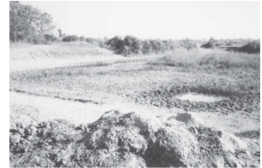
လင်းယဉ်ရွာသူ ရတနာပုံမိဖုရားတည်ခဲ့တဲ့ မေတ္တာကန်ရေခန်းနေပုံ

တွေ လို့ထင်ပါတယ်။ မိဖုရားတည်တဲ့ဘုရားနဲ့သိမ်နဲ့ ပတ်သက်လို့ ဒီနေ့အထိ ပြောဆိုနေကြတာကတော့ အိမ်နေရာ ဘုရား၊ ကျီနေရာ သိမ်လို့ဆိုပါတယ်။ အကြောင်းကတော့ ဒီလိုပါ။ လင်းယဉ်မိဖုရားက သူ့တို့မိသားစုနေထိုင်ခဲ့တဲ့ ဘိုးဘွားပိုင်မြေကို ဘုရားတည်ဖို့ လူ့လိုက်တယ်လို့ ဆိုပါတယ်။ ဘုရားတည်တော့ အိမ်နေရာကို ဘုရားတည်ပြီး ကျီနေရာပေါ်မှာ သိမ်တည်တယ်လို့ ဆိုလိုတာဖြစ်ပါတယ်။ မိဖုရားတည်တဲ့ သက်တော်ရဘုရားရဲ့ တောင်ဘက်က ကပ်လျက်တစ်ဆူရယ်၊ မြောက်ဘက်က ကပ်လျက်ပြုပြင်ပြီး ဘုရားများနဲ့ ဘုရားအို ဘုရားပျက်များအားလုံးကတော့ မိဖုရားရဲ့မိသားစု ဝင်များတည်ထားတဲ့ ဘုရားများဖြစ်ဟန်တူပါတယ်။