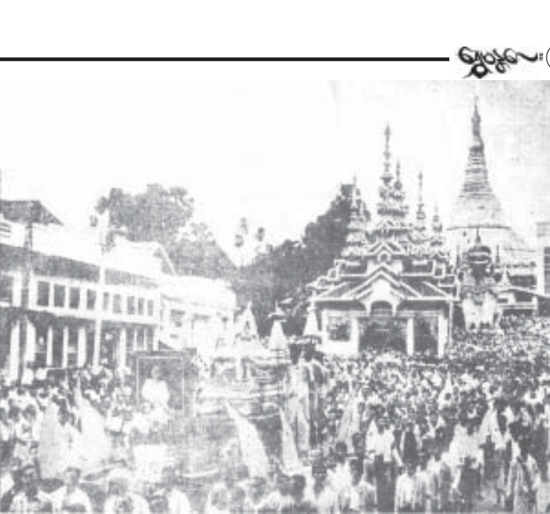
ဆရာကြီးရပ်ကလာပ်ကို ချဆောင်လာတဲ့ မြင်ကွင်း

တွေ ဘာတွေလုပ်နေတာလဲ မကြိုက်ဘူး။ နာမ်ဓာတ်နှင့် ဇီဝဓာတ်များ လုံးဝချုပ်ငြိမ်းပျောက်ကွယ်သွားတဲ့နောက်၊ လုံးဝပျက်စီးကြေမွစပြုနေပြီဖြစ်တဲ့ ရုပ် ကလာပ်ကြီးကို မီးသင်္ဂြိုဟ်ပစ်လိုက်တာ၊ ပြာကို မြေဩဇာလုပ်ပစ်လိုက်တာဟာ အကောင်းဆုံးပဲလို့ထင်တယ်။