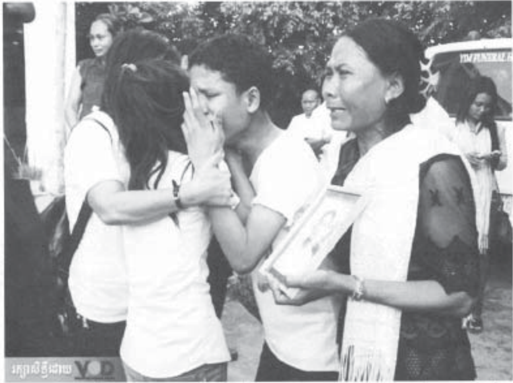
ကမ္ဘောဒီးယားနိုင်ငံ၊ ဟန်တေးမြို့နယ်ရှိ လုပ်ငန်းခွင်တွင် အလုပ်သမားများ နှိပ်စက်ခံနေရခြင်းကို ဖော်ပြရန် ရိုက်ကူးရိုက်ကူးရင်း ဖော်ပြရင်းဖြစ်သည်။

LICADO ဆိုတဲ့ အမှန်တရားစွာဖွဲ့သူများအဖွဲ့ကလည်း လူနည်းသူဟန် စုံစမ်းစစ်ဆေးမှုလုပ်တယ်လို့ ပြောတယ်။ အဖွဲ့ရဲ့ သူတော်ထံ အုပ်ဆန်အာသာကတော့ အစိုးရမှတာဝန်ရှိတယ်လို့ ပြောတယ်။