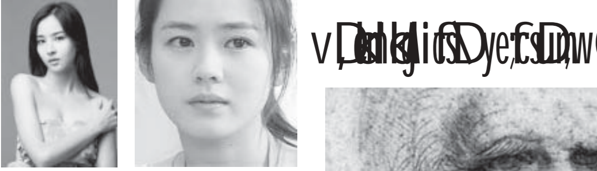
(၉) လီယိုဝမ် (၁၀) ဆွန်ဂိုဂျင်း