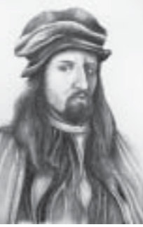
- နွယ်စိုင်း ဟန် -

ကမ္ဘာကျော်ပန်းချီဆရာကြီး လီယိုနာဒိုဒါဗင်ချီ၏ ပန်းချီကားများကို အီတလီနိုင်ငံမြောက်ပိုင်းရှိ တူရင်မြို့၌ ပြသမည်ဖြစ်သည်။ သက်တမ်း ၅၀၀ ကျော်ရှိသော လီယိုနာဒို၏ ကိုယ်တိုင်ရေးပုံတူများကို ရှင်ဘုရင်၏ နန်းစဉ်ရတနာပြပွဲနှင့်အတူ “တူရင်”မြို့ရှိ တော်ဝင်စာကြည့်တိုက်တွင် ပြသမည်ဖြစ်သည်။ သူ၏ကိုယ်တိုင်ရေးပုံတူကို တစ်ချက်ကြည့်လိုက်ရုံဖြင့် ယခင်က မရှိခဲ့ဘူးသေးသော အင်အားများကို ရရှိနိုင်သည်ဟု၍ ပြောကြသည်။ ထို့အပြင် ကိုယ်တိုင်ရေးပုံတူ