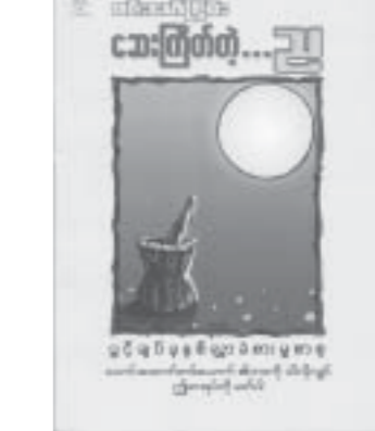
တန်မိုး - ၁၅၀၀ ကျပ်

မာယုသာစာပေပု ဝင်းမော်ငြိမ်း၏ ဆေးကြော် တွဲ ...ညို၊ ပွင့်ချပ်ချစ်လွှာခံစားမှုစာ စာအုပ်ကို ပထမအကြိမ် ထုတ်ဝေဖြန့်ချိသည်။ ဆင်းကတိုပြီးတော့ သောကတ်၊ မြင်းကောင်း၊ ခွာတစ်ချက် အလိမ်၊ ချာလပတ်ကို လည်နေတာပဲ၊ အပြီးမတည့် အမောက်မတည့်၊ သက်ရှိသက်မဲ့ သက်မဲ့ သက်ရှိ၊ နီနီပါဝါ စိမ်းစိမ်း၊ ဆေးကြော်တဲ့ ...ညို စာစု(၇)ပုဒ် ပါဝင်သည်။ “ဆရာဝင်းမော်ငြိမ်း၏ လောကကြီးကိုရှုမြင်ပုံမှာ လေးနက်တည်ကြည်မှုရှိသလို သောသောရွှင်ရွှင် ရယ်ချင်စဖွယ်အမြင်များလည်းပါရှိနေသည်။ ဆရာဝင်းမော်ငြိမ်း၏ ရယ်ရွှင်ဖွယ်အရေးအသားများ၏ အောက်အလွှာထဲ၌ အလွန်လေးနက်သိမ်မွေ့သော အလွမ်းစိတ်တစ်ခုရှိနေသည်။ ဤအချက်မှာ အချို့သော စာရေးဆရာများ၌တွေ့ရတတ်သော သဘောသဘာဝ တစ်ခုဖြစ်ပါသည်။ ထိုသို့သော သဘောသဘာဝရှိသည့် စာရေးဆရာသည် သိမ်မွေ့လေးနက်သော ဝတ္ထုကြီးများကို ရေးသားနိုင်စွမ်းရှိလိမ့်မည်ဟု ကျွန်တော်ယုံကြည်ပါသည်”ဟူ၍ ဆရာနေမျိုးက အမှာစာရေးသားထားသည်။