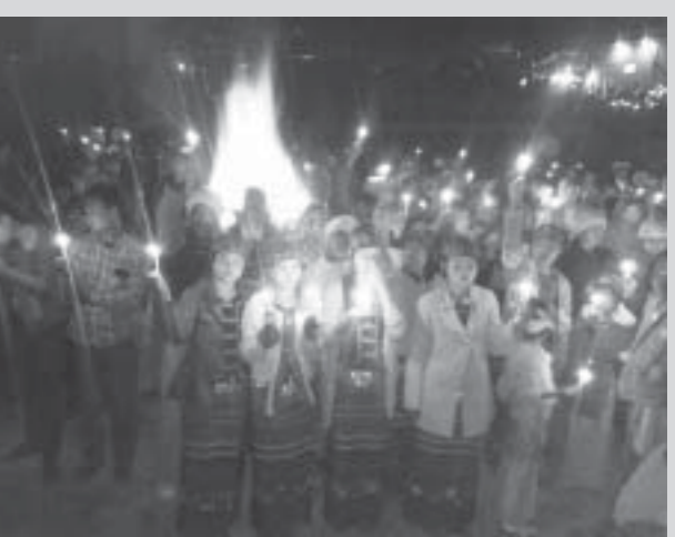
စစ်ဘေးသင့်ပြည်သူများအတွက် ငြိမ်းချမ်းရေးဆုတောင်း