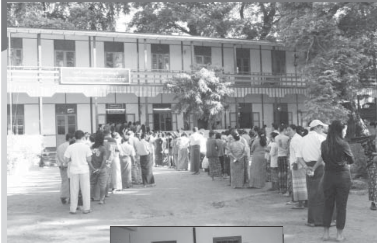
NLD ကိုယ်စားလှယ်များ အပြတ်အသတ် အနိုင်ရရှိခဲ့တဲ့ ၂၀၁၅ အထွေထွေ ရွေးကောက်ပွဲ