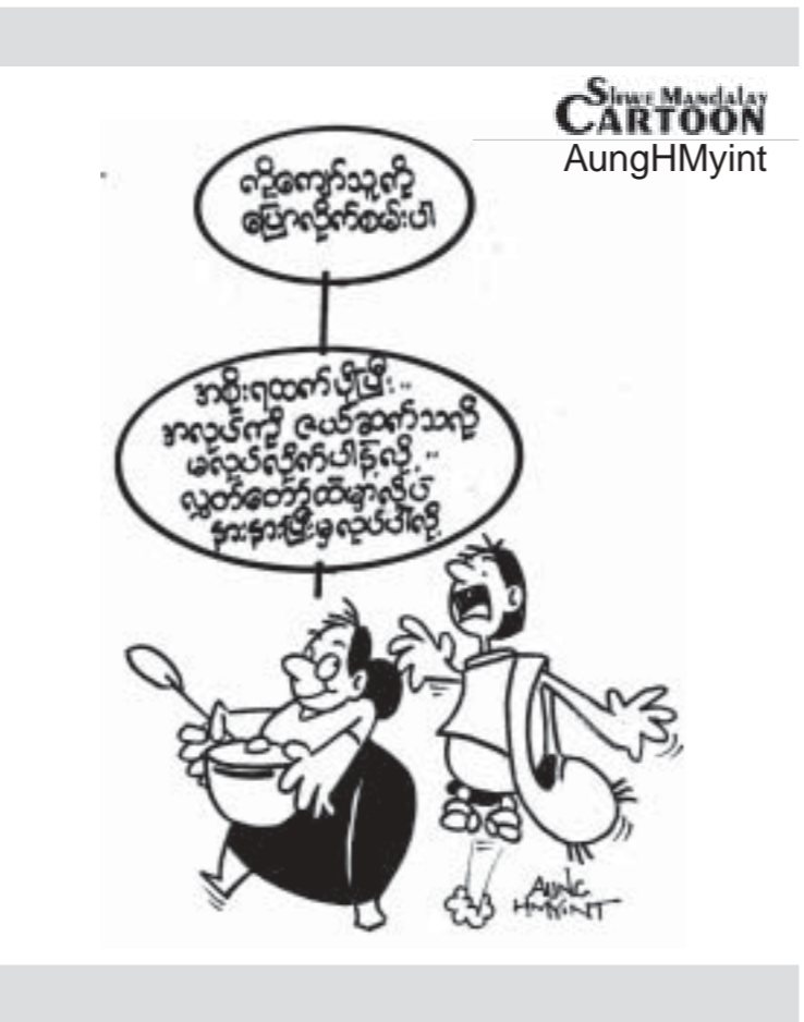
Silver Mandalay Cartoon AungHMYint