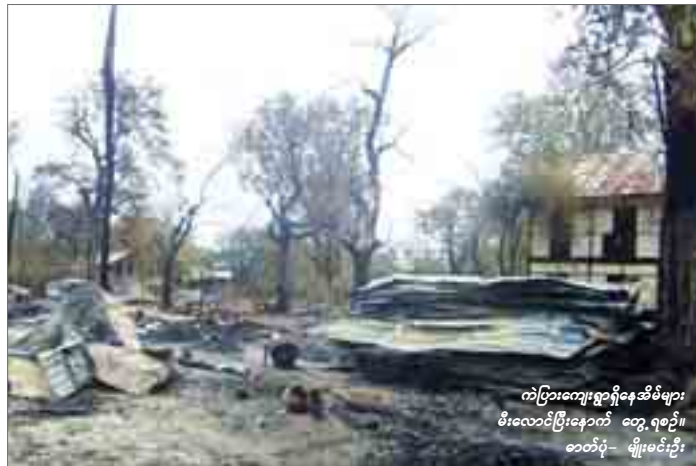
ကပြားကျေးရွာရှိနေအိမ်များ မီးလောင်ပြီးနောက် တွေ့ရစဉ်။

မုံရွာ၊ ဇူလိုင်- ၁၄ စစ်ကိုင်းတိုင်းအတွင်း မိနပ်အမိက ထုတ်လုပ်ရာ မုံရွာမြို့နယ်၊ ကပြားကျေးရွာတွင် ဇူလိုင် ၁၂ ရက် ည ၁၁ နာရီခွဲအချိန်တွင် မီးဖိုခီးကြွင်းမီးကျန်မှတစ်ဆင့် မီးလောင်မှုဖြစ်ပွားခဲ့ရာ နေအိမ် ၂၁ လုံး မီးလောင်ဆုံးရှုံးခဲ့ကြောင်း ကပြားကျေးရွာဒေသခံများ၏ ပြောပြချက်အရသိရသည်။