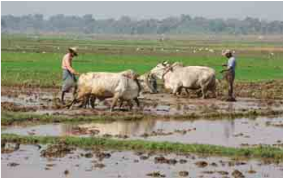
မန္တလေးတိုင်း၊ အမရပူရမြို့နယ်မှ လယ်ယာလုပ်ငန်းရှင်တစ်ဦး။