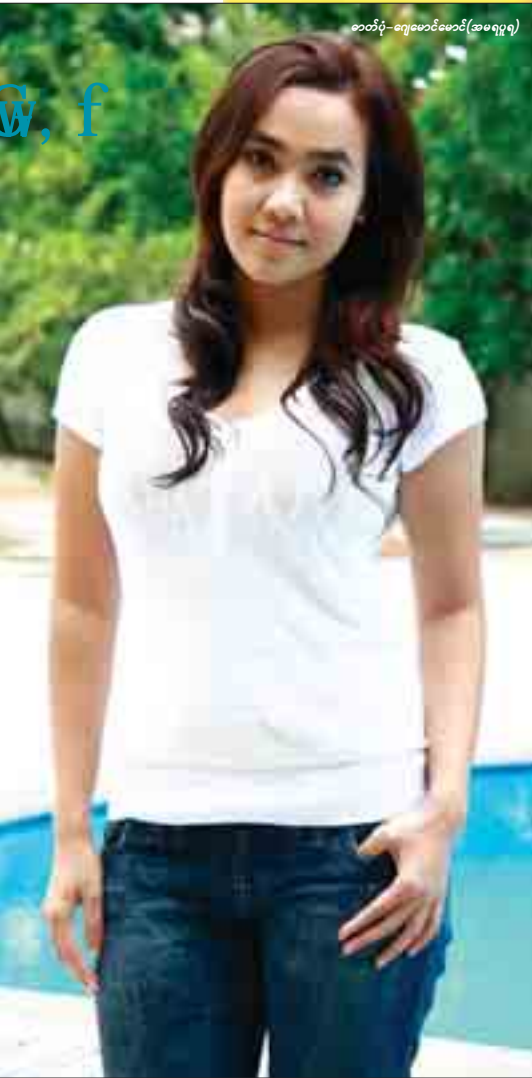
ဂျာဗီယာ - ဧကရာဇ်မောင် (အမရပူရ)

ဒီနှစ်ထဲမှာ ရုပ်ရှင်ကားတွေ ဆက်တိုက်ရိုက် ရတော့တစ်ကားနဲ့ တစ်ကားမှာ ယုံကြည်မှုတွေ အသံလောက်ထိတိုးတက်လာလဲ။ တစ်ကားနဲ့တစ်ကား ယုံကြည်မှုကတော့ မတူတော့ဘူးပေါ့။ ကိုယ့်ကိုယ်ကိုယ်ယုံကြည်မှုကတော့ အရင်တည်းကရှိတယ်။ ကိုယ်မလုပ်နိုင်တဲ့ အလုပ်တစ်ခုကိုမလုပ်ဘူး။ ကိုယ်ကိုယ်တိုင်လုပ်နိုင်တယ်ထင်မှ ယုံကြည်မှုရှိမှပဲ လက်ခံဖြစ်တာပါ။ ဇာတ်ကောင်ရွေးချယ်မှုနဲ့ ပတ်သက်ရင် ညီမ ရွေးချယ်တဲ့ ဇာတ်ကောင်လေးတွေကိုပိုင်ပြင်အောင် သရုပ်ဆောင်တာတွေ ရတယ်။ ဘယ်လိုအားထုတ်မှုတွေနဲ့လုပ်တတ်ပါသလဲ။ ကိုယ်ရွေးတဲ့ဇာတ်ကောင်နဲ့ အနီးစပ်ဆုံး သဘာဝ ကျအောင်၊ ငါသာအပြင်မှာ တကယ်ဖြစ်ခဲ့ရင် ဆိုတဲ့စိတ်ကလေးနဲ့ပိုပေး ကိုဆိုတဲ့ ကောင်မလေး တစ်ယောက်ကို မေ့ထားပြီး နိနီဆိုလည်းနိနီဖြူဖြူဆိုလည်းဖြူဖြူရဲ့စိတ်ကိုသွင်းလိုက်တာပေါ့နော်။ ဒရာမာကားတွေမှာ ညီမမုက်ရည်ကျတဲ့ အခန်းတွေဆို ပရိသတ်တွေကပါ လိုက်ပြီးမျောပါသွားကြတယ်လို့ အသံတွေကြားရတယ်။ အထူးသဖြင့် 'အချစ်နှင့်ကိုယ်လို ဇာတ်ကားမျိုးမှာ ညီမရဲ့အင်အားတွေကို ဘယ်လိုကြိုးစားခဲ့ရလဲ။ အရမ်းပင်ပန်းပါတယ်။ တစ်နေ့လုံး ရွတ်မှာ မိုးပေး တကယ်ကိုလည်းခေါင်းတွေတောင် ကိုက်ရပါတယ်။ မျက်ရည်အစစ်နဲ့ ငိုတော့လေ။ Ref: (၄၅)ခန့်