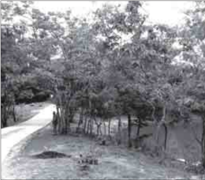
ကွန်ကရစ်လမ်းခင်းပြီးသွားသော လှေကားဥယျာဉ်အတွင်း လမ်းပိုင်းတစ်ခုခုကို ဇူလိုင်လ၁၇ရက်နေ့တွင်ဖွင့်ပေးခြင်းဖြစ်သည်။

လုပ်ပြီးပါက ဥယျာဉ်ကို ပြန်လည် ဖွင့်လှစ်သွားမည်ဖြစ်ကြောင်း သိရ သည်။