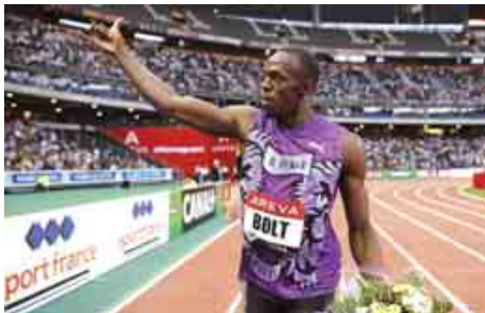
ပါရီ၊ ဇူလိုင်- ၁၇ ရှုမကတမ္မာ ကမ္ဘာ့ချန်ပီယံအပြေးသမား အစီအစဉ်အရ ဇူလိုင် ၁၆