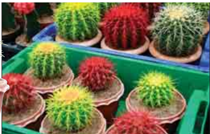
စာတို-ဈေးမောင်မောင်(ဆမရမရ)

ပင်လေးမျိုးကို တင်ထားတာပါ။ ဒီအပင်လေးက အရောင်သုံးရောင်လောက်ရှိပြီး အစိမ်းရောင်၊ အနီရောင်၊ အစိမ်းနဲ့ လိမ္မော်ရောင်မျိုးစုံပါ။