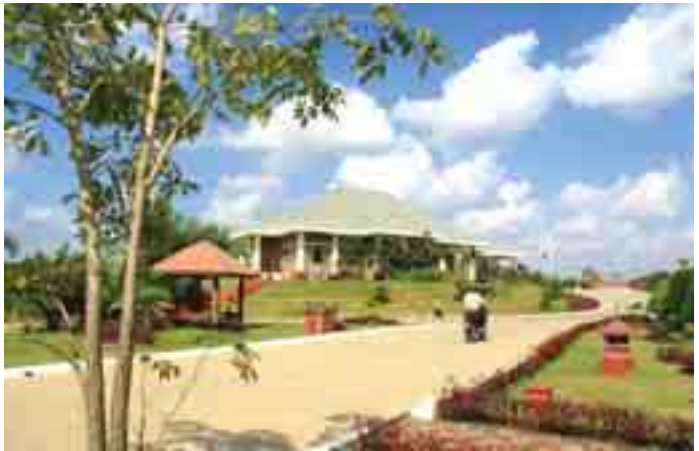
နေပြည်တော်ဟိုတယ်နှင့် နေပြည်တော်ဟိုတယ်တစ်လုံး။

နေပြည်တော်၊ ဇူလိုင်- ၁၅ နေပြည်တော်ဟိုတယ်နှင့် လုပ်ငန်းလည်ပတ်လျက်ရှိသော ဟိုတယ်များအပြင် လုပ်ငန်းအတွင်း ဖွင့်လှစ်ရန်ရှိသော ဟိုတယ်အချို့နှင့် တည်ဆောက်ဆဲ ဟိုတယ်စီမံကိန်းများလည်းရှိနေရာ ဒေသခံလူငယ်များအတွက် ဟိုတယ်ဆိုင်ရာ အလုပ်အကိုင်အခွင့်အလမ်းများစွာ ပေါ်ထွက်လာကြောင်း သက်ဆိုင်ရာ နယ်ပယ်အသီးသီးမှ စုံစမ်းသိရသည်။ “အခုကို လူခေါ်ပေးနေရတယ်။ အသက် ၃၀ အောက်လူငယ်တွေကတော့ ဦးစားပေးပေါ့။ ဆယ်တန်းအောင်ကနေ ဘွဲ့ရအထိ ဟိုတယ်မှာ အလုပ်လုပ်ဖို့ စိတ်ဝင်စားတဲ့ကလေးတွေ လာပြီး လျှောက်နိုင်ပါတယ်။ ဟိုတယ်ဝန်ထမ်းဖြစ်တဲ့အတွက် ရုပ်ရည်အသင့် အတင့် ရှိဖို့ လိုအပ်ပြီး လိုအပ်တဲ့ သင်တန်းတွေလည်း ရှေးချယ်ပြီးရင် စီစဉ်ပေးသွားဖို့ ရှိပါတယ်”ဟု စက်တင်ဘာလလောက်တွင် ဖွင့်လှစ်ရန်ရှိသည့် ဟိုတယ်တစ်ခုနှင့် လုပ်ငန်းဆက်နွယ်ကာ ဝန်ထမ်းစုဆောင်းပေးလျက်ရှိသော ဦးစိုးမြိုင်ကပြော