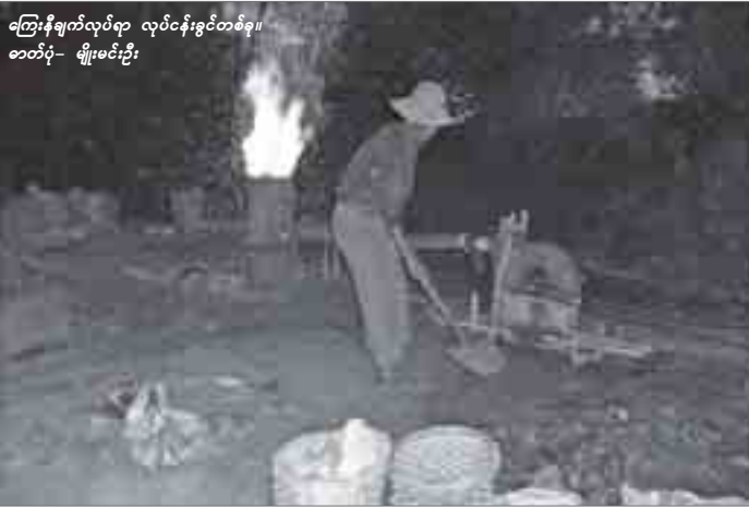
ကြေးနီချက်လုပ်ရာ လုပ်ငန်းရှင်တစ်ဦး။

မုံရွာခရိုင်၊ ဆားလင်းကြီးမြို့နယ်၊ ကြေးစင်တောင်အနီး ပုဂ္ဂလိက ကြေးနီချက်လုပ်ငန်းများ ပြီးခဲ့ သည့် ၂၀၀၉ ခုနှစ်အတွင်း ကမ္ဘာ့ စီးပွားအကျပ်အတည်းကြောင့် ချိန် တွင်ကြေးနီဈေးကွက် ကျဆင်းခဲ့ ရာမှ ယခုနှစ်ဇူလိုင်လအတွင်းဝယ် လိုအားများ၍ ဈေးကွက်ပြန်လည် ဦးမော့လာကြောင်း ဆားလင်းကြီး မြို့နယ် ကံကုန်းကျေးရွာပုဂ္ဂလိက ကြေးနီလုပ်ငန်းရှင်များက ပြော ကြားသည်။ “ကြေးနီဈေးက ပြီးခဲ့တဲ့နှစ် မှာ တစ်ပိဿာကျပ်လေးထောင် ဈေးအထိကျခဲ့တာ။ ဒီနှစ်ဧပြီလ မှာ ကျပ်ငါးထောင်ဈေးနဲ့ငြိမ်နေ တာ။ အခုဇူလိုင်လဆန်းမှ ကျပ် ရှစ်ထောင်ခုနစ်ရာဈေးနဲ့ ကြေးနီ ဈေးကွက်ပြန်ဦးမော့လာတာ။ ပြည်တွင်းပြည်ပဈေးကွက် ဝယ်လို အားကြောင့် ဈေးတက်လာတဲ့