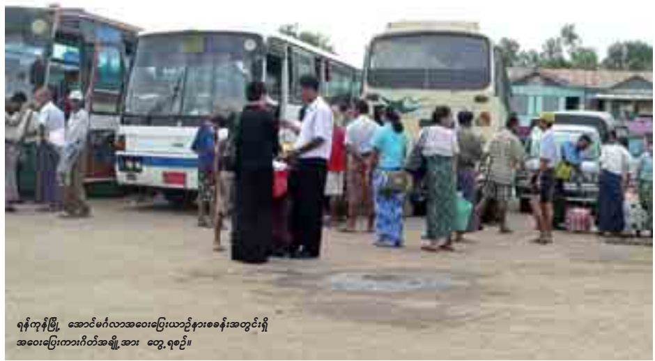
ရန်ကုန်မြို့၊ အောင်မင်္ဂလာအဝေးပြေးယာဉ်နားစခန်းအတွင်းရှိ အဝေးပြေးကားဂိတ်အချို့အား တွေ့ရစဉ်။

အဝေးပြေးယာဉ်လိုင်းအချို့သည် မိုးရာသီတွင်ခရီးသည်လျော့နည်းမှုကြောင့် ကားများ ခရီးစဉ်အတိုင်း ပုံမှန်ထွက်ခွာ နိုင်ရန် လူခေါ်ပွဲစားများကိုပေးထားရှိလာကြောင်း ရန်ကုန်မြို့ရှိအဝေးပြေးဂိတ်များမှ စုံစမ်းသိရှိရသည်။