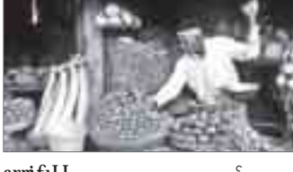
မောင်တော၊ ဇူလိုင်- ၁၄

အဆိုပါဟင်းသီး၊ ဟင်းရွက် များကို မောင်တောနှင့် တက္ကနစ် သို့ နေ့စဉ်ကူးသန်းသွားလာနေ သူများက တင်သွင်းလာကြခြင်း ဖြစ်ကြောင်း သိရသည်။ “အရင်နှစ် တွေက ကိုယ့်ဒေသက ထွက်တဲ့ ဟင်းသီး၊ ဟင်းရွက်တွေပဲ ရောင်း ချခဲ့ရပါတယ်။ ဒီနှစ်တော့ မမျှော် လင့်ဘဲ စိုက်ခင်းတွေပျက်စီးသွား တဲ့အတွက် ဘဏ်လားဒွေရှိက တင် သွင်းရောင်းချခဲ့တာဖြစ်ပါတယ်။ အခုတော့ ဟင်းသီး၊ ဟင်းရွက် တချို့ ထွက်လာပါပြီ” ဟု ဈေး သင်္ချာတစ်ဦးက ပြောသည်။ ထို့ နောက် မောင်တောနယ်စပ်ဒေသ တွင် ဟင်းသီး၊ ဟင်းရွက်များကို တစ်နှစ်ပတ်လုံး စိုက်ပျိုးရောင်းချ နေရကြောင်း သိရသည်။