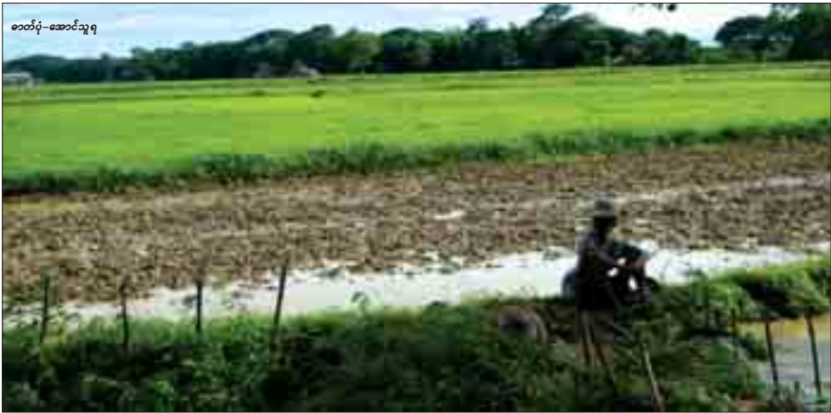
စာတို-ဆောင်သူ

Zkxk 9&uf aeY v, fift cgr, wft ou60 defus ksejehk n rkbmwpbDnf 4aycehis komuebif aywGicgfukHmas&u buftD0Dnf wpf vSfcifvSfvmeonf oVsaeaomjvSfrn ESomUEt aet xmu wpphlpant mawfawm yyekeykbnfxMmi f okSfvomuebif wpfvQu&S, &6fie oisESaumufkifeol rsmuhsuf hmi fi foH MnfrdvkVfupum vnfrcqkcs