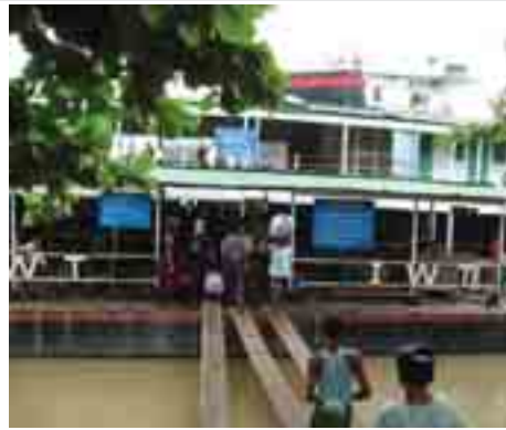
မုံရွာဆိပ်ကမ်းတွင် ဆိပ်ခံတွဲပေါ်မှတစ်ဆင့် သင်္ဘောပေါ်သို့တက်ရောက်နေသော ခရီးသည်များ။

သည်။ တစ်နိုင်ငံလုံးတွင် မိုးရွာသွန်း ခဲ့သဖြင့် အောက်ရေဆုံအားနည်း သွားသောကြောင့် ချင်းတွင်းမြစ် ထဲရှိ အန္တရာယ်ကြီးစေရန် ၃ ခုမှာ မြစ်ကြောင်းသွားရေယာဉ်များအား ကြီးမားသောထိခိုက်မှုအန္တရာယ် များမရှိသေးကြောင်းသိရသည်။ အဆိုပါချင်းတွင်းမြစ်တွင်းရှိ ရွှေစာရေပဲ၊ ပေပဲနှင့် ဝက်သိုက်ပဲ တို့သည် ချင်းတွင်းမြစ်ကြောင်း သွားရေယာဉ်ငယ်များ၊ ပုဂ္ဂလိက ရွက်တယ်များကို ထိခိုက်မှုအန္တ ရာယ်အများဆုံးပေးလေ့ရှိပြီး နှစ် စဉ် ယခုအချိန်ခန့်တွင် ရေပဲများ ကြောင့် ရေယာဉ်များသွားလာမှု ကို ကန့်သတ်ချက်များထုတ်ပြန်၍ တားမြစ်မှုများပြုလုပ်ရလေ့ရှိသည် ဟုသိရသည်။ ယခုနှစ်တွင် မြစ်အောက်ပိုင်း