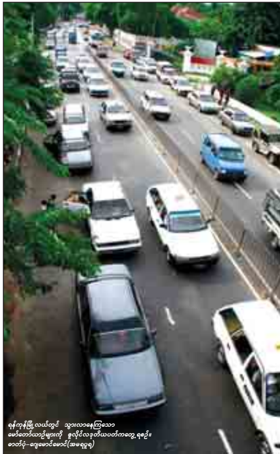
ရန်ကင်းမြို့လယ်တွင် သွားလာနေကြသော မော်တော်ယာဉ်များကို ဇူလိုင်လလဒ်ယာဉ်ကတွေ့ရစဉ်။