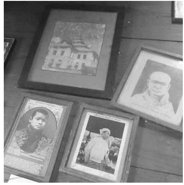
ဆရာတော်ဦးဥတ္တမဓာတ်ပုံနှစ်ပုံနှင့် ဗိုလ်ချုပ်

မောင်မိုးသက် စစ်တွေ၊ စက်တင်ဘာ-၂ မြန်မာနိုင်ငံလွတ်လပ်ရေး မီးရှူးတန်ဆောင်ဆရာတော် ဦးဥတ္တမအား လေးစားဂုဏ်ပြုသောအားဖြင့် စစ်တွေမြို့ရွှေစေတီဘုန်းကြီးကျောင်းတွင် ဦးဥတ္တမပြုတိုက်အား စက်တင်ဘာ ၁ ရက်တွင် အုတ်မြစ်ချစတင်တည်ဆောက်နေကြောင်း သတင်းရရှိသည်။ အဆိုပါရွှေစေတီဘုန်းတော်ကြီးကျောင်းမှာ ဆရာတော်အရှင်ဦးဥတ္တမငယ်စဉ်ကပင် သီတင်းသုံးနေထိုင်ခဲ့သော ကျောင်းတော်ဖြစ်ပြီး စစ်တွေမြို့တွင် သက်တမ်းရင့်သမိုင်းဝင်ကျောင်းတော်ကြီးဖြစ်ကာ လက်ရှိတွင် ဘုန်းတော်ကြီးသင်ပညာရေး၊ အခမဲ့ဆယ်တန်းစာသင် ကျောင်းနှင့် British Council ၏ စစ်တွေမြို့စာကြည့်တိုက်အပြင် ယခုဦးဥတ္တမပြုတိုက်တည်ဆောက်ခြင်းဖြစ်ကြောင်း ကျောင်းထိုင်ဆရာတော် ဦးအရိယာဝံသက မိန့်ကြားဖူးသည်။ “မြန်မာနိုင်ငံလွတ်လပ်ရေးအတွက် အာရှတိုက်တစ်ခွင် အသိ