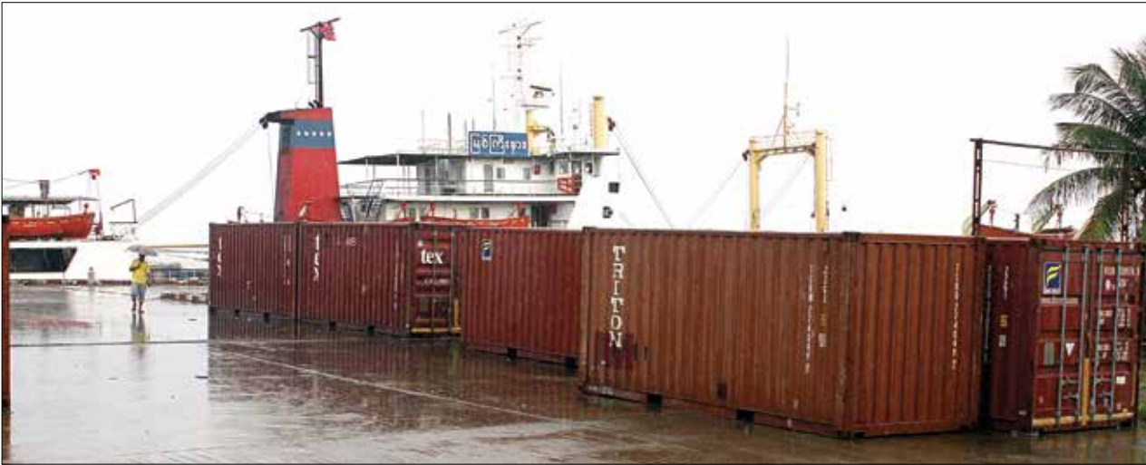
ရန်ကုန်မြို့ သာကေတဆိပ်ခံတံတားတွင် မှောင်ခိုပစ္စည်းကွန်တိန်နာများအား တွေ့ရစဉ်

ပြည်သိမ်း၊ အိဖြူလွင်၊ သိမ်သိမ်စိုး အာဆီယံနိုင်ငံများတွင် မြန်မာနိုင်ငံသည် တရားမဝင်ကုန်သွယ်မှု (မှောင်ခို)အများဆုံးနိုင်ငံတစ်ခု ဖြစ်သည်။ ထိုင်း၊ အင်ဒိုနီးရှားနိုင်ငံတို့တွင် ပြည်တွင်းအသားတင် ထုတ်လုပ်မှုတန်ဖိုး (GDP)တွင် ကုန်သွယ်ရေးအပါအဝင် အခွန်မှရငွေပါဝင်မှု ၃၀ ရာခိုင်နှုန်းနီးပါးရှိနေသည်။ သို့သော် မြန်မာနိုင်ငံတွင် အခွန်မှရငွေပါဝင်မှု ၃ ရာခိုင်နှုန်းသာရှိသည်။ နိုင်ငံဝင်ငွေလေလွင့်ဆုံးရှုံးမှုကို ကာကွယ်ရန် တရားမဝင်ကုန်သွယ်မှု တားဆီးရေး၊ ဗဟိုကော်မတီကိုအဖွဲ့ရသစ်လက်ထက်တွင် ဖွဲ့စည်းပြီး ကုန်ကွယ်ရေးတွင် စစ်ဆေးဆောင်ရွက်မှုများ ပြုလုပ်နေသည်။ မြန်မာနိုင်ငံ သမိုင်းတစ်လျှောက်တွင် တရားမဝင်ကုန်သွယ်မှု (မှောင်ခို)နှစ်၅၀ ကျော်ကြီးစိုးခဲ့သည်။ အတိတ်တစ်ချိန်က မော်လမြိုင်ဈေး၊ စိန်ဂွန်းဈေးတို့မှာ မှောင်ခိုရောင်းဝယ်မှု ခေတ်စားခဲ့သကဲ့သို့ ယနေ့တွင်လည်း နာမည်ကြီးဈေးများ၊ စူပါမားကတ်များ၊ အရောင်းစင်တာအချို့တွင် မှောင်