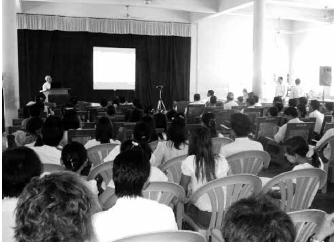
မုံရွာကုန်စည်ဗိုင်းတွင် ပထမဆုံးဟောပြောပွဲ ကျင်းပစဉ်

သာသနာရေးဝန်ကြီးဌာနသည် ဘုန်းတော်ကြီးသင်ပညာရေးကျောင်းများမှ ဆရာ၊ ဆရာမများအတွက်မူလတန်းအဆင့်ကျပ် ၃၆,၀၀၀၊ အလယ်တန်းအဆင့်ကျပ် ၄၁,၀၀၀ ပေးအပ်သွားမည်ဖြစ်ပြီး တစ်နိုင်ငံလုံးရှိ ကျောင်းများအတွက် ကျပ်သုံးဘီလီယံခန့် အသုံးပြုသွားမည်ဖြစ်သည်။