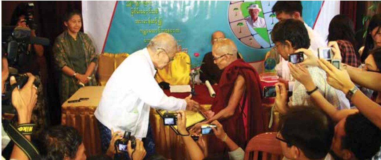
ဦးအုန်းက ဥက္ကဋ္ဌအား ကမ္ဘာမြေချစ်သူ ဆက်ကပ်စဉ်