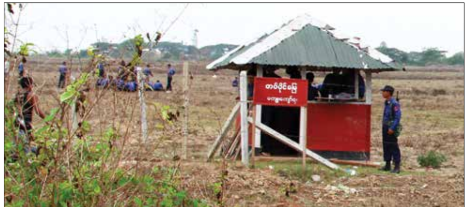
သီလဝါမှတပ်ပိုင်မြေမကျူးကျော်ရဆိုသောဆိုင်းဘုတ်

တွင်းက အစိုးရသတင်းစာများမှ တစ်ဆင့် ထုတ်ပြန်အပြီး စုံစမ်းစစ်ဆေးရေးကော်မတီအဖွဲ့ဝင်များက ယင်းကဲ့သို့ ပြောကြားခြင်းဖြစ်သည်။ မည်သည့်အချိန်တွင်နောက်ဆုံးထားပြီး ပြန်ပေးမည်ဆိုသည့် အချိန်ကာလသတ်မှတ်ချက်ကို ဖော်ပြထားခြင်း မရှိသည့်အဆိုပါ ကြေညာချက်ထဲတွင် စွန့်လွှတ်မည့် မြေများအတွက် ဥပဒေဆိုင်ရာ လုပ်ထုံးလုပ်နည်းများနှင့် အညီ ပြည်ထောင်စုအစိုးရအဖွဲ့သို့ အပ်နှံသွားမည်ဖြစ်ပြီး ပြည်ထောင်စုအစိုးရအဖွဲ့မှ သက်ဆိုင်ရာဝန်ကြီးဌာနများ၏ စီမံခန့်ခွဲမှုဖြင့် ဒေသခံတောင်သူများသို့