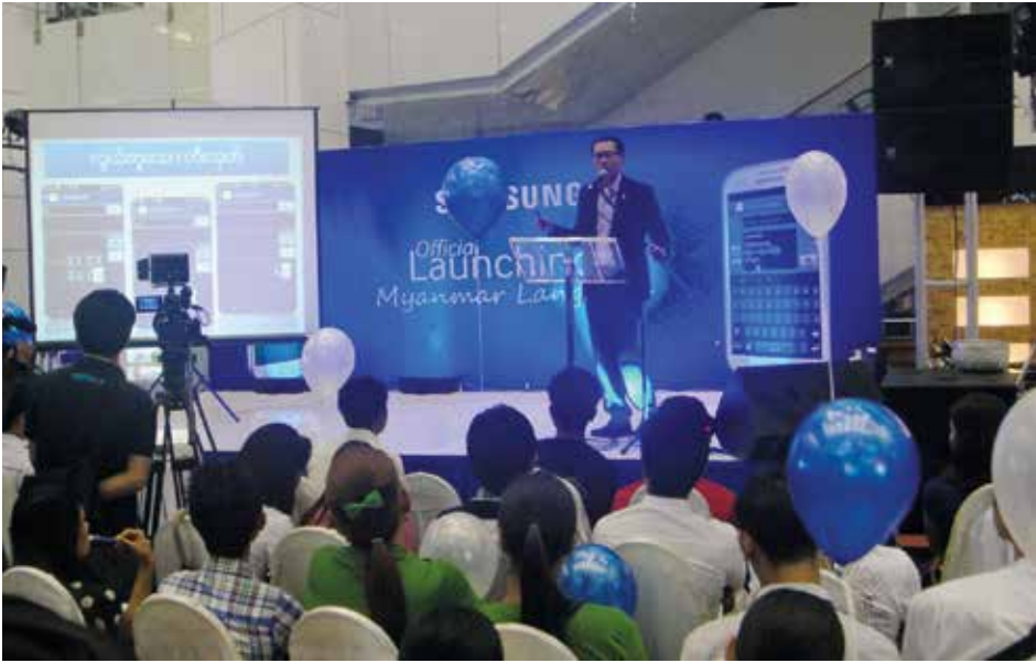
မြန်မာဘာသာပါဝင်သော ဆမ်ဆောင်းဖုန်းများမိတ်ဆက်ပွဲကျင်းပစဉ်

ware အား Update လုပ်ခြင်းဖြင့် မြန်မာစာစနစ် ရယူနိုင်ပြီး Setting အတွင်းရှိ Language မှတစ်ဆင့် ပြင်ဆင်နိုင်မည်ဖြစ်သည်။ သို့သော်လည်း ကုမ္ပဏီမှ တိုက်ရိုက်ဖြန့်ချိသည့် ဖုန်းများမဟုတ်လျှင် မြန်မာစာစနစ်ပါဝင်မည်မဟုတ်ဘဲ ကွန်ရက်ချိတ်ဆက်မှုကို ဖြတ်တောက်ထားသောကြောင့် ကုမ္ပဏီတွင် လာရောက်၍ ပြုလုပ်မှသာ ရရှိနိုင်မည်ဖြစ်ပြီး ထပ်မံ၍ ငွေကြေးကုန်ကျမည်ဖြစ်ကြောင်း ဆမ်ဆောင်းမှတာဝန်ရှိသူတစ်ဦးကပြောသည်။