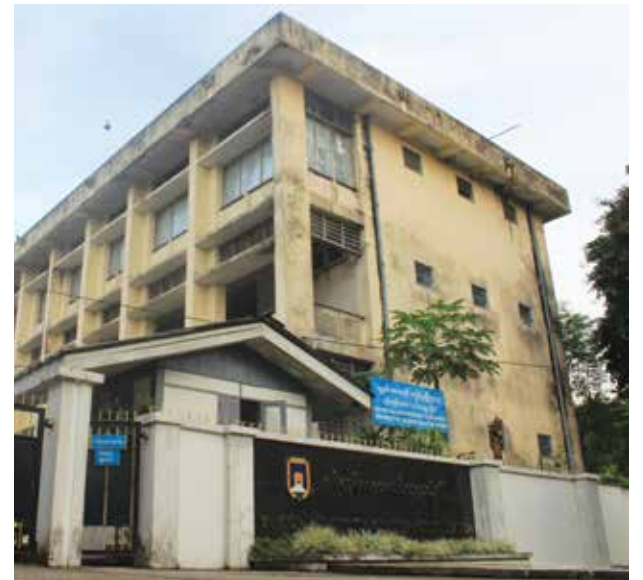
ရန်ကုန်အဝေးသင်တက္ကသိုလ်အဆောက်အအုံ