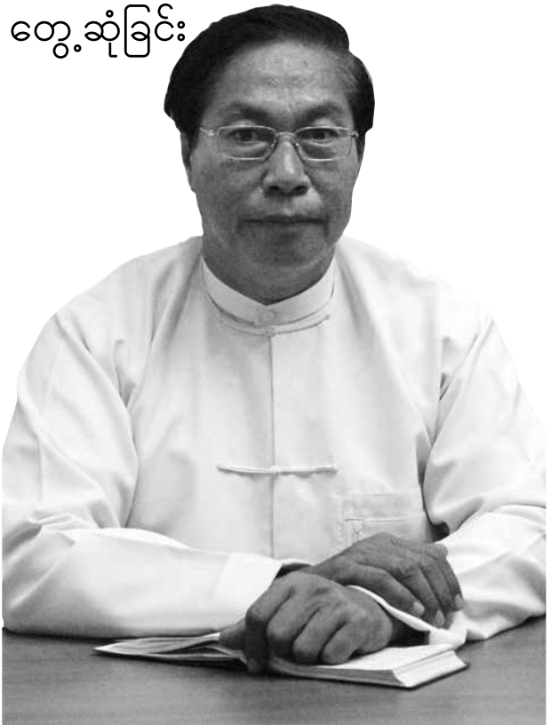
ဓာတ်ပုံ- အောင်သူရ

အခုကျေးလက်ဒေသတွေ မှာဆိုရင် ကျေးလက်ဒေသဖွံ့ဖြိုး ရေးအထောက်အကူပြုကော်မတီ ဆိုပြီးတော့မှရွေးချယ်တင်မြှောက် ထားတဲ့ကျေးရွာအုပ်ချုပ်ရေးမှူး တွေက ခေါင်းဆောင်ပြီးတော့ ကျေးရွာကအများလေးစားရတဲ့ ပုဂ္ဂိုလ်တွေပေါင်းစည်းပြီး ဖွဲ့စည်း တဲ့အဖွဲ့တွေရှိလာပြီ။ တရားဥပဒေ စိုးမိုးရေးအပိုင်းကို ပြန်ကြည့်ရင် အားလုံးလိုက်နာမှဖြစ်တာ။ ဥပ ဒေတွေထုတ်ပြန်ပြီး မလိုက်နာ ရင်လုပ်ရမယ့်ဟာတွေ၊မလုပ်ရ မယ့်ဟာတွေ ဒါတွေက ထောင် ချလိုလည်းမရဘူး။ ပညာပေးလို့ လည်းမရဘူး။ အသိစိတ်ဓာတ်ကို ရှိမှရမှာ အသိစိတ်ဓာတ်ရှိဖို့ဆိုတာ ဝိုင်းဝန်းထိန်းကျောင်းမှရမယ်။ ဝိုင်းဝန်းထိန်းကျောင်း တယ်ဆို တာ ဥပမာဓာတ်မြေဩဇာ အတု ရှိနေပြီဆိုရင်ရောင်းတဲ့လူရှိလို့၊ ဒီရွာမှာလောင်းကစားခိုင်းတွေ၊ ချ ခိုင်းတွေ၊ဘောလုံးခိုင်းတွေ၊ မူးယစ် ဆေးဝါးတွေရှိနေပြီဆိုရင်ကျေးရွာ ဖြစ်တဲ့တွက် ကျေးရွာသားတွေသိ တယ်။ အရင်တုန်းက သွားပြော ရင် ကိုယ်တရားခံ ဖြစ်မယ်။ သူ များ ဓားခုတ်ရာ လက်ဝင်မယျို ဆိုကြားဘူး။ အခုကျွန်တော်တို့ ဖွဲ့ လိုက်တဲ့အဖွဲ့တွေကဘယ်သူ့ကို တိုင်ရင်ထိရောက်မှုရှိတယ်ဆိုတာ သိထားတဲ့အတွက် ကျေးလက် ဒေသမှာယုံကြည် မှုအရင်တည် ဆောက်ရမှာပဲ။ ကျွန်တော်တို့ လိုက်တဲ့အဖွဲ့တွေကဘယ်သူ့ကို တိုင်ရင်ထိရောက်မှုရှိတယ်ဆိုတာ သိထားတဲ့အတွက် ကျေးလက် ဒေသမှာယုံကြည် မှုအရင်တည် ဆောက်ရမှာပဲ။ ကျွန်တော်တို့ အတွက် တကယ်ကိုထိထိရောက် ရောက် ထဲထဲဝင်ဝင် လုပ်မယ့်ဝန် ကြီးဌာနလို့ ယုံကြည်သွားတဲ့တစ် နေ့မှာ ဒီလူတွေကိုတော့ ဖမ်း ပေးပါ။ ဒီပစ္စည်းတွေက အတုတွေ ပါဆိုတာကိုဖော်ထုတ်ဖို့ကမြန်မာ နိုင်ငံရဲ့လဲ မဖြစ်နိုင်ဘူး။ ဘယ်သူ ဖြစ်နိုင်လဲဆိုရင်ကျေးရွာသူကျေး ရွာသားကို ကျေးရွာသူ၊ ကျေးရွာ သားကပဲပြန်လည် ထိန်းသိမ်းပြီး