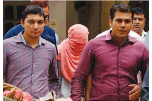
အရပ်ဝတ်နှင့်ရဲများက ခေါင်းတွင်ပေါ်ပြင့်အုပ်ထားသော ဒေလီအဓမ္မမှု တရားခံဆယ်ကျော်သက် လူငယ်ကို ခြံရံရှာဖွေလာစဉ်။ ထိုလူငယ်အား တရားရုံးမှ ပြုပြင်ရေးစခန်းတွင် သုံးနှစ်နေရန် အမိန့်ချမှတ်ခဲ့ပြီး ထိုဆုံးဖြတ်ချက်မှာ တရားရုံးတင်စစ်ဆေးပြီးနောက် ပထမဆုံးချမှတ်ခဲ့သည့် စီရင်ချက်လည်း ဖြစ်သည်။

၎င်းကပြောသည်။ ယခုတစ်ကြိမ်သည် အဆိုပါ အဖွဲ့၏ ဆွေးနွေးပွဲမှ ထုတ်ပြန်သော ပထမဆုံးအကြိမ် အငြင်းအခုံဖြစ်ဖွယ်ရာ ဆုံးဖြတ်ချက်မဟုတ်ပေ။ ယခင်ကလည်း ထိုဘာသာရေးဆရာများ၏ ဆွေးနွေးပွဲသည် အမျိုးသမီးများအား ရေမွှေးတွင် အယ်လ်ကိုဟောပါဝင်နေသည့်အတွက် အသုံးမပြုရန်၊ ဆေးမင်ကြောင်မထိုးရန်၊ ဂျင်းဘောင်းဘီ မဝတ်ရန်နှင့် အနောက်တိုင်းဆီပင်ပုံစံများမထားရန် ကန့်သတ်တားမြစ်ခဲ့ဖူးသည်။ —Ref: BBC