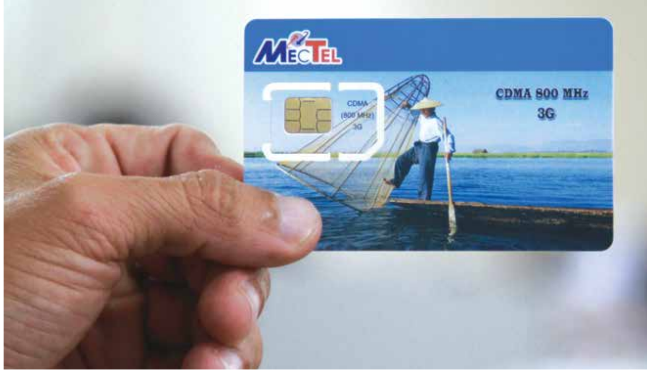
ဈေးကွက်ဝယ်လိုအားကောင်းလာသည့် တန်ဖိုးနည်းဆင်းမိကတ်