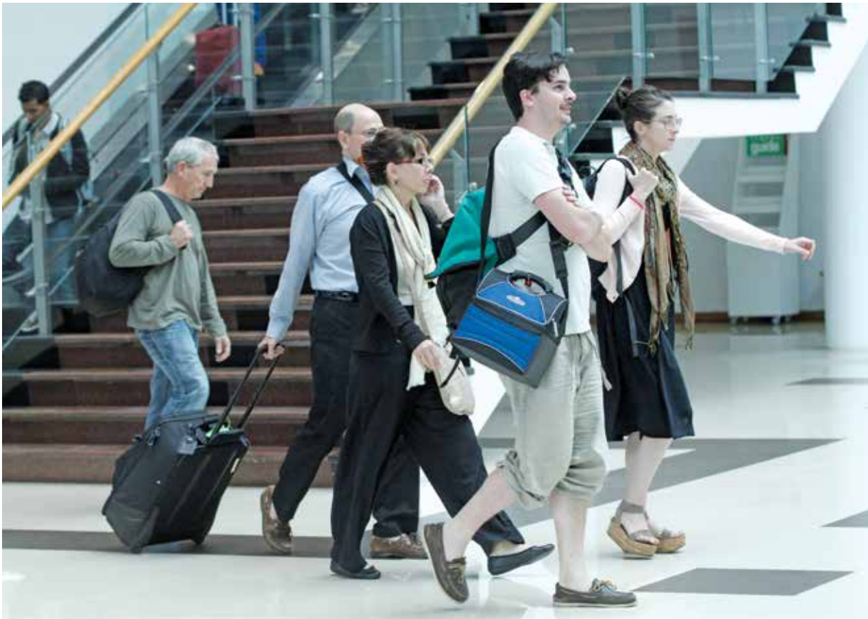
ရန်ကုန်လေဆိပ်တွင်မြင်တွေ့ရသည့် နိုင်ငံခြားခရီးသွားများ