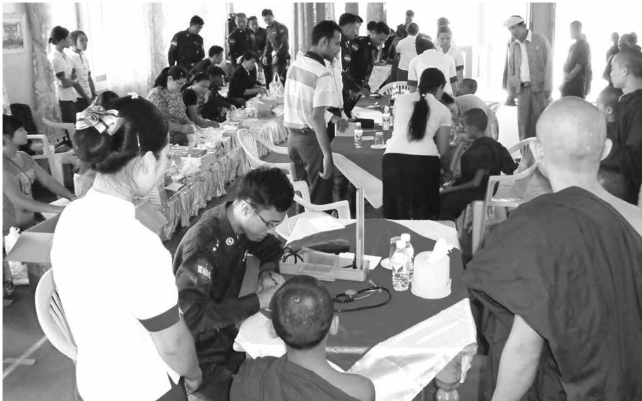
သံဃာတော်များအား ကုသိုလ်ဖြစ် ဆေးကုသပေးနေစဉ်