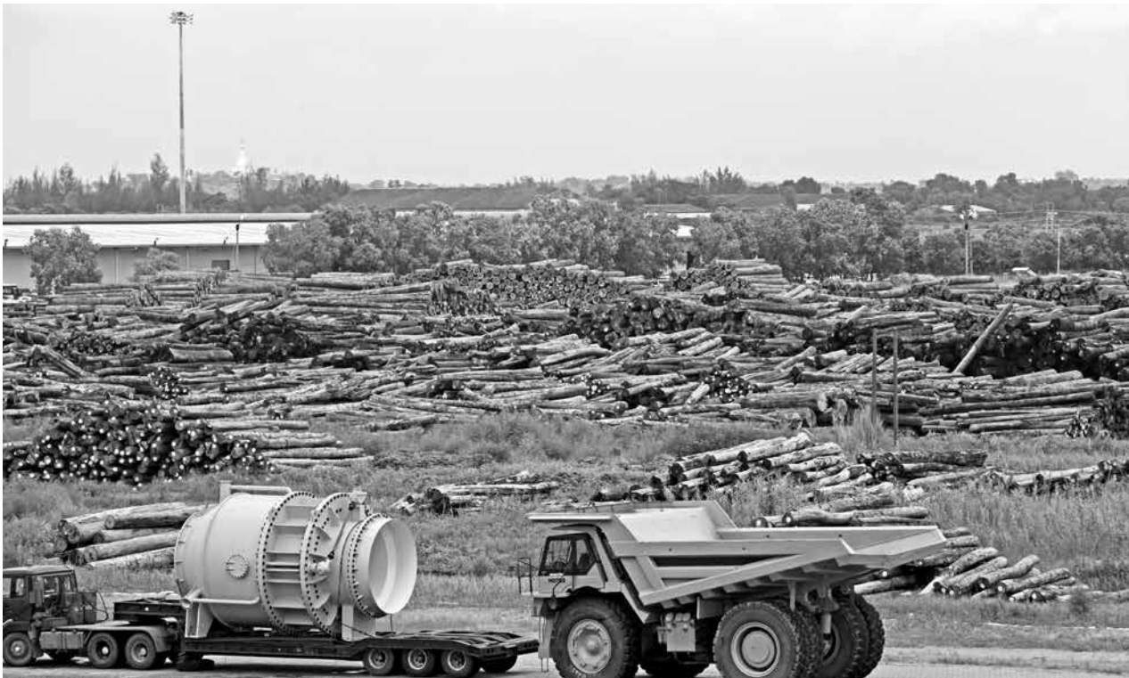
ရန်ကုန်မြို့ သီလဝါဆိပ်ကမ်းတွင်တွေ့ရသည့်သစ်လုံးများ

ဆိုခဲ့ပါ သတင်းနှစ်ပုဒ်ကို ဆက်စပ်ကြည့်သောအခါ သတင်းဖော်ပြသည့်နေ့ရက်ကွာခြားသည်