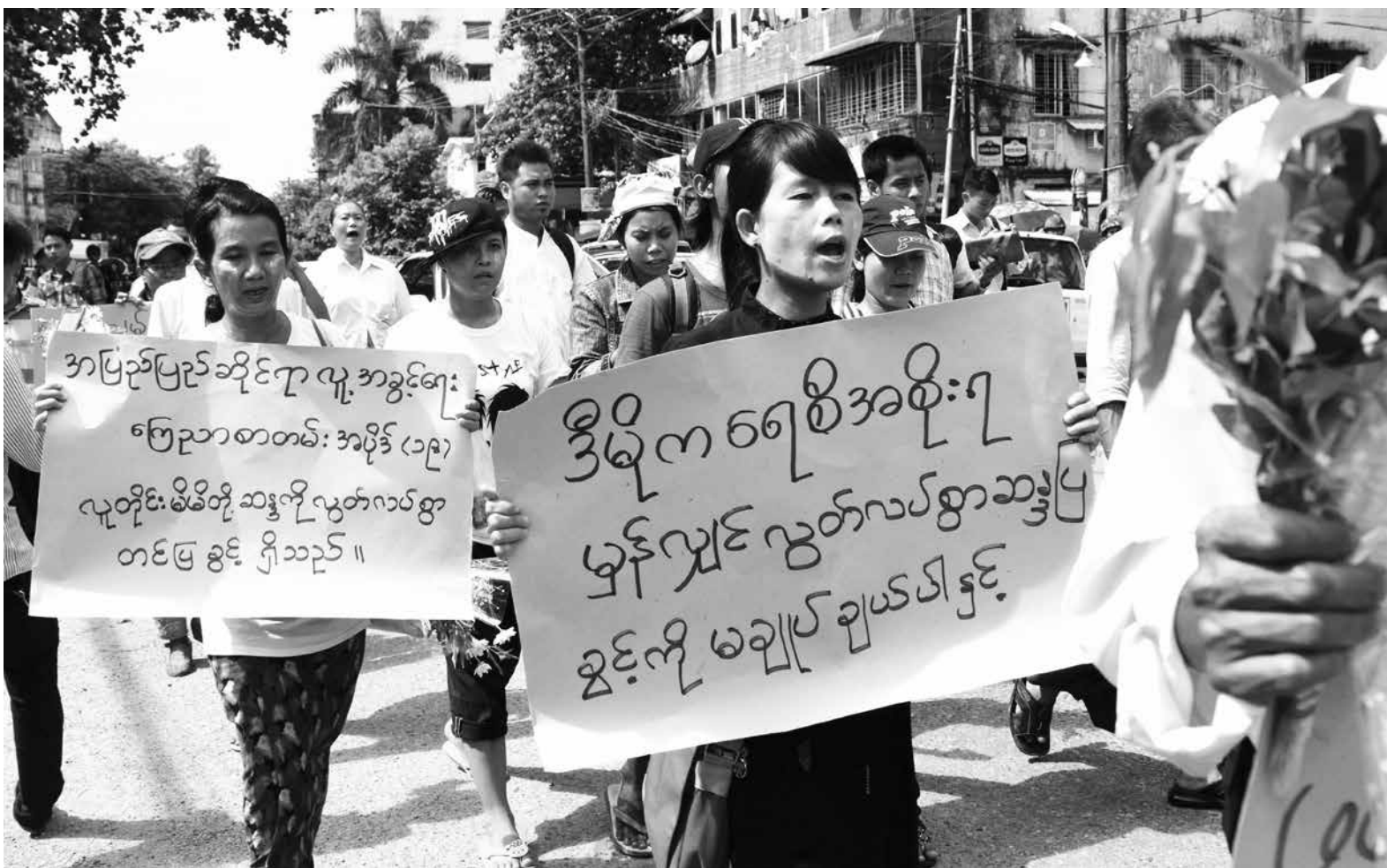
ပုဒ်မ ၁၈ ပယ်ဖျက်ပေးရန် ပုဒ်မ ၁၈ ဖြင့် အရေးယူခံထားရသူများက ဩဂုတ် ၂၇ ရက်တွင် ရန်ကုန်မြို့၌ ဆန္ဒပြနေစဉ်

ငြိမ်းချမ်းစွာစုဝေးလှည့်လည်ခွင့် တရားဝင်ရရှိရန် တင်