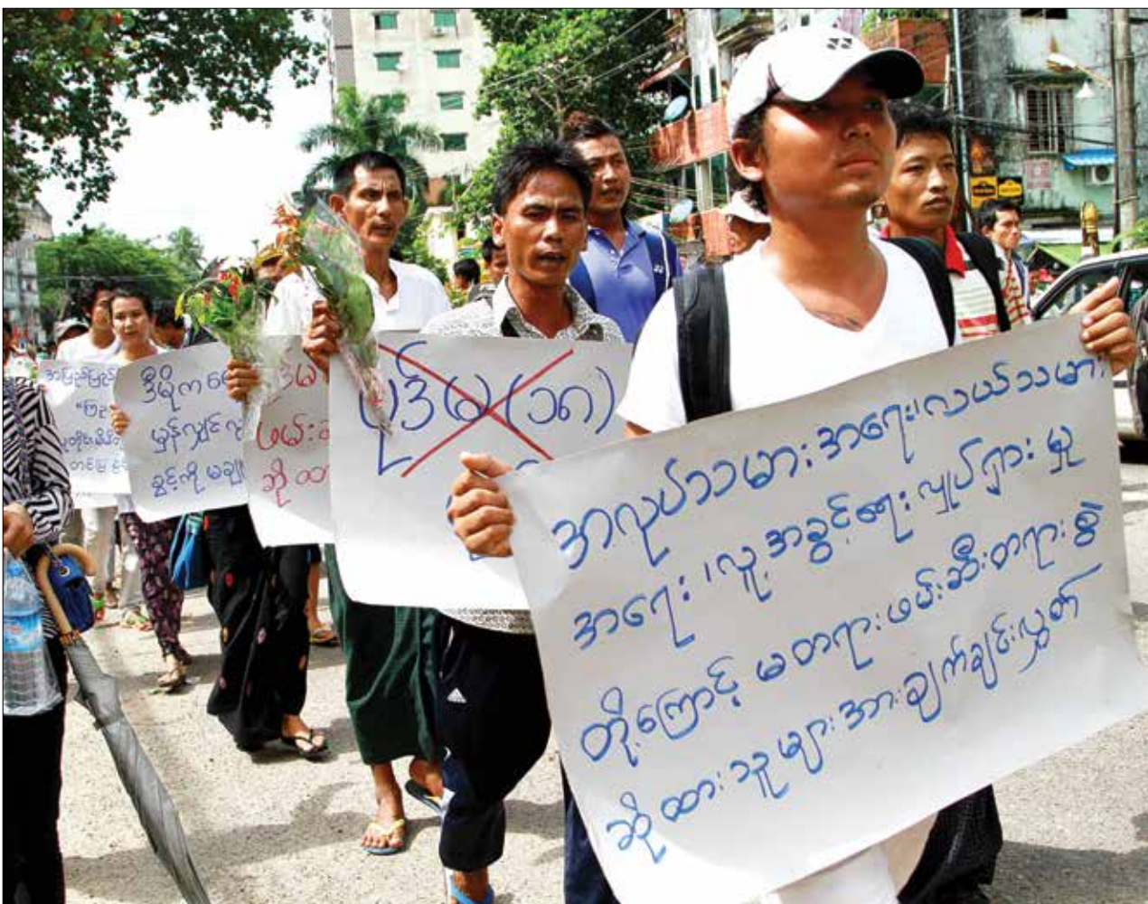
ပုဒ်မ(၁၈)ဖြင့်အမှုဖွင့်ခံထားရသူများက ဩဂုတ် ၂၇ ရက်တွင် ပုဒ်မ(၁၈)ကိုဖျက်သိမ်းပေးရန် ရန်ကုန်မြို့တွင် ဆန္ဒပြနေစဉ်

အောင်နိုင် ‘ပုဒ်မ ၁၈ အလိုမရှိ။ မတရား ဖမ်းဆီးချုပ်နှောင်ထားသူများ လွတ်ပေးရေးတို့အရေး၊ တရား ဥပဒေစိုးမိုးရေး.. တို့အရေး’ မိုးသည်းထန်စွာ ရွာသွန်းနေ သော်လည်း လူတစ်စုကမူ ဆူးလေ စေတီတော်ဘက်သို့လမ်းလျှောက် ချီတက်ဆန္ဒဖော်ထုတ်နေကြသည်။ ငြိမ်းချမ်းစွာစုဝေးခွင့်နှင့် စီ တန်းလှည့်လည်ခွင့်ဥပဒေပုဒ်မ ၁၈ လုံးဝပယ်ဖျက်ရန် စမ်းချောင်း မြို့နယ်မှ ကျောက်တံတားမြို့နယ် ထိ ခုနစ်မြို့နယ် လမ်းလျှောက်ချီ တက်တောင်းဆိုနေကြခြင်းဖြစ် သည်။ လူ့အခွင့်အရေးတက်ကြွ လှုပ်ရှားသူများက ယင်းဥပဒေ သည်ဖွဲ့စည်းပုံအခြေခံဥပဒေနှင့် ဆန့်ကျင်နေပြီး နိုင်ငံသားတို့ရပိုင် ခွင့်များကို ဖိနှိပ်ထားသဖြင့် ကန့် ကွက်ခြင်းဖြစ်သည်ဟုဆိုသည်။