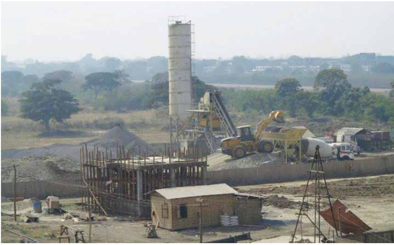
ငရွေဝါလမ်း၏ တောင်ဘက်ရှိ မြေယာပြဿနာဖြစ်နေသော မြေကွက်များကို တွေ့ရစဉ်

ညီညီဇော် မန္တလေး၊ ဩဂုတ်- ၃၀ မန္တလေးမြို့၊ ချမ်းမြသာစည်လေယာဉ်ကွင်းဟောင်းအနီးရှိ မြေကွက်များကို မြို့ပြစီမံကိန်းများတည်ဆောက်နေပြီဖြစ်သည့်အတွက် မသိနားမလည်သူများ ရောင်းမှား၊ ဝယ်မှားမဖြစ်ရန် မန္တလေးမြို့တော်စည်ပင်သာယာရေးကော်မတီမှ အသိပေးထားကြောင်း သတင်းရရှိသည်။