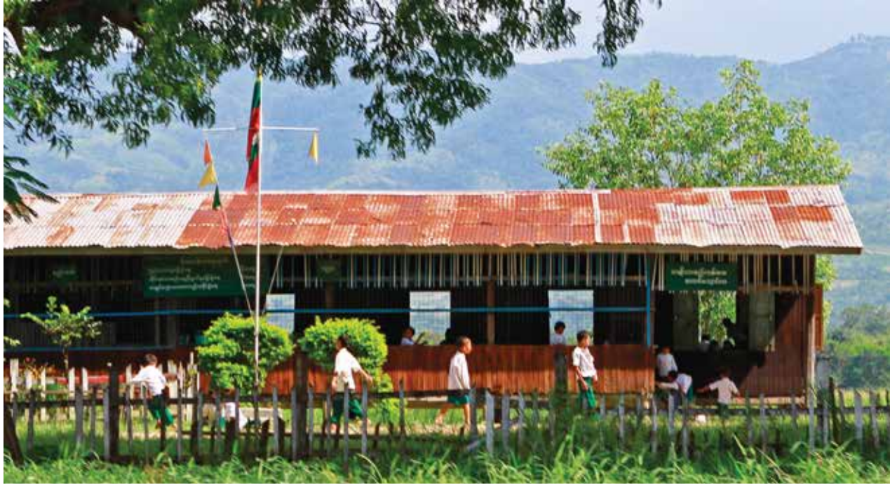
ရှမ်းပြည်နယ်တစ်နေရာရှိ အခြေခံပညာကျောင်းတစ်ကျောင်း

နေလင်းထွန်း ရန်ကုန်၊ ဩဂုတ်-၃၁ မြို့ပြနှင့် ကျေးလက်ဒေသရှိ အခြေခံပညာကျောင်းများ ဖွံ့ဖြိုးတိုးတက်မှုအတွက် မိဘဆရာအသင်းနှင့် ကျောင်းအကျိုးဆောင်အဖွဲ့တို့၏ အခန်းကဏ္ဍသည် အရေးပါလာကြောင်း ပညာရေးအသိုင်းအဝိုင်းကပြောသည်။