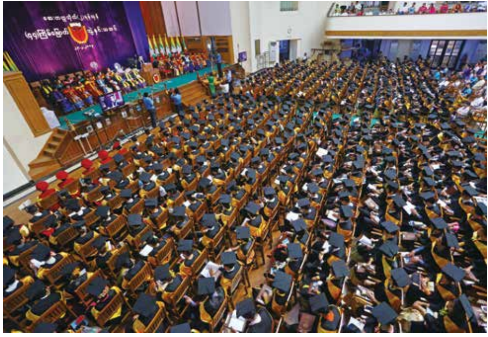
ဆေးတက္ကသိုလ် (ရန်ကုန်) ၏ (၄၄) ကြိမ်မြောက် ဘွဲ့နှင်းသဘင်ပွဲကျင်းပစဉ်

ထိုဘွဲ့ရရှိထားသူများပါဝင်ရောက် ဖြေဆိုနိုင်မည့် လက်ထောက် ဆရာဝန်လစ်လပ်နေရာ တစ်ထောင်ကျော်အတွက် ပြည်ထောင်စု ရာထူးဝန်အဖွဲ့မှ လျှောက်လွှာများ ခေါ်ယူထားသည်။