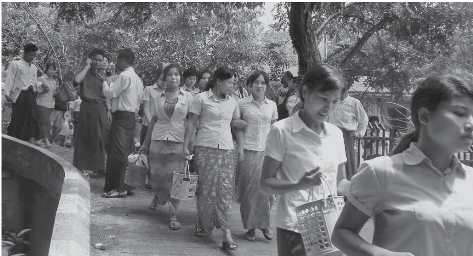
ဓာတ်ပုံ-ကျေးမောင်မောင်(အမရပူရ)

အေးမြတ်သူ ရန်ကုန်၊ ဩဂုတ်-၃၁ ပြည်တွင်းလုပ်သားများ အလုပ် ထုတ်ခံရပါက နှစ်နာကြေးရရှိရန် အပါအဝင် အကျိုးခံစားခွင့်များ တိုးမြှင့်၍ ညှိနှိုင်းဆွေးနွေးလျက်ရှိကြောင်း အလုပ်သမား၊ အလုပ်အကိုင်နှင့် လူမှုဖူလုံရေးဝန်ကြီးဌာနမှ သတင်းရရှိသည်။