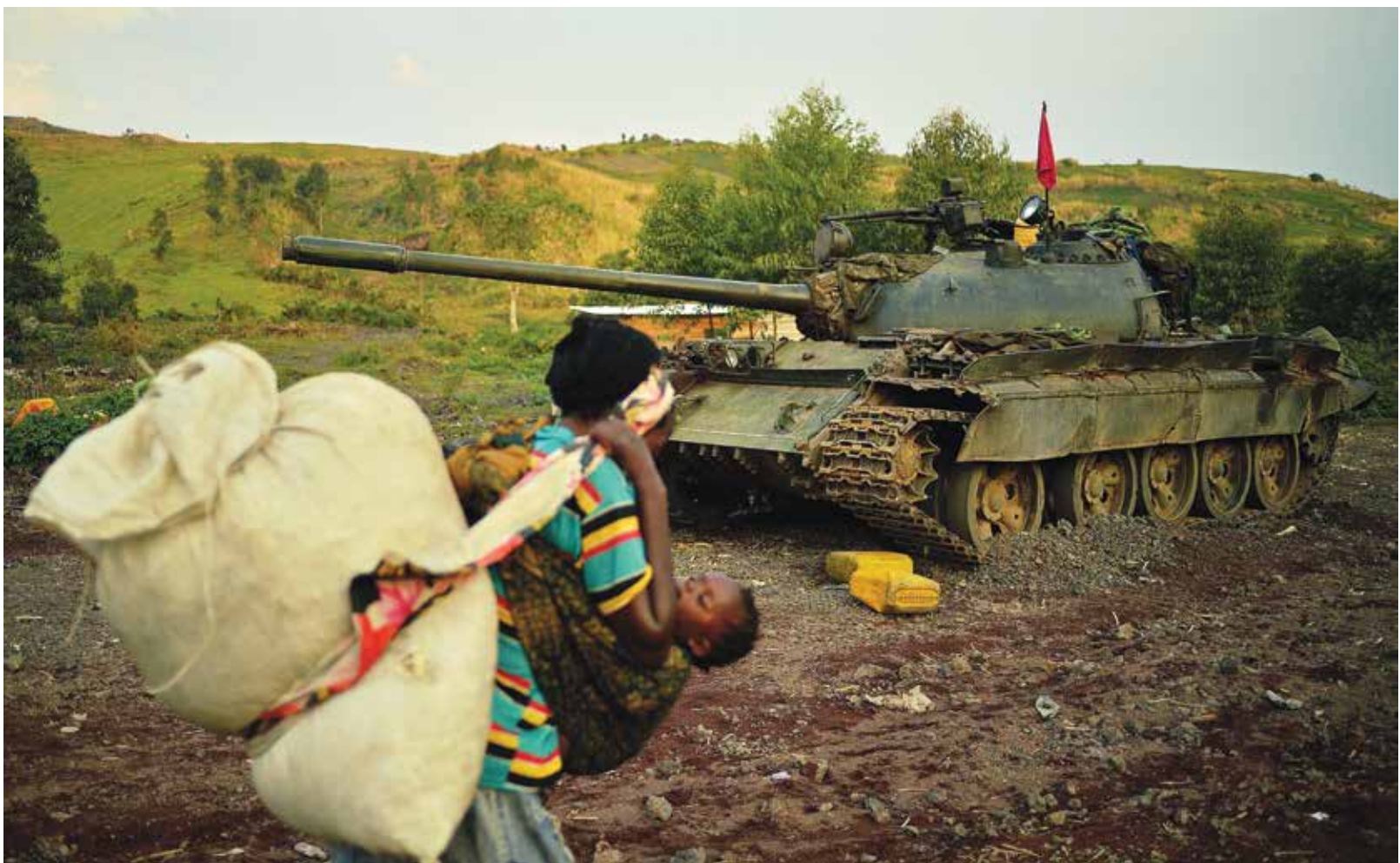
မြို့တော်ဂိုဏ်းကွန်ဂိုအစိုးရတပ်၏ တင့်ကားတစ်စီးရှေ့မှ ကလေးချီလျက်ဖြတ်လျှောက်သွားသော အမျိုးသမီးတစ်ဦး

ကွန်ဂိုစစ်တပ်က ၎င်းတို့ဘက်ကို ပစ်ခတ်ကြောင်း ရပ်ခံဒါ