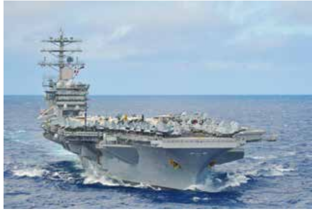
(Nimitz) လေယာဉ်တင်သင်္ဘော လောလောဆယ်တွင် မြေထဲပင် တိုက်ခိုက်ရေးရေယာဉ်အုပ်စုမှာ လယ် အရှေ့ပိုင်းသို့ သွားရောက်

ဝါရှင်တန်၊ စက်တင်ဘာ-၂ ဆီးရီးယားနိုင်ငံအပေါ် အမေရိကန်က အကန့်အသတ်ဖြင့် တိုက်ခိုက်မှုတွင် လိုအပ်ပါက ပါဝင်ကူညီနိုင်ရန် နျူကလီးယားစွမ်းအင်သုံး လေယာဉ်တင်သင်္ဘော USS Nimitz နှင့် ယင်းနှင့်အတူ လိုက်ပါသော တိုက်ခိုက်ရေး သင်္ဘောအုပ်စုသည် ပင်လယ်နီဆီသို့ ဦးတည်ခုတ်မောင်းနေကြောင်း ကာကွယ်ရေးအရာရှိများက ပြောကြားသည်။ ဖျက်သင်္ဘောလေးစီးနှင့် ခရုဆာစစ်သင်္ဘောတစ်စီးပါဝင်သော စာမျက်နှာ ၄၆ >>