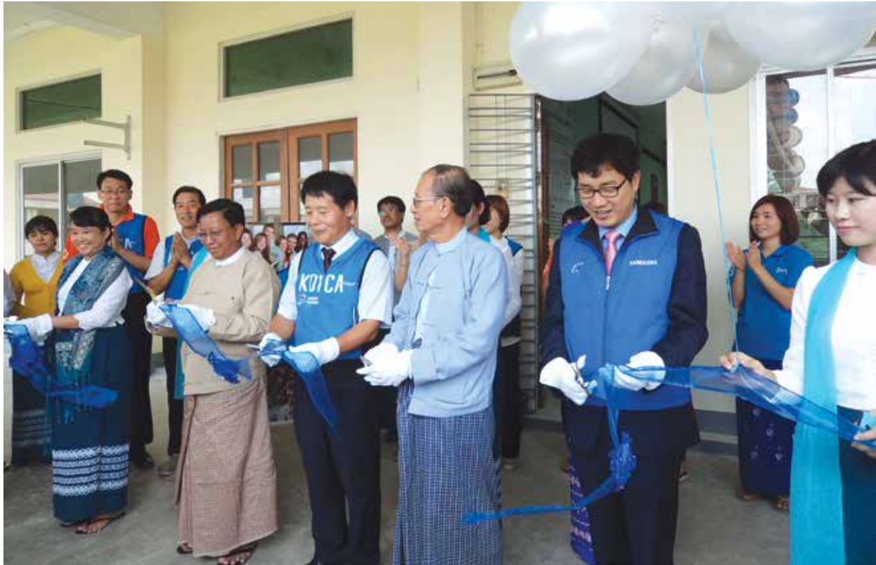
ဒစ်ဂျစ်တယ်စာကြည့်တိုက်ဖွင့်ပွဲကျင်းပစဉ်