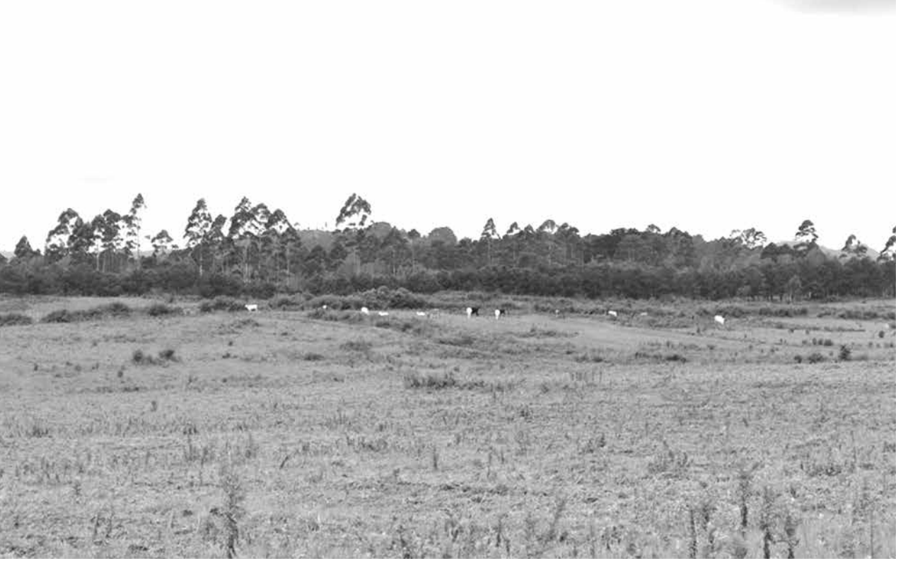
စီမံကိန်းဆောင်ရွက်မည်ဟုသတင်းထွက်ပေါ်နေသော ဒေသကိုတွေ့ရစဉ်

နွားတွေအတွက် စားကျက်မြေဆိုတာ ကျန်မှာတောင်မဟုတ်ဘူး။ သူတို့လုပ်ဖြစ်သွားလို့ ကျွန်တော်တို့ ကျွဲ၊ နွားတွေ သူတို့ပိုင်နက်ထဲ ဝင်ပြီး မြက်စားရင် တောင်တရားစွဲခံရနိုင်တယ်။ ဝမ်းစာအတွက် တောင်ယာဝင်လုပ်ရင်လည်း မုံရွာလက်ပံတောင်းတောင်ကိစ္စမျိုးလိုဖြစ်လာနိုင်ဘူးလို့ဘယ်သူက အာမခံနိုင်မှာလဲ”ဟု တိုင်းရင်းသားတစ်ဦးကပြောသည်။ ပြည်သူ့လွှတ်တော်ဥပဒေကြမ်းကော်မတီဥက္ကဋ္ဌ နှင့် ကွတ်ခိုင်မြို့နယ် ပြည်သူ့လွှတ်တော်ကိုယ်စားလှယ်ဦးတီခွန်မြတ်က မူယင်းစီမံကိန်းကိုပြည်နယ်ဝန်ကြီးချုပ်က လူထုသဘောထားအမြင်တောင်းခံနေပြီး ယခုကဲ့သို့ အချိန်တွင် သက်ဆိုင်ရာမှလက်လွတ်စပယ် ခွင့်ပြုလိမ့်မည်မဟုတ်ဟု ပြောကြားထားသည်။ “ကျွန်တော်တို့ခရိုင်အနေနဲ့ ဒီစီမံကိန်းမဖြစ်နိုင်ကြောင်း အထက်ကို တင်ပြထားတယ်။ မူဆယ်မြေစာရင်းကတော့ ခွင့်ပြုထားတယ်လို့ ကြားပါတယ်”ဟု လားရှိုးမြို့နယ် မြေစာရင်းရုံးမှ တာဝန်ရှိသူတစ်ဦးကဆိုသည်။