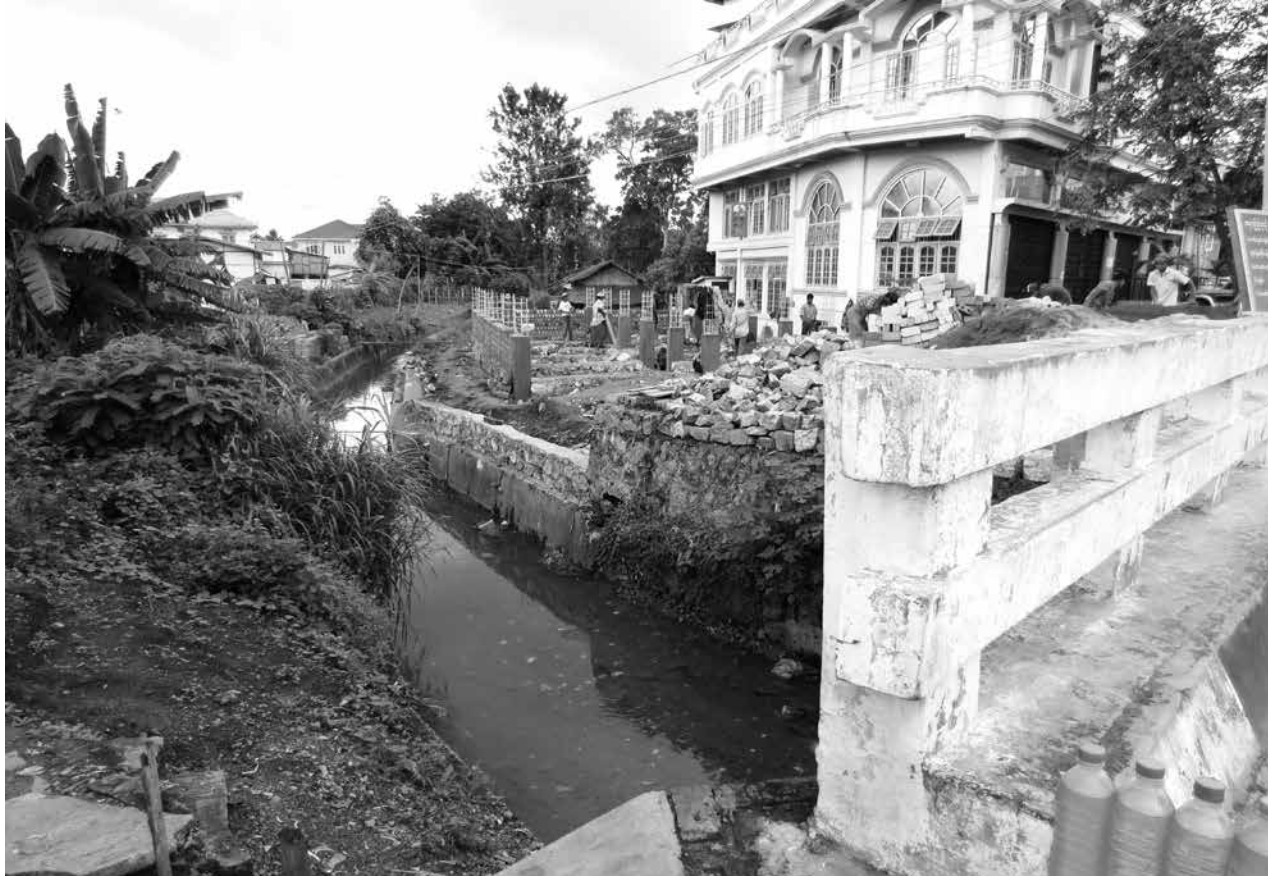
ပြင်ဦးလွင်မြို့မှ ဝဲလောင်းချောင်း

“ပြင်ဦးလွင်မြို့သည် ချယ်ရီမြို့တော်၊ ပန်းမြို့တော်ဟု ခေါ်ဆိုသော တပ်မြို့ဖြစ်ပြီး တပ်နှင့်ပြည်သူတစ်သားတည်းရှိသော မြို့တစ်မြို့လည်း ဖြစ်ကြောင်း ၂၀၁၂-၂၀၁၃ ခုနှစ်တွင် ပြင်ဦးလွင်မြို့တွင်း ရေကြီး၍ လူအသေအပျောက်ရှိခဲ့ဖူးသဖြင့် ရေကြီးရေလျှံမှု မဖြစ်စေရေး၊ ဝဲလောင်းချောင်းအပါအဝင် ရေနုတ်မြောင်းများ ရေစီးရေလာ ကောင်းမွန်အောင် ဝိုင်းဝန်းဆောင်ရွက်ပေးသွားကြစေလိုကြောင်း” ဖြင့် ဩဂုတ်လ ၂၂ ရက် နံနက်ပိုင်းတွင် ပြင်ဦးလွင် စာပေ(၂) အစည်းအဝေးခန်းမ၌ ပြင်ဦးလွင် တပ်နယ်မှ အရာရှိကြီးများအား ကာကွယ်ရေးဦးစီးချုပ် မိုလ်ချုပ်မှူးကြီး မင်းအောင်လှိုင်က မှာကြားသွားပါသည်။