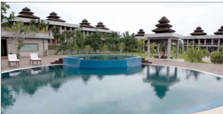
နေပြည်တော်ရှိ အဆင့်မြင့်ဟိုတယ်တစ်လုံး

“ဟိုတယ်အခန်းခန်းနံ့ထားတွေကိုလည်း သတ်မှတ်နှုန်းထားအတိုင်းသာ တောင်းခံရမယ်။ မိမိတို့ဟိုတယ်အစီအစဉ်နဲ့ အခန်းခ