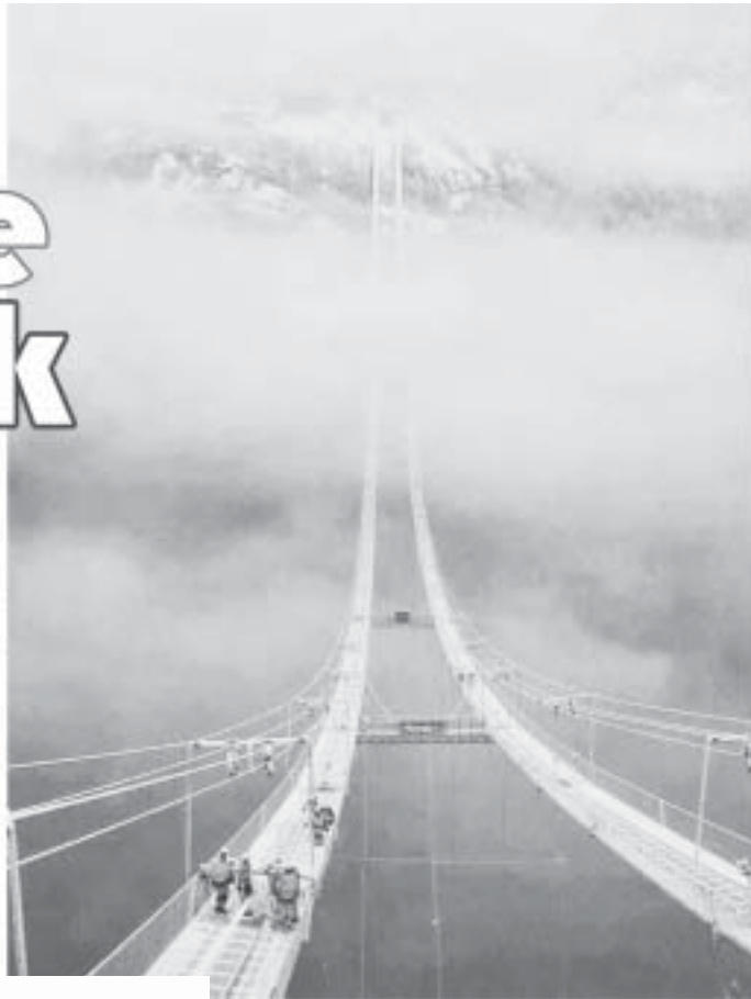
အရည်ဆုံးကြီးတံကား