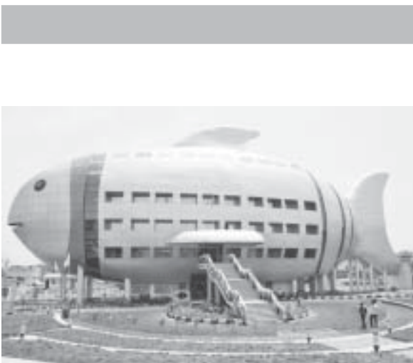
ငါးပုံသဏ္ဍာန်အဆောက်အအုံ