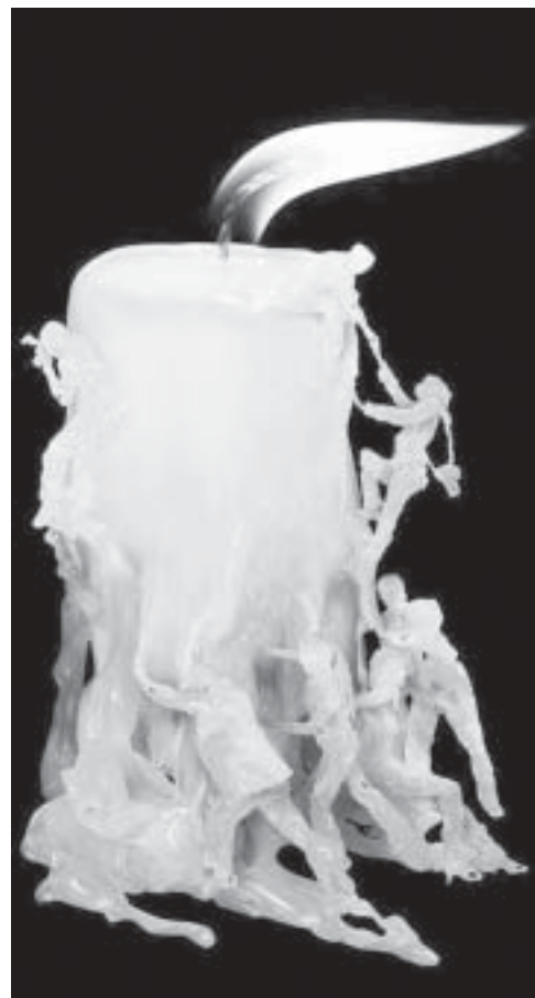
ဖယောင်းတိုင်အနုပညာ