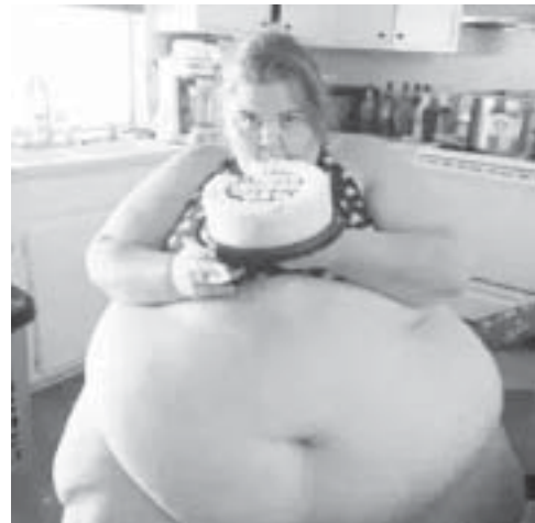
အစားကြီးတဲ့ ဖမ