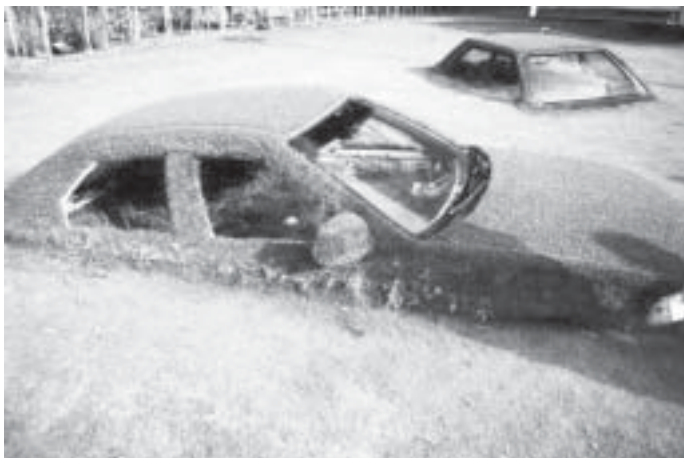
ပန်းခြံထဲက ကား