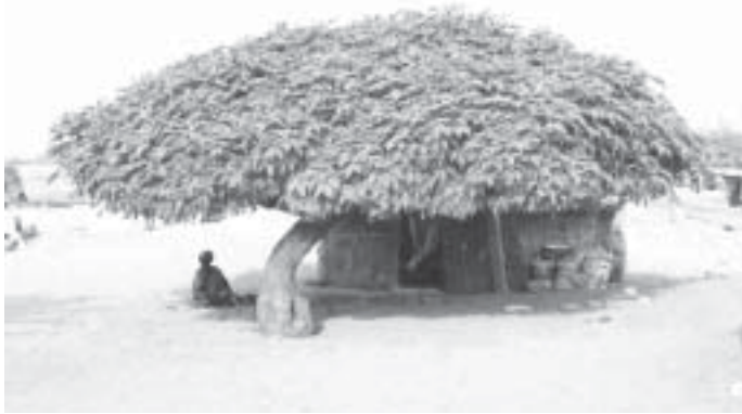
သဲကန္တာရဒလယ်က သစ်ပင်