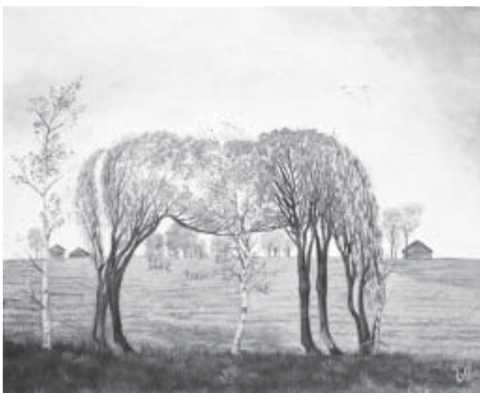
မြင်းသစ်ပင်