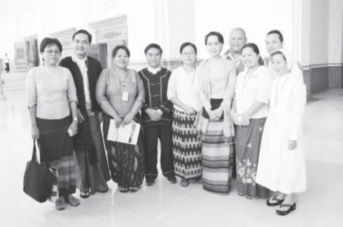
စက်တင်ဘာ ၁၂ရက် နံနက် ၁၀နာရီက ပထမအကြိမ်ပြည်သူ့လွှတ်တော် (၁၁)ကြိမ်မြောက် ပုံမှန်အစည်းအဝေး ဒုတိယနေ့တွင် ပြည်သူ့လွှတ်တော် တရားဥပဒေစိုးမိုးရေးနှင့် တည်ငြိမ်အေးချမ်းရေးကော်မတီဥက္ကဋ္ဌ ဒေါ်အောင်ဆန်းစုကြည်အား လွှတ်တော်လေ့လာရေးလာရောက်သောလေ့လာရေးအဖွဲ့များက လွှတ်တော်ဓမ္မစာချုပ်ချိန်တွင် လာရောက် တွေ့ဆုံ နှုတ်ဆက်စဉ်။