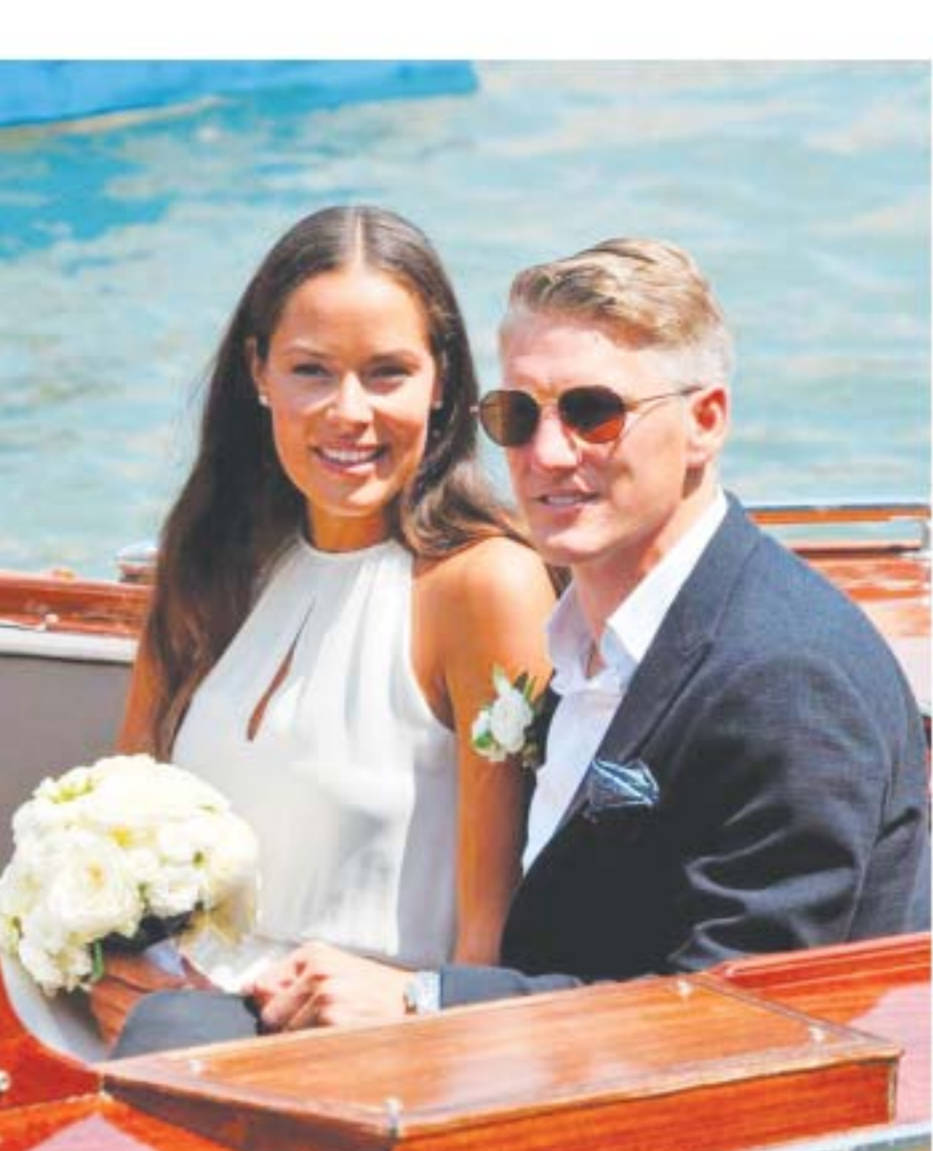
မန်ချက်စတာယူနိုက်တက်နှင့် ဂျာမန်ကစားသမား ဝူဒီနီးစတိုင်ဂါနှင့် ဆားဇီးယားတင်းနစ်အားကစားမယ် အင်နာအီမန်နိုဗစ်တို့ ၁၃-၇-၂၀၁၆ ရက်က လက်ထပ်မင်္ဂလာပွဲ ကျင်းပခဲ့သည်။