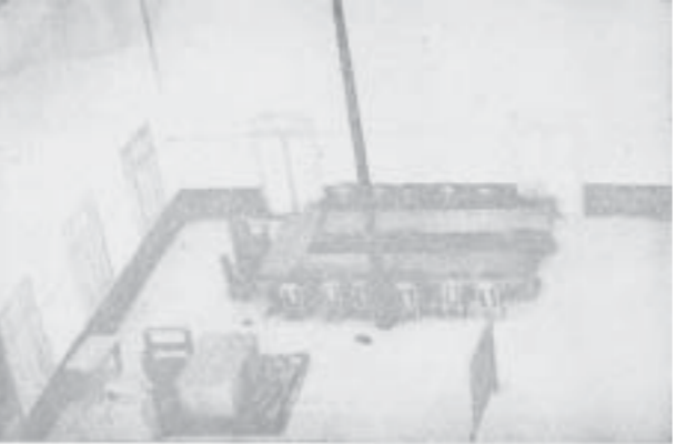
လုပ်ကြံမှုကြီး ဖြစ်ပွားခဲ့သော ဗိုလ်ချုပ် အောင်ဆန်း၏ ရုံးခန်းနှင့် အစည်းအဝေးဆောင်။