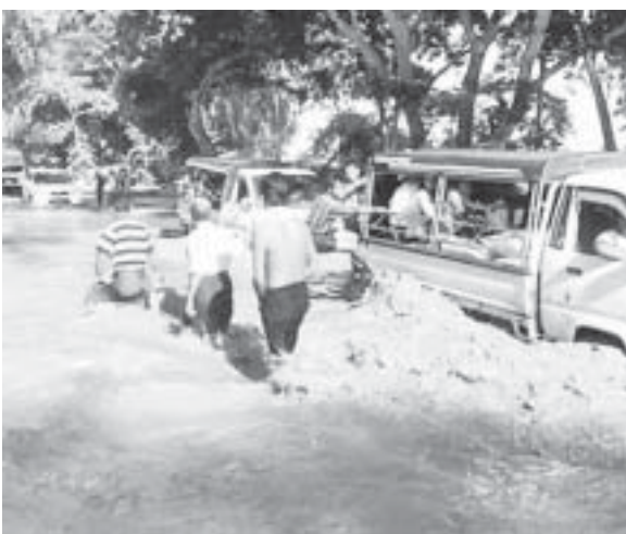
ရန်ကင်းမြို့နယ်၊ ဝါးတန်းကျေးရွာမှာ မိုးကြောင့် ရေကြီးရေလွှဲခြင်းကြောင့် ကျောင်းတချို့ ရေနှစ်မြှုပ်

မန္တလေးတိုင်းဒေသကြီး ပုသိမ်ကြီးမြို့နယ်တွင် စက်တင်ဘာ ၁၄ရက်မှစ၍ သဲရက်ဆက်တိုက်မိုးရွာသွန်းခဲ့ရာ ဆည်တော်ကြီးမြောင်းမှ ရေများနှင့် အခြေတည်ရမ်းမတောင်တန်းများမှ တောင်ကျရေများစီးဆင်းလာမှုကြောင့် လူနေရပ်ကွက်များနှင့် အခြေခံပညာအထက်တန်းကျောင်း ရေနှစ်မြှုပ်ခဲ့ကြောင်း သိရသည်။ “နှစ်တိုင်းလိုလို တောင်ကျရေကြောင့် ရပ်ကွက်တွေ ရေလွှဲတတ်တယ်။ ဆည်တော်ကြီးမြောင်း ရေပိုရလွှဲက ရေလွှဲရင် နှစ်မြှုပ်နေကျပါ။ မနေ့က ဒီလမ်းပေါ်မှာ ရေတွေက ချောင်းထဲကနေ ကျော်လာတယ်။ ရပ်ကွက်တွေထဲ အကျန်ဝင်တော့တာပဲ။ ကျွန်တော့်အိမ်ဆိုရင် ရင်ဘတ်အထိ ရောက်တယ်။” - - - စ - ၇ သို့ - - -