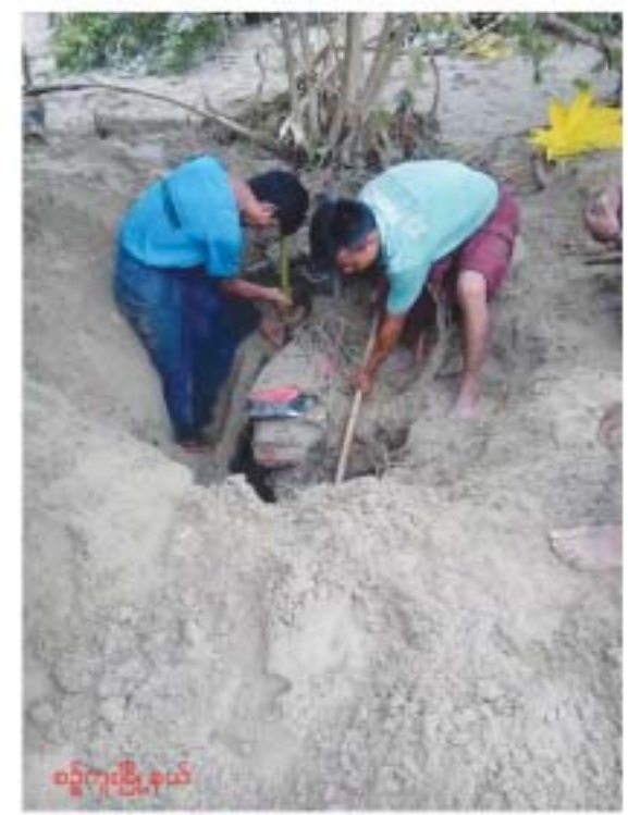
စဉ့်ကူးမြို့နယ် ရေမျက်ကျေးရွာမှာ တောင်ကျချောင်းရေကြောင့် နေအိမ်များ သဲနန်း ဖုံးလွှမ်းနှစ်မြှုပ်