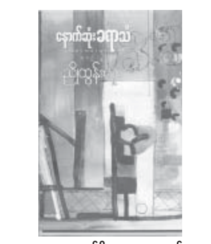
တန်ဖိုး - ၂၀၀၀ ကျပ်

ဥဒါဟရထံကား ... “ကျွန်တော်တို့၏ ကမ္ဘာကြီးတွင် ငြိမ်းချမ်းသာယာမှု၊ ပျော်ရွှင်မှုတွေ ဆိတ်သုဉ်းသွားတော့မလား။ ရင်လေးစရာ အတွေးများက လူသားများကို စိစီးထားပါသည်။ ဘောလုံးပွဲတွေကို စွဲစွဲမက်မက် ကြည့်ခဲ့သည့်ကျွန်တော်ကတော့ ကမ္ဘာကြီး၏ ထာဝစဉ်ငြိမ်းချမ်းသာယာပျော်ရွှင်ရေးအတွက် ဆောင်ရွက်ပေးကြမည်