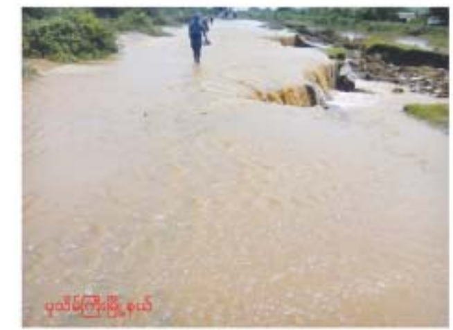
ပုသိမ်ကြီးမြို့နယ်အတွင်း တောင်ကျရေကြောင့် ကျောင်းတချို့ ရေနှစ်မြှုပ်

စဉ့်ကူးမြို့နယ်၊ ရေမျက်ကျေးရွာတွင် စက်တင်ဘာ ၁၈ရက် နံနက် ၃နာရီခန့်က မိုးသည်းထန်စွာရွာ၍ အိမ်ခြေ ၂၃၀လုံး ထိခိုက်ပျက်စီးခဲ့သည်။ မိုးသည်းထန်စွာရွာသွန်းခြင်းနှင့်အတူ ရေကြီးရေလွှဲခဲ့ပြီး အိမ်ခြေ ၅၃လုံးခန့်မှာ သဲနန်းများ ဖုံးလွှမ်းခြင်း ခံခဲ့ရသည်။ ထို့ပြင် ထူးကဲရွာရွာသွန်းသည့်မိုးကြောင့် ရောက်ပင်နိုး၊ ကံမြို့၊ ကျည်တောက်ပေါက်နှင့် နွယ်ရုံတို့တွင်လည်း ရေကျော် ရေလွှမ်းသွားသဖြင့် ထိခိုက်ပျက်စီးမှုများရှိကြောင်း သိရသည်။ ရေမျက်ကျေးရွာတွင် တောင်ကျရေကြောင့် မြေပြို၊ သဲနန်းဖုံးမှုများဖြစ်ပွားခဲ့ပြီး တလေးလူကြီး ငါးဦးပျောက်ဆုံးနေကြောင်း သိရသည်။ အဆိုပါမိုးကြောင့် ကံမြို့တစ်ဖက်ရပ်ဆည် ကျိုးပေါက်မှု ဖြစ်ပွားပြီး လူနေအိမ်ခြေများရေနှစ်မြှုပ်ပြီး လယ်ယာခြေများ ရေလွှမ်းပျက်စီးခဲ့သည်။