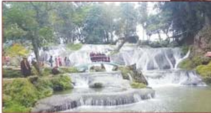
▲ (ယခင်) ရွာဖွယ်ရေယဉ် တာသွင်သွင် (ယခု) တောင်ကျရေရှိင်း ကဆုန်ခိုင်း