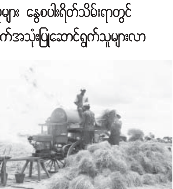
အောင်ဇေယျာ

စပါးခြွေလှေ့ရန်အတွက် စပါးတစ်ဧက ရိတ်သိမ်းခ ကျပ် ၂၅၀၀၀၊ စပါးခြွေစက်ငှားရမ်းခတစ်နာရီ ၆၀၀၀ကျပ်ဖြင့် ငှားရမ်းသုံးစွဲရရာ၊ စပါးခြွေလှေ့စက်များမှ လယ်ကန်သင်းစိုးမှာ ခြွေလှေ့ ပေးရာတွင် ကောက်ရိုးစက်ဖျားကိုပါ တစ်ပြိုင်နက်တည်း မီးရှို့ပေးသဖြင့် စပါးရိတ်သိမ်းထုတ်လုပ်ရာတွင် တစ်ကွင်းလုံးပြောင်တလင်းခါမှုပါပြီးစီးသည်။ ရွှေဘိုနယ်နွေစပါးအထွက်နှုန်းမှာ တစ်ဧကတင်း ၉၀၀န်းကျင်ထွက်ရှိကြောင်းသိရသည်။