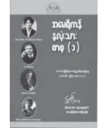
တန်ဖိုး - ဖော်ပြမထား