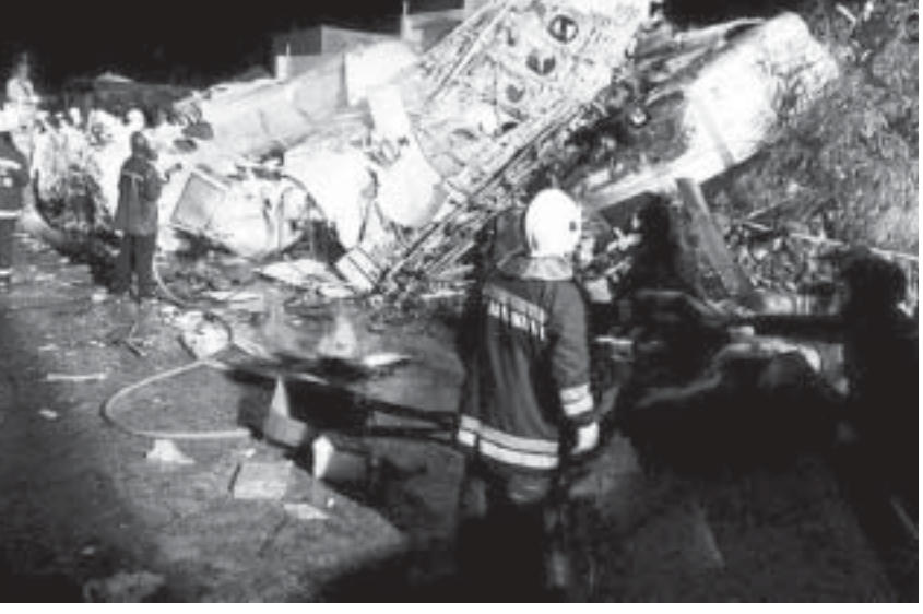
တရုတ်နိုင်ငံမှာ

ထိုင်ဝမ်တွင် အင်အားကြီး မတ်မို့ တိုင်းဖွန်း မုန်တိုင်းဝင်ရောက်တိုက်ခတ်မှုကြောင့် ခရီးသည် တင်လေယာဉ်တစ်စီး ဇူလိုင် ၂၃ ရက် ညက ပင်ဂူ ကျွန်း၌ ပျက်ကျခဲ့သည်။ လေယာဉ်ပျက်ကျမှု ကြောင့် ခရီးသည် ၄၈ ဦးသေဆုံးပြီး ကျန်ခရီးသည် ၁၀၉ ဦး ဒဏ်ရာရရှိကြောင်း AFP သတင်းအရ သိရ သည်။ Trans Asia Airways မှ ATR-72 လေယာဉ်သည် ခရီးသည် ၅၈ ဦးလိုက်ပါ၍ ထိုင်ဝမ် ကျွန်းတောင်ဘက် တာအိုဆီယန်မြို့မှ ထိုင်ဝမ် ရေလက်ကြားရှိ အပန်းဖြေစခန်း ပင်ဂူကျွန်းသို့ ပျံ သန်းစဉ် မုန်တိုင်းတိုက်၍ မာဂူနီလေဆိပ်သို့ ဆင်း သက်ရန် ကြိုးစားသော်လည်း မအောင်မြင်ဘဲ အဆောက်အဦ တစ်ခုခုနှင့်တိုက်မိပြီး ပျက်ကျခြင်း ဖြစ်သည်။ အဆိုပါလေယာဉ်တွင် ပြင်သစ်နိုင်ငံသား နှစ် ဦးပါကြောင်းနှင့် လေယာဉ်အဖွဲ့သားများလည်း လွတ်မြောက်မည်မထင်ကြောင်း လေကြောင်းလိုင်း မှပြောကြားသည်။ ထိုင်ဝမ်တွင် ပုဂ္ဂလိက လေကြောင်းကုမ္ပဏီတစ်ခုမှ ATR-72 လေယာဉ် ပျက်ကျခြင်းသည် ၁၀၅ နှစ် တစ်ခုအတွင်း လူသေ ဆုံးမှု ဖြစ်ပွားသည့် လေယာဉ်ပျက်ကျမှုလည်း ဖြစ် သည်။ ATR-72 လေယာဉ်သည် ရာသီဥတုမ ကောင်းသဖြင့် လှည့်ပြန်လာခဲ့ကြောင်း မျှော်စင်သို့ သတင်းပို့ခဲ့သေးကြောင်းသိရသည်။