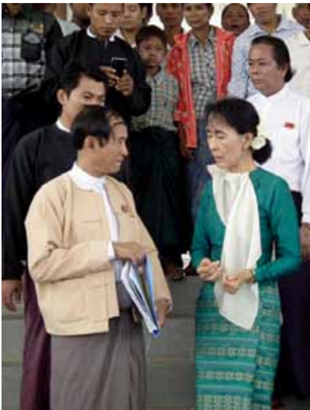
နေပြည်တော်တရားရုံးတစ်ခုမှ ဖြတ်သန်းသည့် ဒေါ်အောင်ဆန်းစုကြည်

အစီရင်ခံစာ၏ သုံးသပ်ချက်အပိုင်းတွင် နိုင်ငံသူနိုင်ငံသားများအား ဥပဒေနှင့်အညီ ကာကွယ်