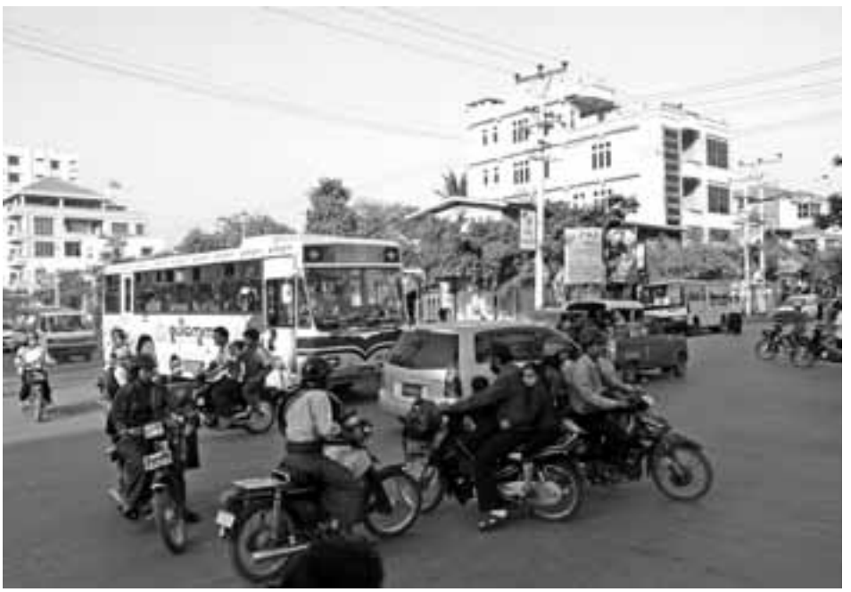
မန္တလေးမြို့ရှိ ယာဉ်ကြောရှုပ်ထွေးရာ လမ်းဆုံတစ်နေရာကို တွေ့ရစဉ်

မန္တလေး၊ နိုဝင်ဘာ - ၂၅ မန္တလေးတွင် ယာဉ်ကြောရှုပ်ထွေးမှုများ သက်သာစေရန်အတွက် လွယ်ကူစေရန်အတွက် အဆင့်မြင့်နည်းပညာသုံး မီးပွိုင့်နှစ်ခုအား ကျပ်သိန်း ၆၀၀ ကျော် အကုန်အကျခံ တပ်ဆင်သွားမည်ဖြစ်ကြောင်း မန္တလေးမြို့တော်စည်ပင်သာယာရေးကော်မတီမှ သတင်းရရှိသည်။ တရုတ်နည်းပညာသုံး အဆင့်မြင့် ဒစ်ဂျစ်တယ် မီးပွိုင့်နှစ်ခုကို မန္တလေးမြို့ ၆၂ လမ်းနှင့် ၂၆ လမ်းဆုံတွင် တစ်ခုနှင့် ရန်ကုန်-မန္တလေးလမ်းမကြီးနှင့် စစ်ကိုင်းလမ်းဆုံဆုံရာတွင် တစ်ခု တပ်ဆင်မည်ဖြစ်ကာ ၎င်းမီးပွိုင့်နှစ်ခုတပ်ဆင်မှုအတွက် ကျပ်သိန်း ၆၃၀ ကုန်ကျမည် ဖြစ်ပြီး ဒီဇင်ဘာထဲတွင် အပြီးသတ် တပ်ဆင်သွားမည်ဖြစ်ကြောင်း သိရသည်။ မီးပွိုင့်များကို K.Light ကုမ္ပဏီက တာဝန်ယူတပ်ဆင်မည် ဖြစ်ပြီး ကုန်ကျစရိတ်အား မန်းစည်ပင်အသုံးစရိတ်ထဲမှ ခွဲဝေသုံးစွဲခြင်းဖြစ်ပြီး ပထမဆင့် စမ်းသပ် တပ်ဆင်ခြင်းဖြစ်ကာ ယာဉ်ကြောရှုပ်ထွေးမှု သက်သာခြင်း၊ မော်တော်ယာဉ်စီးနင်းသူများအတွက် အဆင်ပြေလျှင် ယခုကဲ့သို့ အဆင့်