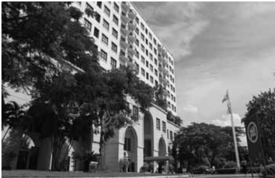
မကြာမီဖြိုဖျက်မည်ဆိုသည့် ဂရင်းမီးရထား Residences