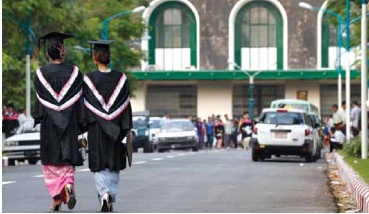
နိုဝင်ဘာ ၂၅ ရက်ကတွေ့ရသည့် ရန်ကုန်တက္ကသိုလ် ဘွဲ့နှင်းသဘင်ခန်းမရှေ့မြင်ကွင်း