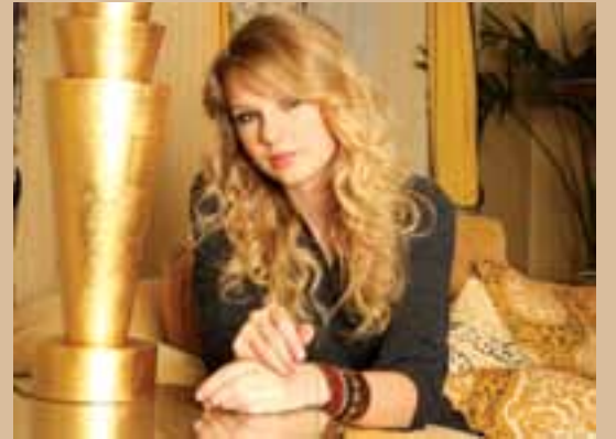
ယခုနှစ်အစောပိုင်းမှစ၍ ဒေါ်လာခြောက်သန်းတန် နေအိမ်ကြီး

အမေရိကန်ကျေးလက်ဂီတအဆိုတော်တေလာဆွစ်မ်သည် ချစ်သူ ဟောင်းကော်နာကနေဒီနှင့် လမ်းခွဲပြီးနောက် ဗြိတိန်နိုင်ငံလန်ဒန်မြို့ရှိ One Direction အဖွဲ့မှ လူငယ်ဂီတသမား ဟယ်ရီစတိုင်းဝယ်ယူ ထားသော အိမ်အနီးတွင် အိမ်တစ်လုံးဝယ်ယူရန် ရှာဖွေနေသည်။ အသက် ၂၂နှစ်အရွယ်ရှိအဆိုတော်တေလာဆွစ်မ်သည် ကော် နာကနေဒီနှင့် လမ်းခွဲပြီးနောက် One Direction အဖွဲ့၏ ဟယ်ရီနှင့် ချစ်ဇာတ်လမ်းစတင်နေဖွယ်ရှိကြောင်း သတင်းများက ခန့်မှန်းဖော်ပြ ကြသည်။ နီးစပ်သူတစ်ဦးကလည်း ဆွစ်မ်သည် လန်ဒန်တွင် ပရင်မ ရှိစေလ်ဇေယာဉ် အိမ်ဝယ်နေခြင်းမှာ ဟယ်ရီနှင့် မကြာသေး မီက နီးစပ်မှုကြောင့်ဖြစ်ကြောင်း ဟယ်ရီကိုပင် အိမ်ရှာပေးရန် မေးမြန်းထားကြောင်းဆိုသည်။ ဟယ်ရီစတိုင်းသည် ထိုအရပ် တွင် တစ်လုံးဝယ်ယူထားခဲ့သည်။