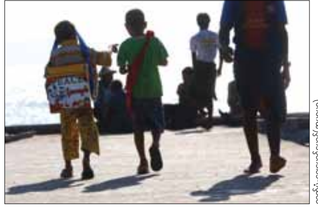
စာတိုက်-ရေပေးပေးပေးပေး (အမရပူရ)

Inquiry Ph: (01) 3739997, (01)381751, (02) 72992.