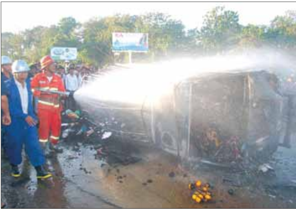
ကားခေါင်းခန်းတွင် မီးလောင်ပေါက်ကွဲမှုကြောင့် မီးကျွမ်းသေဆုံးနေပြီဖြစ်သော အလောင်းနှစ်လောင်းနှင့် ကားအား မီးငြိမ်းသတ်နေသော မီးသတ်တပ်ဖွဲ့ဝင်များ

ထိုနေ့ညနေ ၄ နာရီ ၅ မိနစ်တွင် ပုပ္ပသီရိမြို့နယ်အစပ်နှင့် နေပြည်တော်ပျဉ်းမနားကြား၊ ရာဇဌာနီလမ်းမပေါ်တွင် နေပြည်တော်ဘက်မှလာသော လိုက်ထရပ်ကားမှာ အရှိန်ပြင်းပြင်းနှင့်မောင်းနှင်လာပြီး မီးပွင့်မီးနီကို ဖြတ်မောင်းရာတွင် ပုပ္ပသီရိမြို့နယ်ဘက်မှ နေပြည်တော် ပျဉ်းမနားဘက်အလာလမ်းဆုံတွင် ကားချင်းတိုက်မိခြင်းဖြစ်သည်။ လိုက်ထရပ်ကားမှာ အရှိန်မထိန်းနိုင်ဘဲ ပေနှစ်ဆယ်ခန့်လွင့်သွားကာ တစ်ပတ်လည် မှောက်သွားရာမှ ကားတစ်စီးလုံး မီးလောင်ပေါက်ကွဲသွားကြောင်း၊