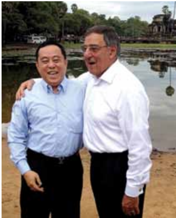
မြန်မာကာကွယ်ရေးဝန်ကြီးနှင့် အမေရိကန်ကာကွယ်ရေးဝန်ကြီးတို့ကို ရင်းနှီးစွာတွေ့ရစဉ် ဓာတ်ပုံ-အာဆီယံအထွေထွေအတွင်းရေးမှူးချုပ်ရုံး

အမေရိကန်အပါအဝင် နိုင်ငံပေါင်းစုံမှ တပ်သားအင်အား တစ်သောင်းကျော်ပါဝင်သော Cobra Gold စစ်ရေးလေ့ကျင့်မှု အစီအစဉ်တွင် မြန်မာနိုင်ငံမှ လာမည့်နှစ်မှစ၍ သုံးကြိမ်ဆက်လေ့လာသူသုံးဦးစေလွှတ်ရန် ကမ္ဘောဒီးယားနိုင်ငံ စီရမ်ရီတွင် အမေရိကန်တပ်မတော်နှင့် မြန်မာ့တပ်မတော်မှ တာဝန်ရှိသူများ သဘောတူညီမှုရရှိခဲ့ကြောင်း သတင်းရရှိသည်။ စာ(၃၀)သို့