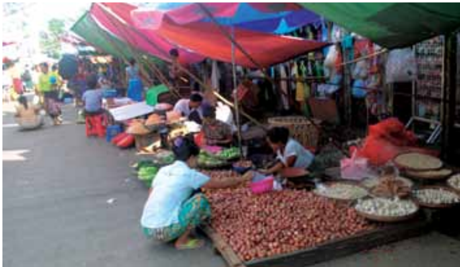
ရာသီဥတုဖောက်ပြန်မှုသည်လည်း ကြက်သွန်နီဈေးမြင့်ရခြင်းအကြောင်းဖြစ်