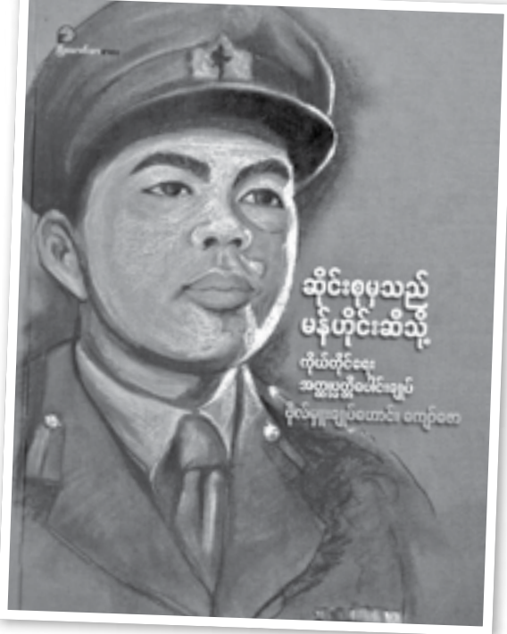
ဆိုင်းစုမှသည် မန်ဟိုင်းဆီသို့ ကိုယ်တိုင်ရေး အတ္ထုပ္ပတ္တိ ဗိုလ်မှူးချုပ်ဟောင်း ကျော်ဇော

အသက် ၁၉ နှစ်အရွယ်မှာပင် ကိုလိုနီနယ်ချဲ့ဆန့်ကျင်ရေးတရား လှည့်လည်ဟောပြောခဲ့သူ ဗိုလ်မှူးချုပ်ဟောင်းအောင်ဆန်းနှင့်အတူ ဂျပန်နိုင်ငံသို့သွားရောက်ကာ စစ်ပညာသင်ကြားခဲ့သူ ရဲဘော်သုံးကျိပ်ဝင်၊ ဖက်ဆစ်တော်လှန်ရေးကြီးတွင် ခေါင်းဆောင်တစ်ဦးအဖြစ် ရှေ့တန်းမှပါဝင်တိုက်ခိုက်ခဲ့သူ၊ လွတ်လပ်ရေးရပြီး ပြည်တွင်းစစ်မီး ဟုန်းဟုန်းတောက်စဉ် ရန်ကုန်မြို့ကြီး ကျဆုံးမသွားရလေအောင် အင်းစိန်တိုက်ပွဲကို ဦးစီးကာ ကြံ့ကြံ့ခံ ပြန်လည်တိုက်ခိုက်အောင်ပန်း ဆင်မြန်းနိုင်ခဲ့သူ၊ တရုတ်ဖြူကူမင်တန်တပ်များ ကျူးကျော်ဝင်ရောက်စဉ် စစ်ဆင်ရေးကြီးများဆင်နွှဲကာ ဦးစီးဆောင်တိုက်ထုတ်ခဲ့သူ၊ စစ်အာဏာရှင်နေဝင်း၏ မတရားလုပ်ဆောင်မှုကြောင့် တပ်မတော်မှ ထွက်ရရှာသူ၊ ပြည်တွင်းစစ်ရပ်စဲရေး ပြည်တွင်းငြိမ်းချမ်းရေး ဆွေးနွေးပွဲများတွင် ဆရာကြီးသခင်ကိုယ်တော်မှိုင်းနှင့်အတူ ရှေ့တန်းမှ ဦးဆောင်ပါဝင်ခဲ့သူ၊ လွတ်လပ်ရေးမော်ကွန်းဝင် နိုင်ငံ့ဂုဏ်ရည်တံဆိပ်များ အပ်နှင်းစဉ် လျှောက်လွှာမတင်ခဲ့သူ၊ လွတ်မြောက်နယ်မြေ ပန်ဆိုင်းသို့သွားရောက်ကာ စစ်အာဏာရှင်စနစ်အား ပြုတ်ပြတ်သားသား ဆန့်ကျင်တိုက်ခိုက်ခဲ့သူ၊ ရွှေတိဂုံစေတီတော်မြတ်ကြီးအား ဖူးမြော်ချင်ပါလျက် အိမ်လွမ်းစိတ္တဇဖြင့် ရေခြားမြေခြားမှာ ကွယ်လွန်ခဲ့ရာ သူ့ဗိုလ်မှူးချုပ်ဟောင်း ကျော်ဇော၏ ပင်ကိုရေးအတ္ထုပ္ပတ္တိစာအုပ်ဖြစ်သည်။