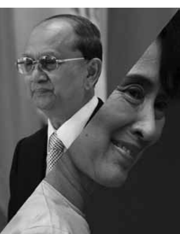
လျာထားစာရင်းတွင် သမ္မတဦးသိန်းစိန်နှင့် ဒေါ်အောင်ဆန်းစုကြည်တို့အကြောင်းကို တိုင်းမ်မဂ္ဂဇင်းအရှေ့အာရှနှင့် တရုတ်ဗျူရိုအကြီးအကဲ မစ္စစ်ဟန်နာတီချီက မိတ်ဆက်ရေးသားထားသည်။ မြန်မာသမ္မတနှင့် ဒေါ်အောင်ဆန်းစုကြည်တို့၏ ပူးပေါင်းဆောင်ရွက်မှုများကြောင့် နှစ်ပေါင်း ၅၀ ခန့် စစ်ရေးအုပ်ချုပ်မှုအောက် ရောက်ခဲ့သော တိုင်းပြည်အား ပြုပြင်ပြောင်းလဲလာစေခဲ့ကြောင်း ဖော်ပြထားသည်။

နိုဝင်ဘာ - ၂၆ ကမ္ဘာကျော် တိုင်းမ်မဂ္ဂဇင်းက ၂၀၁၂ ခုနှစ်အတွက် ဩဇာအရှိဆုံး ပုဂ္ဂိုလ် လျာထားစာရင်းတွင် မြန်မာနိုင်ငံသမ္မတဦးသိန်းစိန်နှင့် ဒေါ်အောင်ဆန်းစုကြည်တို့ ပူးတွဲပါဝင်လျက်ရှိသည်။ အဆိုပါစာရင်းတွင် အမေရိကန်သမ္မတ အိုဘားမား၊ အီဂျစ်သမ္မတ မိုဟာမက်မော့စီ၊ မြောက်ကိုရီးယား ခေါင်းဆောင် သစ်ကင်ဂျုံအမ်တို့ပါဝင်သလို တရုတ်သမ္မတနှင့် ဝန်ကြီးချုပ်သစ်၊ ကန်သမ္မတရွေးကောက်ပွဲ စိန်ခေါ်သူ မစ်ရွမ်းနေနှင့် ပေါလ်ရိုင်ယန်တို့လည်း ပါဝင်သည်။ ထို့အပြင် ယင်းစာရင်း၌ 'Gangnam Style' သီချင်းရေးစပ်သူ တောင်ကိုရီးယားအဆိုတော် PSY၊ ပါကစ္စတန်မှ အမျိုးသမီးပညာရေးလှုပ်ရှားသူ ကျောင်းသူမာလာလာ၊ ရုရှားနိုင်ငံမှ ပန်ကီတအဖွဲ့၊ Pussy Riot တို့လည်း ပါဝင်သည်။ သမ္မတဦးသိန်းစိန်နှင့် ဒေါ်အောင်ဆန်းစုကြည်တို့မှာ လောလောဆယ် မဲပေးထားသော စာရင်းအရ နံပါတ် ၁၄ နေရာတွင် ရောက်ရှိနေသည်။ တိုင်းမ်မဂ္ဂဇင်း စာဖတ်သူများအနေဖြင့် မိမိကြိုက်နှစ်သက်ရာ ပုဂ္ဂိုလ်က ဒီဇင်ဘာ ၁၂ ရက်ည ၁၁ နာရီ ၅၉ မိနစ်အထိ မဲပေးနိုင်