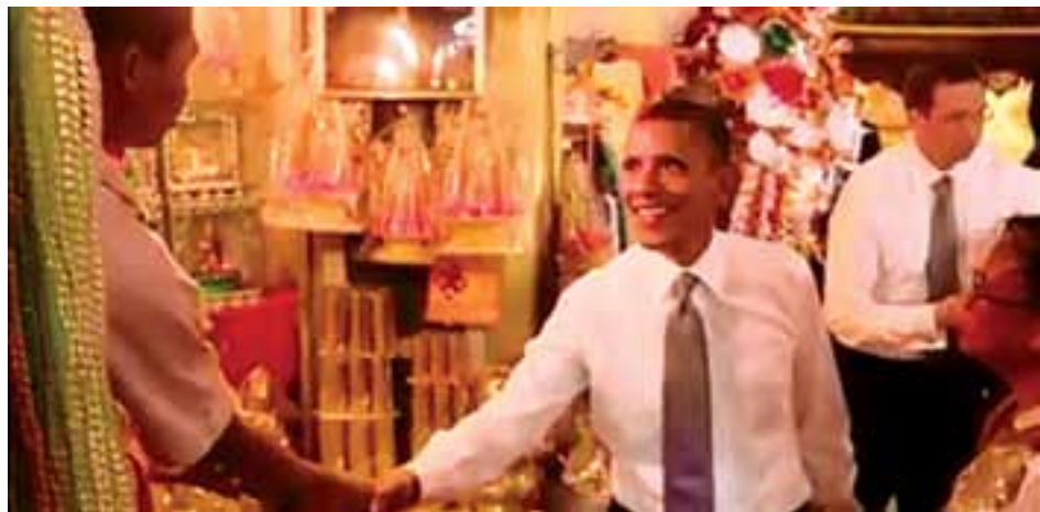
ပန်းပုဆိုင်ပိုင်ရှင်ရှင်လက်ဆွဲနှုတ်ဆက်နေသည့် သမ္မတအိုဘားမား