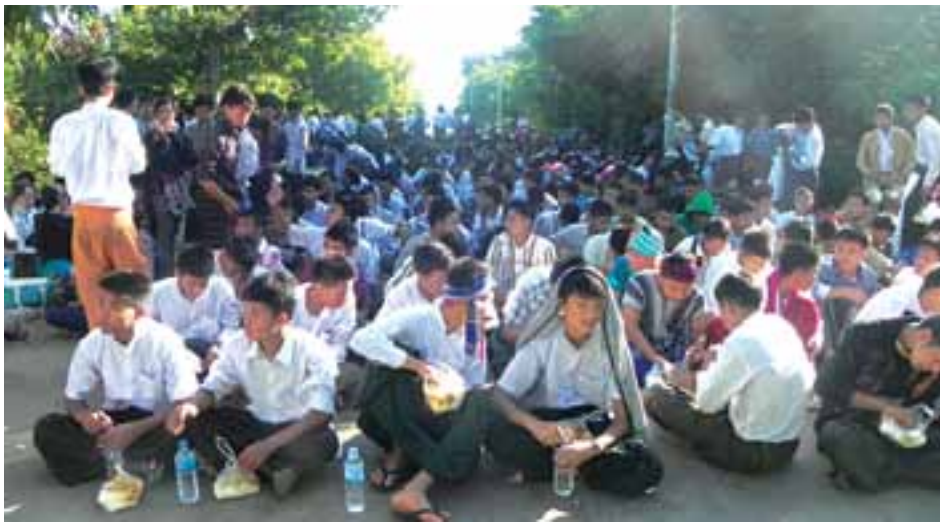
တိုင်းရင်းသားလူမျိုးများစွမ်းရည်ဖွံ့ဖြိုးရေးကောလိပ်(မန္တလေး)မှ ကျောင်းသားများ မူလကျောင်းတွင်ပြန်လည်ပညာသင်ယူနိုင်ရန် တောင်းဆိုနေစဉ်

လုပ်ဆောင်ပေးမည်ဖြစ်ကြောင်း၊ အချိန်ကာလအနေဖြင့် တစ်လခန့် ကြာမြင့်နိုင်ကြောင်း၊ ဒီထက်လည်း စောနိုင်ကြောင်း၊ အမြန်ဆုံးနှင့် အကောင်းဆုံး ဆောင်ရွက်ပေးမည် ဖြစ်ကြောင်း၊ ၎င်းကာလအတွင်း မူလကျောင်းတွင်ပင် နေထိုင်စောင့်ဆိုင်းနိုင်ကြောင်း ဝန်ကြီးက ပြောကြားခဲ့သည်ဟု ကျောင်းသားများက ပြောသည်။ “ဝန်ကြီးကိုလည်း ယုံကြည်ပါတယ်။ ကျွန်တော်တို့ဘက်မှာ အခွင့်အရေးများနေပါတယ်” ဟု ကျောင်းသားတစ်ဦးက ပြောသည်။ ကျောင်းသားများအနေဖြင့် တောင်းဆိုမှုများ ဆက်လက်မပြုလုပ်တော့ဘဲ အဆောင်အတွင်းမှာပင် ငြိမ်းချမ်းစွာနေသွားပြီး အဖြေထွက်မည့်ရက်ကို စောင့်ဆိုင်းကြရမည်ဖြစ်ကြောင်း အဆိုပါကျောင်းသားက ပြောသည်။ “ဟိုနေရာကို တောလို့ ကျွန်တော်တို့ မယူဆပါဘူးခင်ဗျ။ အဲဒီနေရာခွင့်ရရန်မှာ ဝန်ကြီးဌာနတစ်ခုတည်းဖြင့် ဆုံးဖြတ်၍ မရကြောင်း သက်ဆိုင်ရာ အစိုးရနှင့် နိုင်ငံတော် သမ္မတတို့ပါ ပူးပေါင်းစဉ်းစားဆုံးဖြတ်ကြရမည်ဖြစ်ကြောင်း ဝန်ကြီးအနေဖြင့် အကောင်းဆုံး