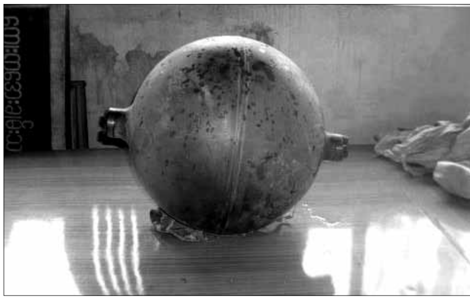
သံဖြူရေပဲခန်းကြီးကျေးရွာ ရာဘာခြံတစ်ခုအတွင်းတွင် တွေ့ရသော မီးခိုးရောင်သတ္တုလုံး

အိဖြူလွင်၊ ရန်ကုန်၊ နိုဝင်ဘာ- ၂၆ သံဖြူရေပဲမြို့နယ် အတွင်းသို့ ကောင်းကင်ပေါ်မှ ပေါက်ကွဲသံများနှင့် အလင်းတန်းများဖြစ်ပေါ်ပြီးနောက် သတ္တုပစ္စည်းများ ယခုလ ၂၃ ရက် နံနက်ပိုင်းတွင် ကျရောက်ခဲ့ကြောင်း သတင်းရရှိသည်။