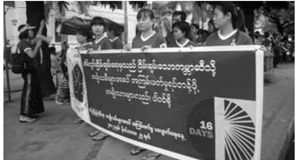
ပါဝင်ချိတ်ကပ်လမ်းလျှောက်ကြသူများ

အပြည်ပြည်ဆိုင်ရာအမျိုးသမီးများအပေါ် အကြမ်းဖက်မှု ပပျောက်ရေးနေ့ဖြစ်သည့် နိုဝင်ဘာ ၂၅ ရက်ကပြည်တွင်းရှိ အမျိုးသမီးအခြေပြုအဖွဲ့အစည်းများမှ လူအင်အား ၂၀၀ ကျော်ပါဝင်သော လူထုလမ်းလျှောက်ပွဲကိုပြုလုပ်ခဲ့ကြောင်း သတင်းရရှိသည်။