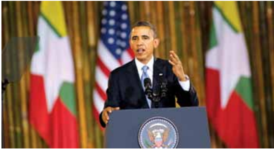
ရန်ကုန်တက္ကသိုလ်တွင် သမိုင်းဝင်မိန့်ခွန်းပြောနေသည့် သမ္မတ အိုဘားမား

မြန်မာနိုင်ငံ၏ ပြုပြင်ပြောင်းလဲမှု သတင်းများကြောင့် ပြည်ပမှလာရောက်သော ဧည့်သည်အရေအတွက်မှာ ယခုနှစ်ခရီးသွားရာသီတွင် ၂၀၁၁ ခုနှစ်ကထက် ၅၀ ရာခိုင်နှုန်းခန့်မြင့်တက်လာပြီး လာမည့် ၂၀၁၃ နှင့် ၂၀၁၄ ခုနှစ်များအတွင်း အရှေ့တောင်အာရှ