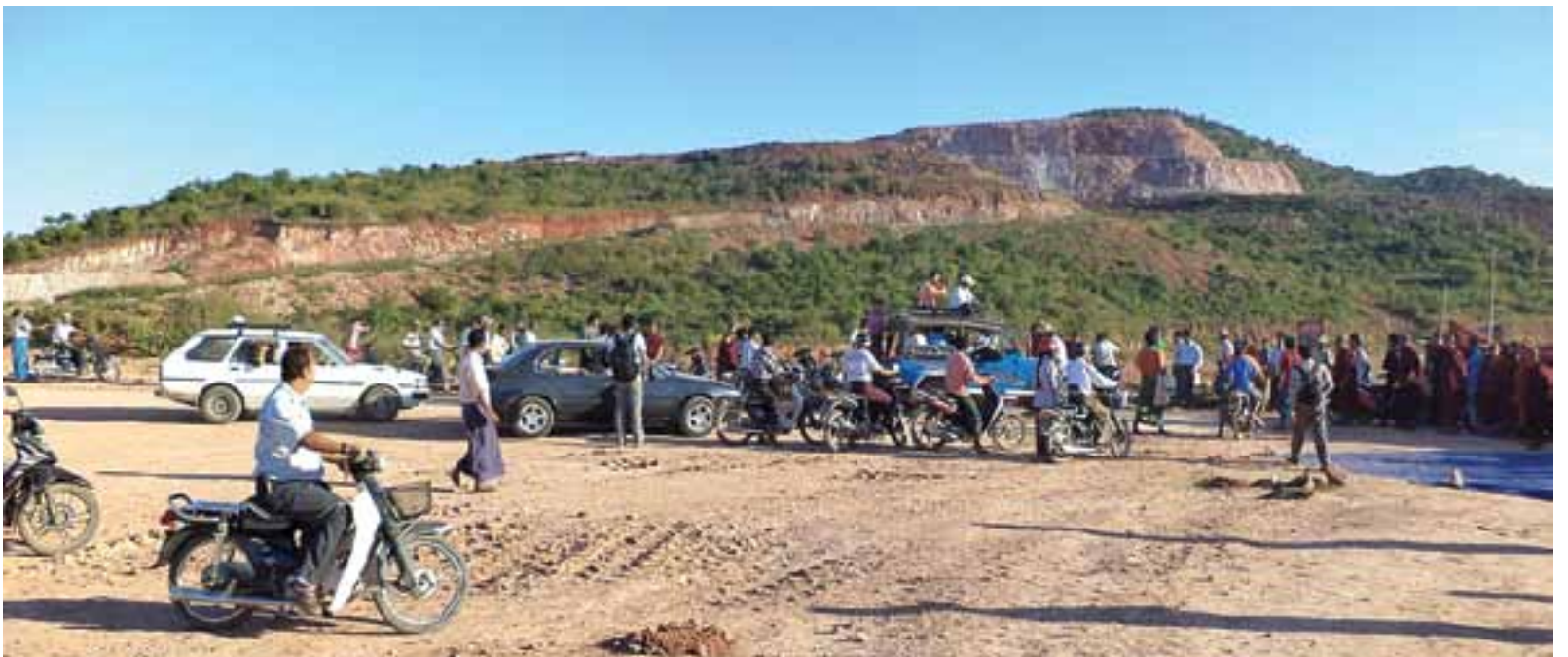
လက်ပန်းတောင်းတောင်ကြေးနီစီမံကိန်း အတွင်းပိုင်းကို နိုဝင်ဘာ ၂၅ ရက်ကတွေ့ရစဉ်

လက်ပန်းတောင်းတောင် ကြေးနီစီမံကိန်းအတွင်းရှိ ရွှေ့ပြောင်းရမည့် ဒေသခံများကို စာနာနားလည် အားပေးရန် နိုဝင်ဘာ ၂၉ ရက်တွင် သွားရောက်မည်ဖြစ်ကြောင်း စာ(၁၂)သို့