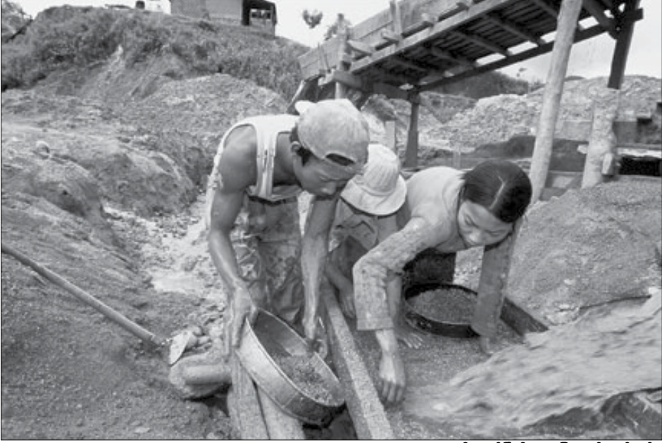
မိုးကုတ်မြို့ရှိ ပတ္တမြားလုပ်ကွက်တစ်ခု

နောက်တစ်နေ့မှ ခုနစ်ရက် အတွင်း လက်မှတ်ရေးထိုး၍ ဥပဒေအဖြစ် ထုတ်ပြန်ကြေညာရမည်။ လက်မှတ်ရေးထိုးခြင်း မပြုလျှင် သတ်မှတ်ကာလ ပြည့်မြောက်သည့်နေ့တွင် ဥပဒေကြမ်းသည် သမ္မတလက်မှတ်ရေးထိုးချက်ကို ရရှိပြီးသကဲ့သို့ ဥပဒေဖြစ်လာရမည်ဟု ပြဋ္ဌာန်းထားသည်။