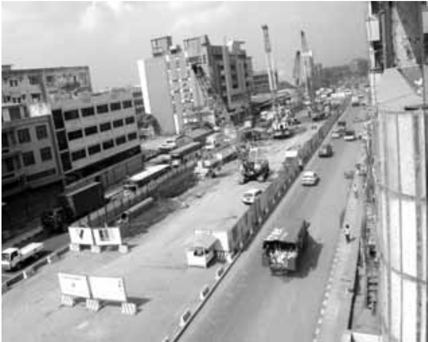
ဆောက်လုပ်ဆဲ ဘုရင့်နောင်ခုံးကျော်တံတား

ဘုရင့်နောင်နှင့် ဘူတာရုံလမ်းဘက်ကို ကူးပေးမည့်အပေါ်ထပ်