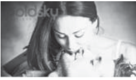
ဘဝကို ပိုင်ဆိုင်လာပေမည်။ Things To Remember When You Date a Strong Woman ကို ဘာသာပြန်ဆိုပါသည်။

အတူတူလုပ်ကိုင်ပေးပါ။ သင့်ကို သူမဘဝ၏ လက်တွဲဖော်တစ်ယောက်ဟု မြင်ယောင်လာပေမည်။ ထက်မြက်သော မိန်းကလေးများတွင် အတူယူစရာ အချက်တစ်ချက်ရှိသည်။ သူတို့ချင်းတွေ့လျှင် ‘အတင်းအဖျင်း’ လုံးဝမပြောပါ။ စီးပွားရေးတိုးတက်ဖို့ မည်သို့ဆောင်ရွက်ရမည်၊ မည်သူကို ကူညီရမည်ဆိုသည်ကို ဆွေးနွေးကြသည်။ မိမိကိုယ် မိမိ တန်ဖိုးကြီးသူဟု တွေးထင်ကြသည်။ သူတို့၏ အမြင်ကိုသာ မှန်သည်ဟုထင်ကြသည်။ တစ်ယောက်တည်း အရာရာကို ရင်ဆိုင်ခဲ့ကြသည်။ အထက်ပါအချက်များကြောင့် သူမကို မာနကြီးသူ၊ တစ်ကိုယ်ကောင်းဆန်သူ၊ အေးစက်လွန်းသူဟု မထင်ပါနှင့်။ သူမသင့်ကို ယုံကြည်လျှင် သူမအကြောင်းများကို ပြောပြပေးလိမ့်မည်။ သင်သေချာမှတ်သားထားပြီး သူမကို အစွမ်းကုန်ချစ်ပြလိုက်ပါ။ သူမနှင့်သင် ပိုပြီးသံယောဇဉ်ရှိလာပြီး မျှော်ရှင်သော