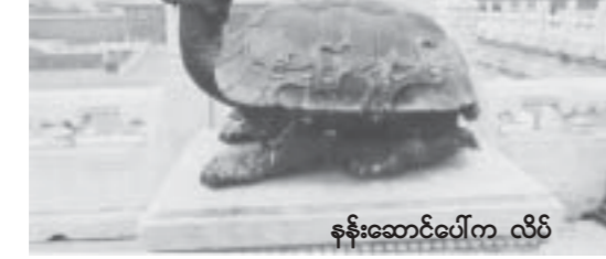
နန်းဆောင်ပေါ်က လိပ်

ကာကွယ်ဖို့အတွက် မိုးကာပလတ်စတစ်စများနဲ့ အုပ်ထားပါတယ်။ ကျွန်တော်တို့ရဲ့ လမ်းပြကလေးမလေးကို ရုပ်ရှင်ထဲမှာပါတဲ့ နန်းဆောင်တွေက သစ်လွင်ပြီး ဒီတကယ့်နန်းဆောင်အစစ်တွေဟာ ဘာလို့ဟောင်းနေတာလဲလို့ မေးကြည့်ပါတယ်။ ဒီကလေးမရဲ့ အဖြေက ဒီနန်းဆောင်အစစ်တွေထဲမှာ ရုပ်ရှင်ရိုက်ကူးခွင့်မရှိပါဘူးတဲ့။ ရုပ်ရှင်ထဲမှာပါတဲ့ နန်းဆောင်တွေက စတူဒီယိုထဲမှာ အသစ်ဆောက်ထားတဲ့ နန်းဆောင်တွေသာ ဖြစ်ပါတယ်တဲ့။ ဒါကြောင့် အဲဒီနန်းဆောင်တွေရဲ့ နောက်မှာ တောင်တန်းတွေ ပါနေတာကိုး။ တားမြစ်မြို့တော်ရဲ့ သက်တမ်းဟာ ၁၅ ရာစုနှစ်ကစခဲ့တာ ခုဆိုရင် နှစ်ပေါင်း ၅၀၀ ကျော်ပါပြီ။ အများပြည်သူအတွက် ပြတိုက်အဖြစ် ဖွင့်လှစ်ပေးတာ ၁၉၂၃ ခုနှစ်ကတည်းက ပါတဲ့။