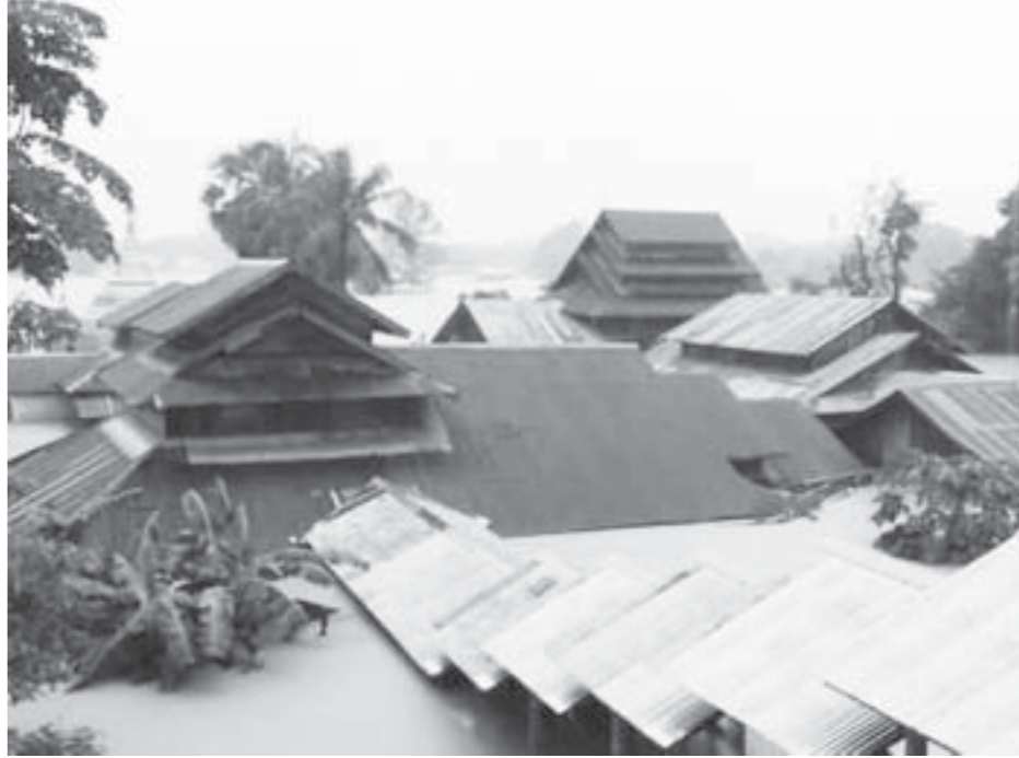
အောင်စေလျာ

အချို့ပြုပျက်ခြင်း၊ သစ်ပင်နှင့် ဓာတ်တိုင်များလဲခြင်းများ ဖြစ်ပွားခဲ့သည်။ ပဲခူးတိုင်းဒေသကြီး တောင်ငူခရိုင် ကျောက်ကြီးမြို့နယ်တွင်လည်း မုန်းချောင်းရေလျှံသည့်အတွက် မုန်း-အုတ်ဖြတ်လမ်းပေါ်ရှိ တံတားပေါ်ထိ ရေလွှမ်းမိုးမှုဖြစ်ပေါ်ခဲ့သည်။ မိုးလေဝသနှင့် ဇလဗေဒညွှန်ကြားမှုဦးစီးဌာန၏ သတင်းထုတ်ပြန်ချက်အရ ဇွန် ၂၇ရက်တွင် ရခိုင်