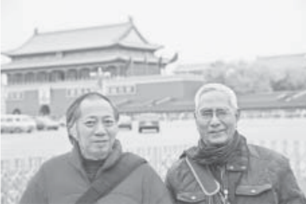
ထွန်အန်မင်မှခံဦးအဆောင်ရှေ့မှာ ညီပုလေးနှင့် ညီစေမင်း

အဆောင်တစ်ခုနဲ့တစ်ခုကြား ကွက်လပ်ထောင့်မှာ အဆင့်မြင့်အိမ်သာတွေ ထားရှိပေးပါတယ်။ ကျန်းမာရေးအတွက် အရေးပေါ်သွားလာချင်ရင် အခက်အခဲမရှိတော့ပါ။ အခကြေးငွေ ပေးစရာမလိုပါ။ နန်းဆောင်ကြီးတွေရဲ့ တစ်ဖက်တစ်ချက်မှာ မင်းညီမင်းသားများနဲ့ မိဖုရားများအတွက် သီးသန့်အဆောင်တွေရှိပါတယ်။ နန်းဆောင်တစ်ခုရဲ့ အတက်လှေကားနှစ်စင်းရဲ့ အလယ်မှာ ကျောက်ဆစ် ပန်းပုလက်ရာများနဲ့ မွမ်းမံထားပါတယ်။ ဒါပေမဲ့ မတော်တဆ ထိခိုက်မှုက