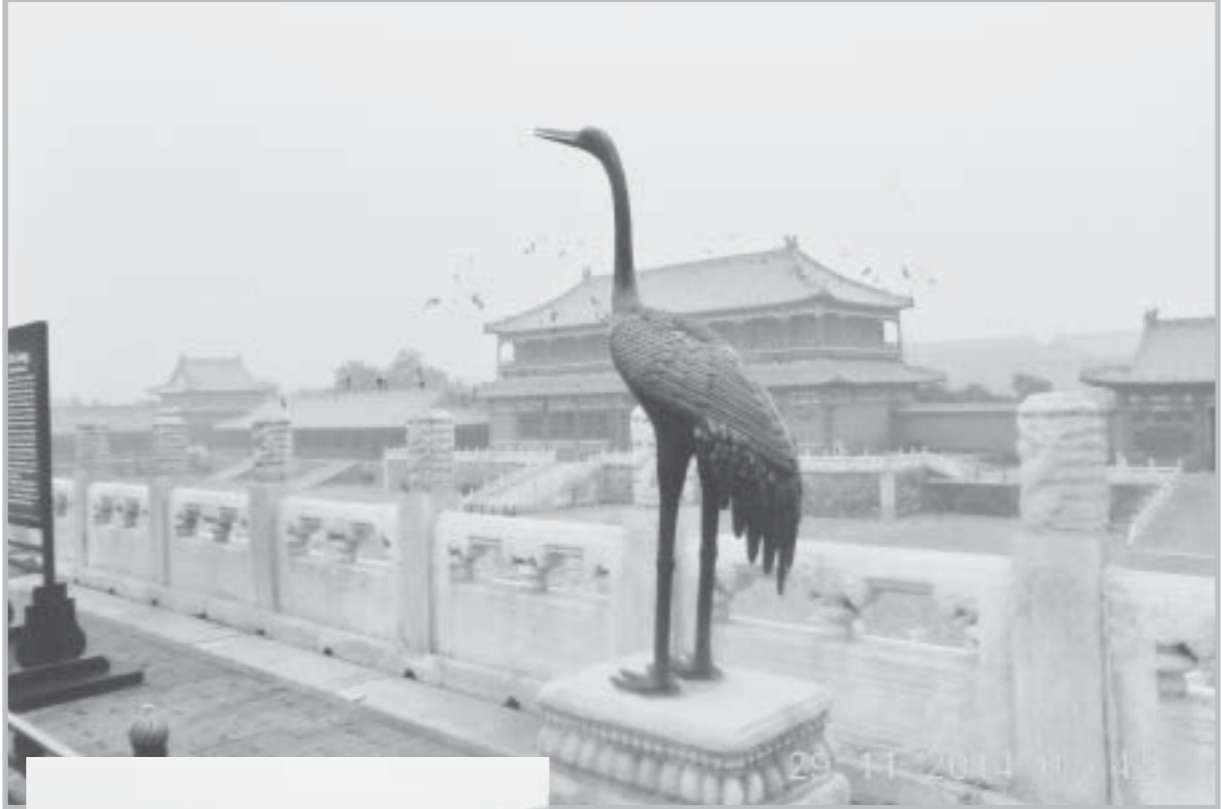
နန်းဆောင်ပေါ်က ကြိုကြွ