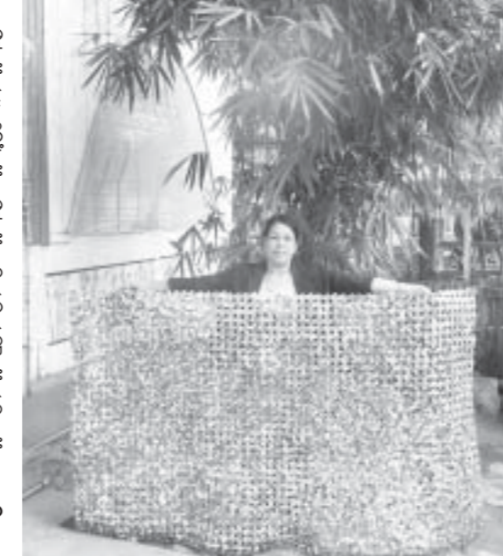
အောင်စေလျာ

အားစုဆောင်း၍ ကိုယ်တိုင်လှည့်၊ အိမ်သုံးလက်မှုပစ္စည်းများအဖြစ် ဒီဇိုင်းပုံဖော်ရက်လုပ်ပြီးမင်းကွန်းတွင် မင်းဧကရီလက်မှုလုပ်ငန်း အမည်ဖြင့် အရောင်းပြခန်းဖွင့်လှစ်ထားခဲ့သည်။ မင်းကွန်းသို့ လာရောက်သည့် ပြည်တွင်း ပြည်ပဧည့်သည်များ ဝင်ရောက်လေ့လာကြည့်ရှုသည့်အပြင် ဝယ်ယူမှုရှိခဲ့သည်။ ၎င်းအနေဖြင့် စွန့်ပစ်ပစ္စည်းများအား လူသုံးကုန်ပစ္စည်းအဖြစ်ပြုလုပ်ရခြင်းမှာ သဘာဝပတ်ဝန်းကျင်ထိန်းသိမ်းသည့်အနေဖြင့် ထုတ်လုပ်ခြင်းဖြစ်သည့်အပြင် ပြည်တွင်းနေရာအနှံ့အပြား၌ ရှိသည့် စွန့်ပစ်ပစ္စည်းများမှ ဈေးကွက်အတွင်း ရောင်းချနိုင်သည့် လူသုံးကုန်ပစ္စည်းများအဖြစ် အများပြည်သူသိရှိစေလိုသဖြင့် ထုတ်လုပ်ရခြင်းဖြစ်ကြောင်း သိရသည်။