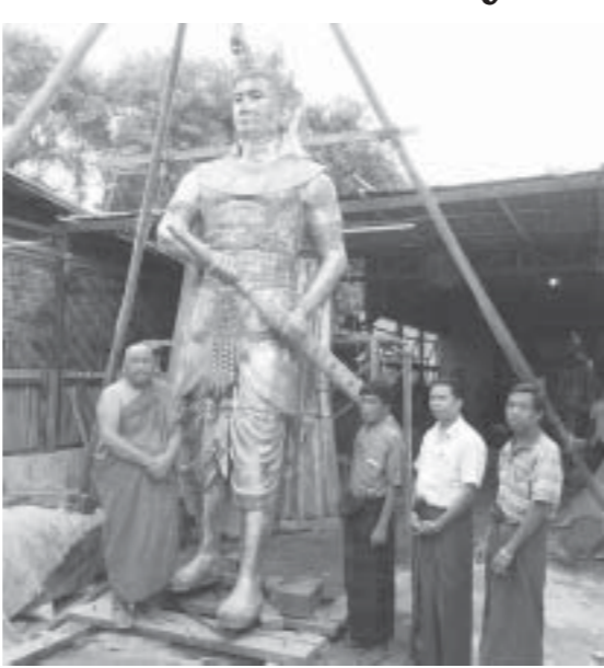
အောင်စေလျာ

စစ်ကိုင်းမြို့၊ ပန်းဘဲတန်းရပ်၊ အိုးကြီးလမ်းဆုံ အပိုင်းနေရာတွင် စိုက်ထူထားရှိမည့် စစ်ကိုင်းမြို့တည်နန်းတည် အနှစ်(၇၀၀)ပြည့် အထိမ်းအမှတ် အသင်္ခယာစောယွန်းမင်း ကြေးသွန်းရုပ်တုကြီးပြုလုပ်နေသည့် မန္တလေး၊ တမ္ပဝတီရပ် ပြည်ဝကြေးသွန်းလုပ်ငန်းခွင်ရှိ လုပ်ငန်း ဆောင်ရွက်မှုများကို သီတဂူကမ္ဘာ့ဗုဒ္ဓတက္ကသိုလ် အဓိပတိ သီတဂူဆရာတော်ကြီးသည် ဇွန် ၂၇ရက်က ကြွရောက်ကြည့်ရှုပြီး အကြံပြုလမ်းညွှန်အားပေးသွားကြောင်း သိရသည်။