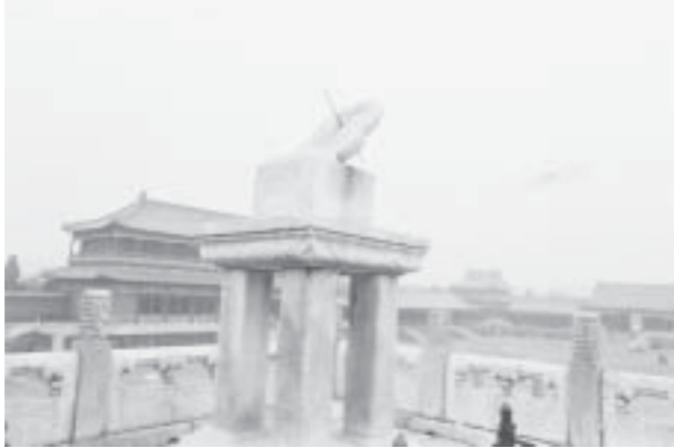
နန်းဆောင်ပေါ်က နေရာရီ

မန္တလေးနန်းတော်ကြီးကို ၁၈၅၅ ခု နိုဝင်ဘာ ၂၈ ရက်နေ့ကတည်းက ဗြိတိသျှစစ်သားတွေ သိမ်းပိုက်ခဲ့တာ နှစ်ပေါင်း ၁၃၀ နီးပါးရှိပါပြီ။ ဗြိတိသျှတပ်တွေဟာ ဒီနန်းတွင်းမှာ အခြေစိုက်ပြီး အထက်မြန်မာပြည်က မျိုးချစ်တော်လှန်ရေးတပ်တွေကို နှိမ်နင်းခဲ့ကြတယ်။ နန်းတွင်းထဲမှာပဲ အကျဉ်းထောင်ကြီးတိုးချဲ့ဆောက်ပြီး မျိုးချစ်များကို ထောင်သွင်းအကျဉ်းချခဲ့ကြတယ်။ ဒုတိယကမ္ဘာစစ်ကြီး မြန်မာပြည်ကို ကူးစက်လာတဲ့အခါ ၁၉၄၅ မှာ ဂျပန်တွေဟာ မန္တလေး နန်းတွင်းမှာ ချန်ကေရိုက်နဲ့ သူ့ဇနီးရောက်ရှိနေတယ်လို့ သတင်းရတဲ့အတွက် မန္တလေး နန်းတွင်းကို ဗုံးကြဲတိုက်ခိုက်ခဲ့တယ်။ ဒါကြောင့် မြန်မာ့ယဉ်ကျေးမှုအဆောက်အအုံတွေ တော်တော်များများ ပျက်စီးခဲ့ရတယ်။