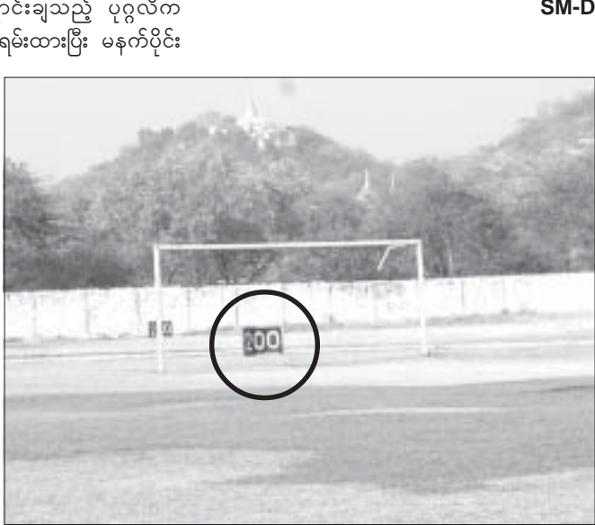
ကွင်းထဲ၌ ရိုက်ချက်အကွာအဝေးပြ ကိန်းဂဏန်းအမှတ်အသား