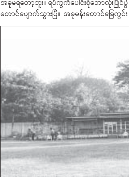
လူထုအားကစားမှ လူတစ်စုအားကစားသို့... ဂေါက်ရိုက်လေ့ကျင့်နေသူများ

မန်းတောင်ခြေ အားကစားကွင်းကို ဂေါက်သီးရိုက်ပစ္စည်းများ ရောင်းချသည့် ပုဂ္ဂလိကလုပ်ငန်းရှင်တစ်ဦးကငှားရမ်းထားပြီး မနက်ပိုင်း