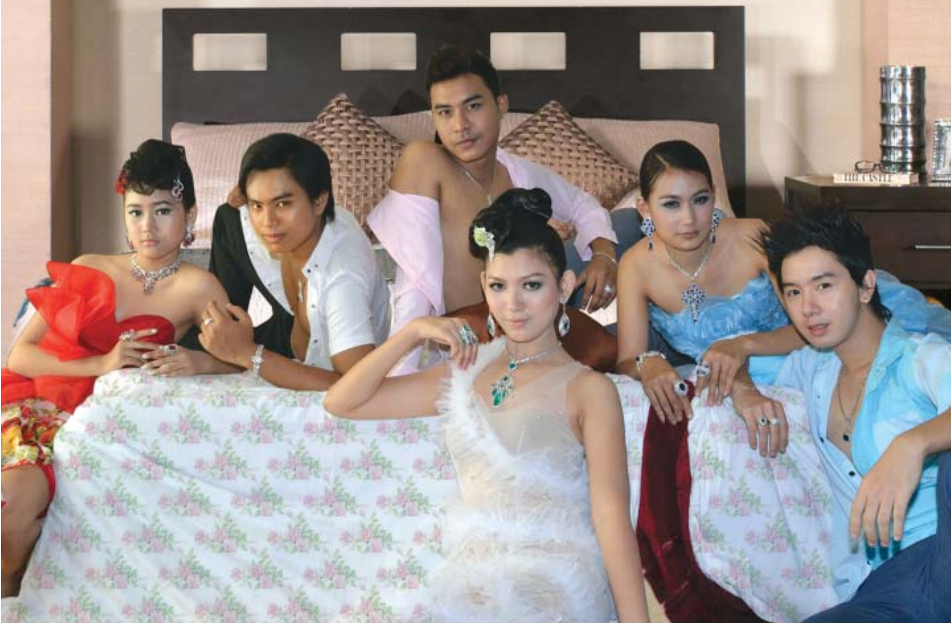
မော်ဒယ်-ဒီဂျေတီး၊ ထက်ဝန်းနိုင်၊ ကျော်သက်စိုး၊ သိမ့်သိမ့်၊ ယွန်းဟိုဟိုကျော်၊ နှင်းသန်းဝတ်၊ မိတ်ကပ်-ဘိုဘိုနီ(မိုးကုတ်)၊ ဝတ်စုံ- Zay Zay (MDY)၊ မိတ်ပုံ-ဇရာအောင်သန်း