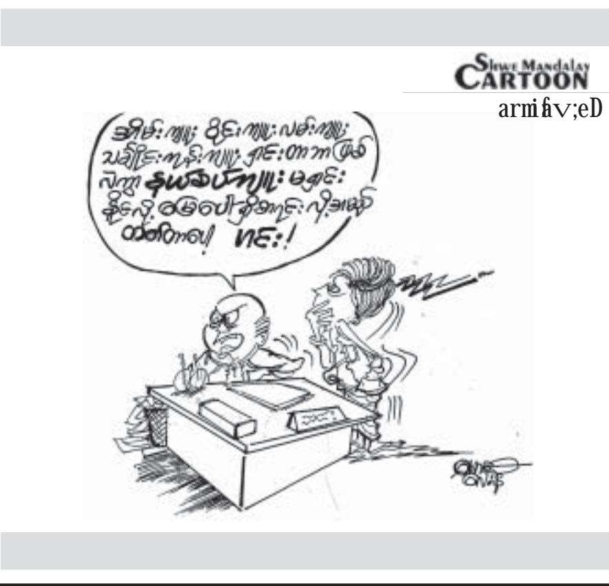
Sinar Masday CARTOON armi&v;eD

အီးယူခေါင်းဆောင်များသည် ရုရှားက ခရိုင်းမီးယားကို ကျူးကျော်ဝင်ရောက်ပြီးနောက် ယူကရိန်းကို ထောက်ခံသည့်အနေဖြင့် အနီးကပ်ဆက်ဆံမှုများပြုလုပ်ရန် သဘောတူစာချုပ်လက်မှတ်ရေးထိုးလိုက်သည်ဟု ၂၀-၃-၁၄ ရက် ဘီဘီစီသတင်းမှတ်ပေးပြသည်။ ယူကရိန်း ကြားဖြတ် ဝန်ကြီးချုပ်နှင့် အီးယူခေါင်းဆောင်များက ဘရက်ဆဲလ်မြို့တွင် ယင်းစာချုပ်ကို လက်မှတ်ရေးထိုးလိုက်ခြင်းဖြစ်သည်။ ရုရှားကိုထောက်ခံသည့် သမ္မတယာနုကိုဗစ်က အဆိုပါ သဘောတူညီချက်ကို ပယ်ဖျက်ခဲ့သဖြင့် နိုင်ငံတွင်းမှာ သွေးစွန်းဆန္ဒပြပွဲများဖြစ်ခဲ့ပြီး ဝင်းသည်လည်း ရုရှားမှစွန့်ခွာခဲ့ရကာ ခရိုင်းမီးယားကိုလည်း ရာထူးက ထိန်းချုပ်သွားခဲ့သည်။ မတ်၂၅ ရက်က ရုရှားအထက်လွှတ်တော်က ခရိုင်းမီးယားကို ရုရှားဖက်ဒရေရှင်းသို့ဝင်ရောက်ရေး စာချုပ်ကို တစ်သမတ်တည်းလက်ခံခဲ့သည်။ အီးယူအဖွဲ့နှင့် ချုပ်ဆိုလိုက်သည့် စာချုပ်အရ အီးယူသည် ယူကရိန်းကြားဖြတ်အစိုးရအား