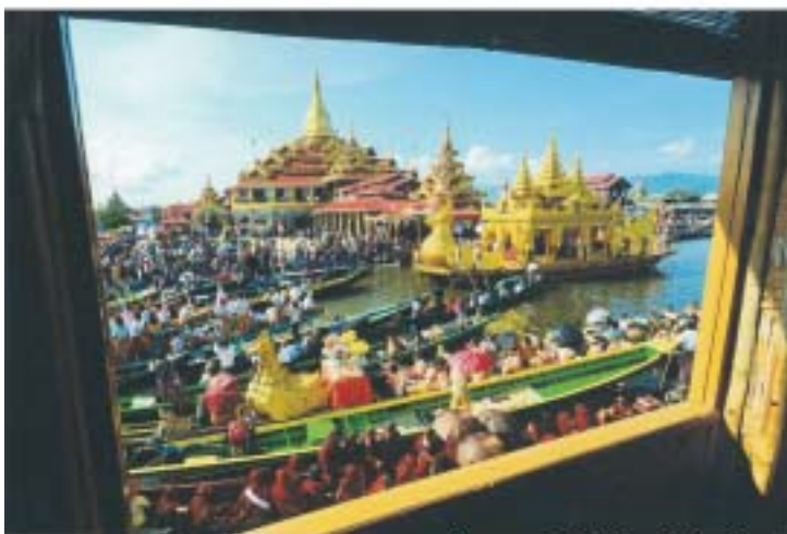
ဒုတိယသုရ ဝဂ္ဂနိက္ခိယျာဏ်၏ လက်ရာ

1,672 Colour Pages | 500 over Business Headings | 6,902 Advertisements | 45,000 over Listings | Map & Guides