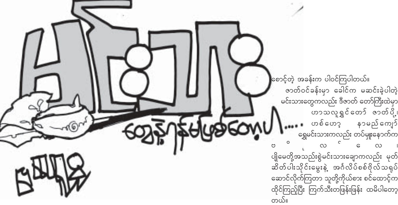
အစောင့်တဲ့ အခန်းက ပါဝင်ကြပါတယ်။

နာမည်ကျော်မင်းသားတစ်ယောက်ကတော့ နှစ်ပါးသွားတောင် မကနိုင်တော့ဘဲ စင်ပေါ်ကနေ နာမည်တပ် ပြောင်ပြောင်ဆဲတဲ့ အထိပါ။ (တကယ်တော့ သူ့ဆဲချင်တာ တခြားစာရေးသူတစ်ယောက်ကြားက လည်တဲ့သူက ကိုယ့်နာမည်သွားပြောတော့ မှားဆဲတာဆိုပါစို့။ ထားပါတော့ ပြီးတာတွေ