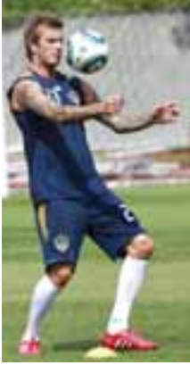
e, la, muF puwivim-4

အမေရိကန် မေဂျာလိဂ် ဘောလုံး ဖြိုင်ပွဲဝင် အယ်လ်အေဂလက်ဇီ အသင်း၏ အင်္ဂလန်ကစားသမား ဒေးဗစ်ဘက်ခမ်းက ၎င်းသည် လာမည့်တင်တင်ဘာ ၁၀ ရက်တွင် ကစားမည့် ကိုလံဘတ်စ်ကွန်အသင်းနှင့်ပွဲ၌ အသင်းအတွက်