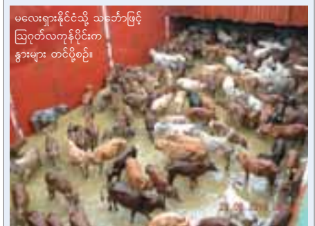
မလေးရှားနိုင်ငံသို့ သင်္ဘောဖြင့် ဩဂုတ်လကုန်ပိုင်းက နွားများ တင်ပို့စဉ်။ ကုန်သွယ်ရေးမူဝါဒကောင်စီက ဆိတ်ကောင်ရေငါးသောင်းနှင့် နွားကောင်ရေတစ်သောင်း တင်ပို့ခွင့်ပြုထားရာ ဩဂုတ်လကုန်အထိ ဆိတ်၊ သိုး၊ နွားအကောင်ရေ ငါးထောင်ကျော်ကို Y.E.S & Freight Forwarding & General Services မှ မလေးရှားနိုင်ငံသို့တင်ပို့ခဲ့သည်။ ဆိတ်၊ သိုး၊ နွားတင်ပို့မှုကို ၂၀၀၈ ဩဂုတ်မှ စတင်ခဲ့ပြီး စုစုပေါင်းကောင်ရေ ငါးသောင်းကျော်တင်ပို့ပြီးဖြစ်ကြောင်း အဆိုပါ ကုမ္ပဏီမှတာဝန်ရှိသူက ပြောသည်။ ausmbD

မှတ်ရေးထိုးစေခဲ့သည်ဟု သိရသည်။ သို့သော် လတ်တလော၌ ယင်းသတ်မှတ်ချက်အတိုင်း တင်ဆောင်ရန် စတင်မည့်အချိန်ကို မသိရသေး၍ လုပ်ငန်းရှင်များက စောင့်ကြည့်လျက်ရှိကြသည်။ ယင်းသို့ တင်ဆောင်လာရပါက တန်ဆာခများမြင့်တက်လာလျှင် အဓိကကျသော ကုန်စည်တင်ဆောင်သူများ၏ ကုန်ကျစရိတ်ပိုလာသလို ကုန်ပစ္စည်းများ ဈေးနှုန်းများမှာလည်း သိသာစွာ မြင့်တက်လာမည်ဖြစ်ကြောင်း သိရသည်။