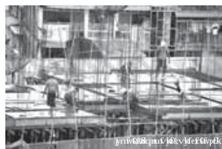
ပြည်ပလုပ်ငန်းတွေ ဝင်လာမယ်။ ဆောက်လုပ်ရေးလုပ်ငန်းကလည်း ဖွံ့ဖြိုးလာမယ်။ ကန်ထရိုက်မြေရှင် ပြဿနာ၊ အလုပ်ရှင် အလုပ်