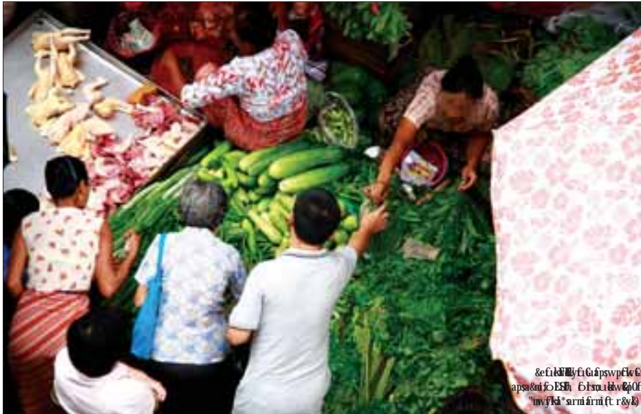
&e f k v D k f v : x D i f k f v k f n E S f r k v D y f i g z , e M k v f r k v k f n f r k v D n f y q , f v m 0 , f n f b u k x n f i y ; a e & i f u u l e f u d j c P a e m f v h j y m a w m h a c j f r n d f v k f y o n f o y q , f b k y f n f e w m u k u n f i f D r k o r D a p s a & m i f v m a p w e m y g v , f k u k f m o m r s f c s u f i a v ; c r o n f t c k p s o n f i v u y q , f q k y p v v f k n f i y ; w w f u w m u k u l e f i r i f i x m ; o n f i v /

ကျွန်မဘေးနားမှာ မုန့်ထိုင်စားနေ သည့် မိန်းမက “ပေါက်လို့လား၊ ဘယ်လောက်ဖူးလဲ” ဟု မေးလိုက် တော့ မုန့်တီသည်က ဝမ်းသာ အားရအသံနဲ့ “ကျွန်မပေါက်တာ မဟုတ်ဘူး။ ရွာတန်းရှည်က လူ တွေပေါက်ကြတာ။ ပေါက်ကြပါ စေ၊ ပေါက်ကြပါစေ။ ဒိုင်ကတော့ လျော်ပေတော့ပဲ” “ဘယ်ကရတာလဲ၊ ဘိုးတော်ပေးတာလား” “မဟုတ်ဘူး။ တစ်ယောက် စီက တစ်လုံးကောင်းတွေကိုရပြီး သူတို့ဘာသာရတဲ့ကြတာ။ ကြာ ပြီ။ သူတို့လုပ်နေကြတာ။ ဒီတစ် ချီတော့ မိသွားပြီ” မုန့်တီသည် မိန်းမက ခြေ