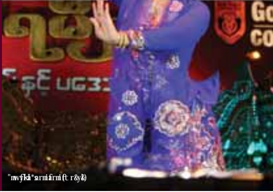
"mvfkl" sarmim (t r & k)