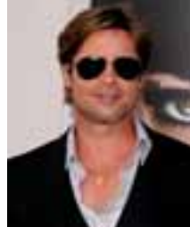
မင်းသားထံမှ အိမ်လက် ဆောင်ရခဲ့သည့် မစ္စမယ်လာ

ဩဂုတ် - ၃၀ ဟော့လီဝုဒ်၏ သန်းကြွယ်သူဌေး မင်းသား ဘရက်ပစ်သည် ပြီးခဲ့ သည့်အပတ်က နယူးအော်လင်း မြို့သို့သွားစဉ် အမျိုးသမီးတစ်ဦး အား အိမ်တစ်လုံးလက်ဆောင် ဝယ်ပေးခဲ့ကြောင်း သိရသည်။ မင်းသားသည် နယူးအော်လင်း သို့ ဟာရီကိုန်းမုန်တိုင်း ကတ် ထရီနာ ငါးနှစ်ပြည့်နှစ်ပတ်လည် အဖြစ်ရောက်ရှိနေခြင်းဖြစ်သည်။