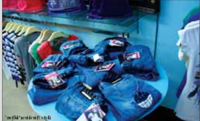
"mvfka"aruaiait r & y k

t j l v f f &e f k v p u v i f m - 4 ခေတ်တွေ ဘယ်လိုပြောင်းပြောင်း မရှိနိုင်အောင် ကြိုက်ကြတဲ့ အ ဝတ်အစားထဲမှာ ‘ဂျင်း’ ဆိုတာ ကတော့ ဘယ်ခေတ်ဘယ်ကာလ ပဲဖြစ်ဖြစ် လူငယ်အားလုံးရဲ့ အ သည်းစွဲပါ။ ဝတ် ရတာလည်း သက် သောင့်သက်သာရှိ ဖက်ရှင်လည်း ကျတဲ့အတွက် ဂျင်းအဝတ်အ ထည်တွေထဲကမှ ဘောင်းဘီဆို ရင်တော့ ဘယ်တော့မှမရှိနိုင်ဘဲ နှစ်သက်ကြပါတယ်။ ဖက် ရှင် ရေစီးကြောင်းက တစ်နေ့ထက်တစ်နေ့ ပြောင်းလဲ လာရာမှာ ကိုယ်ခန္ဓာကို သွယ်လျ သွားစေတယ်လို့ ထင်ရတဲ့ ဂျင်း ဘောင်းဘီတွေကို မိန်းမကလေး တွေရွေးချယ်ဝယ်ယူလာကြတာ ကိုက ဒီနေ့ခေတ်ရဲ့ ဖက်ရှင်လို့ပင် ဆိုနိုင်ပါတယ်။ ခေတ်ရဲ့ ဖက်ရှင်နဲ့လည်း လိုက်ဖက်၊ အရည်အသွေးလည်း