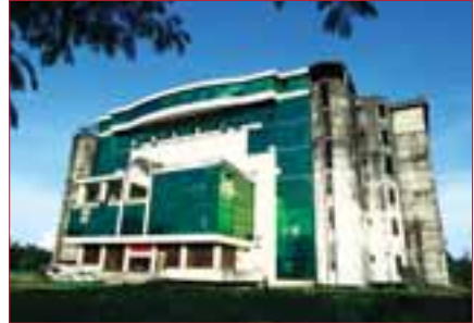
အမျိုးသားစာကြည့်တိုက်ကို စက်တင်ဘာလဆန်းကတွေ့ရခဲ့ပြီး

ရန်ကုန်၊ စက်တင်ဘာ-၄ တာမေ့မြို့နယ်၊ လေးထောင့်ကန်လမ်းမပေါ်နှင့် အရှေ့မြင်းပြိုင်ကွင်း လမ်းမပေါ်တွင်တည်ရှိသော ဆောက်လုပ်ပြီးစီးခြင်း မရှိခဲ့သည့် အမျိုးသားစာကြည့်တိုက် အဆောက်အအုံဟောင်းအား Asia Tiger Services Co., Ltd. မှ ပုဂ္ဂလိကဆေးရုံကြီးအဖြစ် ဆောက်လုပ်ရန် စီးပွားရေးဦးပိုင်လီမိတက်ထံမှ ငှားရမ်းထားပြီးဖြစ်ကြောင်း ယင်း ကုမ္ပဏီ၏ ဥက္ကဋ္ဌဦးဇော်မင်းအေးက 7 Day News သို့ပြောသည်။ လွန်ခဲ့သော ဆယ်စုနှစ်ဝန်းကျင်ကတည်းက စတင်ဆောက်လုပ် ခဲ့သော အဆိုပါအမျိုးသားစာကြည့်တိုက်အဆောက်အအုံအား Asia Tiger Services Co., Ltd. မှ ပုဂ္ဂလိကဆေးရုံအဖြစ် ဆောက်လုပ်ရန်အ တွက် အဆောက်အအုံဒီဇိုင်းများ ရေးဆွဲမှုအပြီးသတ်လုပ်ငန်းပြီးဖြစ်နေ ပြီဖြစ်ကြောင်း အထက်ပါတာဝန်ရှိသူကပြောသည်။