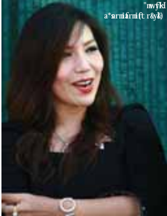
"mvfkl" sarmim (t r & k)

လတ်တလောက “ဘရက်က ကျွန်မ ကိုလိုအပ်တာရှိသလားလို့ မေးခဲ့ပါတယ်။ သူဟာ လိုတာ ထက်ပိုပြီး ကူညီခဲ့သူပါ။ သူ့ရဲ့ Make It Right ဖောင်ဒေးရှင်း သာ မရှိရင် ကျွန်မတို့လည်း ရှိနိုင် မှာ မဟုတ်ပါဘူး”ဟု ရေဒါအွန် လိုင်းသို့ပြောသည်။ ဘရက်ပစ်၏ ယင်းဖောင်ဒေးရှင်းသည် နယူး အော်လင်း ပြည်သူများကို အကူ အညီပေးနေသော အဖွဲ့တစ်ဖွဲ့- ဖြစ်သည်။ —Ref: Showbiz