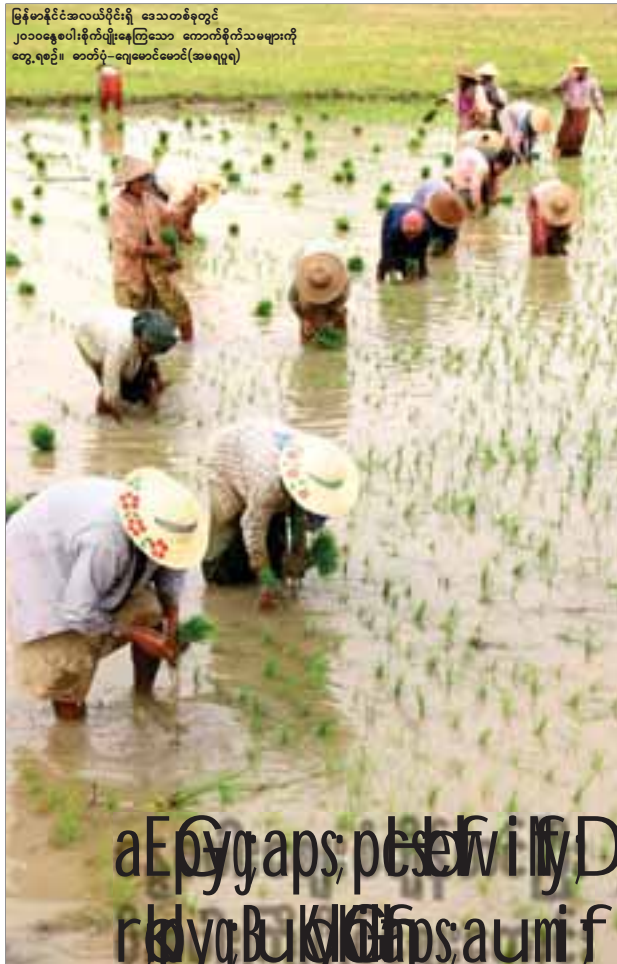
မြန်မာနိုင်ငံအလယ်ပိုင်းရှိ ဒေသတစ်ခုတွင် ၂၀၁၀ခုနှစ်ပေါင်းစုံကမ်းခြေကြည့်ခန်းက အထက်ပိုင်းသမားများကို တွေ့ရခဲ့ပြီး