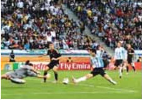
AtEkt: &pf puwivim-4

တောင် အမေရိကထိပ်သီးအာဂျင်တီးနားအသင်းသည် ကမ္ဘာ့အုပ်စုပီပီစီ ဝန်အသင်းနှင့် ချစ်ကြည်ရေးခြေစမ်းပွဲကစားပြီးနောက် ဘရာဇီးတွင် ကျင်းပမည့် ၂၀၁၄ ကမ္ဘာ့ဖလားဖြိုင်ပွဲမတိုင်ခင်အထိ ဥရောပထိပ်သီးအသင်းများကို တောင်အမေရိကခြေသို့ ခေါ်ယူခြေစမ်းပွဲများအဖြစ် ၂၀၁၄ အထိအာဂျင်တီးနားနှင့် ဘရာဇီးတို့တွင် ကစားရန် စီစဉ်နေကြောင်း ဆိုသည်။