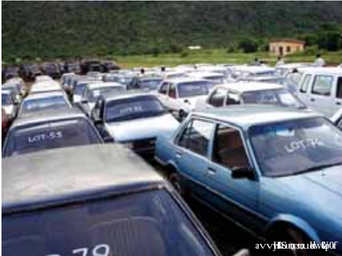
avvbt mi fíomapsEbfsm;rG

ရေအလုံးပေါင်း ၄ မန္တလေးမြို့တွင် စက်တင်ဘာလ ဆန်းပိုင်းက နှစ်ရက်အတွင်း ယာဉ် အစီးရေ ၇၀၀ကျော်ကို လေလံ တင်ရောင်းချခဲ့ကြောင်း ကိုယ်တိုင် လေလံဝင်ဆွဲခဲ့သော စီးပွားရေး လုပ်ငန်းရှင်များက ပြောသည်။ မန္တလေးတိုင်းဒေသကြီး ပုသိမ်ကြီးမြို့နယ် ပင်မယာဉ်သို လှောင်ရေးတပ်တွင် စက်တင်ဘာ ၂၅ နံရံတွင် မော်တော်ယာဉ် ၇၀၀စီး၊ ဆိုင်ကယ် ၁၂စီးနှင့် စက် ဘီး ၁၅စီးတို့ကို လေလံတင် ရောင်းချခဲ့ခြင်းဖြစ်သည်။