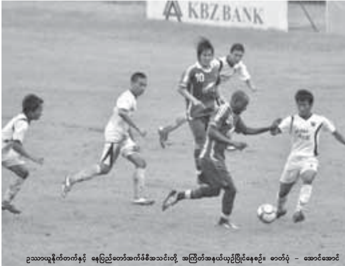
ဥသားယူနိုင်တတ်နှင့် နေပြည်တော်အင်မီအသင်းတို့ အကြိတ်အနယ်ယှဉ်ပြိုင်ပွဲနေ့စဉ်။ စက်တင် - အောင်အောင်

ပြီးခဲ့သည့် စက်တင်ဘာလ ၁ ရက်က အောင်ဆန်းကွင်းတွင် ယှဉ်ပြိုင်ခဲ့သည့် မြန်မာနိုင်ငံဘော လုံးအဖွဲ့ချုပ်ဖလား နှစ်ထွက်ပြိုင်ပွဲ တွင် ဥသားယူနိုင်တတ်အသင်း မှ တိုက်စစ်မှူး လစ်ပီလစ်ပီသည် ပွဲချိန် ၃၁ မိနစ်၌ ပယ်နယ်တီမှ တစ်ဆင့် နေပြည်တော်အသင်း ဘက်သို့ ဒုတိယဂိုးသွင်းယူပြီး နောက် ပြိုင်ဘက်အသင်းပရိသတ် များရွှေ့၍ အောင်ပွဲခံခဲ့ရာ နေပြည် တော်ပရိသတ်တစ်ဦးသည် ကွင်း အတွင်းသို့ပြေးဝင်လာပြီး ဥသား တိုက်စစ်မှူးအား အရာဝတ္ထု တစ်ခုဖြင့် ပစ်ပေါက်ရန် ကြိုး ပမ်းခဲ့ခြင်းဖြစ်သည်။ ထို့ကြောင့် ၎င်းကို တွင်းအတွင်းမှ တာဝန်