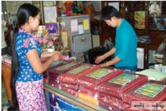
ဓာတ်ပုံ - သန်းဌေး