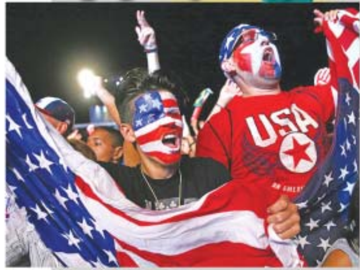
ဘရာဇီးလ်ကမ္ဘာ့ဖလားဘောလုံးပြိုင်ပွဲမှာ အမေရိကန်အသင်းကို တစ်ခဲနက် အားပေးနေသည့် ပရိသတ်များ။ အမေရိကန်နိုင်ငံက ဘောလုံးအားကစားကို ခုတ်ယူတန်စားအားကစားအဖြစ် သတ်မှတ်ထားပေးမယ့် ယခုနှစ် ဘရာဇီးလ်ကမ္ဘာ့ဖလားမှာတော့ အမေရိကန်နိုင်ငံသားအများစုက တစ်ခဲနက်အားပေးလာတာကို တွေ့ရပါတယ်။ ထိုအတူ အမေရိကန်အသင်းက မရတော့ပုံကနေစွဲထွက်ပြီး ဘလဲသင်း ပွဲထွက်အဆင့်ကို ရောက်ရှိကာ ခိုင်ခံ့စွာပေးပေးနေတဲ့ ဘလဲလ်ဂျီယံအသင်းနဲ့ ရင်ဆိုင်ရမှာဖြစ်ပါတယ်။