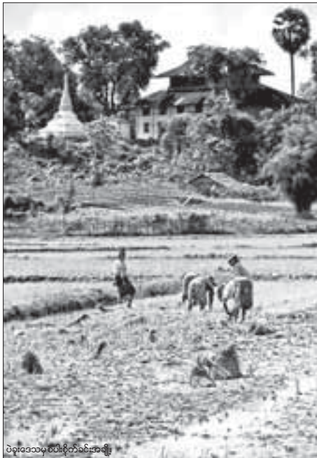
ပဲခူးဒေသမှ စပါးစိုက်ခင်းအချို့

ယင်းကဲ့သို့ ရေလွှမ်းမှုနှင့် ကြုံခဲ့ရသည့်အတွက် ငွေကြေးတတ်နိုင်သူများက ပြန်လည်စိုက်ပျိုးနိုင်သော်လည်း မတတ်နိုင်သူများက မိုးစပါးကိုလက်လွှတ်ခဲ့ရကြောင်း ထိပ်ပိတ်ရွာသား လယ်သမားဦးညွှန်ကျေးရွာရှင်းပြသည်။ ယခုနှစ်တွင် မြန်မာနိုင်ငံ၌