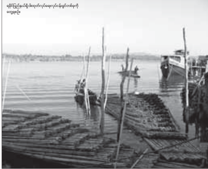
ရခိုင်ပြည်နယ်ရှိ ဝါးလုပ်ငန်းရေလုပ်ငန်းခွင်တစ်ခုကို တွေ့ရပုံ။ များမှ အများဆုံးဖြစ်ပြီး သစ်တောဦးစီးဌာနမှ ခွင့်ပြုချက်ရယူကာ ခုတ်ယူကြခြင်းဖြစ်သည်။ ဝါးခုတ်လုပ်ငန်းများ စတင်နေပြီဖြစ်သဖြင့် မောင်တောနယ်စပ်သို့ တောင်ဘဇာဒေသထွက် ဝါးများ ဝင်ရောက်နေပြီဖြစ်ပြီး ဘင်္ဂလားဒေ့ရှ်နိုင်ငံသို့ တင်ပို့ရန်လည်းဆင်နွှဲနေကြပြီဖြစ်ကြောင်း နှင့် ဝါးခုတ်ယူခြင်းနှင့် ကြိမ်များကိုလည်း တစ်ပါတည်း ထုတ်ယူကြကြောင်း သိရသည်။

မောင်က မောင်တော၊ စက်တင်ဘာ - ၀၇ ဇွန်လအတွင်းက မိုးသည်းထန်စွာရွာသွန်းမှုကြောင့် ရေကြီးခြင်း၊ ရေလျှံခြင်း၊ ရေစီးသန်ခြင်း စသည်တို့ကြောင့် ရပ်နားထားခဲ့သည့် ဝါးခုတ်လုပ်ငန်းများကို ယခုလမှ စတင်ကာပြန်လည်လုပ်ကိုင်နေကြပြန်ကြောင်း ဘူးသီးတောင်မြို့နယ် ဒေသခံတစ်ဦးက ပြောကြားသည်။ ဇွန်လအတွင်းက ဝါးခုတ်လုပ်ငန်းများ ရပ်ဆိုင်းခဲ့ရသည့်အတွက် ဘူးသီးတောင် ဝါးဆိပ်သို့ ဝါးများအဝင်နည်းကာ မောင်တောနယ်စပ်မှ ဘင်္ဂလားဒေ့ရှ်သို့ ဝါးတင်ပို့ရမှုမှာလည်း ဆိုင်းငံ့ထားခဲ့ရကြောင်း ဝါးကုန်သွယ်သူတစ်ဦးကဆိုသည်။ ဘူးသီးတောင်၊ မောင်တောနှင့် ဘင်္ဂလားဒေ့ရှ်ဈေးကွက်သို့ တင်ပို့နေရသည့်ဝါးများမှာ မေယုသစ်တောကြီးစိုင်း၊ စိုင်းဒင်ဝါးတောနှင့် တောင်ဘဇာဝါးတော