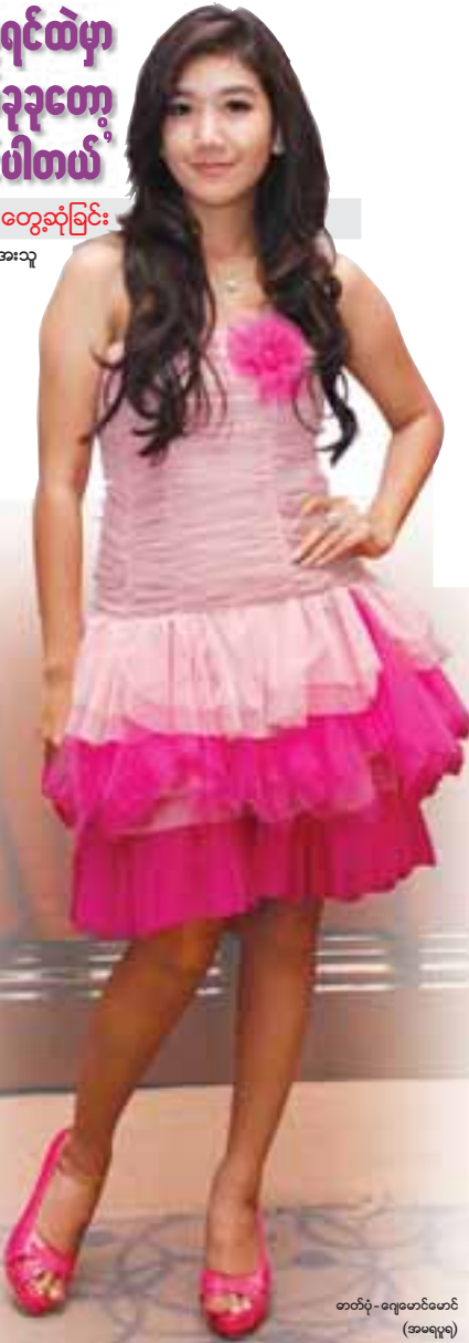
တတိန် - ဂျေမောင်မောင် (ဖေဖေရူ)