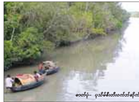
စတင်ပုံ- ပုသိမ်စီးတီးဝက်ဘ်ဆိုက်

ကျင်ထိန်းသိမ်းရေးလုပ်ဆောင်ပေးသည့် ကျွမ်းကျင်ပညာရှင်အချို့ကပြောသည်။ “ဒီဘက်မှာ စပါးစိုက်တော့ မြေငန့်ပြီး စပါးမဖြစ်ဘူး။ ကွမ်းရွက်နဲ့ ဥယျာဉ်ခြံမြေလည်း လုပ်လို့ မဖြစ်ဘူး။ မြေဧရိယာလည်း များများစားစားသိပ်မရှိဘူး။ စိုက်ပျိုးရေးက သိပ်မဖြစ်တော့ မွေးမြူရေးကို ပြန်လည်သင့်တယ်လို့ထင်တယ်။ ဆိတ်မွေးတာကို တစ်စိုက်မတ်မတ်လုပ်သင့်တယ်။ ဒီမှာ မြစ်ချောင်းတွေက ပင်လယ်တွေနဲ့ နီးတော့ ငါးရာဖားရှာကြတယ်။ အဲဒါမရတဲ့ရာသီဆိုရင် သစ်ခိုးခတ်တဲ့စီးပွားရေးပဲရှိတာ” ဟု တိုက်လေးမြို့နယ်အခြေစိုက် သစ်တောသယံဇာတပတ်ဝန်းကျင် ဖွံ့ဖြိုးတိုးတက်ရေးနှင့် ထိန်းသိမ်းရေးအဖွဲ့