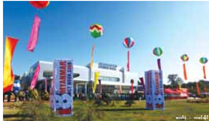
စတင်ပုံ - လမင်းနိုင်