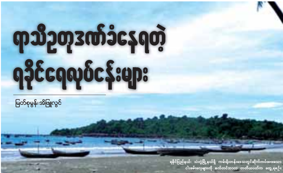
ရခိုင်ပြည်နယ်၊ သံတွဲမြို့နယ်ရှိ ကမ်းရိုးတန်းဒေသတွင်ဆိုက်ကပ်ထားသော ငါးဖမ်းလှေများကို စတင်တင်ဆောင် တာဝန်ယူပေးလာ တွေ့ရပေပြီ။

“အခုနားတော့ ၂ ရက်၊ ၃ ရက်ရှိပြီ။ ငါးမရလို့။ ပင်လယ်ထဲ ဆင်းရင်လည်း ငါးက တစ်ပိဿာ လောက်ပဲရတယ်။ အိမ်စားငါး လောက်ပဲရတယ်။ ပင်ပန်းသ လောက်မရဘူး။ ဆီစရိတ်ကုန် တာပဲရှိတော့ မကုမိဘူး။ ဒါ ကြောင့်ပင်အင်းဘဲနားနေရတာ။ ပင်လယ်မှာ လှိုင်းခဏခဏကြီး တယ်။ ရေစီးကြမ်းပြီး အောက်ရေ စီးတာသန့်တော့ ပိုက်ဆွဲတဲ့ အခါ ငါးသိပ်မရတော့ဘူး။ မနှစ်က