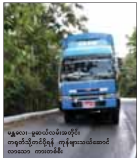
မန္တလေး-မူဆယ်လမ်းအတိုင်း တရုတ်သို့တင်ပို့ရန် ကုန်များသယ်ဆောင် လာသော တာဝန်စီး