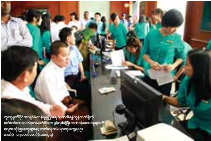
ထုတ်ကုန်ပိုင်ဆိုင်မှုအစီအစဉ်အရ အာရှစိမ်းလန်းမှုပွဲ ဖြိုးရေးဘဏ်၏ ရန်ကုန်ဘဏ်ခွဲကို စက်တင်ဘာလ ၁၆ရက်နေ့က ဖွင့်လှစ်ခဲ့ပြီး ဘဏ်ဝန်ထမ်းများကို ရလှအသုံးပြုနေသူများနှင့် ဘဏ်ဝန်ထမ်းများကို တွေ့ရစဉ် တာဝန်ပေးပေးနေစဉ် (အမရပူရ)

မက်စ်မြန်မာကုမ္ပဏီမှဦးဆောင်ဖွင့်လှစ်သော ဧရာဝတီဘဏ်၏ ရန်ကုန်ဘဏ်ခွဲကိုလည်း စက်တင်ဘာ ၁၆ရက်က ဖွင့်လှစ်ခဲ့သည်။ အေဒင်ဂရပ်မှ မြန်မာ့ရွှေဆောင်ဘဏ်နှင့် အိုင်ဂျီအီးကုမ္ပဏီမှ ယူနိုက်တက်အမရာဘဏ်တို့မှာလည်း ရန်ကုန်ဘဏ်ခွဲများ ဖွင့်လှစ်ရန် စီစဉ်နေကြပြီး ဘဏ်သစ်တစ်ခုစီလျှင် ဘဏ်ခွဲ ၁၀ ခုစီ ဖွင့်လှစ်ရန် ရည်မှန်းထားကြောင်း သတင်းရရှိသည်။