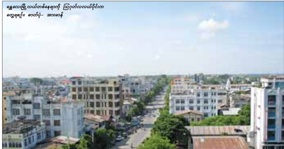
မန္တလေးမြို့လယ်တစ်နေရာကို ဩဂုတ်လလယ်ပိုင်းက တွေ့ရစဉ်။

ရတနာပုံစင်တာတွင် ၂၄ နာရီ လျှပ်စစ်မီးရရှိရေး၊ ကိုယ့်အားကိုယ်ကိုး မီးစက်ဝယ်ယူရေးအတွက် ဆိုင်ခန်းတစ်ခန်းလျှင် ကျပ်နှစ်သောင်းနှုန်း ဈေးအကျိုးတော်ဆောင်အဖွဲ့သို့ ပေးသွင်းရမည်ဖြစ်ကြောင်းလည်း သိရသည်။ ယခင် ရတနာပုံဈေး၏ ဈေးကွက် အကောင်းဆုံးနေရာဖြစ်သော ၇၈x၃၃ ထောင့်ဈေး၏ ဝေးပုံတစ်ပုံမြေနေရာတွင် M.G.W Construction မှ ကိုယ်ပိုင်ခိုင်းမွန်းပလာဇာဈေး တည်ဆောက်ပြီး မိမိနှစ်သက်သော နေရာတွင် ကြိုက်ဖျော်မြင် ဝေးဝယ်နိုင်ကာ မီးလောင်ခံရသော ဈေးသည်များက ရတနာပုံစင်တာတွင် ခြောက်ပေပတ်လည်တစ်ခန်းလျှင် ကျပ်သိန်းခုနစ်ဆယ်ပေးသွင်းရကြောင်း သိရသည်။