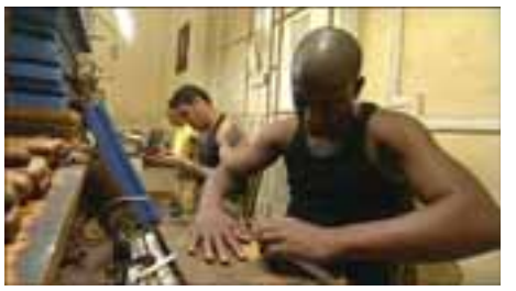
ရောလ်ကတ်စထရီကလည်း စီးပွားရေးတွင် နိုင်ငံတော်က ထိန်းချုပ်ထားမှုများကို လျှော့ချသွားမည်ဖြစ်ကြောင်း ဩဂုတ်လက ပြောကြားခဲ့သည်။ -Ref: BBC

ဆိုသည်။ ကျူးဘား၏ ကွန်မြူနစ် အစိုးရသည် လက်ရှိတွင်နိုင်ငံ၏ စီးပွားရေးကဏ္ဍ အားလုံးကို ထိန်းချုပ်ထားပြီး တရားဝင်လုပ်သား အင်အားစုစုပေါင်း ၅ ဒသမ ၁ သန်း၏ ၈၅ ရာခိုင်နှုန်းကို အလုပ်ပေးထားသည်။ ထို့ကြောင့် လုပ်သား ငါးသန်းကျော်မှ တစ်သန်းခန့်ကို အလုပ်ဖြုတ်မည်ဆိုပါက နိုင်ငံ၏ လုပ်သားငါးဦးလျှင် တစ်ဦးမှာ အလုပ်နေရာဆုံးရှုံးရဖွယ်ရှိသည်။ ကျူးဘားသမ္မတ