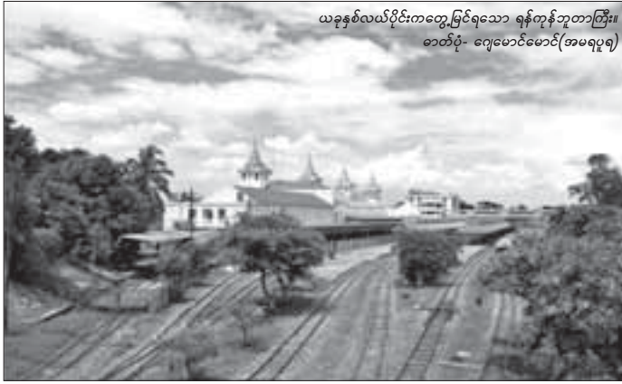
ယခုနှစ်လယ်ပိုင်းကတွေ့မြင်ရသော ရန်ကုန်ဘူတာကြီး။

ရန်ကုန်၊ စက်တင်ဘာ - ၁၇ ဗိုလ်ချုပ်ချုပ်ချီး ဦးကျော်သစ်သား တံတားပေါ်တွင် မိုင်းတွေ့ရှိပြီး သည့်နေ့က ရန်ကုန်ဘူတာကြီး တွင် လုံခြုံရေး တိုးမြှင့်ဆောင်ရွက်နေကြောင်း ဘူတာကြီးမှ တာဝန်ရှိသူတစ်ဦးက ပြောကြားသည်။