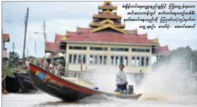
စံချိန်တင်ရေလျော့နည်းမှုဖြင့် ကြုံတွေ့ခံရသော အင်းလေးကန်တွင် စက်တင်ဘာလထိ စံချိန်တင်ရေအမြင့်စံချိန်ကိုပြည့်မီရန် အနည်းငယ်ခန့်သာလိုတော့ကြောင်း အင်းလေးဒေသကျွန်းကျင်သူများထံမှ သိရသည်။

ဖောင်တော်ဦးဘုရားပွဲ ကျင်းပနေစဉ် ရွှေသားဆင်းတူတော်များအား ဖောင်တော်ကြီး၊ ဖောင်တော်ငယ်များဖြင့် ပင့်ဆောင်၍ ကန်ဝန်းကျင်ရွာများ အပူဇော်ခံခြင်း၊ လှေပြိုင်ပွဲကျင်းပခြင်းများ ပြုလုပ်လေ့ရှိရာ အင်းလေးဒေသ၏ ယင်းရိုးရာကို ဆက်လက်ထိန်းသိမ်းရန် လိုအပ်သောရေပမာဏရှိရန်လိုအပ်ကြောင်းကျွန်းကျင်သူများကပြောသည်။