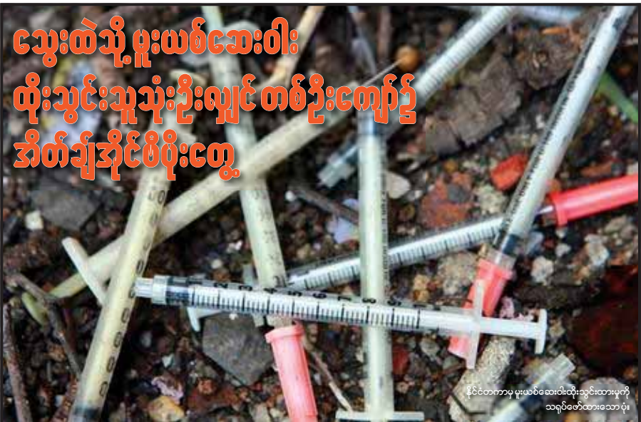
မြိုင်တကာမှ မူးယစ်ဆေးဝါးထိုးသွင်းသူများကို သရုပ်ဖော်ထားသော ပုံ။

ဝတ်ရည် ရန်ကုန်၊ စက်တင်ဘာ - ၁၆ မြန်မာနိုင်ငံတွင် သွေးထဲသို့ မူးယစ်ဆေးဝါး ထိုးသွင်းသူ သုံးယောက်တွင် တစ်ယောက်ကျော်၌ အိတ်ချ်အိုင်စီပိုးတွေ့ရကြောင်း UNAIDS မှ အဆင့်မြင့် အရာရှိတစ်ဦးကပြောသည်။