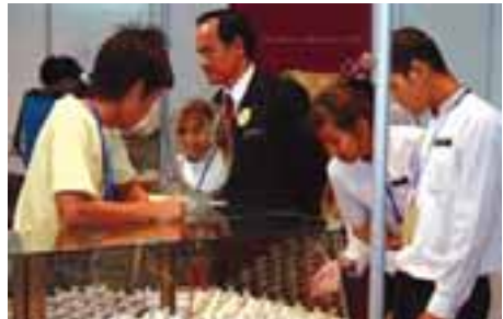
၂၀၀၉ခုနှစ်တွင် ကျင်းပခဲ့သော ကျောက်မျက်ရတနာအရောင်းပြပွဲတွင် မြို့တော်ရောက်လာသူများနှင့် ရောင်းချနေသူများကို တွေ့ရစဉ်၊ စက်တင်ဘာ - ၁၈ ရက်နေ့က

အားဟန် ရန်ကုန်၊ စက်တင်ဘာ - ၁၈ တန်ဖိုးဆက်တိုက်ကျသွားခဲ့သော ပို့ကုန် ရငွေမှာ နိုင်ငံတကာနှစ်လယ် ကျောက်မျက်ရတနာပြွဲ ရက်ရွှေဆိုင်မှုကြောင့် တန်ဖိုး ပြန်တက်လာနိုင်ကြောင်း ပို့ကုန် သွင်းကုန် စီးပွားရေးလုပ်ငန်းရှင် အချို့ကပြောသည်။ “ကျောက်မျက်ပြွဲရွှေလို့ Export Earning (ပို့ကုန်ရငွေ) ပြန်မာလာနိုင်တယ်”ဟု ပြည်ထောင်စုမြန်မာနိုင်ငံကုန်သည်များနှင့် စက်မှုလုပ်ငန်းလုပ်ငန်းရှင်များ အသင်းချုပ် UMFCCI မှ ဗဟိုအလုပ်အမှုဆောင်အဖွဲ့ဝင် စီးပွားရေးလုပ်ငန်းရှင်ကြီးတစ်ဦးက စက်တင်ဘာ ၁၈ ရက်တွင် ပြောသည်။ ယင်းက ပို့ကုန်ရငွေတန်ဖိုးမှာ ယခင်မျှော်မှန်းထားသည့်ထက် ကျောက်မျက်ပြွဲရွှေဆိုင်မှုကြောင့် ပိုလျင်မြန်စွာ ပြန်တက်လာနိုင်ခြင်းကို ပြောခြင်းဖြစ်သည်။ ပြည်တွင်း၌ ကျင်းပသော နိုင်ငံတကာ ကျောက်မျက်ရတနာပြွဲများမှာ ပြည်ပမှ ကျောက်စိမ်း