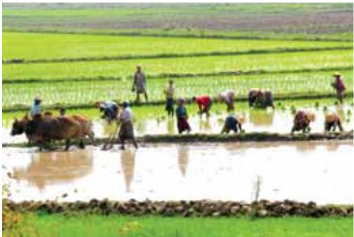
မိုးပေါက်ရောက်နေသော လယ်သမားများ။

မိုးလေဝသပညာရှင်တို့၏ အဆိုအရ မြန်မာနိုင်ငံ တစ်ဝန်းလုံး လျားလျားကို မိုးရွာသွန်းမှုဖြစ်ပေါ်စေသည့် မုတ်သုံလေများမှာ စက်တင်ဘာလအကုန်တွင် မြန်မာနိုင်ငံမှ လက်ပြန်တက် ထွက်ခွာပေးတော့မည်။ မုတ်သုံလေများနှင့်အတူ မိုးပျောက်သွားမည်ကို တောင်သူအချို့ ပုပ်နံ့နေသည်။ ထို့အတွက် ဦးကြီးတို့ လုပ်ဆောင်ရမည့် အဓိကအလုပ်သည် ရေကိုရရှိနိုင်သမျှနည်းလမ်းများသုံး၍ ရအောင်ယူပြီး ဖြစ်နိုင်သမျှမလေလွင့်စေရန် ထိန်းသိမ်းရေးပင်ဖြစ်သည်။