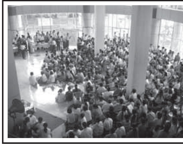
PHOTO NEWS ၂၀၀၈ခုနှစ်က ဦးလောင်ဆုံးရှုံးခဲ့သော ရတနာပုံဈေးအနက်တွင် အသစ်ပြန်လည်ဆောက်လုပ်နေကာ ဦးစီးတော့မည့် ရတနာပုံဈေးဝင်တာမှ ဆိုင်ခန်းများအားစက်တင်ဘာ ၂၀ရက်မှ ၂၀ရက်အထိ ဆိုင်ခန်းပေါင်း၁၅၅၅ ခန်းကို ဝဲနံဘက်နေရာမှတားပေးလျက် ရှိသည်။ ပုံတွင် စက်တင်ဘာ ၂၀ရက်က ရတနာပုံဈေးဝင်တာ ပရိုဂျက်ရှင်းခရီးသားအတွင်း ဆိုင်ခန်းများကို ဝဲနံဘက်နေစဉ်၊ သတင်း- ဦး၊ တတ်ပုံ- မင်းအင်

ယူမှာဖြစ်ပါတယ်။ သတင်းတွေတင်မကဘဲ သီချင်းတွေကစလို့ ကဏ္ဍအားလုံးလိုလိုအတွက် အဲဒီလို စိစစ်ထားပါတယ်”ဟု အထက်ပါပုဂ္ဂိုလ်ကရှင်းပြသည်။ ရတနာပုံဝက်ဘ်ပေါ်တယ်တွင် လွှင့်တင်မည့် သတင်းများသည် ယင်းပေါ်တယ်မှ တရားဝင်ပူးပေါင်းထားသည့် ဂျာနယ်များမှ စာပေစိစစ်ရေးနှင့် ပြုပြင်သားသတင်းများကို အသုံးပြုမည်ဖြစ်ရာ ယင်းအတွက် ထပ်မံစိစစ်ရန် မလိုအပ်ကြောင်းသိရသည်။