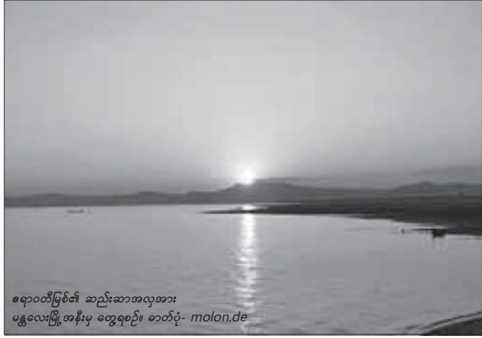
ရောဝင်မြစ်၏ ဆည်းဆာအလှအား မန္တလေးမြို့ အနီးမှ တွေ့ရစဉ်။

ရာသီဥတု ပြောင်းလဲခြင်းသည် မြစ်များအပေါ် သွယ်ဝိုက်၍ အကျိုးသက်ရောက်မှု ရှိသည်။ မြန်မာနိုင်ငံသည် ရာသီဥတုပြောင်းလဲမှုဒဏ်ကို ယခုနှစ်အနည်းငယ်အတွင်း သိသာစွာ ခံစားလာရသည်။ ရာသီဥတုပြောင်းလဲခြင်းကို စောင့်ကြည့်လေ့လာသော ပညာရှင်ကြီးများ၏ ခန့်မှန်းချက်အရ မတ်သို့မီသည် အဝင်နောက်ကျ၍ အထွက်စောမည်ဖြစ်သည်။ တစ်နှစ်၏ မိုးရွာသွန်းမှုပမာဏသည် ပြည့်စုံသော်လည်း မိုးလယ်အတွင်း မိုးပြတ်မှုများဖြစ်ပေါ်ပြီး ရွာသွန်းရက်၌ တစ်ရက်မိုးရေချိန် လက်မထက်ပိုမိုရွာသွန်းပါက မြေပြုမှုရေကြီးလျှံမှုများ ဖြစ်ပေါ်နိုင်၍ လူထုက သတိပြုသင့်ကြောင်း