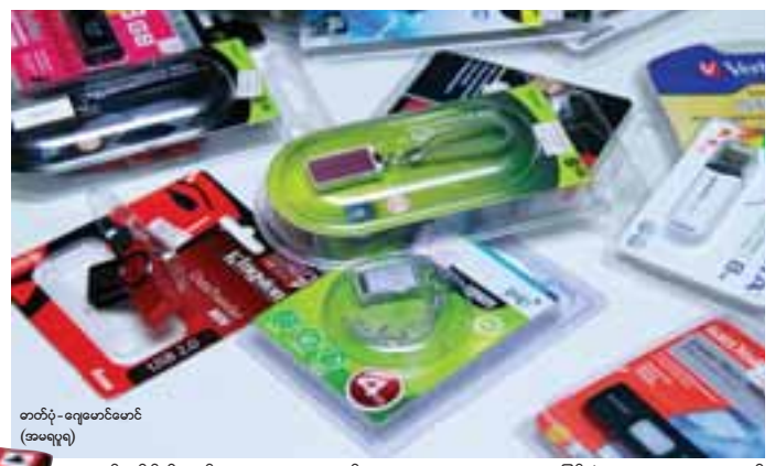
တတိယ - ဂျေဟောင်းမောင် (အမေ့ရဲ့)

ပိုင်လျှို့ဝှက်နံပါတ်(Password) ပေးပြီးပိတ်လိုရတဲ့အတွက် တခြား သူများ လွယ်လွယ်အသုံးမပြုနိုင် တော့မယ့် အားသာချက်ရှိလို့ ပိုလူ ကြိုက်များတယ်လို့သိရပါတယ်။ Memory 2GB ကနေ 32GB အထိ ဈေးကွက်ထဲမှာရှိပေမယ့် Stick အသုံးပြုတဲ့သူအများစုက တော့ 8GB တွေ အသုံးများကြပါ တယ်။ ဒီဆိုင်မှာ SanDisk တံဆိပ် အပြင် Toshiba တံဆိပ်စတဲ့ တံဆိပ်အမျိုးမျိုးနဲ့ Memory Stick