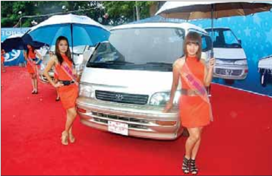
မန္တလေးမြို့၊ မြို့တော်ဧည့်သည်တော်တင်ဘာ ၁၇ရက်မှ ၂၀ရက်အထိကျင်းပခဲ့သော ၂၀၁၀ ဒုတိယအကြိမ် ကား၊ လူသုံးကုန်နှင့် ပညာရေးပြပွဲ၌ ကားကုမ္ပဏီတစ်ခု၏ ပြခန်းတွင် ပြသထားသောကားများနှင့် ခေတ်မီများကိုတွေ့ရစေခဲ့။

အတွဲ(၃)၊ အမှတ်(၂၇) ၂၀၂ ဖတ် ၇ တွင် စတင်ထုတ်ဝေသည် ၁၃၇၂ ခုနှစ်၊ တော်သလင်းလပြည့်နေ့ ၊ ကြာသပတေး၊ (စက်တင်ဘာ ၂၃ ၊ ၂၀၁၀)