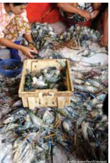
တက်ဝဲ - ရေထွက်ကုန် (အမရပူရ)

ပြည်ပတင်ပို့သူများအနေဖြင့် တွက်ခြေမကိုက်ပါက ဓွေးမြူသူများကို ဈေးလျှော့ပေးဝယ်လေ့ရှိကြောင်း ငါးမွေးမြူရေးလုပ်ငန်း