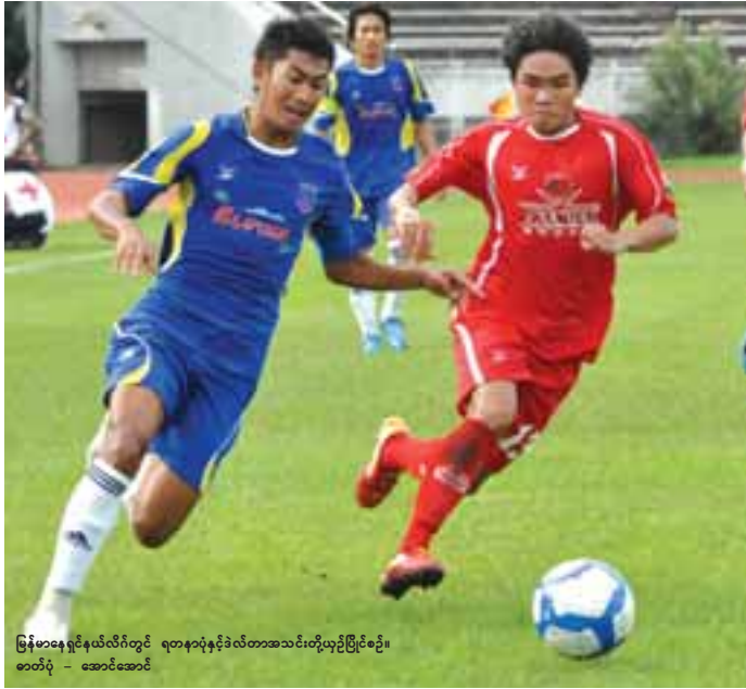
မြန်မာနေရှင်နယ်လိဂ်တွင် ရုက္ခပူရနှင့်ဒီလီတာအသင်းတို့ယှဉ်ပြိုင်စဉ်၊ စာတံပုံ - အောင်အောင်

ထို့အပြင် မြန်မာနေရှင်နယ်လိဂ်ပြိုင်ပွဲသို့ ဝင်ရောက်ယှဉ်ပြိုင်ရမည့် ကလပ်အသင်းအား ရွေးချယ်မှုသည် ဘောလုံးအဖွဲ့ချုပ်၏ လုပ်ပိုင်ခွင့်ဖြစ်ကြောင်း ယခုကဲ့သို့