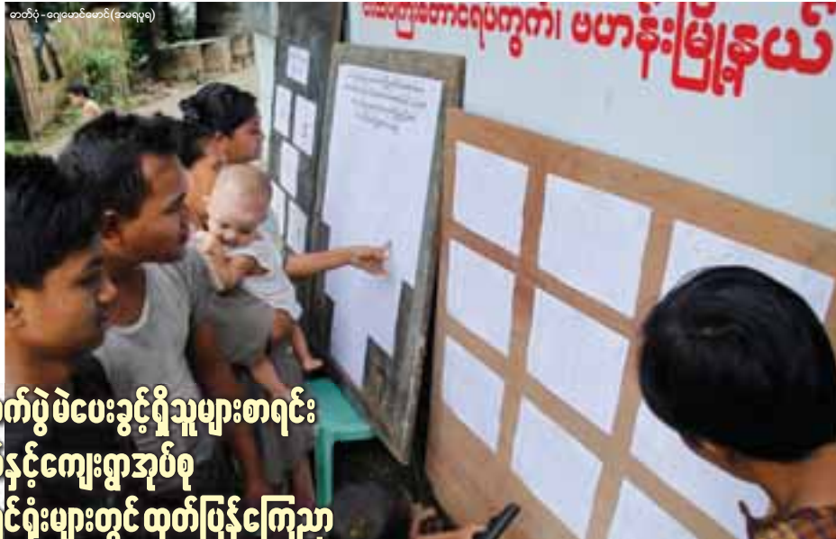
တစ်ပွဲ - ရေပေးပေးခြင်း (အမေရိကန်)