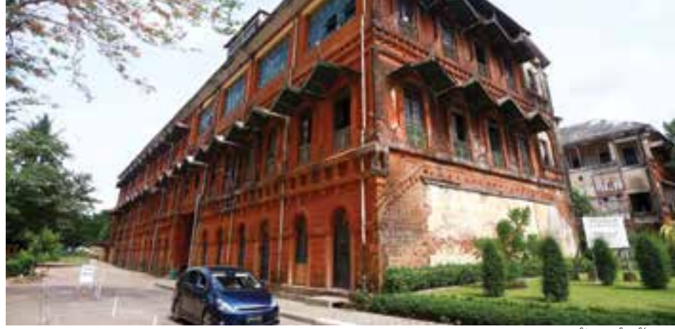
မီးရထားရုံးချုပ်ဟောင်းအဆောက်အအုံ

မြန်မာ-တရုတ်ရေနံစိမ်းပိုက်လိုင်းကို မဒေးကျွန်း (မြဒေးကျွန်း) မှ စတင်တည်ဆောက်ပြီး ဓာတ်ငွေ့ ပိုက်လိုင်းကို ကျောက်ဖြူမြို့နယ်မှ စတင်တည်ဆောက်သည်။ ယင်းပိုက်လိုင်း နှစ်လိုင်းသည် ရခိုင်ပြည်နယ်၊ ရှမ်းပြည်နယ်၊ မကွေးတိုင်း ဒေသကြီးနှင့် မန္တလေးတိုင်း ဒေသကြီးတို့ကို ဖြတ်သန်းဖောက်လုပ်ထားပြီး ရေနံစိမ်းပိုက်လိုင်းသည် ၇၇၄ ကီလိုမီတာ ရှည်လျားကာ သဘာဝဓာတ်ငွေ့ ပိုက်လိုင်းသည် ၇၉၃ ကီလိုမီတာ ရှည်လျားသည့် ပိုက်လိုင်းများ ဖြစ်သည်။ ယင်းစီမံကိန်းကို မြန်မာနိုင်ငံ အစိုးရနှင့် တရုတ် အိန္ဒိယနှင့် ကိုရီးယားနိုင်ငံတို့မှ ကုမ္ပဏီခြောက်ခုက ရင်းနှီးထားသည်။