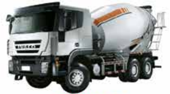
IVECO 682 9Cu.M Mixer Truck

ဝယ်ယူသူများအဆင်ပြေစေရန်အတွက် Hire Purchase စနစ်ဖြင့်ရောင်းချပေးပါမည်။