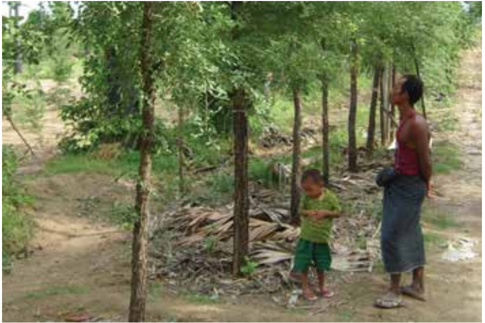
သနပ်ခါးစိုက်ခင်းတစ်ခင်းနှင့်ဒေသခံသားအဖနှစ်ဦး

အရောင်းအဝယ် ဖြစ်ခဲ့ကြောင်း အဆိုပါ ဒေသခံတောင်သူများ ပြောပြချက်အရ သိရှိရသည်။ ချင်းတွင်းမြစ်အတွင်း သနပ်ခါး အရောင်းအဝယ်ပြုလုပ်ရာ ကနီမြို့နယ် ချိုင်းကျေးရွာနှင့် ဒင်ပေါက်ကျေးရွာများတွင် ယခင်နှစ် များက နေအိမ်ခြံဝင်းအတွင်း သနပ်ခါးစိုက်ပျိုးရေးလုပ်ကိုင်ခဲ့ရာမှ ယာစိုက်ခင်းများအတွင်း သနပ်ခါး တိုးချဲ့ စိုက်ပျိုးခဲ့ခြင်းဖြစ်သည်။ ယခုနှစ် ဆီးသီးဈေးကွက် အနေအထားအရ ကနီမြို့နယ် အတွင်း ဆီးစိုက်ပျိုးရေးလုပ်ငန်း အချို့ သနပ်ခါးစိုက်ပျိုးရေး လုပ်ငန်းအဖြစ် ပြောင်းလဲလုပ်ကိုင်လာ ခဲ့ကြောင်း သတင်းရရှိသည်။