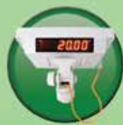
နက်စက်ခြင်ခိုင်းခွက်