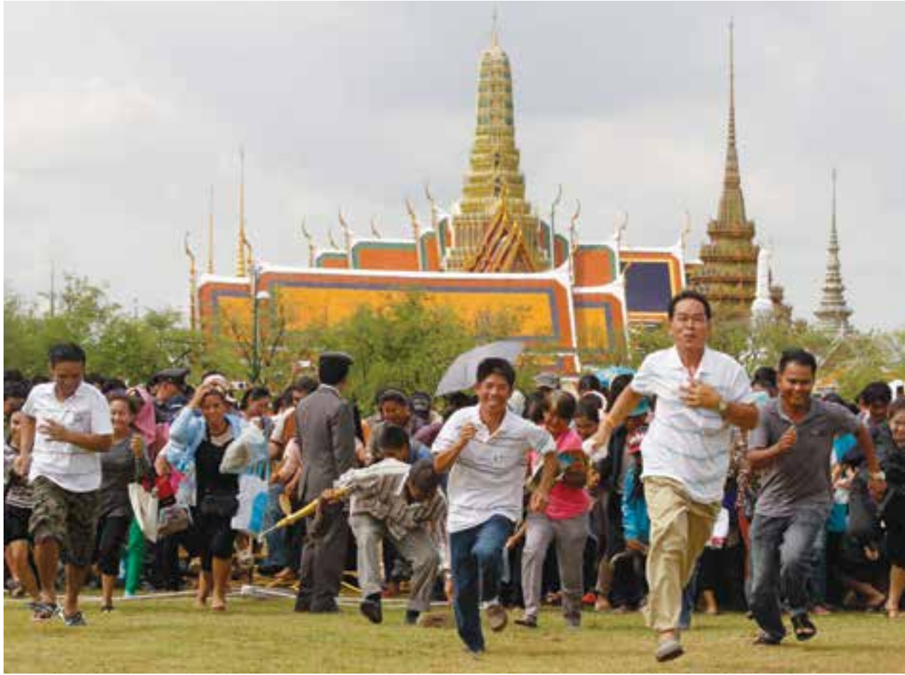
မေလ ၁၃ ရက်က ဘန်ကောက်မြို့၌ ကျင်းပသော နှစ်စဉ်ပြုလုပ်သည့် တော်ဝင်လယ်ထွန်မင်္ဂလာပွဲတော်တွင် စပါးမျိုးစေ့များကို လက်ထဲဆုပ်ကိုင်ကာ အတားအဆီးများကိုဖြတ်ကျော်ပြေးနေကြသူများ။ ရှေးယခင်ကပင်ရှိခဲ့သော လယ်ထွန်မင်္ဂလာပွဲတော်သည် ဗုဒ္ဓဘာသာတိုင်းနိုင်ငံတွင် ပျံ့နှံ့မြောက်သွေသောရာသီ၏ အဆုံးသတ်လည်းဖြစ်ပြီး ကမ္ဘာ့အကြီးဆုံး ဆန်တင်ပို့သည့်နိုင်ငံများထဲမှ တစ်နိုင်ငံဖြစ်သော ထိုင်းနိုင်ငံ၏ စပါးစိုက်ရာသီအစလည်းဖြစ်သည်။

ဆော်ဒီအာရေဗျနိုင်ငံတွင် ပြီးခဲ့သော နွေရာသီကတည်းက အဆိုပါပိုင်းရပ်စ်ကူးစက်ခံရသော စာမျက်နှာ(၄၆)သို့