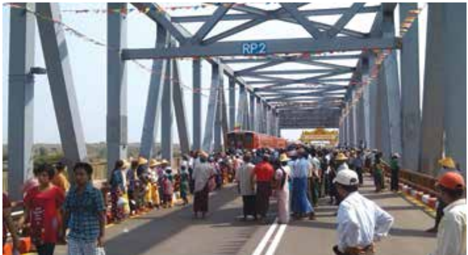
မကျွေးမြို့နှင့် မင်းလှမြို့ကို ဆက်သွယ်ပေးသော ဧရာဝတီတံတား (မလွန်)ကို မေ ၁၀ ရက်တွင် ဖွင့်လှစ်ခဲ့သည်။ အဆိုပါတံတားမှာ ၁၂ စင်းမြောက် ဧရာဝတီမြစ်တံတားဖြစ်ပြီး ပင်မတံတားအရှည် ၂၂၁၅ ပေ ရှည်လျားပြီး သံကူတန်းကရစ်တံတားဖြစ်သည်။ ရထားလမ်းနှင့် ကားလမ်းနှစ်ခုတွင်ပါရှိပြီး ကားလမ်းခန့်ဝန်မှာ တန် ၆၀ ထိဖြစ်သည်။

တစ်ဘူးလျှင် ကျပ် ၅၀၀ နှုန်းဖြင့် ဈေးကွက်အတွင်း စတင်ဖြန့်ဖြူး ရန် စီစဉ်ထားသည်။ ခေါင်းလျှော်ရည်နှင့် ဆပ် ပြာရည်ထုတ်လုပ်မှုသင်တန်းအား မြန်မာနိုင်ငံမျက်မမြင်များအသင်း (ရန်ကုန်)မှ နည်းပညာနှင့် ကုန် ကြမ်း ပစ္စည်းများထောက်ပံ့ခဲ့ကာ အသက်မွေးဝမ်းကျောင်းပညာရပ် အဖြစ် ရောင်ခြည်သစ်မျက်မမြင် သင်တန်းကျောင်းတွင် ဧပြီလမှစ ၍ အခြေခံအိမ်တွင်းမှုပညာသင် တန်းအဖြစ် ဖွင့်လှစ်သင်ကြားခဲ့ ခြင်းဖြစ်သည်။