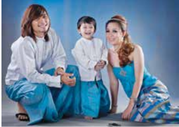
ဓာတ်ပုံ-လမင်းနိုင်