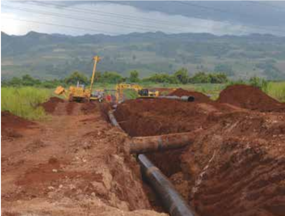
စာတိုက်ပို့ကုန်လှိုင် စီမံကိန်းတစ်နေရာ

မြန်မာ-တရုတ်စာတိုက်ပို့ကုန်လှိုင် သဘာဝပတ်ဝန်းကျင် ထိခိုက်မှုများရှိခဲ့သည်ဟု ပြောဆိုနေကြသော်လည်း စီမံကိန်းအကောင်အထည်ဖော်သည့် ကုမ္ပဏီက ကောက်ယူထားသော သဘာဝပတ်ဝန်းကျင် ထိခိုက်မှုစစ်တမ်းအရ ထိခိုက်မှုမရှိသည့်စီမံကိန်းဖြစ်ကြောင်း အရှေ့တောင်အာရှ ရေနှင့် သဘာဝပတ်ဝန်းကျင် ပိုက်လိုင်းစီမံကိန်းအကောင်အထည်ဖော်ရေးအဖွဲ့မှ ဥက္ကဋ္ဌမစ္စတာလီ ကျန်ယွင်းက ပြောသည်။