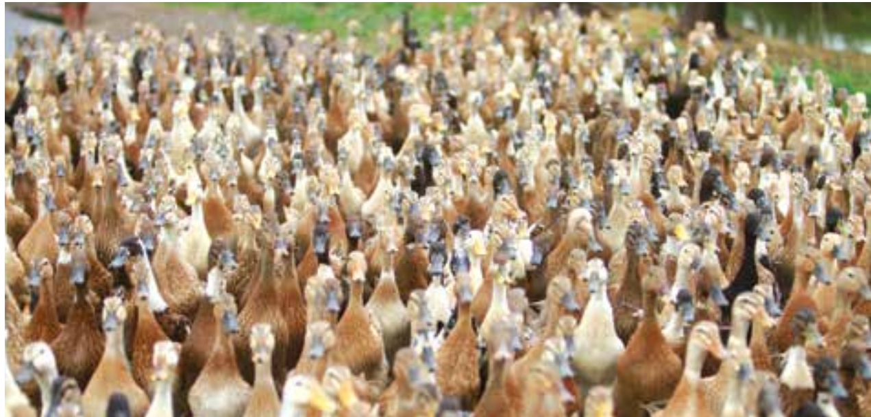
မွေးမြူရေးအဖွဲ့များကိုတွေ့ရစဉ်