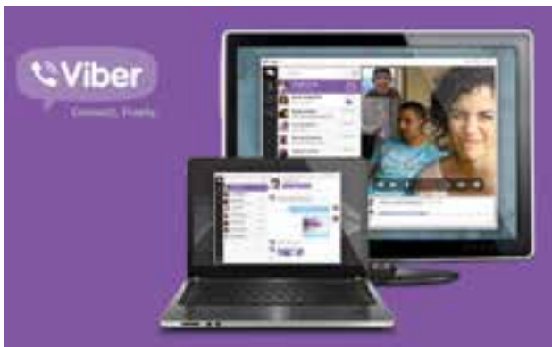
ပြုနိုင်သည်။ အသစ်ထွက်ရှိလာသော Viber Version အသစ်မှာ မိုဘိုင်းဖုန်းများတွင်သာမက ကွန်ပျူတာများတွင်ပါ ပြည်ပခေါ်ဆို

အဆိုပါ Viber 3.0 Version မှာ ios နှင့် Android ဖုန်းများတွင်သာမက ကွန်ပျူတာနှင့်ပါ ချိတ်ဆက်အသုံးပြုနိုင်သည်။ ထို့အပြင် Window ကွန်ပျူတာတွင် သာမက Mac ကွန်ပျူတာတွင်ပါ အသုံး