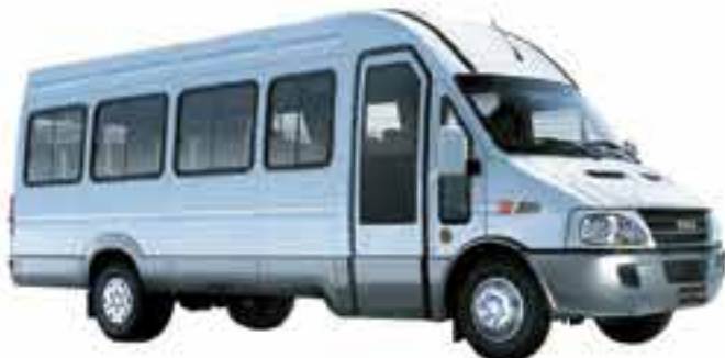
10 Seaters to 19 Seaters

ရုံး/ကုမ္ပဏီ/ဘဏ်/ကျောင်းကြို/ပို့နှင့် ခရီးတိုအမျိုးမျိုးသွားနိုင်ရန်အတွက်