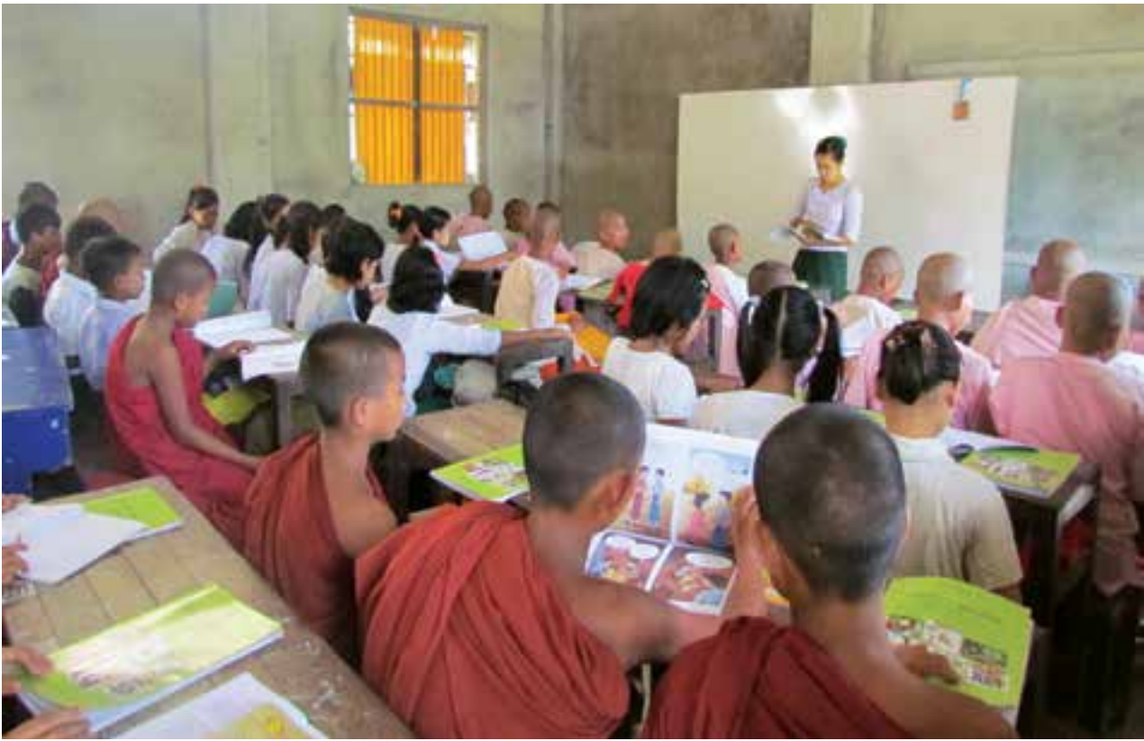
ဘုန်းတော်ကြီးသင် ပညာရေးကျောင်းတစ်ခုတွင် ပညာသင်ကြားနေကြသူများကို တွေ့ရစဉ်

လက်ရှိတွင် အထူးဇီဝဗေဒဘာသာရပ် ဘွဲ့ကြိုသင်တန်းများကို မော်လမြိုင်တက္ကသိုလ်၊ တောင်ကြီးတက္ကသိုလ်၊ ဒဂုံတက္ကသိုလ်၊ မကွေးတက္ကသိုလ်၊ ပုသိမ်တက္ကသိုလ်၊ စစ်တွေတက္ကသိုလ်၊ မုံရွာတက္ကသိုလ်၊ မြစ်ကြီးနားတက္ကသိုလ်၊ ပြည်တက္ကသိုလ် နှင့် ရတနာပုံတက္ကသိုလ်တို့တွင် သင်ကြားပို့ချနေသည်။