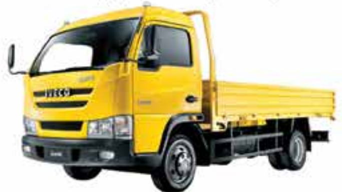
3.5 Tons to 6 Tons Box Truck also available