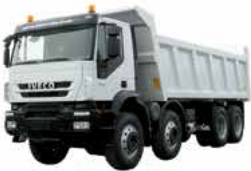
IVECO 682 15Cu.M to 20Cu.M Dump Truck

ကုန်ပစ္စည်းမျိုးစုံသယ်ယူပို့ဆောင်ရေး၊ လုပ်ငန်းရှင်များအတွက်