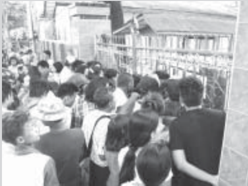
အောင်ချက် ၃၈.၅၆ ရာခိုင်နှုန်းရှိ မန်းတိုင်းဒေသကြီးတက္ကသိုလ်ဝင်တန်း အောင်စာရင်း