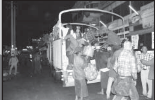
ချမ်းမြေ့ပြည်ယာဉ် ရပ်နားစခန်းတွင် လောကီကိုင်ဒေသမှနေရပ်ပြန်ရန် ရောက်ရှိလာသူများ