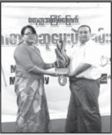
အလကာစာပေဆုချီးမြှင့်ပွဲ