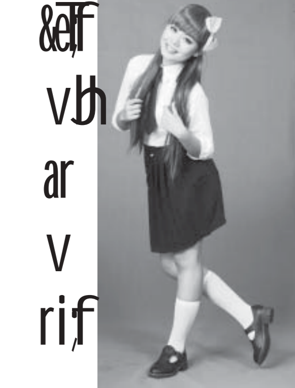
မန္တလေးမြို့အတွင်း နေထိုင်သူများ၏အသုံးပြုနေသည့် အက္ခရာများ

မန္တလေးမှာ ပွင့်လင်းရာသီပီပီ သွက်လက်နေတဲ့ စီးပွားရေးကွန်ယက်တွေနဲ့ ဆက်စပ်လျက် ကပ်ပါနေတာကတော့ အနုပညာအဝန်းအပိုင်းပါ။ ကမ္မဇာ်ဖွင့်ပွဲတွေ ပစ္စည်းသစ်မိတ်ဆက်ပွဲတွေ၊ ဆိုင်သစ်ဖွင့်ပွဲတွေ၊ ကုန်ပစ္စည်းပရိုမိုးရှင်းပွဲတွေမှာ ကိုပြီးတို့လို အစီအစဉ် တင်ဆက်သူတွေ၊ မော်ဒယ်တွေ၊ ဒဏ်ဆာတွေ မနားတမ်းအလုပ်လုပ်နေကြရသလို၊ တစ်ဖက်မှာလည်း ဒါရိုက်တာအကယ်ဒမီတွေနဲ့ အောင်ဇော်တို့လို၊ ကိုပေါက်တို့လို၊ ဒါရိုက်တာတွေလည်း မိုးလေကင်းစင်ချိန် ဒါတော်မီရိုက်နေကြတာ တွေ နေ့ပျပါတယ်။