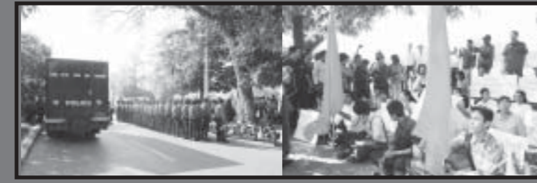
ပင်မကျောင်းသားသပိတ် အင်အားသုံးအကြမ်းဖက်ဖြိုခွင်းမှု ရှုတ်ချဆန္ဒထုတ်ဖော်ပွဲ