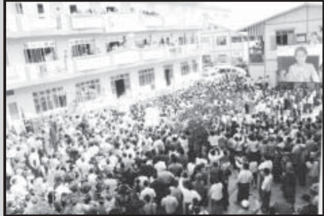
မဟာမုနိဘုရားကြီးနှင့် ကတက်ကုန်းမိုးရိမ်ဘုန်းတော်ကြီးဆင်ကျောင်းသို့ ရောက်ရှိလာသော ဒေါ်အောင်ဆန်းစုကြည်