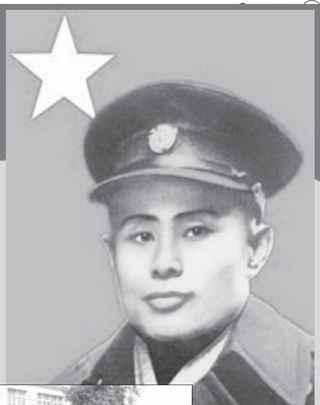
အမျိုးသားခေါင်းဆောင်ကြီး ဗိုလ်ချုပ်အောင်ဆန်း နှစ်(၁၀၀)ပြည့်မွေးနေ့