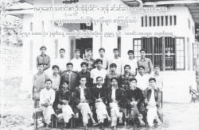
မန္တလေးတောင်တော် လူငယ်စာကြည့်အသင်း