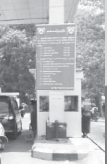
သုံးရက် တစ်ဖွန်းတည် မြို့ဝင်ကြေး