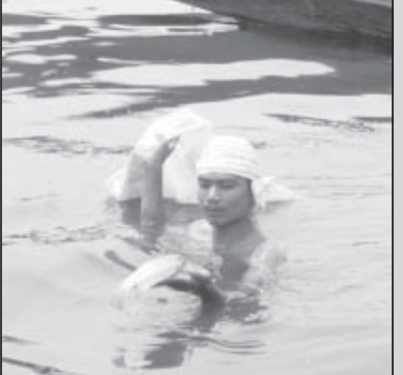
တောင်သမန်အင်းအတွင်း ငါးသေများကို လိုက်လံရှင်းနေသူတစ်ဦး