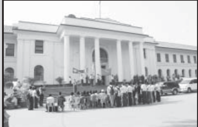
ဗိုလ်ချုပ်အောင်ဆန်းရာပြည့်ကျင်းပသော တက္ကသိုလ်ကျောင်းသားကျောင်းသူများ