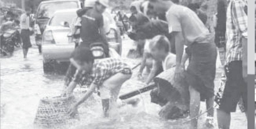
မေ ၁၈-၁၉ရက်မှာ ရွာသွန်းမိုးကြောင့် ၂၃လမ်း၊ ၈၃x၃၄ လမ်းကြားတွင် မိုးရေဖွေးဖွေးထဲမှာ မျောပါလာသော ငါးများကို ဖမ်းယူနေကြသူများ