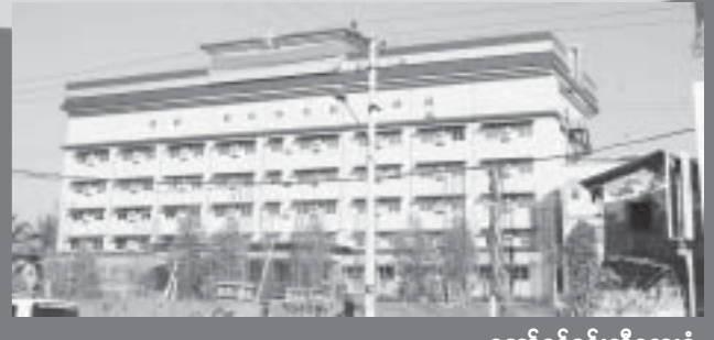
တော်ဝင်နှင်းဆီဆေးရုံ