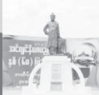
နှစ်(၆၀)ပြည့် အင်ဂျင်နီယာပညာရေးခရီး