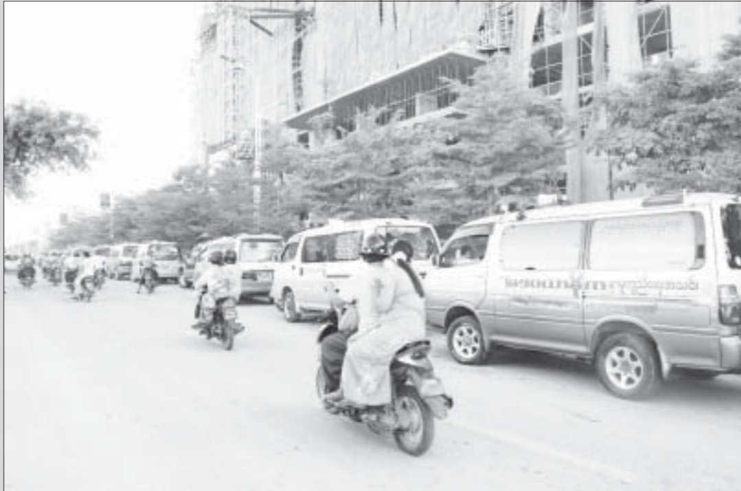
ငြိမ်းပြီကျမှုဖြစ်ပွားရာသို့ ကယ်ဆယ်ရေးဝန်ထမ်းများနှင့် ပူးပေါင်းဆောင်ရွက်ရန်ရောက်ရှိနေသော လူမှုရေးကူညီမှုအသင်းအဖွဲ့များ