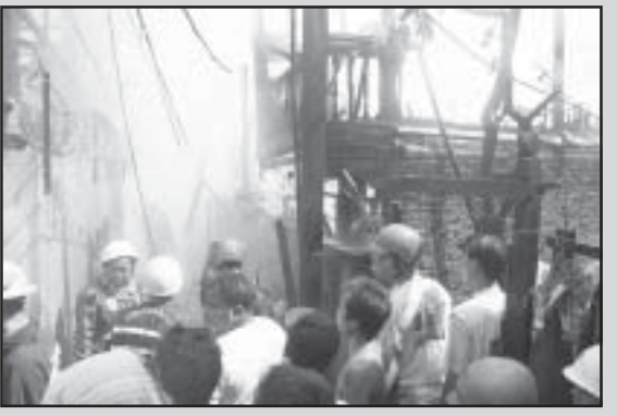
ဥယျာဉ်အုပ်ဝင်း မီးလောင်ကျွမ်းမှု