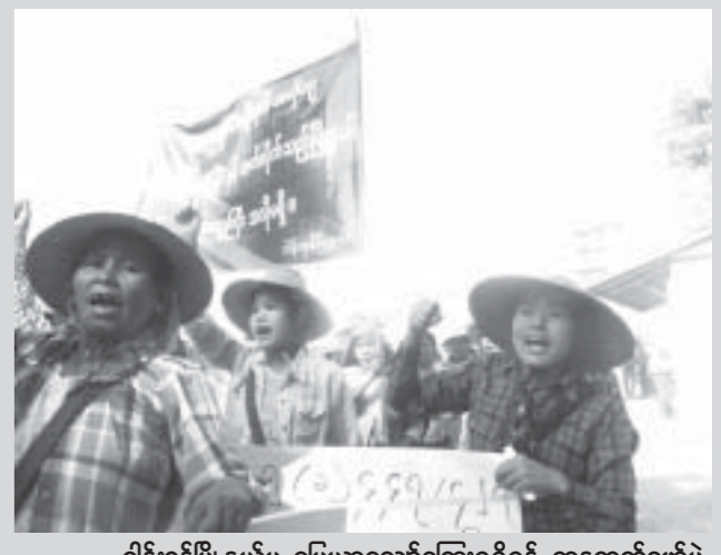
ငါးစွန်မြို့နယ်မှ မြေယာလျော်ကြေးရရှိရန် ဆန္ဒထုတ်ဖော်ပွဲ