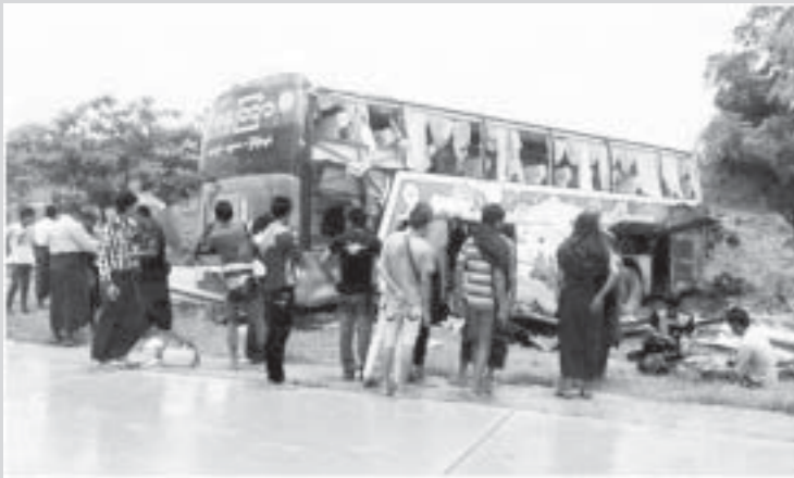
မိုင်တိုင် ၂၀၃/၃ မှာဖြစ်ပွားခဲ့တဲ့ ယာဉ်တိုက်မှု