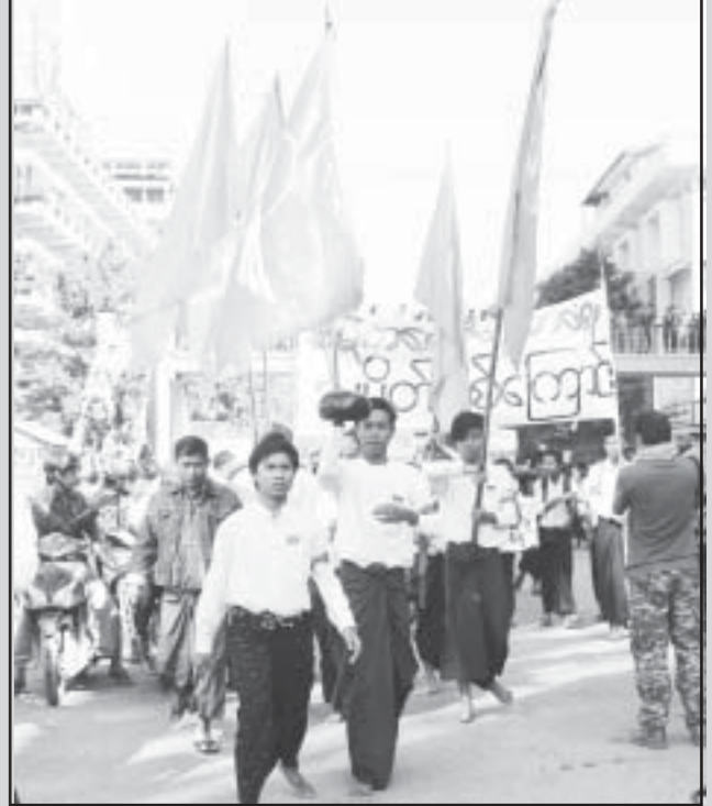
ဒီမိုကရေစီပညာရေးသပိတ်စစ်ကြောင်း