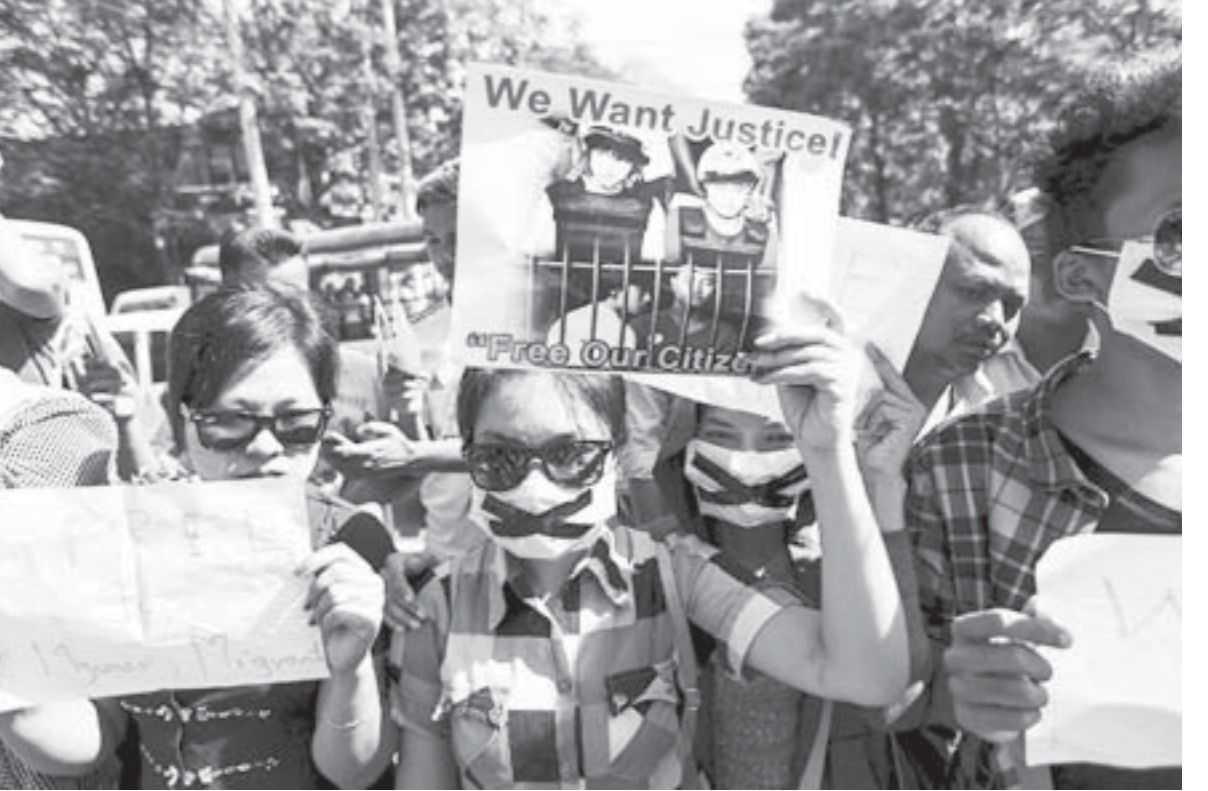
ဂျပန်နိုင်ငံ၊ ဟိုနိုယုမားမြို့နယ်ရှိ ရှေးဟောင်းမြို့နယ်တစ်ခုတွင် ရှေးဟောင်းမြို့နယ်တစ်ခုကို ပြုပြင်ဆင်ရာတွင် ပါဝင်နေကြသူများ

ဖိုးမြိုင်။ ထိုင်းမှာ သေဒဏ်ဖြစ်ဒဏ်က အမှန်တကယ် သေဒဏ်အဖြစ်ပေးလို့လားဗျ။ ဖိုးညှဏ်။ အေးဗျ။ ဒီစေဘ၂၅ရက် ဘန်ကောက်ပို့ခံ သတင်းအရ (၂)ဝန်ခံချက်ရအောင် ထိုင်းရဲများက ညဉ့်ပန်းစိန်ဖက်ခြင်း၊ (၃)လူသတ်မှုကျူးလွန်တယ်ဆိုတဲ့ ပေါက်တူးက DNA က မြန်မာနှစ်ဦးနဲ့ မကိုက်ညီခြင်း (၄) ထိုင်းကပေးတဲ့ DNA သက်သေတွေက ခိုင်လုံမှုမရှိခြင်း (၅)ရုံတော်ကပြတဲ့ သက်သေမခိုင်လုံခြင်း ဒါတွေ့ရှိတယ်လို့ ပညာရှင်တွေက ထောက်ပြထားတယ်ဗျ။ ဖိုးမြိုင်။ ထိုင်းရဲတွေက တရားခံစစ်တာကြမ်းတဲ့ သမိုင်းကြောင်းလည်း ရှိတယ်ဆိုဗျ။