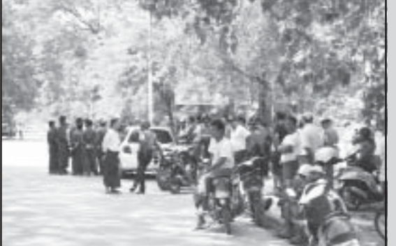
စစ်ကိုင်း-မန္တလေးကားလမ်းဘေး အိမ်ကိုလုံးအား ဖျက် ဝင်ရောက် မြင်ကွင်း