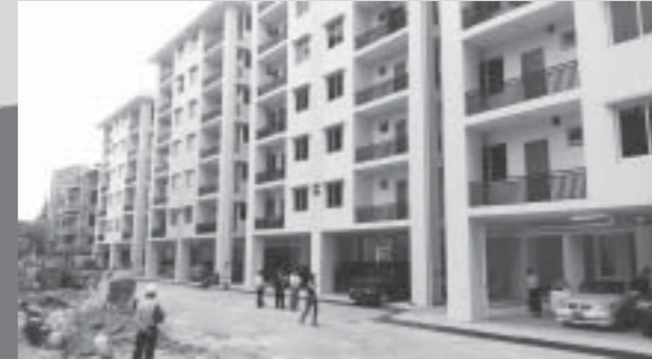
စိတ္တရမဟိရပ်ဝန်ထမ်းအိမ်ရာများဖျက်သိမ်း၍ အသစ်တည်ဆောက်ခဲ့သော တိုက်ခန်းများ