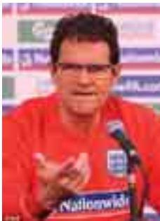
ဇာကလည်း “အရည်အသွေးမရှိ၊ စိတ်ဓာတ်မရှိ၊ မျှော်လင့်ချက်မရှိ”

လန်ဒန်၊ ဇွန်- ၁၉ ကမ္ဘာ့ဖလားပြိုင်ပွဲ၏ဒုတိယမြောက် အုပ်စုပွဲစဉ်၌ အယ်လ်ဂျီးရီးယားအသင်းနှင့် အင်္ဂလန်အသင်းတို့ သရေကျခဲ့ပြီးနောက် အင်္ဂလန်သတင်းစာများက အသင်းနည်းပြနှင့် ကစားသမားများကို ပြင်းထန်စွာ ဝေဖန်မှုများပြုလုပ်ခဲ့ကြောင်း သိရသည်။ အင်္ဂလန်ဒေးလီမေရာသတင်းစာက နည်းပြကာပယ်လိုနှင့် အင်္ဂလန်အသင်းအား “အသုံးမကျမှုအပြည့်” ဟု ခေါင်းစဉ်တပ်ဖော်ပြခဲ့သလို၊ ဂါးဒီးယန်းသတင်းစာကလည်း “အရည်အသွေးမရှိ၊ စိတ်ဓာတ်မရှိ၊ မျှော်လင့်ချက်မရှိ”