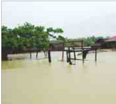
ဖြစ်ပေါ်ခြင်းမှာ လွန်ခဲ့သည့် ၁၉၉၄ ခုနှစ်၊ မွန်တိုင်းတိုက်ခတ်ခဲ့ပြီးနောက်ပိုင်း ပထမဆုံး ဖြစ်ပေါ်ခဲ့

ကျောင်းများတွင် ပြောင်းရွှေ့နေရာချပေးထားကြောင်း သိရသည်။ နေရာပြောင်းရွှေ့နေရသည့် အိမ်ထောင်စုများအားမောင်တောဒေသဌာနဆိုင်ရာတာဝန်ရှိသူများနှင့် မောင်တောအခြေစိုက် အိုင်အင်န်ဂျီအိုအဖွဲ့အစည်းများမှ အစားအသောက်များကူညီထောက်ပံ့ပေးထားပြီး ရေကြီးမှုကြောင့် အသေအပျောက်မရှိကြောင်းလည်း သိရသည်။ ဘူးသီးတောင်မြို့နယ်တွင် တောင်ပြိုကျမှုကြောင့် အနည်းဆုံး ၁၇ ယောက် သေဆုံးခဲ့ကြောင်း သက်ဆိုင်ရာ တာဝန်ရှိသူများ၏ ထုတ်ပြန်ချက်အရ သိရသည်။ ယခုနှစ် မောင်တောဒေသတွင် မိုးသည်းထန်ကာ ရေကြီးမှု