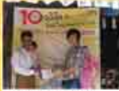
ဦးအေးကို(ပုသိမ်နား) (၉/တကန(နိုင်)၀၄၃၀၂၃)