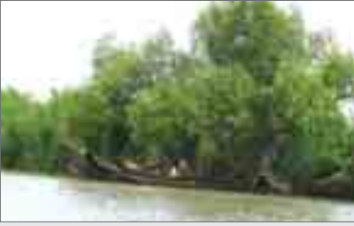
တံတားရပ် ရန်ကုန်၊ ဇွန်-၁၆

ဧရာဝတီတိုင်းရှိ ဒီရေတေမျိုးစိတ် တချို့သော ဒီရေတေသစ်ပင်မျိုးစိတ်များသည် မျိုးသုဉ်းပျောက်ကွယ်လုနီးပါးအန္တရာယ်နှင့် ရင်ဆိုင်နေရသောကြောင့် ကာကွယ်ထိန်းသိမ်းရန်လိုအပ်ကြောင်း ဧရာဝတီတိုင်း ဒီရေတေပြန်လည်စိုက်ပျိုးရေးတွင် ၁၀ နှစ်တာဆောင်ရွက်ခဲ့ပြီး MERN အဖွဲ့၏ သဘာဝပတ်ဝန်းကျင်အကြံပေး ဝန်ထမ်းတစ်ဦးက ပြောသည်။