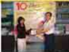
မသိစုညာ(မန္တလေး) (၉/မနမ(နိုင်)၀၀၂၆၃၃)