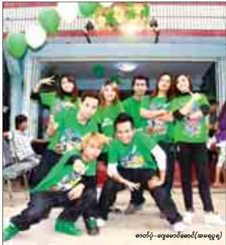
ဇာတ်ပုံ-ဇာတ်လမ်းစင်ဒရဲလား(အမေရိကန်)