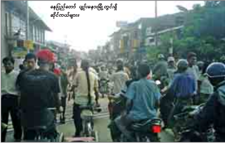
နေပြည်တော် ယဉ်းမနာမြို့တွင်းရှိ ဆိုင်ကယ်များ။

နေပြည်တော်၊ ဇွန်- ၁၁ နေပြည်တော်ခရိုင်အတွင်းရှိ မော်တော်ယာဉ် မှတ်ပုံတင်ပြုလုပ်ထားခြင်းမရှိသေးသော လိုင်စင်မဲ့ဆိုင်ကယ်များအား စာရင်းကောက်ယူ၍ တရားဝင်မှတ်ပုံတင် ပြုလုပ်သွားစေမည်ဖြစ်ကြောင်း နေပြည်တော်ယာဉ်စည်းကမ်းထိန်းသိမ်းရေးကြီးကြပ်မှုကော်မတီမှ တာဝန်ရှိသူတစ်ဦးကပြောသည်။