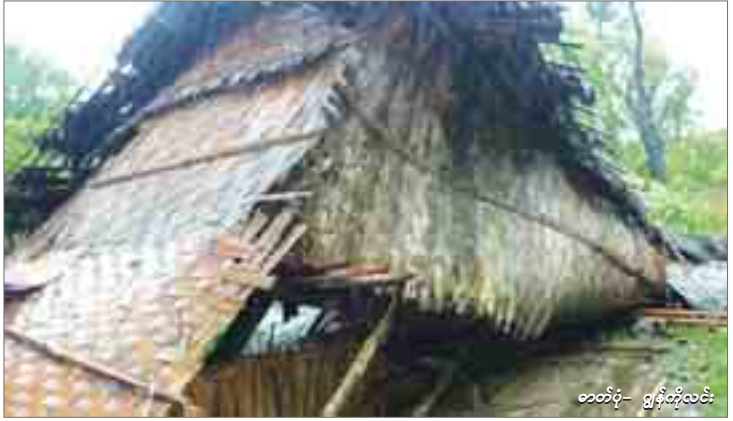
ဓာတ်ပုံ- ဖြန့်တို့လင်း