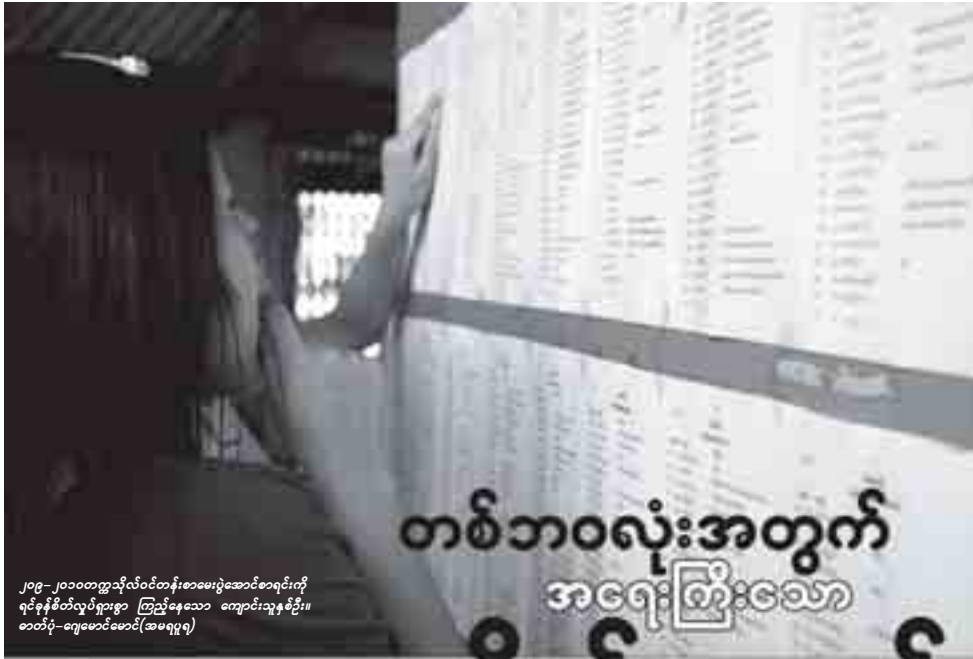
၂၀၀၉-၂၀၁၀ တက္ကသိုလ်ဝင်တန်းစာမေးပွဲအောင်စာရင်းကို ရင်နှစ်စိတ်လှုပ်ရှားစွာ ကြည့်နေသော ကျောင်းသူနှစ်ဦး၊