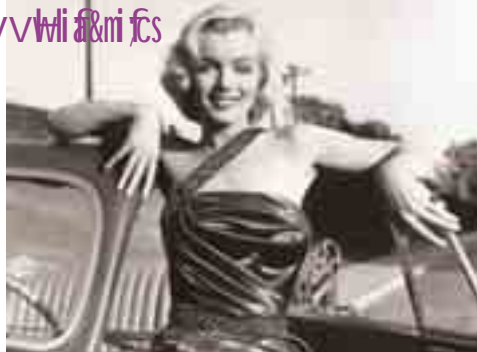
မှာ ပေါင် ၁၈,၈၈၅ ဖြင့်လည်းကောင်း၊ Pirates of Caribbean ဇာတ်ကားမှ ကပ္ပတိန်ဂျက်စပ်ဖိုးဝတ်စုံမှာ ပေါင် ၂၃၆၇ ဖြင့်လည်းကောင်း ရောင်းချခဲ့ရသည်။ ယခု

ဟောလီဝုဒ်၌ ပြုလုပ်သည့် လေလံပွဲများတွင် အကြီးဆုံးဖြစ်သော ယခုလေလံပွဲ၌ ၁၉၃၉ ခုနှစ်ထုတ် ရုပ်ရှင် The Wizard of Oz ဇာတ်ကားမှ မင်းသမီးကြီးမာဂရက်ဟမ်ဗီလ်တန်ဝတ်ဆင်ခဲ့သော မှော်ဦးထုပ်မှာလည်း ပေါင် ၁၃၇,၄၂၀ ဖြင့်လေလံအောင်ခဲ့သည်။ ထို့အပြင် နာမည်ကျော် Indiana Jones And the Last Crusade ဇာတ်ကားတွင်ပါဝင်ခဲ့သော မြင့်မြတ်သည့် ရွှေခွက် Holy Grail မှာ ပေါင် ၁၃,၀၀၀ ဖြင့်လည်းကောင်း၊ မင်းသားဂျွန်နီဒပ်စ်၏ Edward Scissor Hands ဇာတ်ကားမှ ကတ်ကြေးလက်များ