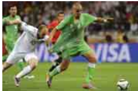
ဟု တန်ဖိုးဖြတ်ဝေဖန်ခဲ့သည်။ ဇာကလည်း “ခွင့်လွှတ်နိုင်စရာမရှိပါ။ အလွန်ဆိုးရွားခဲ့ပြီ” ဟုဆို