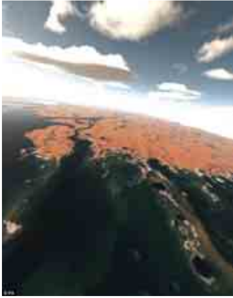
ထိုကျယ်ပြန့်ကြောင်းဆိုသည်။ သို့ ပေါ်မှ ရေများမည်ကဲ့သို့ ကွယ် သော်ပညာရှင်များသည် ဂြိုဟ် ပျောက်သည်ဆိုခြင်းကိုမူ အသေ

နေအဖွဲ့အစည်းအတွင်းမှ ဂြိုဟ် တစ်ခုဖြစ်သော အင်္ဂါဂြိုဟ်သည် တစ်ချိန်က ဂြိုဟ်၏ မျက်နှာပြင် သုံးပုံတစ်ပုံစာခန့်ကျယ်ပြန့်သော ပင်လယ်သမုဒ္ဒရာကြီးတစ်ခုရှိခဲ့ ပြီး ယင်းအချက်ကြောင့် ဂြိုဟ် ပေါ်တွင် ဂြိုဟ်သားများ ပေါက် ဖွားနေထိုင်နိုင်ကြောင်း သိပ္ပံပညာ ရှင်များက ရှာဖွေတွေ့ရှိခဲ့သည်။ အဆိုပါပညာရှင်များသည် ကော်လိုရာဒိုတက္ကသိုလ်မှ ပညာ ရှင်များဖြစ်ပြီး ၎င်းတို့သည်ဂြိုဟ် ပေါ်တွင် ယခုအခါ ခန်းခြောက် လျက်ရှိသော မြစ်ဝကျွန်းပေါ်နေ ရာဟောင်းများ၊ မြစ်ဖိဆင်းနိုင်သော တောင်ကုန်းများရုပ်ပုံထောင်ချီ၍ အသေးစိတ်လေ့လာခဲ့ကာ ဖော် ထုတ်နိုင်ခြင်းဖြစ်သည်။ ဂြိုဟ်ပေါ် ရှိ အဆိုပါသမုဒ္ဒရာသည် လွန်ခဲ့ သောနှစ်ပေါင်း ၃ ဒသမ ၅ တီ လီယံခန့်က ရှိခဲ့ခြင်းဖြစ်ပြီး ဂြိုဟ် မျက်နှာပြင်၏ ၃၆ ရာခိုင်နှုန်းအ