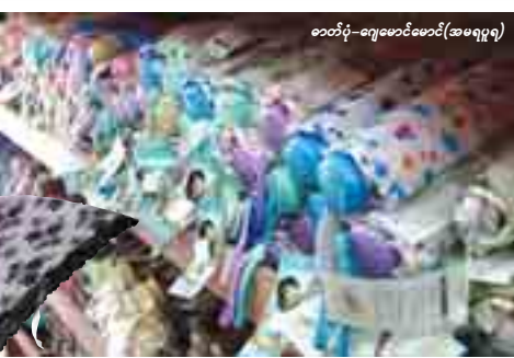
ဓာတ်ပုံ-ရေမောင်းဆောင်(အမရပူရ)