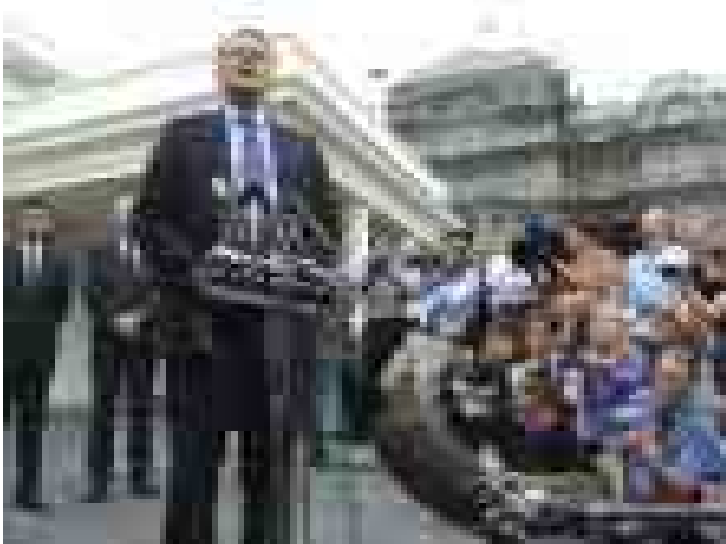
ဝါရှင်တန်၊ ဇွန် - ၁၇ မက္ကဆီကို ပင်လယ်ကွေ့၊ ရေဒီယိုဖိတ်စဉ်မှုကြောင့် ထိခိုက်ခဲ့သူများအား လျှော့ချပေးခြင်းနှင့် ကန့်သတ်ချက်များကို လျှော့ချပေးခြင်းဖြင့် ဝါရှင်တန်၊ ဇွန် - ၁၇