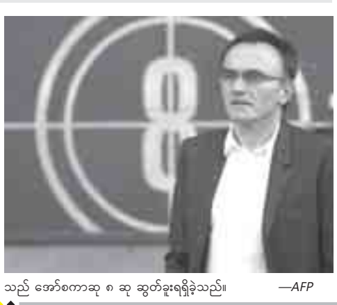
သည် အော်စကာဆု ၈ ဆု ဆွတ်ခူးရရှိခဲ့သည်။

လံပစ်အတွက် ပါဝင်သည့် အခြားထုတ်လုပ်သူသုံးဦးမှာ ဝေကျင်း ၂၀၀၈ အိုလံပစ်၏ ဒီဇိုင်းနာ မာ့စ်ဖရို၊ ဂရုမီနှင့် BAFTA ဆုဆန်ကာတင်ဆရာဝင်ရုပ်သံဒါရိုက်တာဟမ်မစ်ရှ်လမ်းမီလ်တန်၊ ဒိုဟာမြို့တော်တွင်ကျင်းပခဲ့သည့် ၂၀၀၆ အာရှအားကစားပြိုင်ပွဲအတွက် အစီအစဉ်ထုတ်လုပ်သူ ကတ်သရင်း အူဂူတို့ဖြစ်သည်။ ဒါရိုက်တာ ဒန်နီဘိုးဂျင်း၏ ၂၀၀၈ ခုနှစ်တွင် မွင်ဘိုင်းမြို့ အခြေစိုက်ကူးခဲ့သည့် Slumdog Millionaire ဇာတ်ကား