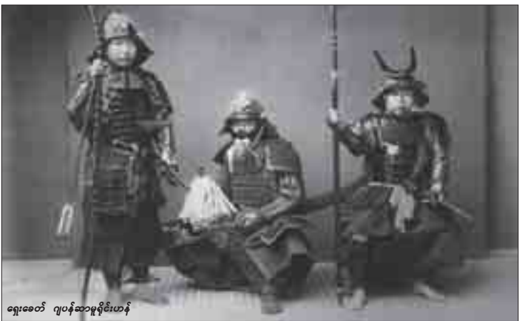
ရှေးခေတ် ဂျပန်ဆာမူရိုင်းဟန်

ရန်ကုန်၊ ဇွန် - ၁၆ ဂျပန်ဆာမူရိုင်းတို့၏ တိုက်ပွဲများတွင် အသုံးပြုသည့်ပညာရပ်တစ်ခုဖြစ်သော TAJUTSU ပညာမှာ မြန်မာနိုင်ငံသို့ လွန်ခဲ့သော ၁၆ နှစ်ကပင် စတင်ရောက်ရှိခဲ့ပြီး ထိုပညာရပ်အားလေ့လာသင်ကြားမှုအနည်းငယ်သာရှိခဲ့ကြောင်း ယင်းပညာရပ်ကိုလာရောက်သရုပ်ပြသော Grand Master Mr. TANAKAKOSHIRO က ကုန်သည်ကြီးများတို့တယ်သရုပ်ပြပွဲ၌ ပြောကြားခဲ့သည်။ ဂျပန်တိုက်ခိုက်ရေးအားကစားများဖြစ်သော ဂျူဒို၊ ကရာတေး စသည်တို့မှာ အားကစားဆန်သောပညာရပ်ဖြစ်ပြီး TAJUTSU ပညာရပ်မှာ (VIP)ခေါ် အရေးကြီးပုဂ္ဂိုလ်များ၏လိုမြဲရေးကို တာဝန်ယူရသော အကြမ်းဖက်အဖွဲ့