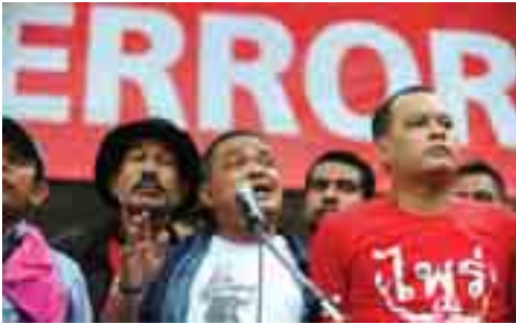
ဘန်ကောက်၊ ဇွန် - ၁၅ ထိုင်းနိုင်ငံ ရာဇဝတ်မှုဆိုင်ရာ တရားရုံးက မကြာသေးမီက ဘန်

ကောက်မြို့လယ်တွင်ဖြစ်ပွားခဲ့ သော အစိုးရဆန့်ကျင်ဆန္ဒပြမှုများ တွင် အကြမ်းဖက်ဝါဒနှင့်ပတ်