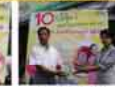
ဦးသန်းလွင်(ပဲခူး) (၇/ခဥန(နိုင်)၀၅၂၄၂၁)