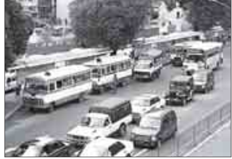
ကြီးအုပ်စုတွင်ပါရှိသည့် တန်နှင့်အထက် ခရီးသည်တင်ယာဉ်များ ထရပ်ကားများမှာမူ အင်ဂျင်ပြောင်းလဲမှုအတွက် ကြိုတင်

ar0i fr &eUkFz&F17 စက်သုံးဆီများကို လွတ်လပ်စွာ ဝယ်ယူနိုင်လာသဖြင့် ယာဉ်ပိုင်ရှင်တချို့က ဆီစားသက်သာသည့် အင်ဂျင်များသို့ပြောင်းလဲရန် စိတ်ဝင်စားလာကြောင်း သိရသည်။ မော်တော်ယာဉ်များ ဓာတ်ဆီမှဒီဇယ်၊ ဒီဇယ်မှဓာတ်ဆီအင်ဂျင်သို့ ပြောင်းလဲမှုများကို ကုန်းလမ်းပို့ဆောင်ရေးဌာနကြားမှူးစီးဌာနမှ ဖွဲ့စည်းပြုစုပေးထားပြီး ကားသေးများမှာမော်တော်ယာဉ်မှတ်ပုံတင်သက်တမ်းတိုးသည့်အခါတွင်မှ အင်ဂျင်ပြောင်းလဲထားမှုကို အသိပေးပြောကြားနိုင်သည်ဟုသိရသည်။ ယာဉ်