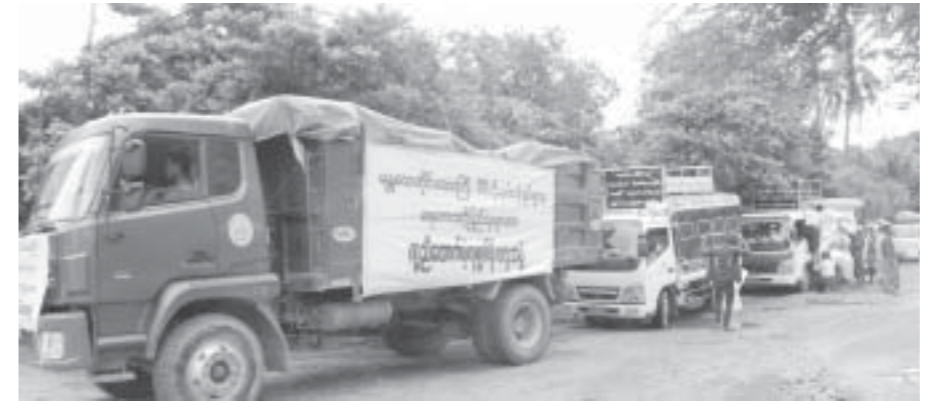
မန္တလေးတိုင်းဒေသကြီးဒီဇိုလုပ်ငန်းရှင်များ၏ ရေဘေးကူညီထောက်ပံ့ရေး

အပါအဝင်လှူဒါန်းငွေတန်ဖိုး သိန်း ၁၀၀ ခန့်ကို ကိုယ်တိုင်သွားရောက် ပေးအပ်လှူဒါန်းခဲ့သည်။ အဆိုပါဒေသများတွင် ရေကြီးပြီးသော်လည်း ပြန်လည်ထူထောင်ရေးနှင့် ကျန်းမာရေးကိစ္စများအား အထူးဆောင်ရွက်ရန် လိုအပ်လျက်ရှိနေသေးကြောင်း သိရှိရသည်။