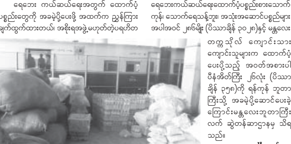
ရေဘေးကယ်ဆယ်ရေးအတွက် ထောက်ပံ့ပေးမည့် အစားအသွယ်များ

ရေဘေးကယ်ဆယ်ရေးအတွက် ထောက်ပံ့ ပစ္စည်းများကို မြန်မာ့မီးရထားမှ အခမဲ့ပို့ဆောင် ပေးလျက်ရှိရာ ဌာနဆိုင်ရာများ၊ NGO INGO အသင်းအဖွဲ့များ၊ အစိုးရအသိအမှတ်ပြုအသင်း အဖွဲ့များမှ ရေဘေးကယ်ဆယ်ရေး ထောက်ပံ့ပစ္စည်း များကို မြန်မာ့မီးရထားဖြင့် သယ်ပို့လိုပါက မြန်မာ့ မီးရထားက သတ်မှတ်ထားသည့် ပုံစံတွင် ဖြည့်စွက် ၍ အခမဲ့ သယ်ယူပို့ဆောင်ပေးနေကြောင်း မြန်မာ့ မီးရထား မန္တလေးဘူတာကြီးမှတာဝန်ရှိသူတစ်ဦး ထံက သိရသည်။ ရေဘေးကယ်ဆယ်ရေးအတွက် ထောက်ပံ့ ပစ္စည်းများ မီးရထားဖြင့် ပို့ဆောင်ရာတွင် မြန်မာ့ မီးရထားဖြင့် အခမဲ့သယ် ပို့ပေးရန်ပုံစံတွင် တင်ပို့သူမှ အမည်၊ အဖွဲ့အစည်းအမည်၊ မှတ်ပုံတင်အမှတ်၊ နေရပ်လိပ်စာ၊ ဆက်သွယ်ရန် ဖုန်းနံပါတ်၊ တင်ပို့ သည့် ပစ္စည်းအမျိုးအစား၊ ပို့မည့်ဘူတာ၊ ပစ္စည်း အရေအတွက်(ပိဿာ)၊ တင်ပို့သည့်ရက်စွဲ၊ ရထား အမှတ်၊ ရွေးယူမည့်သူအမည်၊ အဖွဲ့အစည်းအမည်၊ မှတ်ပုံတင်အမှတ်၊ နေရပ်လိပ်စာ၊ ဖုန်းနံပါတ်တို့ကို ပြည့်စုံစွာ ဖြည့်စွက်ရေးသားပြီး အစိုးရအဖွဲ့ မဟုတ် သည့် ပရဟိတအသင်းများဖြစ်ပါက မြို့နယ် အထွေ ထွေအုပ်ချုပ်ရေးဌာနမှထောက်ခံစာပါရမည်ဖြစ်ကြောင်း သိရသည်။ ရေဘေး ကယ်ဆယ်ရေးအတွက် ထောက်ပံ့ ပစ္စည်းတွေကို အခမဲ့ပို့ပေးဖို့ အထက်က ညွှန်ကြား ချက်ထွက်ထားတယ်။ အစိုးရအဖွဲ့မဟုတ်တဲ့ပရဟိတ