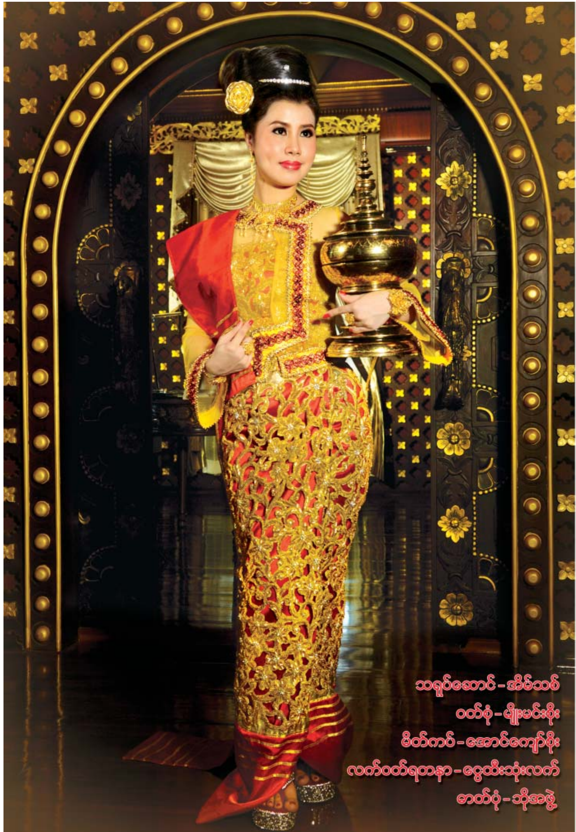
သရုပ်ဆောင် - အိမ်သစ် ဝတ်စုံ - မျိုးမင်းစိုး မိတ်ကပ် - အောင်ကျော်စိုး လက်ဝတ်ရတနာ - ငွေထီးသုံးလက် ဇာတ်ပုံ - သိုအာဖွဲ့