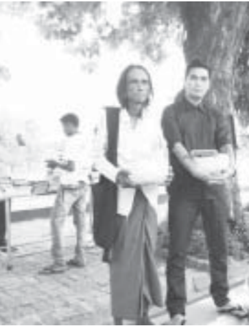
တံဆိပ်၊ ဖဲပြား၊ ရင်ထိုးမပါသော မန္တလေးကဗျာဆရာလုပ်ငန်းများ ရေဘေးကူညီရေးအလှူငွေရရှိရန် စည်းလုံးညီညွတ်စွာလှုပ်ရှားပါဝင်

ဒီလိုအစုအဖွဲ့တွေက ကိုယ့်စေတနာနဲ့ကိုယ် လူပင်ပန်းခံပြီး တစ်နိုင်လံလုံးက ရေဘေးသင့် ပြည်သူတွေကို စာနာစိတ်နဲ့ တတ်စွမ်းသမျှ ကူညီနေကြချိန်မှာ တကယ့်တရား