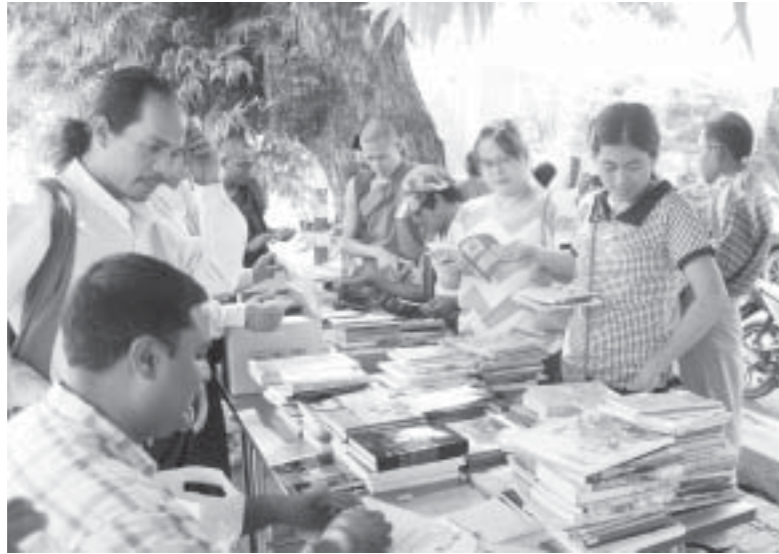
မန္တလေးကဗျာဆရာများရဲ့ ရေဘေးကူညီရေးအလှူငွေအတွက် ကြိုက်တဲ့စာအုပ်ယူ စေတနာရှိသလောက်လှူသွားဆိုတဲ့ အစီအစဉ်

စုတ်လ ပထမပတ်မှာ တစ်နိုင်လံ လုံးက ရေဘေးသင့်ပြည်သူတွေအတွက် အလှူငွေကောက်ခံကြ၊ စားနပ်ရိက္ခာ၊ လူသုံးကုန်၊ အဝတ်အထည်တွေ အလှူခံကြတဲ့ လုပ်ငန်းကို တစ်နိုင်လံလုံးမှာရှိတဲ့ မြို့ကြီး မြို့ငယ်အသီးသီးမှာ အစုအဖွဲ့အသီးသီးက အင်တိုက်အားတိုက် လုပ်ဆောင်ကုသိုလ် ယူကြရာမှာ မန္တလေး လေးပြင်လေးရပ်မှာလည်း မကြုံစဖူးထူးကဲလှတဲ့ ညီညွတ်မှုစည်းလုံးမှုနဲ့ အားတက်သရောရှိမှုကို ပီတိဖြစ်လောက်အောင် တွေ့ခဲ့ပြင်ခဲ့စားခဲ့ကြရပါပြီ။ အဝေးကြီး သွားကြည့်နေစရာမလိုပါဘူး။ မန္တလေးဆိုတော့လည်း ဝင်လွယ်ထွက်လွယ် နားခို လွယ်တဲ့ ြစ်ဘိလမ်းပေါ်က ကျုံးဘက်ခြမ်း၊ ပလက်ဖောင်းကြီးဟာ နေရာကောင်းကြီးပဲပေါ့။ အနောက်ဘက်လမ်း ၈၀ နဲ့ အရှေ့ဘက် ၆၆လမ်းအတွင်းမှာ Vinyl ရောင်စုံတွေနဲ့ ရေဘေးကူ အလှူခံအဖွဲ့တွေ အစီအစဉ်နေရာယူထားကြပါပြီ။ ကိုယ့်မိခင်အစုအဖွဲ့ရဲ့ အမည်နာမ အမှတ်တံဆိပ်တွေနဲ့ တက်ကြွနေကြပါတယ်။ လုပ်အားပေး စေတနာ့ဝန်ထမ်း အများစုဟာ လူငယ်တွေပါပဲ။ ကျောင်းသားအရွယ်တွေပါပဲ။ ကျောင်းသားတွေ ကိုယ်တိုင်ပါပဲ။ ကျောင်းသား အစုအဖွဲ့ အများစုဟာ မန္တလေးမြို့ပေါ်က တက္ကသိုလ်ပေါင်းစုံက ကျောင်းသားတွေပါပဲ။