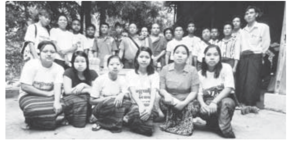
အမရပူရ ဝဲကြီးဆင်ရွာ မေတ္တာအရိပ်ကျန်းမာရေးစောင့်ရှောက်မှုအသင်းက ချောက်မြို့နယ် ဥယျာဉ်အုပ်စုနှင့် စလင်းမြို့နယ် ချင်းပြစ်ကျွန်းရွာ ရေဘေးအလှူ