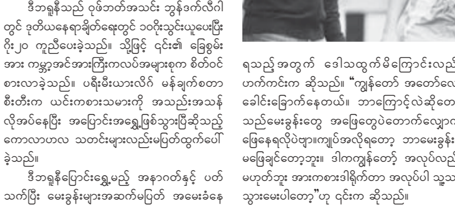
ရသည့်အတွက် ဒေါသထွက်မိကြောင်းလည်း ဟက်ကင်းက ဆိုသည်။ “ကျွန်တော် အတော်လေး ခေါင်းခြောက်နေတယ်။ ဘာကြောင့်လဲဆိုတော့ သည်မေးခွန်းတွေ အဖြေတွေပဲတောက်လျှောက် ဖြေနေရလို့ပဲဗျာ။ ကျုပ်အလိုရတော့ ဘာမေးခွန်းမှ မဖြေချင်တော့ဘူး။ ဒါကကျွန်တော့် အလုပ်လည်း မဟုတ်ဘူး အားကစားဒါရိုက်တာ အလုပ်ပါ သူ့ဘာ သွားမေးပါတော့”ဟု ၎င်းက ဆိုသည်။

ဂုဏ်ဘတ်နည်းပြ ဒီယက်တာဟက်ကင်းက အသင်း၏နာမည်ကျော် ကစားသမားတစ်ဦးဖြစ် သည့် ကယ်ဒင်ဒီဘရူနို အနာဂတ်နှင့်ပတ်သက်ပြီး ဖြစ်ပေါ်နေသည့် ကောလာဟလများကို စိတ်ပျက်မိ ကြောင်းပြောဆိုလိုက်သည်။ အဆိုပါ ဘယ်လ်ဂျီယံ ကစားသမားသည် ပြီးခဲ့သည့် ဘောလုံးရာသီက ဂုဏ်ဘတ်အသင်းနှင့် အောင်မြင်မှုရရှိခဲ့ပြီးနောက် ကမ္ဘာ့တန်ဖိုးအရှိဆုံး ကစားသမားတစ်ဦးဖြစ်လာ ခဲ့သည်။ ဒီဘရူနိုသည် ဂုဏ်ဘတ်အသင်း ဘွန်ဒက်လီဂါ တွင် ဒုတိယနေရာချိတ်နေတွင် ၁၀ဂိုးသွင်းယူပေးပြီး ဂိုး၂၀ ကူညီပေးခဲ့သည်။ သို့ဖြင့် ၎င်း၏ ခြေစွမ်း အား ကမ္ဘာ့အင်အားကြီးကလပ်အများစုက စိတ်ဝင် စားလာခဲ့သည်။ ပရီးမီးယားလိဂ် မန်ချက်စတာ စီးတီးက ယင်းကစားသမားကို အသည်းအသန် လိုအပ်နေပြီး အပြောင်းအရွှေ့ဖြစ်သွားပြီဆိုသည့် ကောလာဟလ သတင်းများလည်းမပြတ်ထွက်ပေါ် ခဲ့သည်။ ဒီဘရူနိုပြောင်းရွှေ့မည့် အနာဂတ်နှင့် ပတ် သက်ပြီး မေးခွန်းများအဆက်မပြတ် အမေးခံနေ