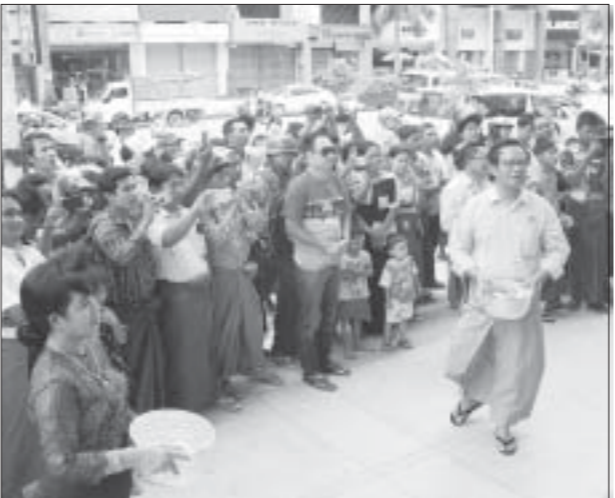
ပိုင်းမှန်းပလာစာရှေ့ မြန်မာနိုင်ငံသဘင်ဖောင်ဒေးရှင်း ရေဘေးကူညီရေး လှုပ်ရှားမှု