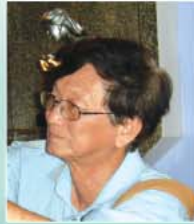
စကားလက်ခောင်း

ရိုသားလို့၊ ပွင့်လင်းလို့ အခွင့်အရေးတွေ ဆုံးရှုံးကောင်း၊ ဆုံးရှုံးလိမ့်မယ် ဘာပဲဖြစ်ဖြစ် ရိုသားပါ၊ ပွင့်လင်းပါ။