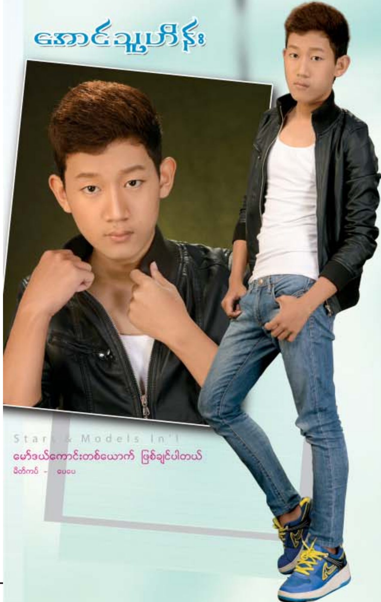
Star Models in 1 မော်ဒယ်ကောင်းတစ်ယောက် ဖြစ်ချင်ပါတယ် မိတ်ကပ် - ပေပေ