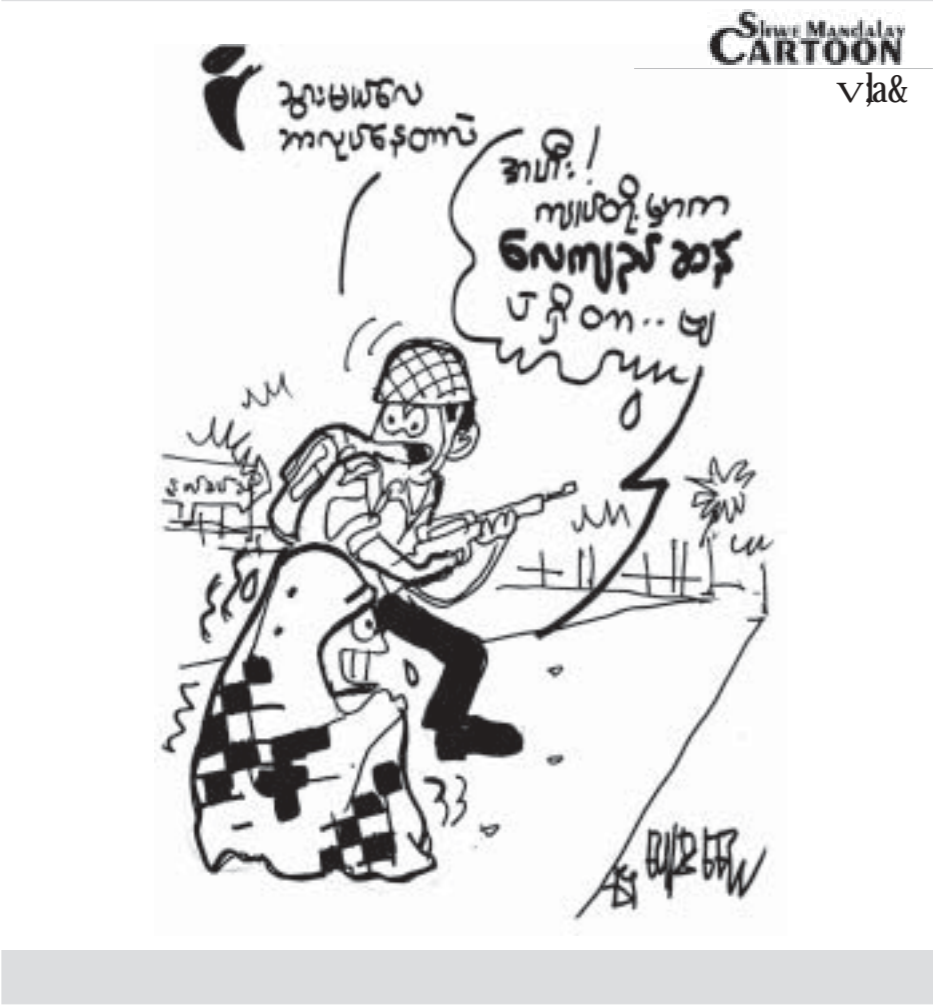
ShweMandalay Cartoon vja&

ချင်းတွင်းမြစ်ကြောင်းတွင် ယခုကဲ့သို့ ရေယာဉ်တိမ်းမှောက် နှစ်မြှုပ်မှုဖြစ်စဉ်များ များစွာမြစ်