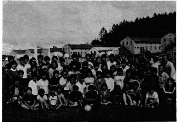
「미국속의 한국인」 청소년 하기 캠프