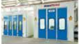
Paint booth exterior