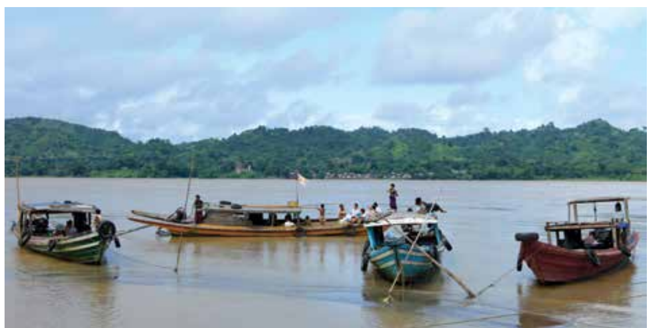
ပြည်မြို့ဘက်ခြမ်းမှ မြင်တွေ့ရသည့် ရောဂါနှင့်ချင်းတွင်းဖြစ်ရေ

ဟင်းတာရာတွင် နည်းပညာ၊ စက်ပစ္စည်းလိုအပ်ချက်ကြောင့် ကမ္ဘာ့ကျန်းမာရေးအဖွဲ့က သတ်မှတ်ထားသည့် စံနှုန်းများဖြစ်သည့် PH၊ ရေတွင်ပျော်ဝင်သော အောက်အထိ ကမ္ဘာပေါ်တွင် မသတ်မှတ်ရသေးသောကြောင့် ကမ္ဘာ့ကျန်းမာရေးအဖွဲ့က သောက်သုံးရေ သတ်မှတ်ချက် စံနှုန်းများဖြင့်သာ တိုင်းတာခြင်းဖြစ်ကြောင်း အထက်ပါဌာနမှ တာဝန်ရှိသူတစ်ဦးက ပြောသည်။