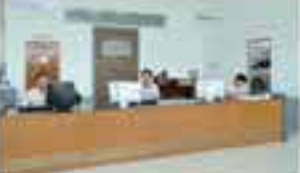
Service reception area