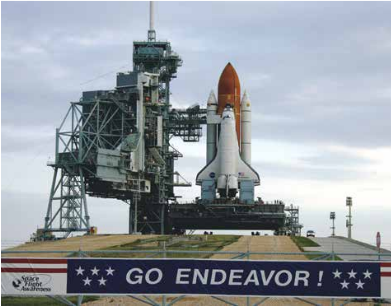
၂၀၀၇ ခုနှစ် ဇူလိုင် ၁၁ ရက်က အမေရိကန်အာကာသလွန်းပျံယာဉ် Endeavour အား ဖလော်ရီဒါပြည်နယ် ကနေဒီအာကာသစခန်းရှိ ပစ်လွှတ်စဉ်အမှတ် 39-A တွင် အဆင်သင့် ပြင်ဆင်ထားသည်ကို တွေ့ရစဉ်

အဆိုပါ ပြေးပွဲကို ပြည်တွင်း အပြေးပြိုင်ပွဲအဖွဲ့ များနှင့် စီးပွားရေးလုပ်ငန်းများက စည်းရုံးခဲ့ပြီး လူမှုရေးမီဒီယာများမှ တစ်ဆင့် အများပြည်သူသိရှိစေရန် လုပ်ဆောင်ခဲ့သည်။ ၎င်းပြေးပွဲကို One Run ဟု အမည်ပေးထားပြီး ပြေးပွဲ၏ဆောင်ပုဒ်မှာ “ငါတို့ပန်းဝင်ရမည်” ဟူ၍ ဖြစ်သည်။ အီလီနွိုက်၊ အင်ဒီယားနား၊ ကင်တပ်တီ၊ မီချီဂန်နှင့် အိုဟိုင်းယိုးပြည်နယ်များမှ အပြေးသမား ၃၅ ဦးသည်လည်း ဘော်စတွန်မာရသွန်ပြေးပွဲကို အဆုံးမသတ်နိုင်ခဲ့သောကြောင့် မေလ ၂၆ ရက်တွင် နာမည်ကျော် အင်ဒီယာနာပူးလစ် ကားမောင်းပြိုင်ပွဲတွင်း၌ ပရိသတ်ထောင်ပေါင်းများစွာရှေ့တွင် ကွေ့နံပါတ် ၄ မှနေ၍ မိုင်ဝက်ခန့်ပြေးကာ ပန်းတိုင်သို့ စနစ်တကျပန်းဝင်မည်ဖြစ်သည်။ “ဘော်စတွန်မှာ ဖြစ်ခဲ့တဲ့ ဝမ်းနည်းကြေကွဲဖွယ် အဖြစ်အပျက်က လူတိုင်းရင်ထဲမှာ ကျန်ရှိနေတုန်းပဲ။ ဒါကြောင့် အပြေးသမားတွေကို ပရိသတ်တွေရဲ့ရှေ့မှာ အပြေးပြိုင်ပွဲကို အဆုံးသတ်ဖို့ အခွင့်အရေးပေးချင်ခဲ့ပါတယ်” ဟု အင်ဒီယာနာပူးလစ် ကားမောင်းပြိုင်ပွဲကျင်းပရေးပုဂ္ဂိုလ်တစ်ဦးက ပြောသည်။ ကားမောင်းပြိုင်ပွဲတွင်းအဖွဲ့အရာရှိများသည် ဘော်စတွန်အားကစားသမားများအဖွဲ့သို့ ပြိုင်ပွဲဆက်လုပ်ခွင့်ပေးရန် ဆက်သွယ်အကြောင်းကြားခဲ့ပြီးနောက် ဘော်စတွန်အားကစားသမားများအဖွဲ့ကလည်း အင်ဒီယားနားပြည်နယ်နှင့် အခြားပြည်နယ်များရှိ ပြိုင်ပွဲအဆုံးမသတ်နိုင်ခဲ့သော အပြေးသမားများထံ အကြောင်းကြားပေးခဲ့သည်။ —Ref: AFP