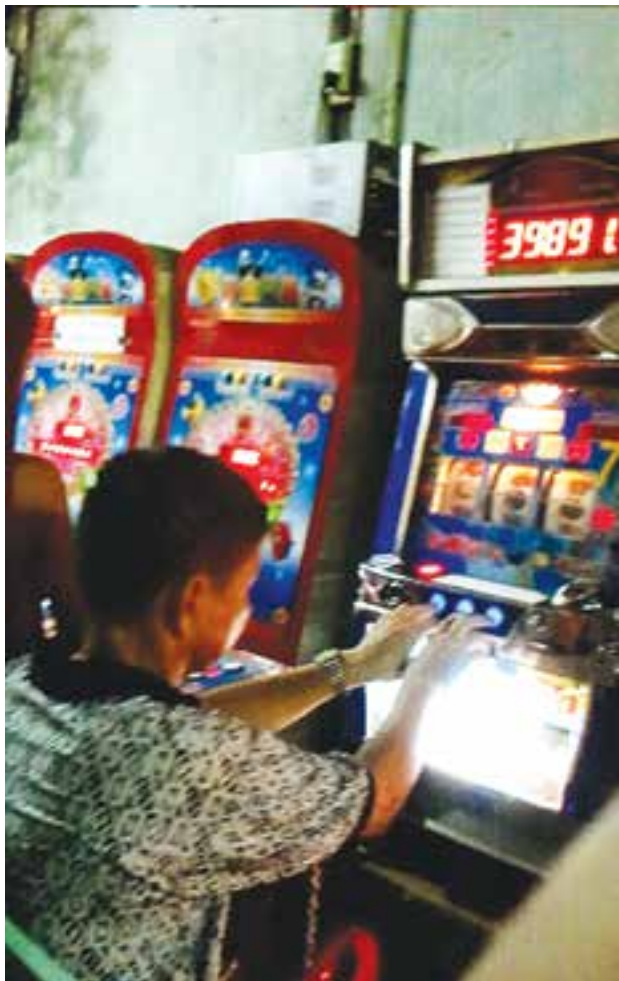
ငါးမန်းရုံတစ်ခုအတွင်း ဆော့ကစားနေသူများ မတ်ပုံ-ကျော်ဇင်သန်း မှ မိမိကြိုက်နှစ်သက်သည့် အကောင်ကို ရွေးပြီး ထိုးနိုင်သည်။ မိမိထိုးထားသည့် အကောင်ကျပါက လျော်ကြေးငွေကို သတ်မှတ်

ဘူး။ မိသားစုစားဝတ်နေရေး အလွန်ဒုက္ခရောက်တယ်” ဟု တက္ကစီယာဉ်မောင်းတစ်ဦးက ဆိုသည်။ ယခုဖွင့်လှစ်သည့်ကာစီနိုဂိမ်းစက်များမှာ ငမန်း၊ စင်ရော်၊ ကျီးကန်း၊ ခို၊ ဝက်ဝံ၊ ခြင်္သေ့စသည်ဖြင့် အရုပ်များစွာ ပါဝင်သည်။ အရုပ်တစ်ခုချင်းစီလိုက်၍ ခလုတ်ခုံပေါ်မှ လျော်ပေးမည့်ငွေပမာဏမှာ တူညီမှု မရှိဘဲ ကွဲပြားသည်။ မိမိလောင်းကြေး ထိုးလိုက်သည့် ပမာဏပေါ်မူတည်၍ လျော်ကြေးငွေရပါက လေးဆ၊ ခြောက်ဆ၊ ရှစ်ဆ၊ ဆယ်နှစ်ဆနှင့် ငါးမန်းပွက်ပါက ၂၄ဆ အထိလျော်ကြေးရနိုင်ကြောင်း ယင်းကာစီနိုကို စွဲမြဲစွာ ကစားသူက ပြောသည်။ ကာစီနိုစက်မှ ပေးလျော်မှုမှာ လျှပ်စစ်ကိန်းဂဏန်းလေးများဖြစ်ပြီး ယင်းကိုဆိုင်ရှင်လည်း ဖြစ်၊ ခိုင်လည်းဖြစ်သူက ငွေကြေးနှင့်ပြန်လည်ပေးလျော်သည်။ စက်တွင်ပါဝင်သော အကောင်များထဲ