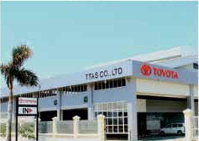
Building and entrance

တစ်လလျှင်ကားအစီးရေ (၈၀) အထိဝန်ဆောင်မှုပေးနိုင်တဲ့ ကျွန်ုပ်တို့ရဲ့အသစ်ဖွင့်လှစ်လိုက်တဲ့ TTAS ကားဘော်ဒီရုံနှင့်ဆေးမှတ်စင်တာမှာ ကားဘော်ဒီပြုပြင်ခြင်းနှင့် ဆေးမှတ်လုပ်ငန်း လုပ်ကိုင်ရန်အတွက် နေရာ(၁၂) နေရာ၊ ကားဆီထိုးနှင့် အင်ဂျင်ဘိုင်လဲလှယ်ခြင်းလုပ်ငန်း လုပ်ကိုင်ရန်အတွက် နေရာ(၄) နေရာနှင့် စွယ်စုံဆေးမှတ်၊ မောင်းတင်ရုံ (၂) ရုံ ပါရှိတဲ့အပြင် ယာဉ်ပိုင်ရှင်များသက်တောင့်သက်သာ စောင့်ဆိုင်းဖို့အတွက် အဆင့်မြင့်နားနေဆောင် တစ်ခုလည်းပါရှိပါတယ်။