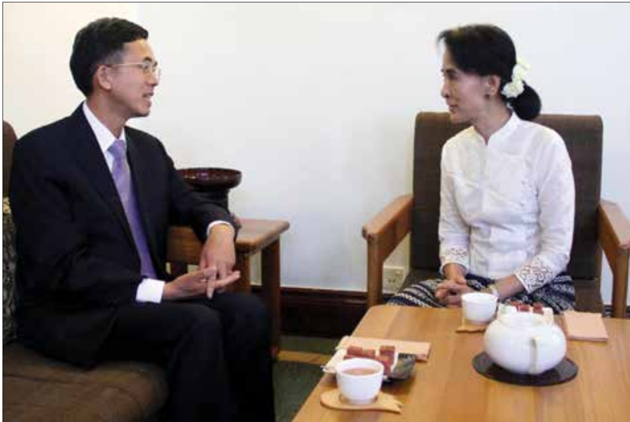
မြန်မာနိုင်ငံဆိုင်ရာတရုတ်သံမတ်သစ် Yang Houlan တက္ကသိုလ်ရိုက်သားလမ်းရှိ အောင်ဆန်းစုကြည်၏ နေအိမ်သို့ ဧည့်သည်ရောက်လာရောက်တွေ့ဆုံစဉ်

1375 ငွေပေး ပုဂံမြို့နယ်အုပ်ချုပ်ရေးအဖွဲ့ (အ. 29 ? 2013)