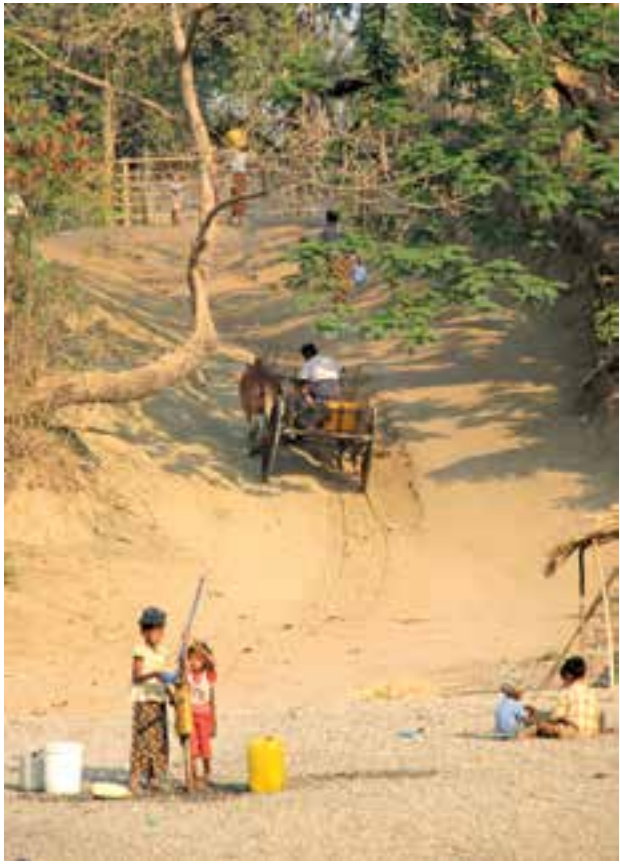
ရေတိုကပ်မှ ရေနှိပ်ယူနေသည့်ကလေးငယ် နှစ်ဦးအား ရွှေစက်တော်ဘုရားအနီးတွေရစဉ်

လွန်ခဲ့သည့်နှစ်၅၀ ဝန်းကျင် က ဂျပန်နိုင်ငံတွင်လည်း မြန်မာ နိုင်ငံအပူပိုင်းဇုန်ကဲ့သို့ ကြုံတွေ့ဖူး ကြောင်း၊ ကမ္ဘာ့ဘဏ်မှ နည်းပညာ ငွေကြေးအကူအညီများ ဆောင် ရွက်ခဲ့ရာယနေအချိန်တွင်သစ်သီး ဝလံနှင့် ဆန်အဓိကထွက်သော ဒေသဖြစ်နေကြောင်း အထက်