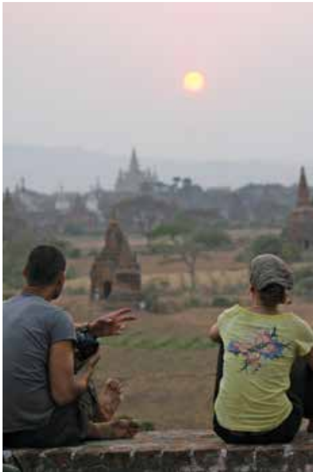
ပုဂံဆည်းဆာနှင့် နိုင်ငံခြားခရီးသွား နှစ်ဦး

ခိုင်ချို ရန်ကုန်၊ မေ-၂၅ ပုဂံရှေးဟောင်းယဉ်ကျေးမှုနယ်မြေတွင် နေဝင်ချိန်ကြည့်ရှုရန်အတွက် စေတီပုထိုးနှစ်ဆူထပ်မံခွင့်ပြုပေးရန် ဟိုတယ်နှင့် ခရီးသွားလာရေးလုပ်ငန်းဝန်ကြီးဌာနသို့ မြန်မာနိုင်ငံညွှန်လမ်းညွှန်များအသင်းက တင်ပြတောင်းဆိုထားကြောင်း သတင်းရရှိသည်။