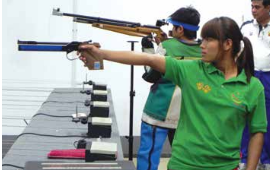
နေပြည်တော်ရှိ ရွှေအားကစားလေ့ကျင့်ရေးစခန်းတွင် လေ့ကျင့်နေသောမြန်မာအားကစားသမားများ