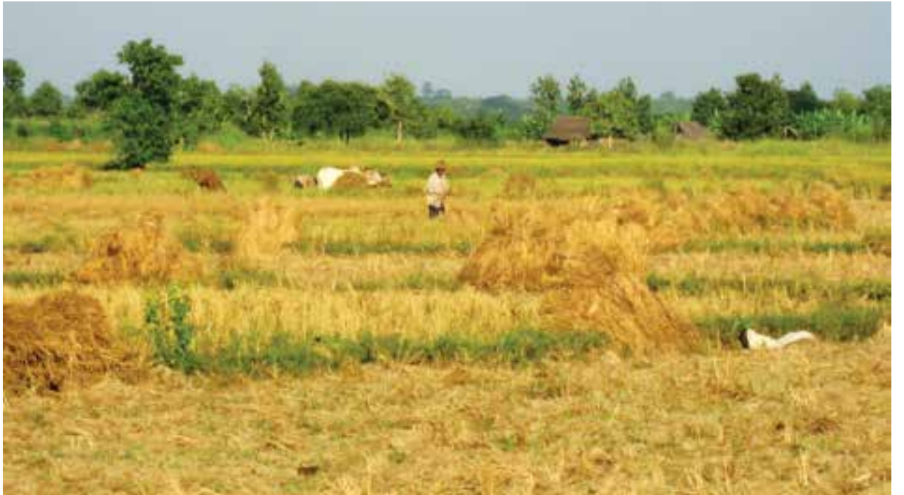
နေပြည်တော်အနီးရှိ လယ်ယာမြေများတွင် စပါးရိတ်သိမ်းနေစဉ်