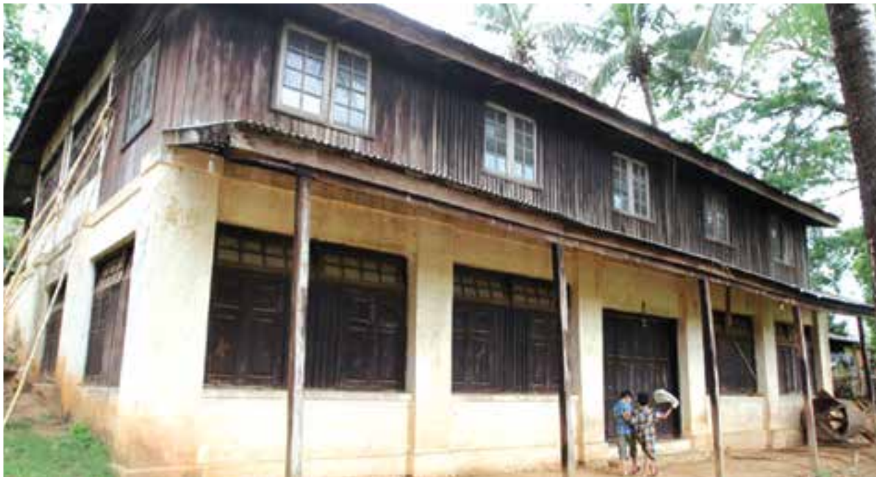
ကမ္ဘာလှည့်ခရီးသွားများစိတ်ဝင်စားသော ကသာမြို့ရှိအင်္ဂလိပ်အရာရှိများကလပ်အဆောက်အအုံ

ကမ္ဘာကျော်စာရေးဆရာကြီးဂျော့ အော်ဝဲလ်နေထိုင်ခဲ့ရာ ကိုလိုနီခေတ် အဆောက်အအုံဖြစ်သည့် စစ်ကိုင်းတိုင်း၊ ကသာမြို့ရှိ နိုင်ငံခြားဧည့်သည်များ မျက်စိကျရာ အင်္ဂလိပ်အရာရှိများကလပ်သည် ပျက်စီးနေပြီး ထိန်းသိမ်းစောင့်ရှောက်မှုလိုအပ်နေကြောင်း နယူးယောက်တိုင်းမ် သတင်းစာက ရေးသားထားသည်။