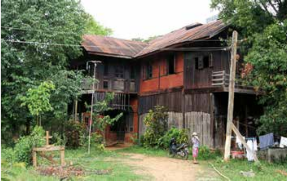
ကမ္ဘာကျော် ဗြိတိသျှ စာရေးဆရာ ဂျော့အော်ဝဲလ် နေထိုင်ခဲ့သောအိမ်

သော နေရာတစ်ခုအဖြစ် ဝေးလံအထီးကျန်စွာ ရှိနေပြန်၏။ ဗြိတိသျှရဲအရာရှိ တစ်ဦးအဖြစ် မြန်မာနိုင်ငံအဝန်း၌ ငါးနှစ်ကြာ တာဝန်ထမ်းဆောင်ခဲ့သည့် ဂျော့အော်ဝဲလ်က ၁၉၂၇ တွင် ကသာမှာ နောက်ဆုံးတာဝန်ကျခဲ့ပါသည်။ ထိုဒေသ၌ ဂျော့အော်ဝဲလ် ကြွင်းကျန်ခဲ့သည့် နောက်ဆုံးအငွေအသက်များမှာ မီးလင်းဖိုနှင့် တစ်ချိန်က ခဲညားခဲသည့် လှေကားထပ်များ ရှိရာ နှစ်ထပ်သစ်သားအိမ်တစ်လုံးသာ ဖြစ်သည်။ အိမ်နံရံများမှာ ဆေးကွာကျနေပြီး အိမ်ထဲမှာလည်း ဖုန်မှုန့်များ ဖုံးအုပ်နေသည်။ တစ်ချိန်က ဂျော့အော်ဝဲလ်၏ အစေခံများ ချက်ပြုတ်ခဲ့ရာ မီးဖိုချောင်မှာလည်း ပျက်စီးနေပြီး အမိုးများက ကြမ်းပြင်ပေါ်မှာ အပြည့်။ အစိုးရအရာရှိတစ်ဦး၏ မိသားစုဝင်များက အိမ်အဆောင်တစ်ခု အတွင်းမှာ ရှိနေကြပြီး အိမ်ရှေ့တံခါးမကြီး၏ အပြင်ဘက်တွင် သူတို့၏ အဝတ်များကိုလှန်းထားကြသည်။ လူဦးရေ ၂၃,၈၃၀ ရှိသည့် ထို