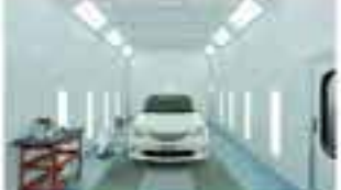
Paint booth interior