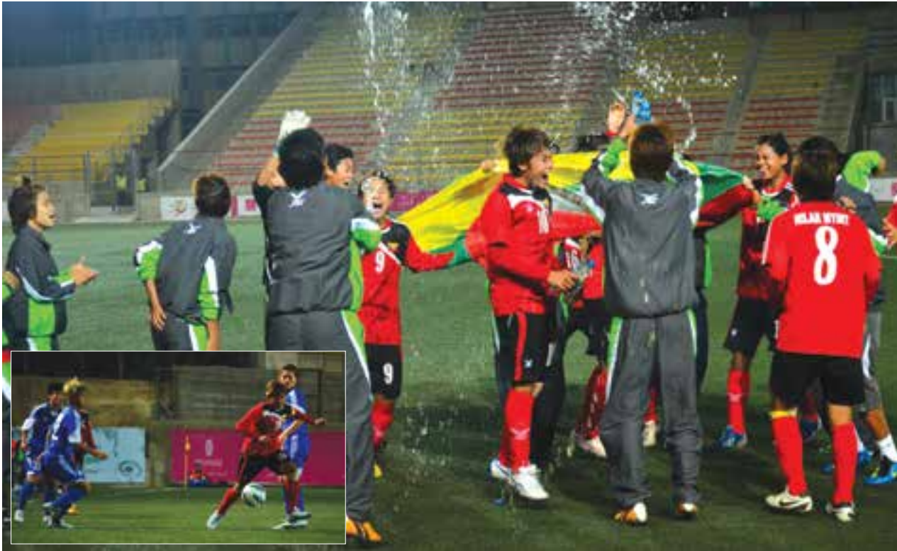
တရုတ်(တိုင်ပေ)နှင့်ပွဲအပြီး ခြေစစ်ပွဲအောင်၍ အောင်ပွဲခံနေသော မြန်မာအမျိုးသမီးအသင်း(ပုံ-ကြီး)၊ ဂိုးမရှိသရေကျခဲ့သော ခြေစစ်ပွဲတွင် မြန်မာနှင့်တရုတ်(တိုင်ပေ)ယှဉ်ပြိုင်နေစဉ်(ပုံ-သေး)