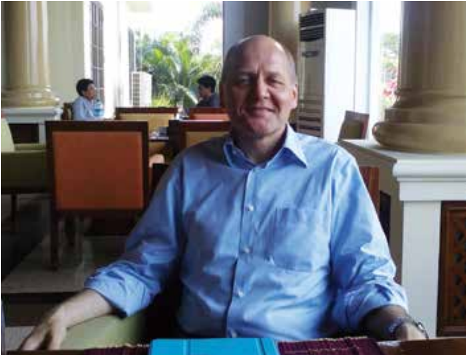
Telenor အမှုဆောင် ဒုဥက္ကဋ္ဌ Mr.Sigre Brekke

နိုင်ချီ မြန်မာနိုင်ငံတွင် တယ်လီဖုန်းဆက်သွယ်ရေးလုပ်ငန်း လုပ်ကိုင်ခွင့် အတွက် ကမ္ဘာ့ထိပ်သီးမိုဘိုင်း ဖုန်းကုမ္ပဏီများအပါအဝင် နိုင်ငံတကာကုမ္ပဏီများက အပြိုင်အဆိုင် ကြိုးပမ်းလျက်ရှိသည်။ ဆက်သွယ်ရေးအော်ပရေတာ နှစ်နေရာအတွက် ပဏာမရွေးချယ်ခံရသော ကုမ္ပဏီအချို့ကလည်း ပြည်တွင်း မီဒီယာများမှတစ်ဆင့် ထိတွေ့ပြောဆိုခွင့်ရရန် ကြိုးပမ်းနေကြသည်။