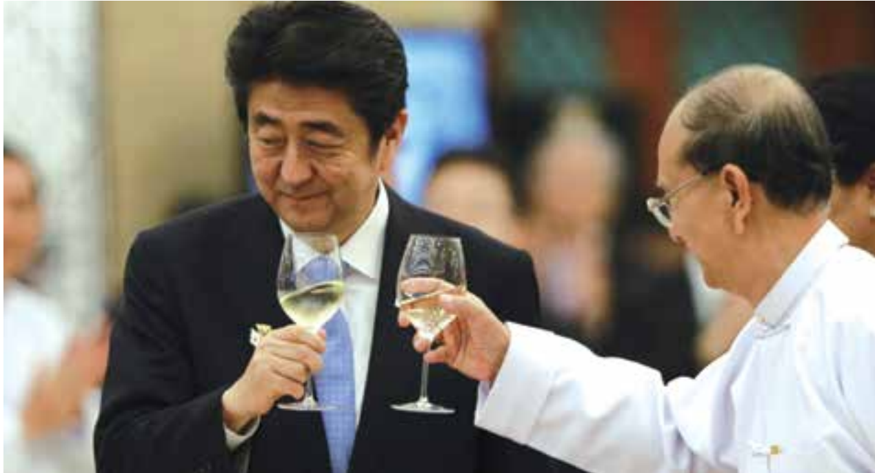
သမ္မတဦးသိန်းစိန်နှင့် ဂျပန်ဝန်ကြီးချုပ် ရှင်ဆိုအာဘေးတို့ကို တွေ့ရစဉ်