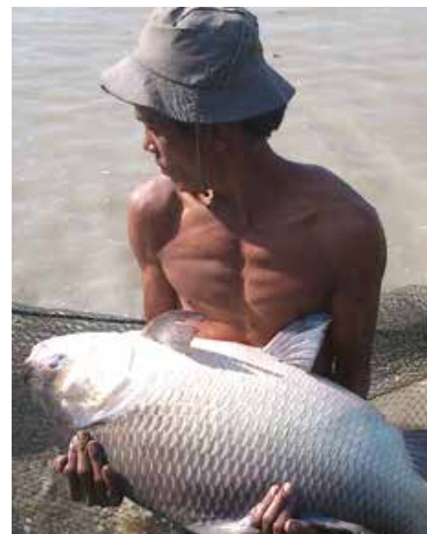
ငါးမွေးကန်အတွင်းမှ ငါးကိုဖမ်းယူနေသော ရေလုပ်သားတစ်ဦး