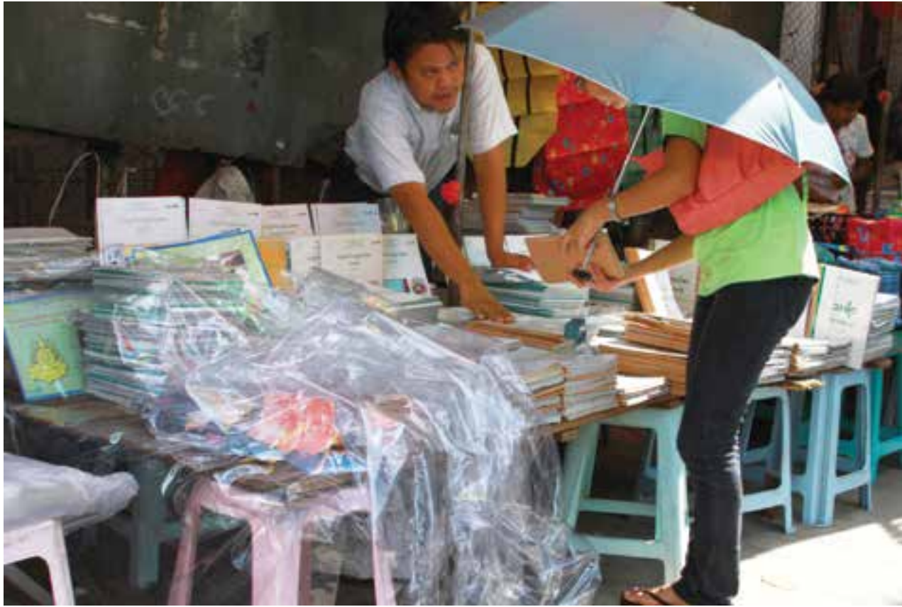
ကျောင်းသုံးပြဋ္ဌာန်းစာအုပ်များရောင်းသည့်ဆိုင်တွင် ဝယ်ယူနေသူတစ်ဦး တွေ့ရစဉ်