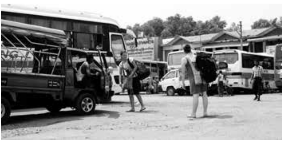
အောင်မင်္ဂလာအဝေးပြေးယာဉ်ရပ်နားစခန်းကို တွေ့ရစဉ်

ထိုဆိုက်ရောက်စနစ်ဆောင်ရွက်မှု ပြီးစီးပါက အဝေးပြေးကားကြီးအစီး ၃၀ တစ်ပြိုင်နက် ရပ်နား