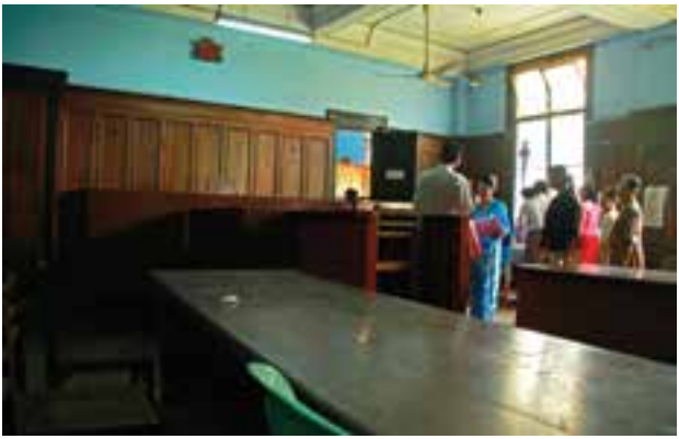
တရားခွင်တစ်ခုမြင်ကွင်း

နိုင်ငံတကာတရားရုံးများက အသရေပျက်မှု (Defamation) ကို တရားမမှုကြောင်းအရ စွဲဆိုပြီး နစ်နာကြေးတောင်းဆို စေသည့် လမ်းကြောင်းကိုသာ လက်ခံကျင့် သုံးနေသော်လည်း မြန်မာနိုင်ငံ