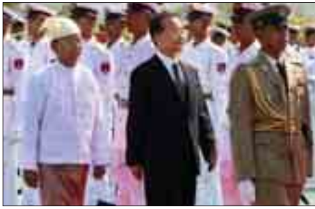
နိုင်ငံတော်ဝန်ကြီးချုပ် ဦးသိန်းစိန်နှင့် တရုတ်ပြည်သူ့သမ္မတနိုင်ငံ နိုင်ငံတော်ကောင်စီဝန်ကြီးချုပ် မစ္စတာဝမ်ကြွေးပေါင်တို့ ဂုဏ်ပြုတံခွဲကို ဖော်ဆောင်ကြစဉ်။