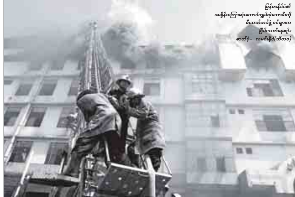
မြန်မာနိုင်ငံ၏ အချိန်အကြာဆုံးလောင်ကျွမ်းခဲ့သောမီးကို မီးသတ်တပ်ဖွဲ့ဝင်များက ငြိမ်းသတ်နေစဉ်

မေး - မေလ ၂၄ ရက်က မြစ်ပွားခဲတဲ့ မင်္ဂလာဈေးမီးလောင်မှုက မီးသတ်တပ်ဖွဲ့ရဲ့ သက်တမ်းမှာ အချိန်အကြာဆုံးမီးလို့ ပြောလို့ရနိုင်မလား။ ဖြေ - အချိန်အကြာဆုံး ငြိမ်းသတ်ခဲ့ရတဲ့ မီးလို့ပြောလို့ရတယ်။ မီးသတ်တပ်ဖွဲ့တွေအတွက်လဲ အခက်ခဲဆုံး၊ အပင်ပန်းဆုံး မီးလို့ ပြောလို့ပါရတယ်။ အရင်မှတ်တမ်းထဲမှာအခြားအချိန်အကြာဆုံးလောင်ခဲ့တဲ့မီးကတော့ ၂၀၀၄ခုနှစ်လောက်ကဖြစ်မယ်။ အဖျောက်မှာလောင်ခဲ့တဲ့ အဖျောက်ရေနံမြေသဘာဝဓာတ်ငွေ့တွင်းတစ်တွင်းမီးလောင်မှုပါ။ နာရီပေါင်း ၂၆ နာရီကြာငြိမ်းခဲ့ရတယ်။ အခု မင်္ဂလာဈေးကတော့ ပိုပြီးကြာသွားတာပေါ့။ နာရီ ၅၀လောက်ကြာအောင်ဆက်တိုက် ငြိမ်းလိုက်ရတယ်။ ၃ ရက်နီးပါးလောက်ကြာသွားတာပေါ့။