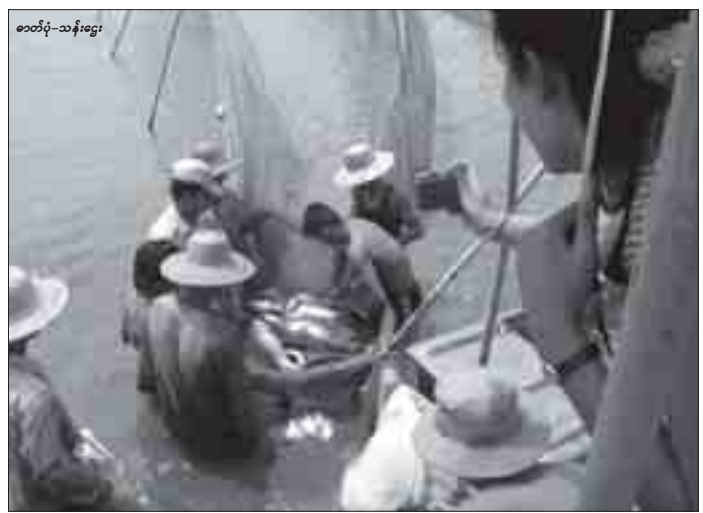
စတီဖု-သန်းငွေ

ကိုအတည်ပြုပြီး အီးယူစနစ်နဲ့ပညာမညီညွှန်ခြင်းချင်တဲ့သင်္ဘောပါ” ဟု မြန်မာနိုင်ငံရေထွက်ပစ္စည်းထုတ်လုပ်သူများနှင့်ပို့ကုန်လုပ်ငန်းရှင်များအသင်း MPEA မှ တာဝန်ရှိသူတစ်ဦးက 7Day News သို့ ပြောသည်။ အဆိုပါအကြောင်းကြားစာကို ဘယ်လိုရှိယံနိုင်ငံ ဘရပ်ဆဲလ်မြို့ရှိ အီးယူကော်မရှင်ရုံးမှ မြန်မာနိုင်ငံသို့ပို့ခဲ့ခြင်းဖြစ်သည်။ ကျန်းမာရေးနှင့်စားသုံးသူများ ဦးဆောင်ညွှန်ကြားရေးမှူးရုံးမှတစ်ဆင့် တိရစ္ဆာန်ကျန်းမာရေးနှင့်ပူလုံရေးမှူးညွှန်ကြားရေးမှူးမစ္စတာဘားနတ်စ် ဗင်ဂိုသန်က အဆိုပါ အကြောင်းကြားစာပို့ခဲ့ခြင်းဖြစ်သည်။ အဆိုပါ အီးယူကော်မရှင်ရုံးမှ တာဝန်ရှိသူက တတိယနိုင်ငံများသို့ မေးမြန်းခဲ့ကြောင်းသိရသည်။ မြန်မာနိုင်ငံသည် အီးယူအသိအမှတ်ပြုနိုင်ငံဖြစ်သောကြောင့် ယခုကဲ့သို့ အကြောင်းကြားစာရခဲ့ကြောင်း MPEA မှ တာဝန်ရှိသူက ပြောသည်။