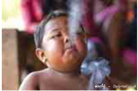
၁၀၀၄

ဂျကာတာ ၅ ဇွန် - အင်ဒိုနီးရှားနိုင်ငံသူ မိခင်တစ်ဦးသည် သူမ၏ ၂ နှစ်အရွယ်ကလေးငယ်က ဆေးလိပ်စွဲနေသဖြင့် ဆေးလိပ်ဖြတ်ရေး အကူအညီများရရန် မြို့တော်ဂျကာတာသို့ ရောက်လာခဲ့ကြောင်း အင်ဒိုတာဝန်ရှိသူများက အတည်ပြုလိုက်သည်။ စီအန်အန်သတင်း၏ အဆိုအရလည်း အဆိုပါဆေးလိပ်စွဲနေသည့် ကလေးငယ်က ဆေး