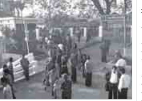
ဘူးသီးတောင်မြို့၊ ဆိပ်ကမ်းတစ်နေရာကို တွေ့ရစဉ်။

“စစ်တွေ-ဘူးသီးတောင် ရေ ကြောင်းခရီးတာခရီးသည်အသွား အလာ များပြားတဲ့လမ်းကြောင်း တစ်ခုဖြစ်ပါတယ်။ ရခိုင် ရေ ကြောင်း ဌာနစုက နေ့စဉ်အဆင်း တစ်စီး၊ အတက်တစ်စီး အစုန်အ ဆန် ခုတ်မောင်းပြေးဆွဲပေးတဲ့ တစ်ခုတည်းသော ရေကြောင်း ခရီးလမ်းလည်းဖြစ်ပါတယ်။ ပြည်