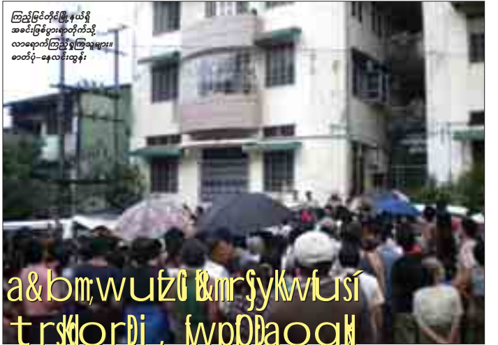
ကြည့်မြင်တိုင်မြို့နယ်ရှိ အင်းဖြူမြို့နယ်အတွင်းရှိ လာရောက်ကြည့်ရှုကြသူများ။

a&b,m,wu,tz &mr,sy,kv,lus,t tr,rh,ordi, lwp,0,ba,oo,qh