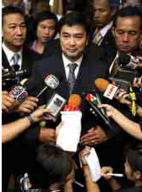
တောင်းဆိုနေခဲ့ကြသည်။ အဘီဆစ်ကမူ ရွေးကောက်ပွဲမပြုလုပ်မီ တည်ငြိမ်မှု ရရှိရန် အရေးကြီးကြောင်း ပြောကြားသည်။ ရွေးကောက်ပွဲပြုလုပ်မည့်နေ့ရက်ကိုမူ မသတ်မှတ်သေးကြောင်း သိရသည်။ —Ref: AP

ဆန္ဒပြသူ ရှိနေဆဲပေါင်း များစွာက ပါလီမန်ဖျက်သိမ်းရေးနှင့် ရွေးကောက်ပွဲအသစ်များကို တောင်းဆိုနေခဲ့ကြသည်။ အဘီဆစ်ကမူ ရွေးကောက်ပွဲမပြုလုပ်မီ တည်ငြိမ်မှု ရရှိရန် အရေးကြီးကြောင်း ပြောကြားသည်။ ရွေး