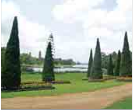
ထို့အပြင်သစ်မာပင်၊ ယူက လစ်ပင်၊ ကျွန်းစသည့်အပင်များ ကိုလည်း တစ်အိမ်ထောင်လျှင် သတ်မှတ်အပင်နှုန်းနှင့် စိုက်ပျိုး ခဲ့ကြောင်းသိရသည်။ ပြင်ဦးလွင်မြို့နယ်တွင် လည်း အရိပ်ရသစ်ပင်များ လျော့ နည်းလာခြင်းကြောင့် ယခုနှစ်တွင်

အချို့နေရာ၌ အပူချိန်မြင့်တက် လာခဲ့ကြောင်း၊ ပြင်ဦးလွင်မြို့ နယ် လာဘဲတောင်ထိန်းသိမ်းရေးကို စနစ် တကျမဆောင်ရွက်ပါကနောင်နှစ် ပေါင်း ၃၀ အတွင်း မန္တလေးကဲ့သို့ အပူချိန်မြင့်တက်လာနိုင်ကြောင်း ပြင်ဦးလွင်မြို့ သဘာဝပတ်ဝန်း ကျင်ထိန်းသိမ်းရေးလိုလားသူ တစ်ဦးက 7Day News သို့ပြော သည်။ရာသီဥတုပြောင်းလဲလာခြင်း ကြောင့် ပြင်ဦးလွင်မြို့၏ အမှတ် အသားဖြစ်သော ချယ်ချီပင်များ ပင်လျှင် မျိုးသုဉ်းပျောက်ကွယ် သွားမည့်အရေး စိုးရိမ်သကဲ့သို့ သစ်တောသစ်ပင် ထိန်းသိမ်းရေး ကို သစ်တောဥပဒေအတိုင်း စနစ် တကျဆောင်ရွက်သွားကြရန်မြို့ ခံများက လိုလားလျက်ရှိသည်။