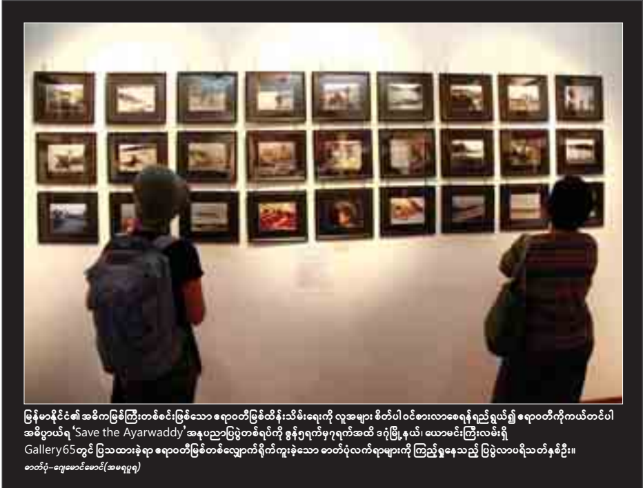
မြန်မာနိုင်ငံ၏ အဓိကမြစ်ကြီးတစ်စင်းဖြစ်သော ဧရာဝတီမြစ်ထိန်းသိမ်းရေးကို လူအများ စိတ်ပါဝင်စားလာစေရန်ရည်ရွယ်၍ ဧရာဝတီကိုကယ်တင်ပါ အဓိပညာရဲ့ 'Save the Ayarwaddy' အနုပညာပြပွဲတစ်ရပ်ကို ဇွန်၅ရက်မှ၇ရက်အထိ ဒဂုံမြို့နယ်၊ ယောမင်းကြီးလမ်းရှိ Gallery 65 တွင် ပြသထားခဲ့ရာ ဧရာဝတီမြစ်တစ်လျှောက်ရှိ ကူးခဲ့သော ဓာတ်ပုံလက်ရာများကို ကြည့်ရှုနေသည့် ပြဋ္ဌာန်ပုံရိပ်များကို ခေါ်ဆို-ရှုမောင်မောင် (အမူပုံရိပ်)

ရန်ကုန်၊ ဇွန်-၄ ရန်ကုန်မြို့တွင် လှုပ်စစ်ဓာတ်အားပေးဝေမှုကို ဇွန်လအတွင်း တိုးမြှင့်ပေးသွားမည်ဟု ရန်ကုန်မြို့တော်လှုပ်စစ်ဓာတ်အားပေးရေးအဖွဲ့မှ သတင်းရရှိသည်။ လှုပ်စစ်မီးတိုးမြှင့်ပေးရေးအတွက် အသစ်တပ်ဆင်ထားသော ကမ်းလွန်သဘာဝဓာတ်ငွေပိုက်လိုင်းဖြစ်သည့် ၂၄လက်မပိုက်လိုင်းမှ ဓာတ်ငွေများ မကြာမီပိုလွှတ်တော့မည်ဖြစ်သည်။ ယင်းမှရရှိသော ဓာတ်ငွေများဖြင့် အင်းစိန်ရွာ၊ အလုံ၊ လှော်ကား၊ သာကေတရှိ တာဘိုင်ဓာတ်အားပေးစက်ရုံလေးလုံးမှ လှုပ်စစ်မီးတိုးမြှင့်ပေးရန်စီစဉ်နေခြင်းဖြစ်ကြောင်း တာဝန်ရှိသူတစ်ဦးကပြောကြားသည်။ “အခု လက်ရှိပေးနေတဲ့ ဂက်စ်ပိုက်လိုင်းက ပေါက်နေလို့ မီးအားက ပုံမှန်မပေးနိုင်တာ။ အခုပိုက်လိုင်းအသစ်နဲ့ ပေးဖို့ကို စီစဉ်ပြီးသွားပြီး ဓာတ်ငွေလွှတ်ပို့ပေးတော့မယ်”ဟု အထက်ပါ ပုဂ္ဂိုလ်ကဆက်လက်ပြောသည်။ ၀(၁၂)အိုင်