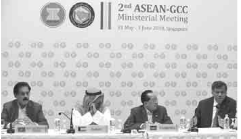
ရေရှည်စီးပွားရေး ပူးပေါင်းဆောင်ရွက်မှုများ ပြုလုပ်နိုင်မည်ဖြစ်ကြောင်း ကူမိုက်ဂျီယာဝန်ကြီးချုပ် နှင့် နိုင်ငံခြားရေးဝန်ကြီး ရိုက်ဒေါက်တာမိုဟာမက်အယ်လ်ဆာဘားက ပြောကြားခဲ့ပြီး ယခုပူးပေါင်းဆောင်ရွက်မှုတွင် ပုဂ္ဂလိကကဏ္ဍနှင့် အခြားဌာနဆိုင်ရာအခြားအဖွဲ့များ ပါဝင်လာရန် စုစည်းရန် လိုအပ်ကြောင်း အာဆီယံအတွင်းရေးမှူးချုပ် ဆူရင်ပစ်ဆူဝမ်က ပြောကြားသည်။ —Ref: AFP

ထားသည်။ အစည်းအဝေးမှာ အကျိုးဖြစ်ထွန်းကြောင်း နှစ်ဖက်လုံးက ပြောကြားပြီး နိုင်ငံခြားရေးဝန်ကြီးများအကြား ရင်းနှီးမှုများတိုးတက်လာကြောင်း အေအက်ဖီပီ သတင်းက ဖော်ပြသည်။ အာဆီယံနှင့် GCC ဒေသနှစ်ခု၏ ကုန်သွယ်ရေးမှာလည်း လွန်ခဲ့သော ၆ နှစ် ၇ နှစ်အတွင်း များစွာတိုးတက်ခဲ့ပြီး ကန်ဒေါ်လာ ၂၀ ဘီလီယံမှ ဘီလီယံ ၁၀၀ အထိ ရောက်ရှိလာခဲ့ကြောင်း သိရသည်။ တစ်ဖက်နှင့် တစ်ဖက် သိကျွမ်းရန် လိုအပ်ကြောင်း၊ ရင်းနှီးကျွမ်းဝင်မှုမှ နေ့စဉ် ခိုင်မာသော