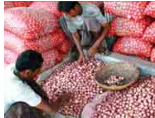
ရန်ကုန်ဈေးကွက် ဘုရင့်နောင်သို့ ကားအစီးရေ နေ့စဉ် ၂၅ စီးမှ ၄၀

ပြည်တွင်းရှိ ကြက်သွန်နီဈေးနှုန်း ကျဆင်းမှုမှာ စံချိန်တင်ခဲ့ပြီး ဘုရင့်နောင်ဈေးကွက်တွင် လက်ကားဈေးတစ်ပိဿာ ၁၀၀ ကျပ်မှ ၂၀၀ ကျပ်အတွင်းသာ ရှိတော့ကြောင်း သတင်းရရှိသည်။ ယခုနှစ် ကြက်သွန်နီစိုက်ပျိုးထုတ်လုပ်မှုမှာ အထွက်ကောင်းသော နှစ်တစ်နှစ်ဖြစ်သလို၊ ပြည်ပတင်ပို့ခွင့် ကန့်သတ်ထား၍ ပြည်တွင်းဈေးနှုန်းတွင် ပိုလျှံမှုများရှိသည်အထိ ဖြစ်ခဲ့သည်။ ထို့ကြောင့် ပြီးခဲ့သည့် နှစ်ကုန်ဒီဇင်ဘာလောက်မှ စတင်၍