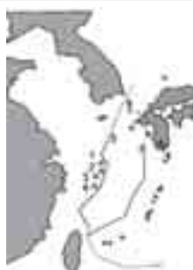
ဝန်ကြီးချုပ် ဟာတိုယာမာတို သဘောတူညီခဲ့ကြသည်။ အရှေ့တရုတ်ပင်လယ်ပြင်တွင် ဓာတ်ငွေ့ရှာဖွေရေး အတူတကွလုပ်ဆောင်ရန် ၂၀၀၈ ခုနှစ် ဇွန်လက နှစ်နိုင်ငံကြားသဘောတူညီခဲ့သည်။ တရားမဝင်သော ဆွေးနွေးပွဲများ စတင်နေပြီ ဖြစ်သော်လည်း တိုးတက်မှုမှာ နှေးကွေးနေသည်။ တရုတ်ဝန်ကြီးချုပ် ဝမ်ကြောင်းပေါင်၏ သုံးရက်တာ ဂျပန်နိုင်ငံအလည်အပတ်ခရီးစဉ်အတွင်း ရရှိခဲ့သည့် သဘောတူညီချက်တွင် ဓာတ်ငွေ့ပူးပေါင်းရှာဖွေရေး အခြေခံနားလည်မှု ရရှိခဲ့သလို လက်ရှိလုပ်ကိုင်နေသော ရေနံနှင့် သဘာဝဓာတ်ငွေ့လုပ်ကွက်တွင် ဂျပန်ကုမ္ပဏီများ ပါဝင်လုပ်ကိုင်ရေးလည်း သဘောတူညီမှု ရရှိခဲ့

တိုကျို၊ ဇွန် - ၁ အရှေ့တရုတ်ပင်လယ်ရှိ အငြင်းပွားနေသော သဘာဝဓာတ်ငွေ့လုပ်ကွက်အား အတူတကွပူးပေါင်းလုပ်ဆောင်ရေး တရားဝင်ညှိနှိုင်းမှုများ စတင်လုပ်ဆောင်မည်ဖြစ်ကြောင်း တရုတ်နှင့် ဂျပန်နိုင်ငံတို့က သဘောတူညီခဲ့ကြသည်။ ထို့အပြင် နှစ်နိုင်ငံကြားပေါ်ပေါက်လာသော တင်းမာမှုများကို ကိုင်တွယ်ဖြေရှင်းရန် ဝန်ကြီးချုပ်နှစ်ဦးကြား အချိန်မရွေး ခေါ်ဆိုနိုင်သော တယ်လီဖုန်းလိုင်းတစ်လိုင်းထားရှိရန်လည်း တရုတ်ဝန်ကြီးချုပ် ဝမ်ကြောင်းပေါင်နှင့် ဂျပန်