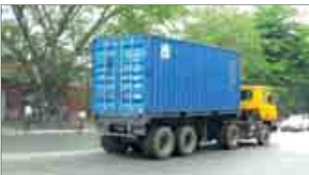
ဝန်းသောမြေနေရာတွင် ငွေကျပ်သိန်း ၈၀၀ ခန့်အကုန်ကျခံကာ တင်ဆောင် မည်ဖြစ် သည်။

ကွန်ကရစ်နာယာဉ်ရပ်နားစခန်းကို ဒဂုံမြို့သစ်အိမ်ကမ်းမြို့နယ်၊ မြန်နန္ဒာလမ်း၊ ကမ်းနားလမ်းနှင့်ရွှေလီလမ်းကြားရှိ ဧက ၅၀ ခန့်ကျယ်