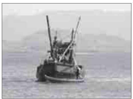
ထိုသို့လုပ်ကိုင်ဖြစ်ခဲ့ပါက ငါးလုပ်ငန်းဦးစီးဌာနမှ တတ်သိပညာရှင်များက ဦးစီးပြီး ပိုင်းဝန်းပူး