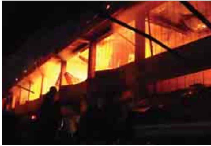
ရန်ကင်း၊ ဇွန်-၃