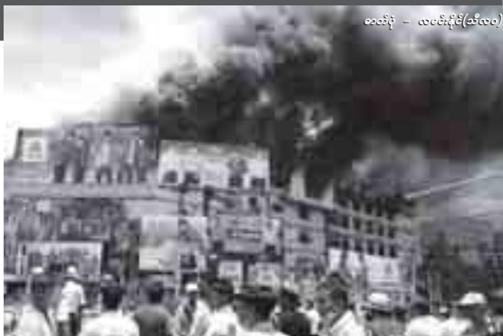
ဓာတ်ပုံ - လစမ်းရန်(သီလဝ)

မီးလောင်မှုမှတ်တမ်းများကို ကြည့်ပါက ယခင်နှစ်များကထက် ပေါ့ဆမီးမှတ်တပ်ဆင်ဖြတ်ပွားခဲ့သော မီးလောင်မှု၊ မီးဖိုခန်းမှ မီးလောင်မှု အကြိမ်