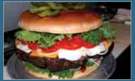
လေ့အကျင့်တွင်ပါဝင်ပြီး ယင်းအလေ့အကျင့်ကြောင့် ရင်ကျပ်ရောဂါဖြစ်စေသည့်အကြောင်းအရင်းဖြစ်နိုင်ကြောင်း သုတေသီများက

‘ဟင်ဘာဂါ’စားသုံးခြင်းမှာ ကျန်းမာရေးနှင့်မညီညွတ်သည့် အ