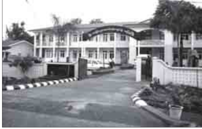
မက်စီ- နီလ်ဗိုလ်ဝင်း

ရေကြည်မြို့ရှိ မြို့မ အခြေခံ ပညာအထက်တန်း ကျောင်းခွဲတွင် အလျား ၁၈၀ ပေ၊ အနံ ၇၀ ပေ အကျယ်ရှိသည့် အခန်းပေါင်း ၁၇ ခန်းပါ၊ နှစ်ထပ်ကျောင်းဆောင် သစ် ဆောက်လုပ်ရာတွင် ကျပ် သိန်း ၃၅၀၀ ကျော်၊ ကျောင်း ဆောင်အဟောင်းပြုပြင်မှုအတွက် ကျပ်သိန်း ၁၂၀၀ နှင့် အခြား ပရိ ဘောဂကျောင်းအသုံးအဆောင် များအတွက် ကျပ်သိန်း ၅၀၀