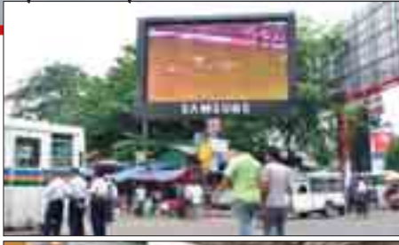
စတင်ပုံ-ဆောင်ဆောင်

ထိုသို့ အားကစားဂျာနယ်အများအပြားထွက်ရှိနေသော်လည်း ဝယ်လိုအားမှာ ထူးထူးခြားခြားတက်မလာကြောင်း ၎င်းက ဆက်လက်ပြောသည်။ ဂျာနယ်ရောင်း အားကျခြင်းမှာ အားကစားဂျာနယ်များလည်း နည်းလျှော့ကျသွား၍ ဖြစ်နိုင်ကြောင်း ဂျာနယ်ကိုင်စားလှယ်ကြီးတစ်ဦးကလည်း ခန့်မှန်းသည်။ “ဟိုတုန်းက ဂျာနယ်ဈေးနှုန်း