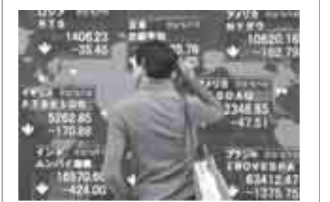
ဘန်ကောက်၊ ဇွန် - ၁ တရုတ်နိုင်ငံ၏ ကုန်ထုတ်လုပ်မှုမှာ မေလအတွင်း နှေးကွေးသွားသည်ဆိုသော သတင်းများနှင့် ဥရောပအစိုးရကြေးမြီများက ကမ္ဘာ့စီးပွားရေးလက်လှည့်မှုကို ပျက်ယွင်းစေနိုင်သည်ဟူသော စိုးရိမ်မှုများကြောင့် အာရှစတော့ဈေးကွက်တစ်ဝန်းကျင်လုံး ကျဆင်းလာကြောင်း သိရသည်။

ဥရောပ၏တောင်ပိုင်းကွေးမြီများကို ကိုင်တွယ်ရန် ခြီးခြံရွေ့တာရေးအစီအစဉ်များချမှတ်နေခြင်းကြောင့် ဥရောပသည် စီးပွားရေးကွေးကျဆင်းမှုဖြစ်နိုင်ခြေရှိကြောင်း ရခိုင်ကာ နိုင်ငံခြားတင်ပို့မှုအားကိုးနေရသော အာရှတိုက်ကိုလည်း ထိခိုက်နိုင်သည်ဟူသော တွေးခေါ်မှုများကြောင့်လည်း ဈေးကွက်ကျဆင်းခြင်းဖြစ်နိုင်ကြောင်း အေပီသတင်းကဖော်ပြသည်။ တရုတ်နိုင်ငံ၏ ကုန်ထုတ်လုပ်မှုကျဆင်းသွားကြောင်း မကြာသေးမီကပြုလုပ်ခဲ့သည့် စစ်တမ်းများကပြဆိုနေရာ ဥရောပနှင့် အခြားဒေသများ၏ဝယ်လိုအားလျော့နည်းသွားခြင်းက အာရှတိုက်လည်းသက်ရောက်မှုရှိကြောင်း အေပီသတင်းကဖော်ပြသည်။ ရေနံဈေးနှုန်းမှာ ကန်ဒေါ်လာ ၇၄ အောက်သာရှိပြီး ယန်းငွေနှင့်နှိုင်းယှဉ်လျှင် ကန်ဒေါ်လာတန်ဖိုး သိသိသာသာမပြောင်းလဲသော်လည်း ယူရိုနှင့်နှိုင်းယှဉ်လျှင် ကန်ဒေါ်လာ တန်ဖိုး မြင့်တက်လာသည်။ ဂျပန်၊ ဩစတြီးယျ၊ တောင်ကိုရီးယား၊ ဟောင်ကောင်၊ တရုတ်(တိုင်ပေ)ရဲ့ စတော့ဈေးကွက်တစ်ဝန်းကျင်လုံး အသီးသီးကျဆင်းလာသည်။ ဥရောပ၏ ကြေးမြီအကျပ်အတည်းက ကမ္ဘာ့စီးပွားရေးအပေါ် သက်ရောက်မည်ကို ရင်းနှီးမြှုပ်နှံသူများက စိုးရိမ်နေကြောင်း မီဂျူတိုရှယ်ယာရောင်းဝယ်ရေးကုမ္ပဏီမှ ဈေးကွက်ဆန်းစစ်လေ့လာသူ မာဆာတိုရီဆာတိုက ပြောကြားသည်။ —Ref: AP