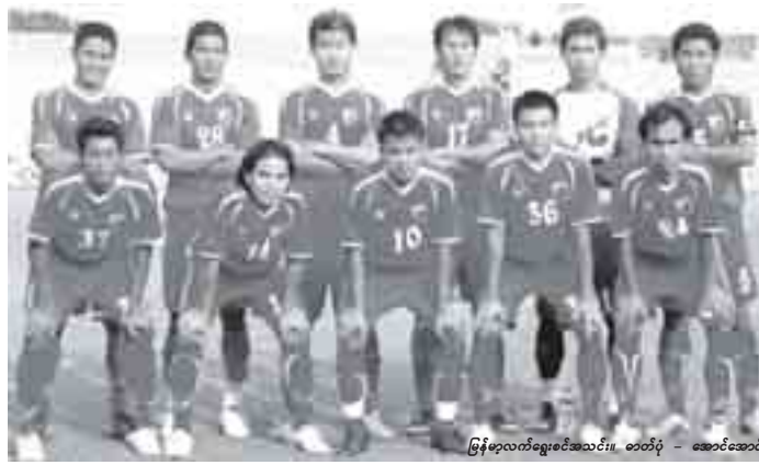
မြန်မာ့လက်ရွေးစင်အသင်း၊ ဓာတ်ပုံ - အောင်အောင်