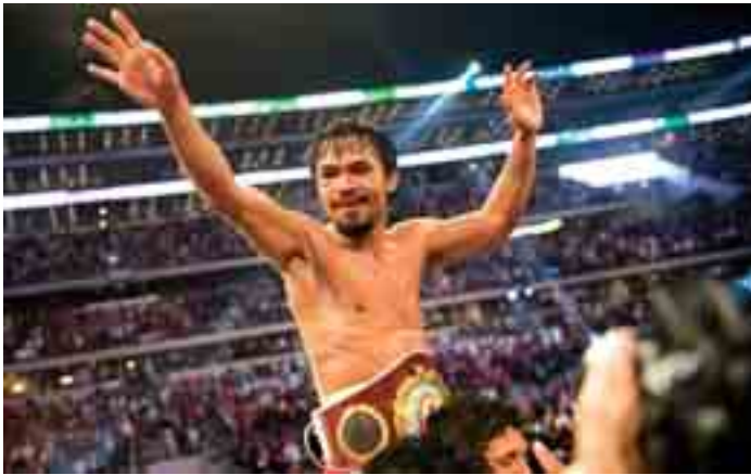
တတိယတန်း သရဖူလွှဲပွဲတွင် အတန်းလိုက်ပြိုင်ပွဲများမှလည်း ချန်ပီယံခံပတ်ခွန်ဆုအထိ ရရှိခဲ့သဖြင့် ယခုကဲ့သို့ အကောင်းဆုံးလက်ရွေးစင်ဆုကို မဲပေးရွေးချယ်ခံခဲ့ရခြင်းဖြစ်သည်။