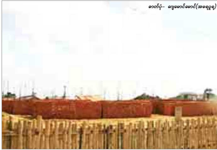
စာတိုက်- ရေမောင်မောင်(အမရပူရ)

နေပြည်တော် စည်ပင်သာယာရေးကော်မတီ နယ်နိမိတ်အတွင်း သဘာဝပတ်ဝန်းကျင် ထိန်းသိမ်းသည့် အနေဖြင့် အုတ်