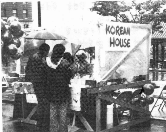
가두 음식판매하는 한인회 임원과 부인들)