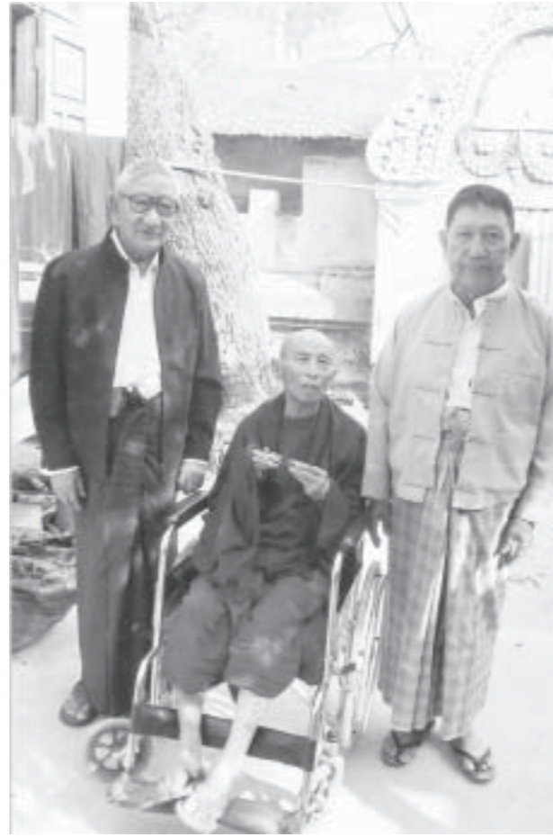
တောင်သမန်ကွင်း တို့အဆင်းတွင် အင်းမြေမှာတွားကင်းမြေများသို့ တန်တားသာဟန် ရှေးလက်ကျန်တည်လေးဒဏ် မိုးဒဏ်ဖလါပု ခံနိုင်သရွေ့ ကျန်သရွေ့ကို မနေ့ကလည်း ရောက်ခဲ့ ... ဟု ဆရာတော်၏အမိန့်ကို ကဗျာခံခဲ့၏။ ယခု ဆရာသည် တောင်သမန်ကဗျာ မစီနိုင်တော့ပါလား။ တောင်သမန်ကဗျာသစ် မတွေ့နိုင်တော့ပါလားဟု တွေးမိလိုက်မှ ရင်မှာပို၍ မောသွားပါသည်။

ကိုပညာ၊ အမရပူရ ဒီလိုတွေ့ရတော့ ကိုပညာ(အမရပူရ)အတွက် ဒီလိုရေးချင်ပါတယ်။