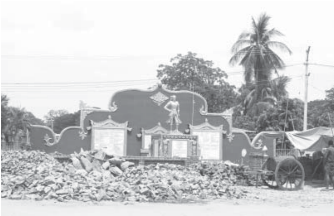
မန္တလေး-ရွှေဘိုလမ်းမကြီးဘေး

ကားကြီးကွင်းအဝင်နေရာရှိ ရွှေဘိုမြို့၊ ဂုဏ်ဆောင် အလောင်းမင်းတရားကြီး ဦးအောင်ဇေယျရပ်တူ ရင်ပြင်အား အစိုးရသစ်၏ ပြောင်းလဲချိန်တန်ပြီ ရက် ၁၀၀စီမ်ချက်ကာလအတွင်း ရွှေဘိုမြို့နယ်စည်ပင်သာယာရေးအဖွဲ့မှ အပြီးပြုပြင်မည်ဖြစ်ကြောင်း သိရသည်။