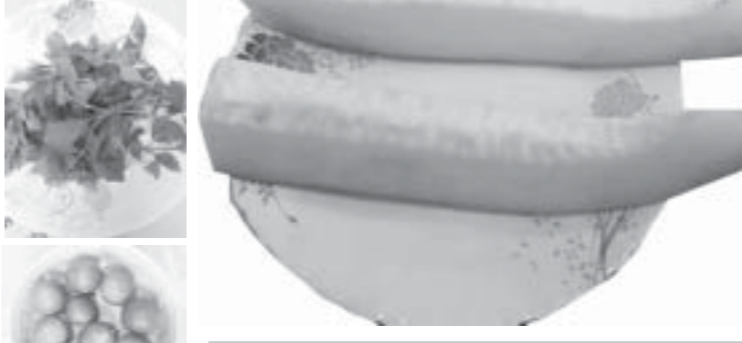
အိမ်ဂျိတ်ဖက်မာ့ဖက်ကို ဖန်တီးခဲ့တာပဲ။