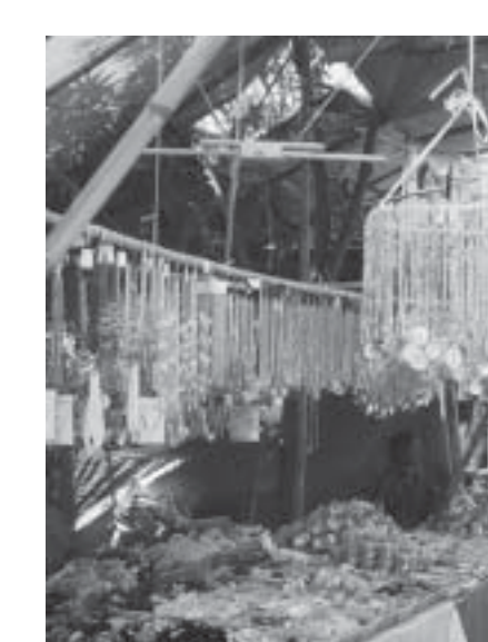
တောင်ပြုန်းပွဲတော်နေ့မှာ မြို့ပေါ်မှာ ချောင်းမြစ်ကမ်းတစ်လျှောက် ချောင်းမြစ်ကမ်းတစ်လျှောက် ချောင်းမြစ်ကမ်းတစ်လျှောက် ချောင်းမြစ်ကမ်းတစ်လျှောက်

တောင်ပြုန်းဆုတောင်းပြည့် ဘုရားပွဲတော်နှင့်အတူ မင်းနုစ်ပါးပွဲတော်ကို နှစ်စဉ်ဝါခေါင်လဆန်း ၁၀ ရက်၌ ညီလာခံသဘင်ကျင်းပပွဲ၊ ဝါခေါင်လဆန်း ၁၁ ရက်၌ ချိုးရေတော်သုံးပွဲ၊ ဝါခေါင်လဆန်း ၁၄ ရက်၌ ယုန်ထိုးပွဲ၊ လပြည့်နေ့၌ ထိန်ပင်ခုတ်ပွဲများကျင်းပရာ အနယ်နယ်အရပ်ရပ်မှ လာရောက်ပူဇော်ပသသူများ ပန်းဆက်သူများ၊ ကန်တော့ပွဲထိုးသူများ၊ အပျော်အပါးလာ