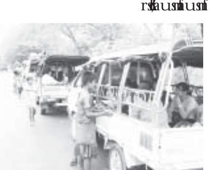
တောင်ပြုန်းပွဲတော်နေ့မှာ မြို့ပေါ်မှာ ချောင်းမြစ်ကမ်းတစ်လျှောက် ချောင်းမြစ်ကမ်းတစ်လျှောက် ချောင်းမြစ်ကမ်းတစ်လျှောက် ချောင်းမြစ်ကမ်းတစ်လျှောက်

တောင်ပြုန်းပွဲတော်သည် မြန်မာဘုရင်များလက်ထက်တော်များမှ စ၍ ကျင်းပလာခဲ့ရာ ထီးကျိုးစည်ပေါက် ကျွန်သပေါက်ဘဝမှသည် ခေတ်စနစ်အမျိုးမျိုးတွင် စစ်ဘေး၊ မီးဘေး၊ ရေဘေး၊ ရောဂါဘယဘေးအမျိုးမျိုးကြုံတွေ့သည့်ကြားမှာလည်း မပျက်မကွက်ကျင်းပနိုင်ခဲ့ရာ မန္တလေးမြို့တွင် ဖြစ်ပွားခဲ့သော ပဋိပက္ခဖြစ်စဉ်ကြောင့် ပုဒ်မ ၁၄၄ ထုတ်ထားခဲ့ရသည့် အခြေအနေမှာလည်း ဓလေ့ထုံးစံမပျက် စည်ကားသိုက်မြိုက်စွာ ကျင်းပသွားသည်ကို မှတ်တမ်းတင်ရမည်ဖြစ်ပါသည်။