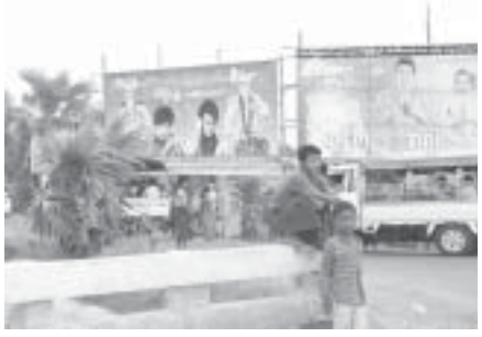
တောင်ပြုန်းပွဲတော်နေ့မှာ မြို့ပေါ်မှာ ချောင်းမြစ်ကမ်းတစ်လျှောက် ချောင်းမြစ်ကမ်းတစ်လျှောက် ချောင်းမြစ်ကမ်းတစ်လျှောက် ချောင်းမြစ်ကမ်းတစ်လျှောက်

ယခင်နှစ်များက ပွဲတော်စတင်သည့်ရက်တွင် လူနှစ်ထောင်နီးပါးသာရှိခဲ့ပြီး ယခုအခါ ပွဲတော်စတင်ကတည်းက နိုင်ငံခြားသားများအပါအဝင် လာရောက်ကြသူတွေ များပြားကြောင်း သိရသည်။