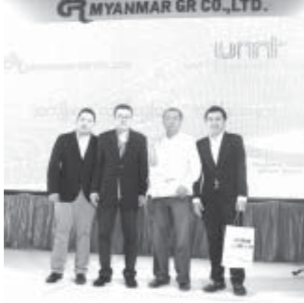
Myanmar GR Co.,Ltd နှင့် UMT Co.,Ltd အကြား ပူးပေါင်းဆောင်ရွက်နေသည့် အဖွဲ့ဝင်များ

၃၇လမ်း၊ ၇၃x၇၄လမ်းကြား အင်တာနက်ဆိုင်အနီးတွင်ရပ်ထားသော နံပါတ်မပါ Kenbo-125 ဆိုင်ကယ်အားလည်းကောင်း၊ လွန်ခဲ့သည့် ၂၀ရက်ခန့်က ၃၇လမ်း၊ ၇၇x၇၈လမ်းကြားကြက်ဆီထမင်းဆိုင်အနီးတွင် ရပ်ထားသော နံပါတ်မပါ Yinbo-125 ဆိုင်ကယ်အား လည်းကောင်း၊ ၃၇လမ်း၊ ၇၆x၇၇လမ်းကြားရှိ ခေါင်ရည်ဆိုင်အနီးတွင်ရပ်ထားသော နံပါတ်မပါ Super Anbo 125 ဆိုင်ကယ်အားလည်းကောင်း စစ်ဆေးပေါ်ပေါက်ခဲ့သဖြင့် သက်သေခံဆိုင်ကယ်များအား လိုက်လံသိမ်းဆည်းပြီး မဟာအောင်မြေမြို့မရဲစခန်း(၁)၅၇၆/၂၀၁၄ (၁)၅၇၇/၂၀၁၄၊ (၁)၅၇၈/၂၀၁၄၊ (၁)၅၇၉/၂၀၁၄၊ (၁)၅၈၀/၂၀၁၄၊ (၁)၅၈၁/၂၀၁၄ ဖြစ်မှုပုဒ်မ-၃၇၉/၅၄အရ အမှုဖွင့်စစ်ဆေးလျက်ရှိကြောင်း၊ ဆက်လက်စစ်ဆေးချက်အရ ဆိုင်ကယ်သုံးစီး ထပ်မံပေးပေါက်ခဲ့ကြောင်း တိုင်းရဲအကူမှ သိရသည်။