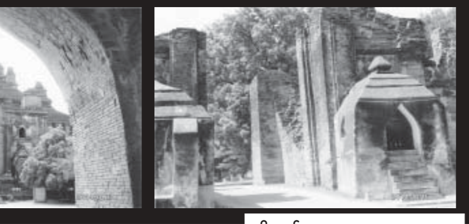
ပုဂံမြို့

တစ်ခုကို စနစ်တကျဖွဲ့စည်းထားပြီး ဝန်းကျင်အမှိုက်တို့ကိုဈေးရောင်းချရာ ဆိုင်ခန်းများက အလှည့်ကျတာဝန်ယူရပါတယ်။ မိမိတာဝန်ကျ အလှည့်ကိုမယူနိုင်လျှင် လူငှား၍ သန့်ရှင်းရေးလုပ်ရသလို စုပေါင်းနေ့စားပေးငှားထားသော သန့်ရှင်းရေးဝန်ထမ်းအချို့ရဲ့ တစ်နေ့ကုန်လှုပ်ရှားဆောင်ရွက်မှုဟာ အတုယူအားကျစရာပါ။