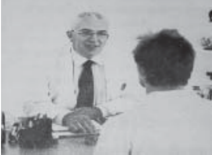
ညီအစ်ကိုနှစ်ယောက်ဟာ ၂၀၀၀ ပြည့်နှစ်မှာ တွေ့ဆုံခဲ့ကြပါတယ်။