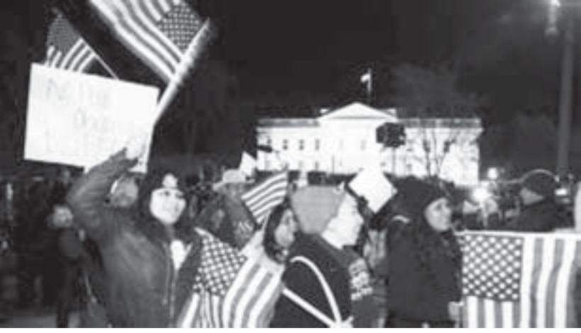
မူးယစ်ပစ္စည်းကင်းရှင်းရေးအတွက် ဆန္ဒပြပွဲများတွင်ပါဝင်သူများ

သမားများနှင့် ရဲများ ရုန်းရင်းဆန်ခတ်ဖြစ်ခဲ့သည်။ သေဆုံးသည်ဟု ယူဆရသည့် ကျောင်းသားများ၏ မိသားစုဝင်များကို တင်ဆောင်လာသည့် ယာဉ်တန်းက နိုင်ငံတစ်ဝှမ်းမှာဖြစ်နေသည့် ဆန္ဒပြပွဲများကို အားပေးရန် လှည့်လည်သွားလာပြီးနောက် နိုင်ငံဘာ ၂၀ရက်နေ့ မြို့တော်မကြွဆီကို စီးတီးသို့ ရောက်ရှိခဲ့သည်။ ကျောင်းသားများ ပျောက်ဆုံးသွားသည့် ကိစ္စနှင့်ပတ်သက်ပြီး တရား