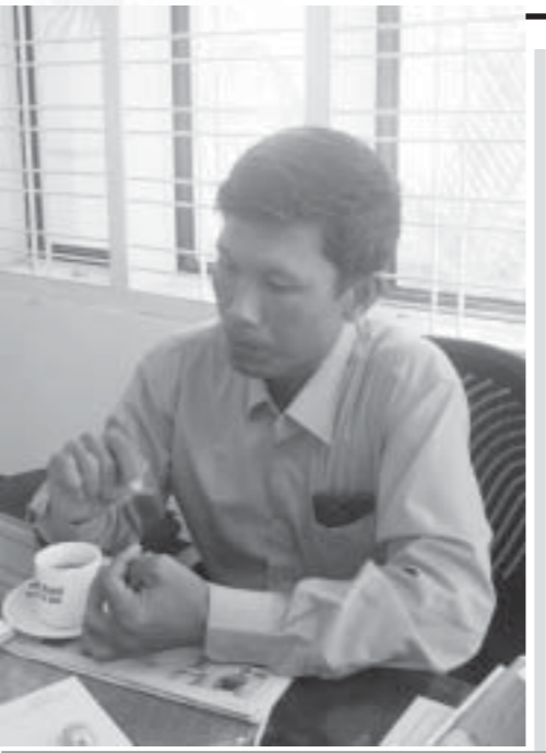
နေ့စဉ်အသုံးပြုနေကြသော ဂရုတုန်ကော်ဖီမစ်

ဘဲ ထိုင်းနိုင်ငံကပါ လက်ခံမှုတွေရရှိနေပါတယ်။ ကျွန်တော်တို့ Gold Roast+Calsome ကွေ့ကာ Royal Myanmar Tea Mix အားလုံးရဲ့, Exp: Date က ၂ နှစ် ပေးထားပါတယ်။