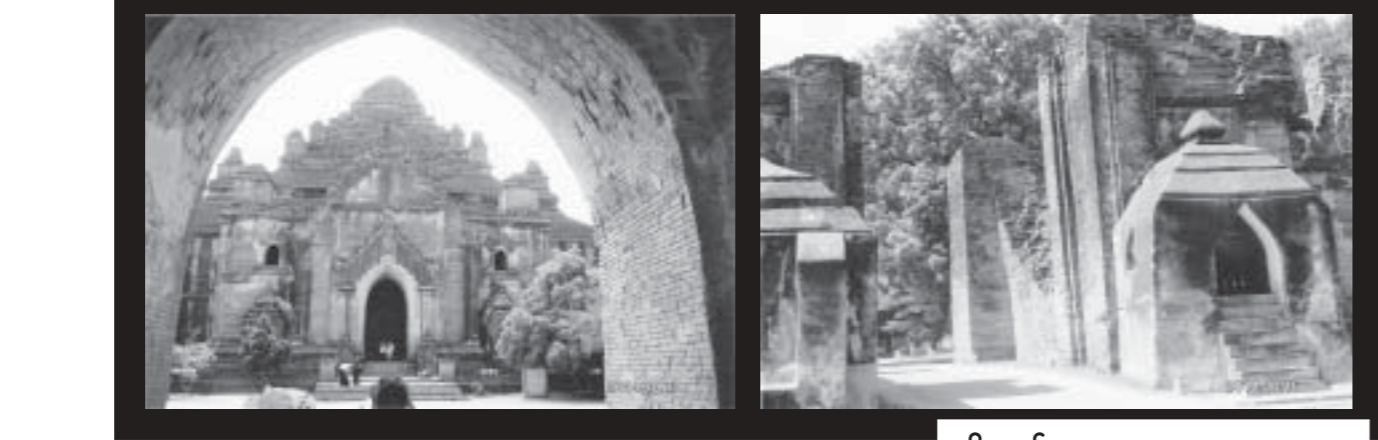
ပုဂံမြို့

စိုက်ပျိုးသူများက အသီးမရအပင်မလှလို့ ကာလရှည်ကြာစွာမထူးထူးခဲ့တဲ့ သစ်ပင်များပဲဖြစ်ပါတယ်။ အခုတော့ ပုဂံမြေမှာ ပြန်လည်ရှင်သန်ခွင့်ရနေပါပြီ။