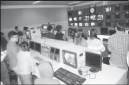
မြန်မာ့သတင်းပညာသိပ္ပံ(Myanmar Journalism Institute -MJI) သင်တန်းဒီပလိုမာ (မန္တလေး)သင်တန်းကျောင်းမှ သင်တန်းသူ သင်တန်းသားများသည် နိုဝင်ဘာ ၂၀ရက် နံနက် ၉နာရီက နေပြည်တော်ရှိ ပြန်ကြားရေးဝန်ကြီးဌာန ပြည်ထောင်စုဝန်ကြီးဦးရဲထွဋ်၏ ဖိတ်ကြားချက်အရ နေပြည်တော်ရုံးအမှတ်(၇)အစည်းအဝေးခန်းမသို့သွားရောက် တွေ့ဆုံသည်။

ရှေးဦးစွာ ဝန်ကြီးက ပြန်ကြားရေးဝန်ကြီးဌာန၏ လက်ရှိဖြစ်ပေါ်ပြောင်းလဲမှုများခေတ်စနစ်နှင့်အညီ မြန်မာမီဒီယာဆောင်ရွက်နေမှု အခြေအနေများ၊ အရည်အသွေးပြည့်ဝပြီး ကျင့်ဝတ်ကို