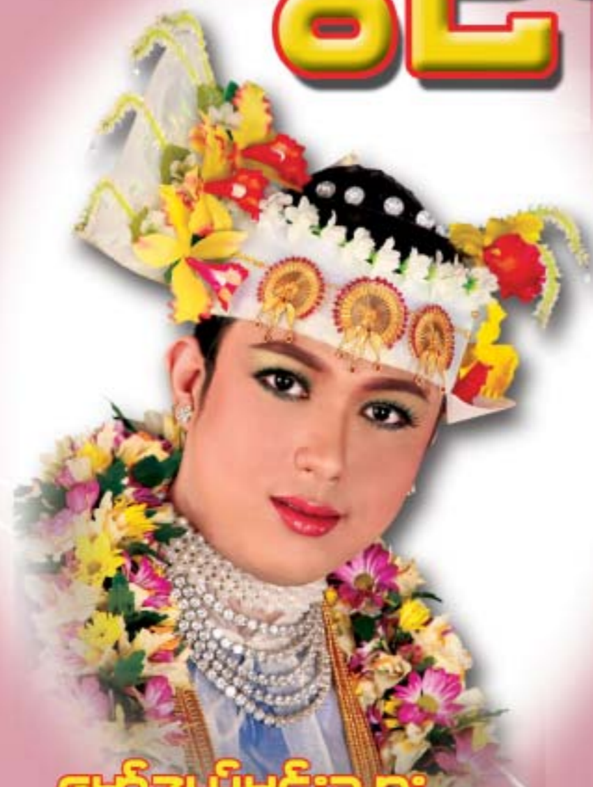
မော်ဒယ်မင်းသား