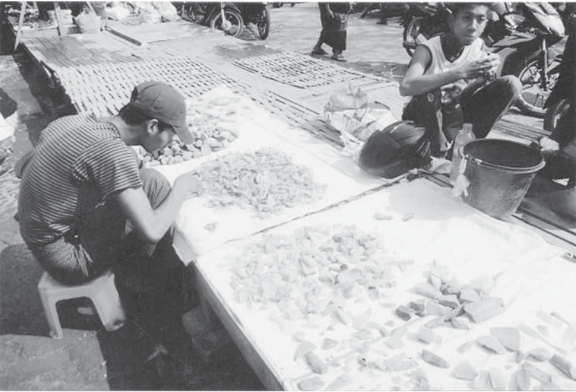
ဤကျောက်စ တစ်ခုစီအတွက် အခွန်ဆောင်ပြီးကြောင်း အထောက်အထားပြနိုင်ပါသလား...