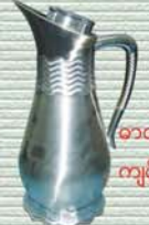
ဓာတ်ဘူး ကျပ် ၁၅၀၀၀