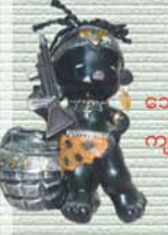
ဘောလုံးပင်လူရိုင်း ကျပ် ၆၅၀၀