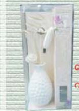
ရေမွှေးပန်းအိုး ကျပ် ၈၀၀၀

Star & Model International Show လျှောက်၊ Photo Model