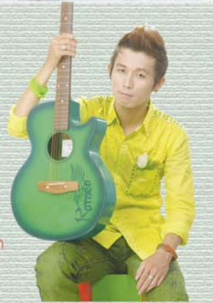
ဂိုဗိဇ္ဇာ အနုပညာ

တက္ကသိုလ်ဝင် စာမေးပွဲကို ဘာသာစုံဂုဏ်ထူးနဲ့ အောင်မြင်ခဲ့တယ်။ ရမှတ်(၅၁၃)မှတ်။ အကြိုက်ဆုံး ဘာသာက သင်္ချာပါ။ ရမှတ် (၉၂)မှတ်။ အကြောက် ဆုံးဘာသာက မြန်မာစာပါ။ ရမှတ် (၇၅)မှတ်။ အား နည်းတဲ့ဘာသာဖြစ်တဲ့အတွက် နေ့တိုင်းအချိန်ပို ပေးပြီး ကျက်ဖြစ်ပါတယ်။ ရည်ရွယ်ချက်ကတော့ ဆရာဝန်တစ်ယောက်ဖြစ်ချင်တာပါ။ လိင်စာက ၈၄လမ်း၊ ၂၈-၂၉လမ်းကြား၊ မန္တလေးမြို့၊ ဖုန်း ၀၂ - ၃၃၈၉၇။