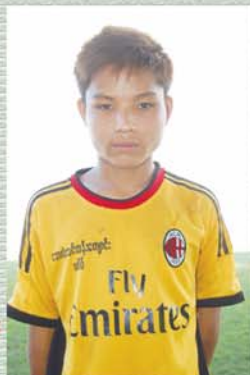
သက်နိုင်