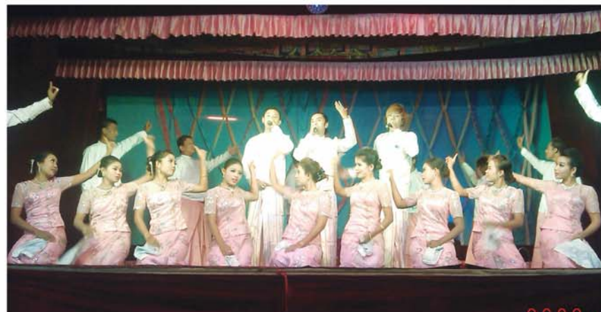
မိုလ်ညိုကို ကာ

Corner of 15 th & 86 th Street, Mandalay. Tel : 09-5179013, 09-6801192