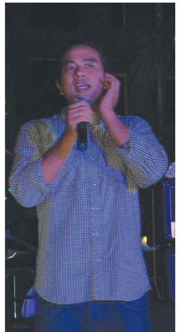
အဆိုတော်လင်းလင်း