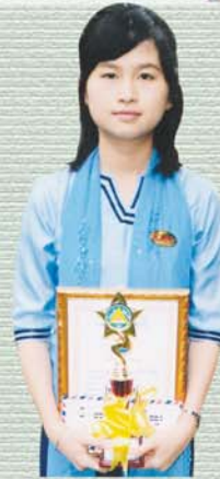
ဇာနည်အောင် ပညာရေး