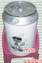
ကား ရေခဲသေတ္တာ ကျပ် ၁၂၀၀၀၀