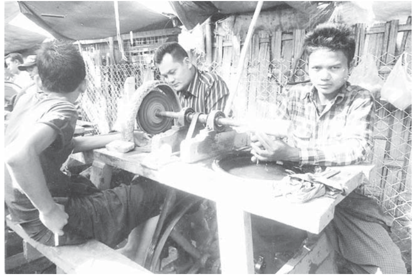
လိုင်စင်လုပ်ရမည့် သွေးခုံ

သယ်ယူမည့် ကျောက်များအတွက် စုပေါင်း၍ လည်းကောင်း၊ အတွဲလိုက်သော်လည်းကောင်း၊ တစ်ခုချင်းစီသော်လည်းကောင်း အခွန်ဆောင်ကြ သည်။ ကျောက်အရွယ်စားသေးလျှင် စုပေါင်း၍ အိတ်ထဲထည့်ချိန်က အခွန်ဆောင်ကြသည်။ အရွယ်ကြီးလျှင် အလျား၊ အနံ၊ အမြင့်တိုင်းပြီး အလေးချိန်သတ်မှတ်ကာ အခွန်ဆောင်ကြရ သည်။ ပစ္စည်းပိုင်ရှင်များက မန္တလေးသို့ရောက် မှသာ ကျောက်အလေးချိန်အလိုက် ငွေပေးချေ၍ ပစ္စည်းကို ရွေးယူရသည်။ ထိုအခါ သယ်ဆောင်သူ များက ပိုင်ရှင်များအတွက် အခွန်ဆောင်ထား သော သက်သေခံစာရွက်စာတမ်းများ ထုတ်ပေး ပါ။ ပေးရန်လည်းမဖြစ်နိုင်ပါ။ အဘယ်ကြောင့် ဆိုသော် ကျောက်များကိုစုပေါင်း၍တွက်ချက်ကာ အခွန်ဆောင်လာသောကြောင့်ဖြစ်သည်။ လုံးခင်း ရှိ ကျောက်မျက်ရုံးမှလည်း ကျောက်တစ်စလျှင် အခွန်ဆောင်ပြီး ပြေစာတစ်ရွက်ထုတ်ပေးရန် မဖြစ်နိုင်ပါ။ ဤသို့လုပ်နေလျှင် တစ်လကြာလျှင် ပင် ကားတစ်စီးတိုက်ရနိုင်မည်မဟုတ်။ ကျောက် များကလည်း ထမင်းစားကျောက်များဖြစ်၍ စုပေါင်း ဆောင်စေခြင်းဖြစ်သည်။ ဤအကြောင်း အခြင်းအရာများကို မသိသူ၊ သိအောင်လည်း လေ့လာမထားသူများက အခွန်ဆောင်ပြီးကြောင်း သက် သေခံစာရွက်စာတမ်းတောင်းနေကြ သည်။ အမှန်တကယ်တော့ မန္တလေးရောက်သော ကျောက်များသည် အခွန်ဆောင်ပြီးသော ကျောက် များသာဖြစ် သည်။ အခွန်မဆောင်ထားသော ကျောက်များမဝင်ရောက်စေရန် တားဆီးသည့် နည်းလမ်းမှာ လုံးခင်းကျောက်မျက်ရုံးအလွန်