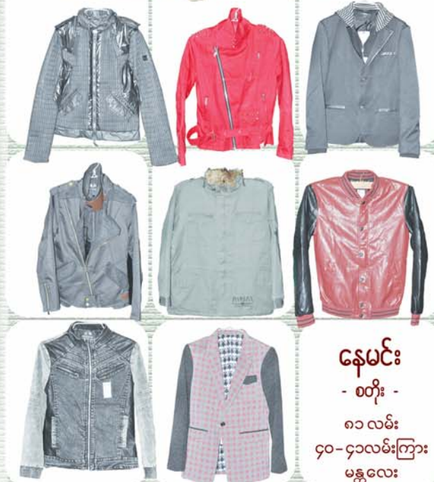
နေမင်း - စတိုး -