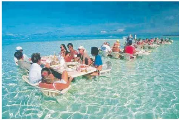
ဟာပိုင်ယီ ပင်လယ်စားသောက်ဆိုင်