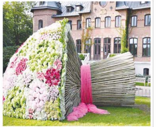
အိမ်ရှေ့က ပန်းစည်းကြီး