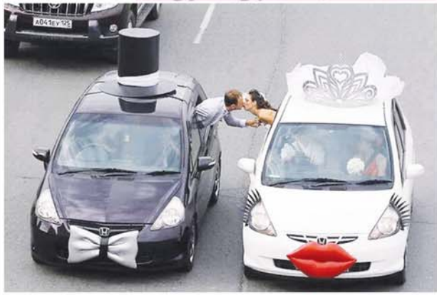
မင်္ဂလာကား စုံတွဲ