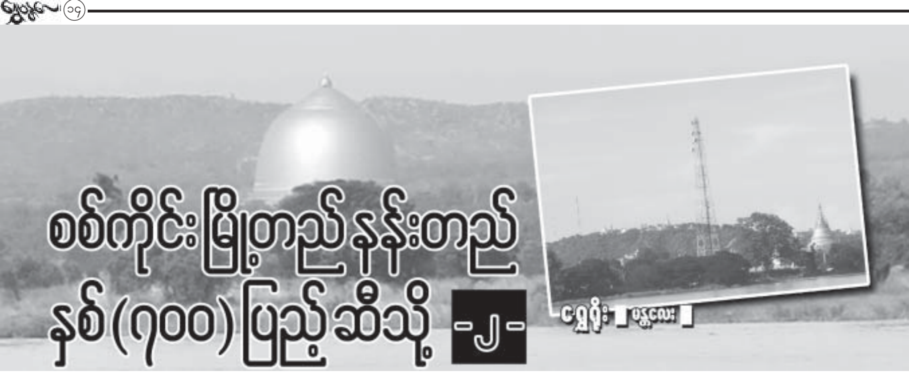
စစ်ကိုင်းမြို့တည် နန်းတည် နှစ်(၇၀၀)ပြည့် သီသို -၂-