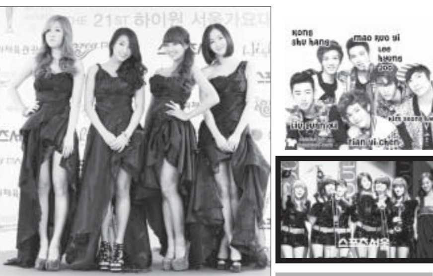
နွယ်စိုးဟန် ဘဝသံပြန်ဆိုသည့်

ကိုရီးယားနိုင်ငံတွင် ဝိတထူးချွန်ဆုများကို 2014 ခုနှစ်မှစတင်၍ အခမ်းအနားပြု ချီးမြှင့်ခဲ့သည်။ 2014 ခုနှစ်အတွက် ဝိတထူးချွန်ဆုပေးပွဲနှင့်ဖော်ပြပွဲကို ဆိုးလ်မြို့၌ ကျင်းပရာ အစိုးရပိုင်းမှ တာဝန်ရှိပုဂ္ဂိုလ်များ၊ ရုပ်ရှင်၊ ဝိတအနုပညာရှင်များတက်ရောက်ခဲ့ကြသည်။ 2014 ခုနှစ်အတွက် ဝိတထူးချွန်ဆုရရှိသူများမှာ တစ်နှစ်တာအကောင်းဆုံးဓာတ်ပြားဆုကို Dragon World ဓာတ်ပြားဖြင့် အဆိုတော်ယွန်းယောင်းဘေးကလည်းကောင်း၊ အကောင်းဆုံးသီချင်းဆုကို ချိုးယွန်းပီးက Bounce တေးသီချင်းဖြင့်လည်းကောင်း၊ အကောင်းဆုံးဂီတဆုကို ဆွန်ဖွဲ့ဖွန်းအာ ကလည်းကောင်း၊ တစ်နှစ်တာအကောင်းဆုံးရက်ဆုကို "ရောခီအင်နီနီ"