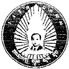
គណបក្ស ហ៊ុនស៊ីនប៊ុច