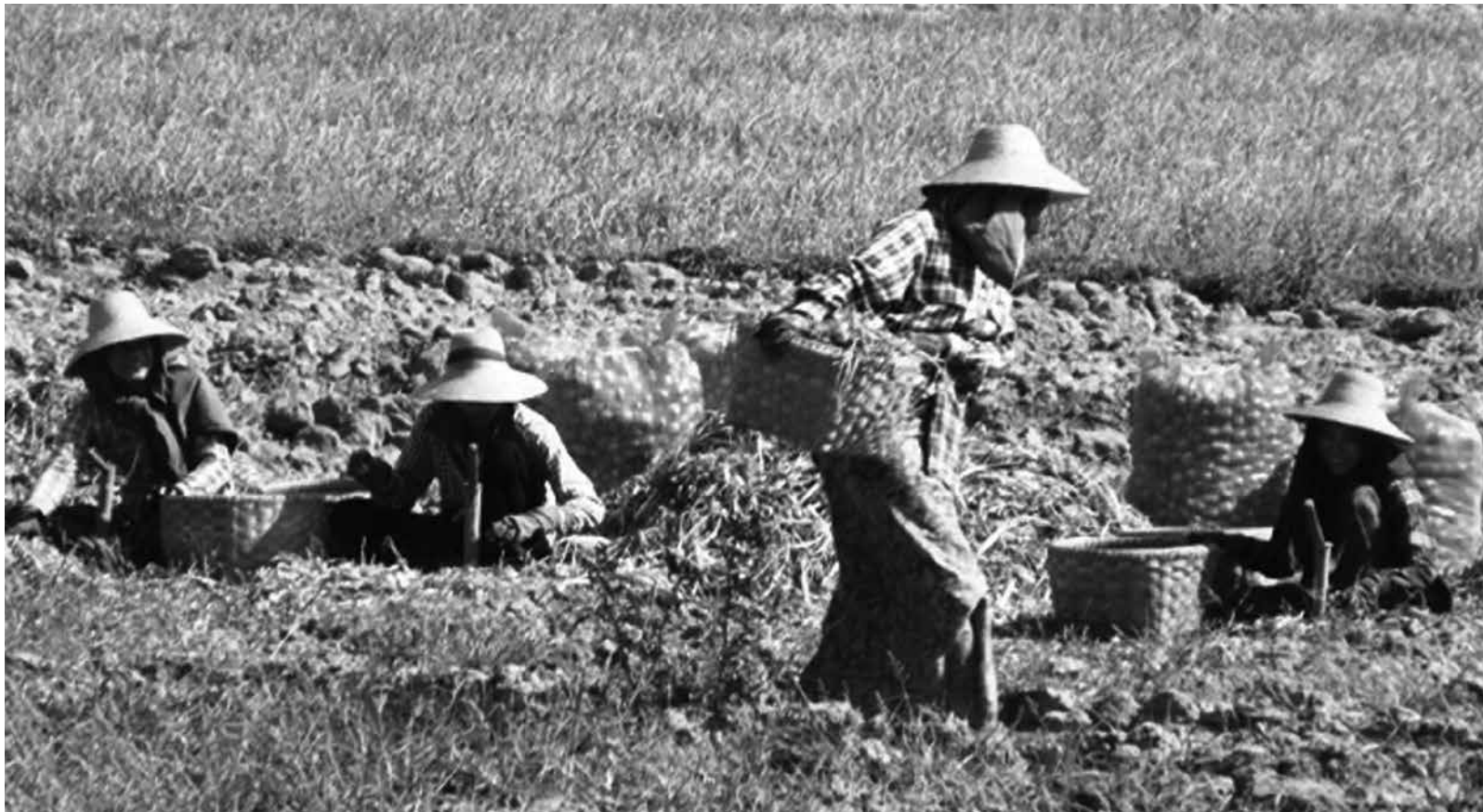
ကြက်သွန်နီဖော်နေသည့် အမျိုးသမီးများကို တွေ့ရစဉ်

ယခုရက်ပိုင်း အိန္ဒိယ နိုင်ငံတွင်လည်း ကြက်သွန်နီဈေးကျနေပြီး ပြည်တွင်းဈေးကွက်တွင်