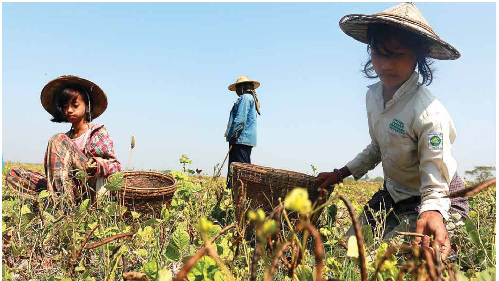
လှည်းကူးမြို့ နယ်အတွင်းရှိ ပဲတီစိမ်းစိုက်ခင်းတစ်ခုတွင် ပဲဆွတ်ခူးနေသည့် တောင်သူမိသားစုတစ်စုကို တွေ့ ရစဉ်

အတွဲ(၁၃)၊ အမှတ်(၁) ၂၀၀၂ မတ် ၇ တွင် စတင်ထုတ်ဝေသည် ၁၃၇၅ ခုနှစ်၊ တပေါင်းလဆန်း ၅ ရက် ၊ ဗုဒ္ဓဟူး ၊ (မတ် ၅ ၊ ၂၀၁၄)