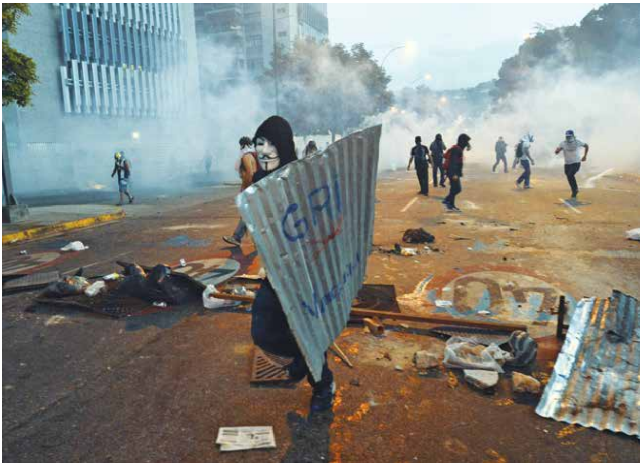
ဖေဖော်ဝါရီ ၂၈ ရက်က ကာရာကတ်စ်မြို့ အစိုးရဆန့်ကျင်ဆန္ဒပြပွဲအတွင်း Guy Fawkes မျက်နှာဖုံးတပ်ဆန္ဒပြသူတစ်ဦး သွပ်ပြားခိုင်းကာ ကိုင်ဆောင်ထားသည်ကို တွေ့ရစဉ်

ဆန္ဒပြပွဲစီစဉ်သူ အဲဖရက်ဒိုရိုမာရိုက နှိပ်စက်ညှဉ်းပန်းမှု ၃၀၀ ကို