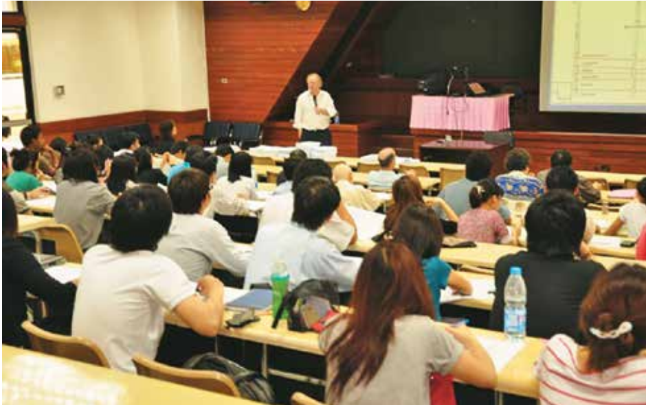
ချူလာလောင်ကွန်းတက္ကသိုလ်အတွင်းရှိ စာသင်ခန်းကို တွေ့ရစဉ်

နေလင်းထွန်း ရန်ကုန်၊ မတ်-၁ ထိုင်းနိုင်ငံ၊ ဘန်ကောက်မြို့ရှိ ချူလာလောင်ကွန်းတက္ကသိုလ်တွင် ပြည်သူ့ကျန်းမာရေးဘွဲ့လွန်ပညာသင်ဆု လျှောက်ထားနိုင်ကြောင်း ကြေညာထားသည်။