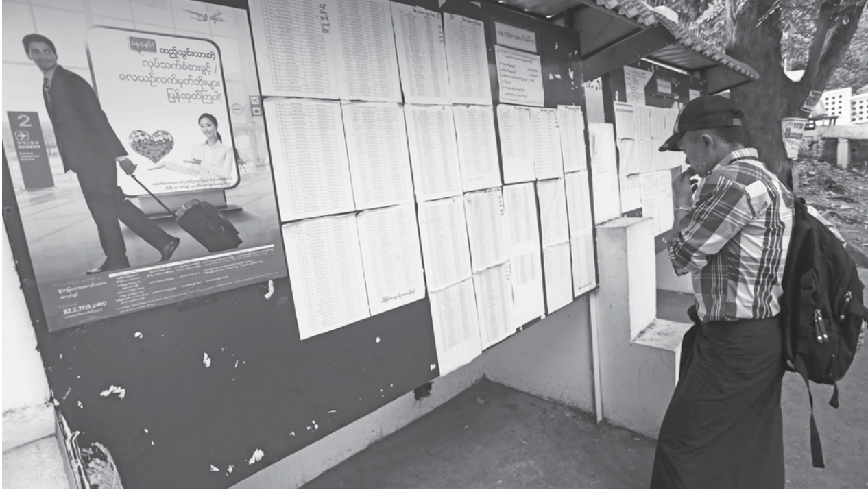
အလုပ်ခေါ်စာကပ်ထားသည့်ကိုကြည့်နေသူတစ်ဦး

အေးမြတ်သူ ရန်ကုန်၊ မတ်-၃ ကိုရီးယားနိုင်ငံမှ ကုန်ထုတ်လုပ် ဝန်းများအတွက် ယခုနှစ်အတွင်း မြန်မာအလုပ်သမားငါးထောင် ကျော်ခေါ်ယူသွားမည်ဖြစ်ကြောင်း HRD Korea EPS စင်တာမှ သတင်းရရှိသည်။ ကိုရီးယားနိုင်ငံ ကုန်ထုတ် လုပ်ငန်းများအတွက် မြန်မာအ လုပ်သမား ၅၃၀၀ခန့်ခေါ်ယူမည် ဖြစ်သည်။ နိုင်ငံပေါင်း ၁၅ နိုင်ငံမှ နိုင်ငံခြားသားလုပ်သားများကို ခေါ် ယူ ကမ်းလှမ်းလုပ်ကိုင်စေရာတွင် မြန်မာလုပ်သားများသည် အခြား နိုင်ငံသားများထက် လုပ်ကိုင်နိုင်မှု စွမ်းရည်ကောင်းမွန်သည့်အတွက် ယခုနှစ်တွင် အလုပ်ခေါ်စာများပိုမို ကမ်းလှမ်းခံရခြင်းဖြစ်သည်။ ယခုနှစ်တွင် ကိုရီးယားနိုင်ငံ က မြန်မာအလုပ်သမားခေါ်ယူမှု မြင့်တက်လာသည့်အခွင့်အလမ်းကို ရိုးယားနိုင်ငံအတွင်း တရားမဝင်