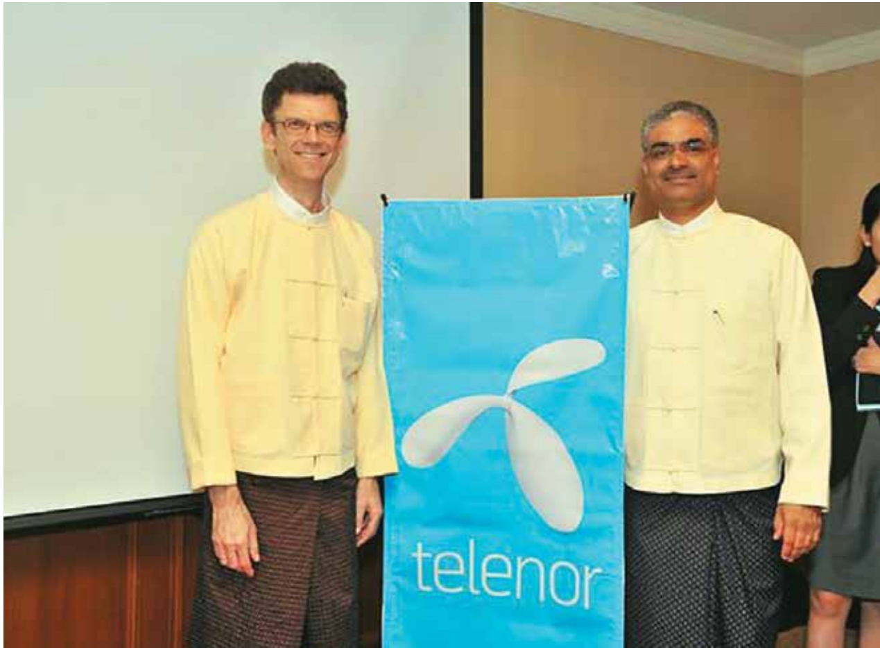
တယ်လီနောမြန်မာမှာ CEO နှင့် တာဝန်ရှိသူတစ်ဦး