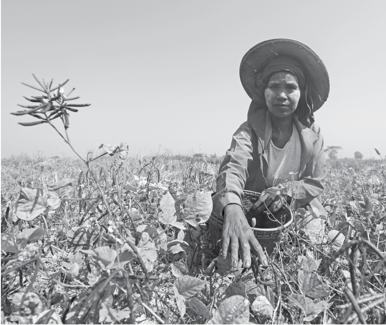
ပဲတီစိမ်းဆွတ်ခူးနေသည့် အမျိုးသမီးတစ်ဦး

သို့သော်လည်း အဆိုပါမြေနေရာများတွင် စိုက်ပျိုးရန်မဆိုထားနှင့်။ ဦးရင်နွယ်ကဲ့သို့ မူလပိုင်ရှင်များခြေချခွင့်ရရန်ပင် ကြန့်ကြာနေဆဲဖြစ်သည်။