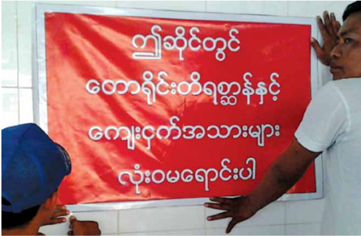
ကျိုက်ထီးရိုးတွင် တားမြစ်ထားသောစာချိတ်ထားသည့်ဆိုင်