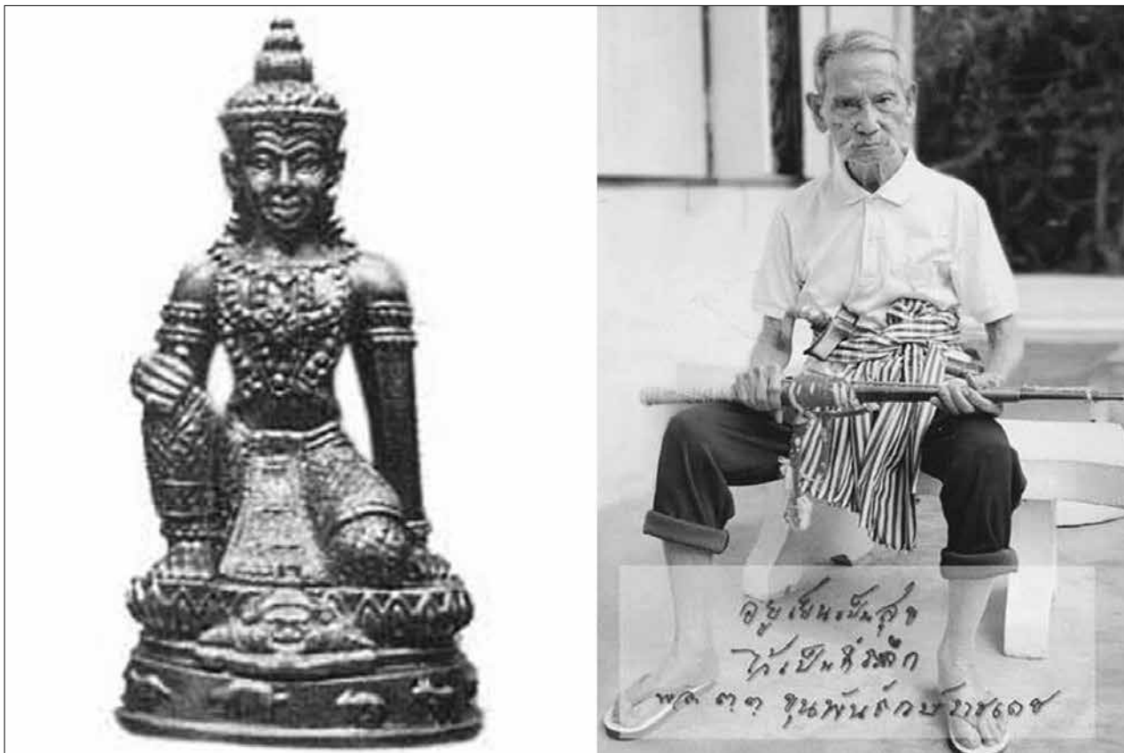
ကျထူးခမ်းရာမာထပ်ရုပ်တုနှင့် ကျထူးခမ်းဆရာကြီး ထိုင်းရဲဗိုလ်ချုပ် ခွန်ပန်

“ဆိုင်ပါသော်ကောကိုရင်ရယ်။ စာဏကျအမတ်ကြီးရဲ့အ