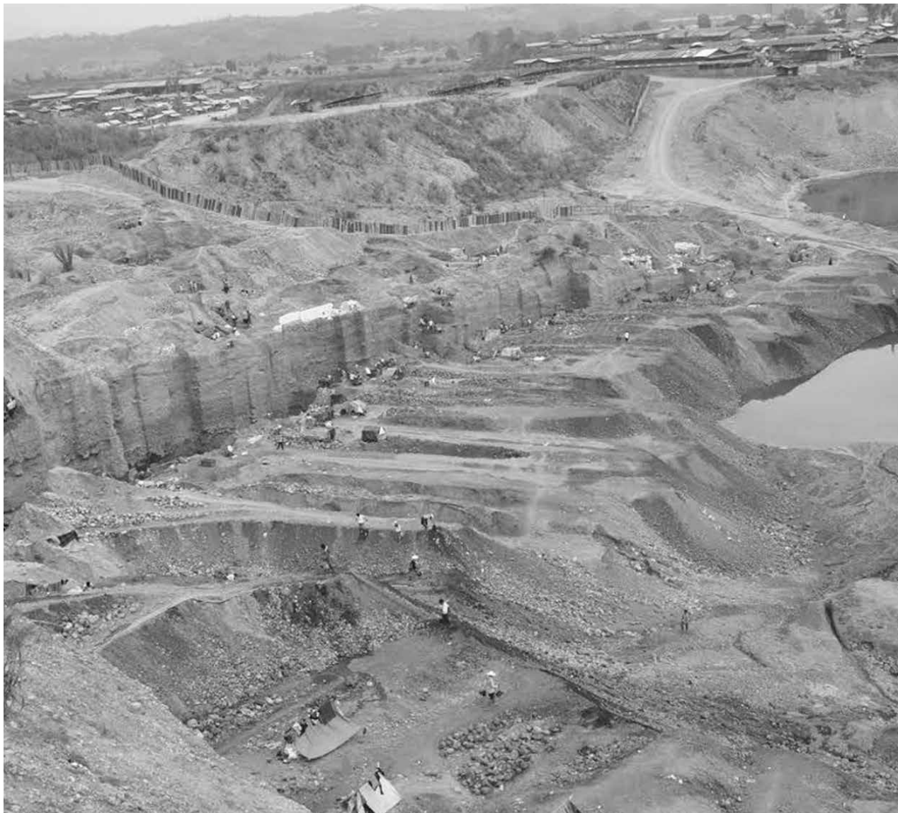
ကမ္ဘာကျော် ကျောက်စိမ်းများထွက်ရာ ဖားကန့်ဒေသ

ကိုကျော်မင်းအပါအဝင် အလုပ်သမားရှစ်ဦး ပါဝင်သည့် ကျောက်တူးအဖွဲ့ကို လော်ပန် (ကျောက်တွင်းသူဌေး)တစ်ဦးက စားသောက်ကုန်ကျစရိတ် စိုက် ထုတ်ပေးထားပြီး လွန်ခဲ့သည့် နှစ်လကျော်ကပင် မှော်စိစာတွင် ကျောက်ကျင်းတူးနေခြင်းလည်း ဖြစ်သည်။ ကျောက်အောင်၊ မ အောင်မသေချာသေးသော်လည်း