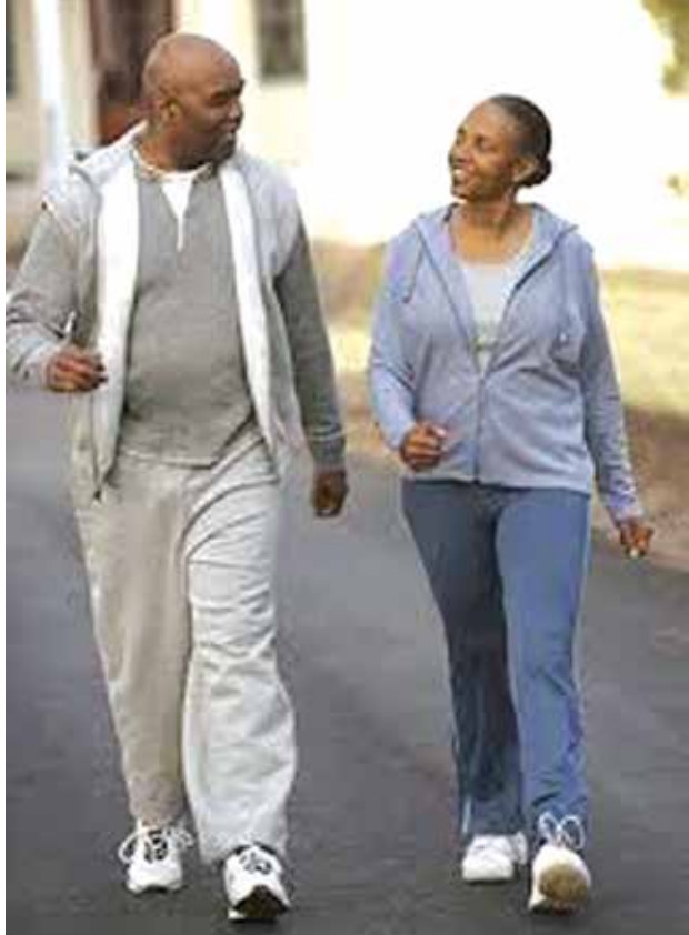
သည်။ အရိုးပွခြင်းနှင့် ခန္ဓာကိုယ်ညွှန်းကိန်းဆက်စပ်မှုအရ ပုံမှန်အလေးချိန်ရှိသူများတွင် ၅၃ ရာခိုင်နှုန်း၊ ပုံမှန်အလေးချိန်ထက် လျော့နည်းသူများတွင် ၁၃ ရာခိုင်နှုန်း၊ ပုံမှန်အလေးချိန်ထက် များသူများတွင် ၂၅ ရာခိုင်နှုန်းနှင့် အဝလွန်သူများတွင် ၅၈ ရာခိုင်နှုန်း အထိ ရှိနေသည်ဟု သိရသည်။

အရိုးပွခြင်းသည် မျိုးရိုးရှိသူများ၊ ဆေးလိပ်သောက်သူများ၊ အားကစားလုပ်ရှားမှု မရှိသူများ၊ ပန်းနာရင်ကြပ်ရောဂါအတွက် ဆေးဝါးစွဲသောက်နေသူများ၊ အချိန်မတိုင်မီ ဓမ္မတာဆုံးသည့် အမျိုးသမီးများနှင့် အသက် ၆၅ နှစ် ကျော်သူများတွင်အဖြစ်များပြီး အရိုးပွ၍ အရိုးကျိုးခြင်းမှ ကာကွယ်ရန် နေ့စဉ်စားသုံးသော အစားအသောက်များတွင်ကယ်လ်ဆီယမ်နှင့် ဗီတာမင်ဒီ ပြည့်ဝစွာ စားသောက်ရန်၊ အာဟာရမျှတစေရန် စားသောက်ခြင်း၊ ဆေးလိပ်နှင့်အရက်ဖြစ်ခြင်း၊ ကိုယ်လက်လှုပ်ရှားမှု အားကစားတစ်ခုခုကို လုပ်ဆောင်ရန် လိုအပ်သည်ဟု ဆေးပညာရှင်များက အကြံပြု