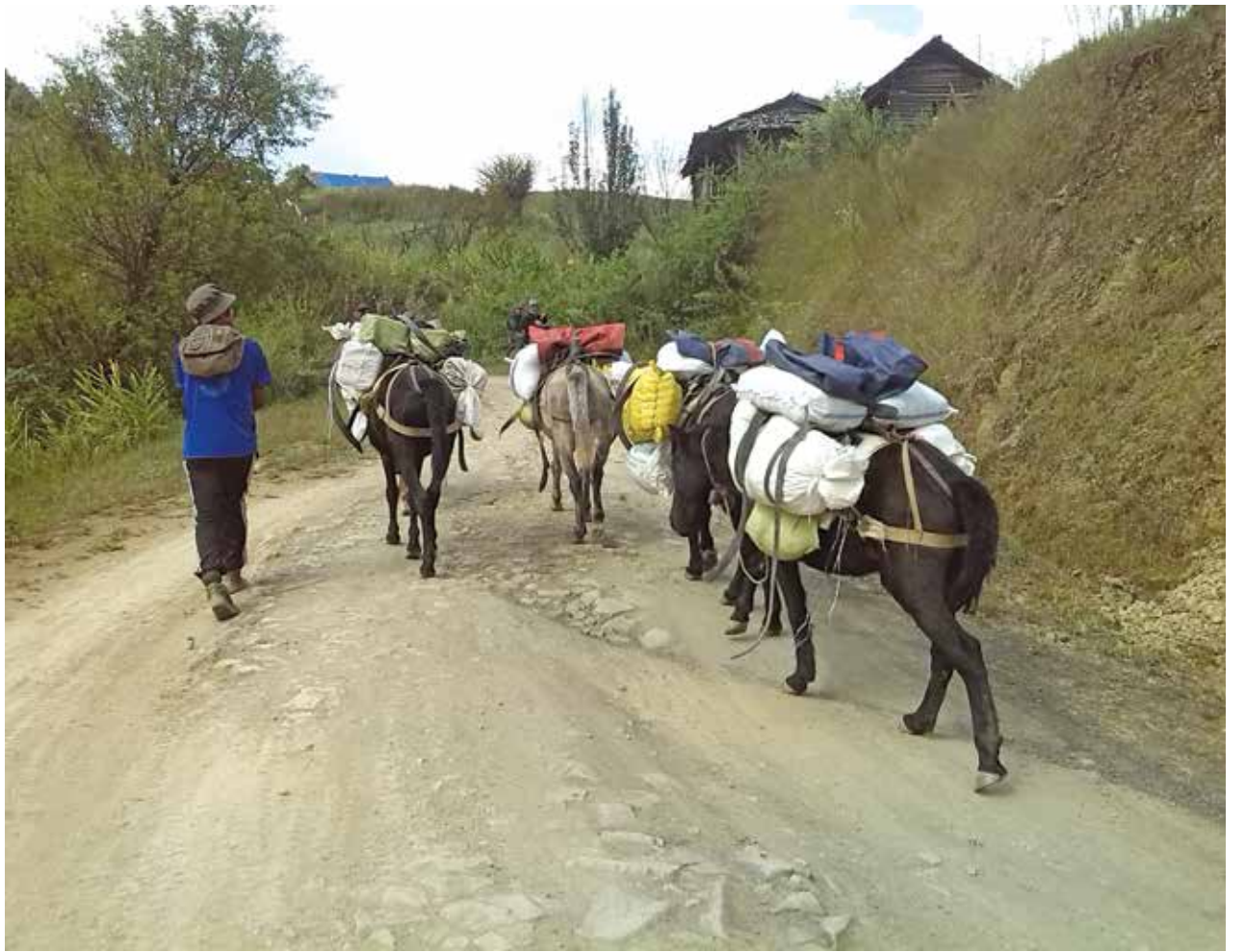
ချင်းတောင်တန်းများကြားတွင် တွေ့ရသည့် ဒေသခံခရီးသွားတစ်ဦး

အခမ်းအနားကို Hakha Town Hall တွင် ကျင်းပခဲ့ပြီး ချင်းပြည်နယ်ဝန်ကြီးများ၊ ဘာသာရေးခေါင်းဆောင်များနှင့် ကိုးမြို့နယ်မှ သက်ဆိုင်ရာတာဝန်ရှိသူများတက်ရောက်ခဲ့ကြသည်။ ယခု ထောက်ပံ့ခြင်းသည် ၂၀၁၂-၁၄ ဘတ်ဂျက်ထဲမှ ပေးအပ်ခြင်းဖြစ်ပြီး သဘာဝဘေးဒုက္ခကူညီရေးအတွက် ကျပ်သိန်း ၁၀၀၀၊ မိဘမဲ့၊ အိုမင်းမစွမ်းစောင့်ရှောက်ရေးအတွက် ကျပ်သိန်းပေါင်း ၇၀၀ ဒသမ ၃၃ စုစုပေါင်း ကျပ်သိန်း ၁၇၀၀ ဒသမ ၃၃ ဖြစ်ကြောင်း ချင်းပြည်နယ်ဝန်ကြီးဌာန ဝန်ကြီးတစ်ဦးက ပြောသည်။ အဆိုပါ ထောက်ပံ့ငွေကို