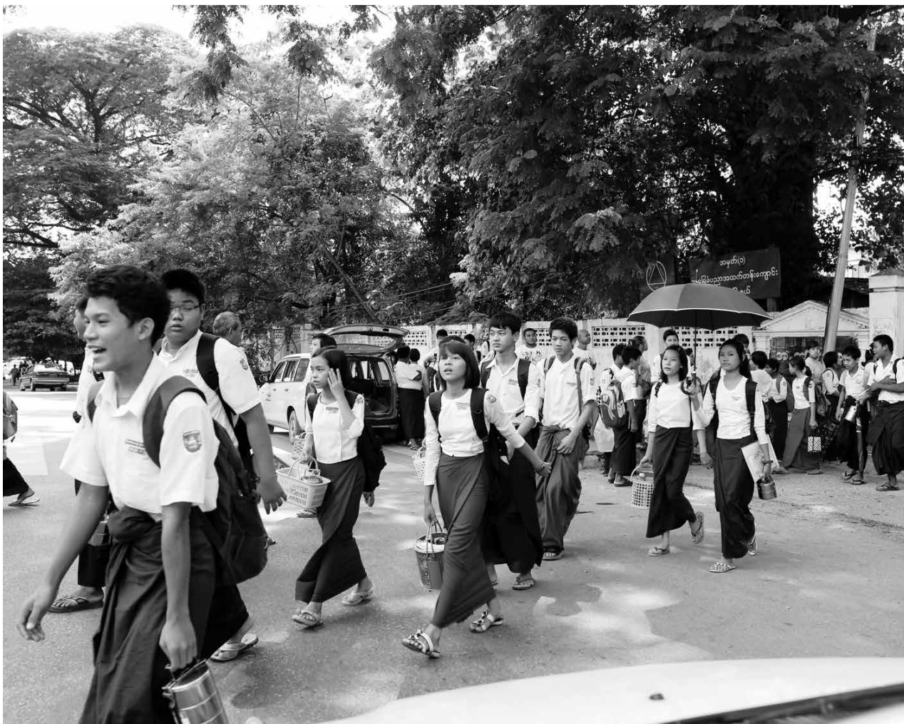
အစိုးရအထက်တန်းကျောင်းမှ ကျောင်းသူ၊ ကျောင်းသားများကို တွေ့ရစဉ်