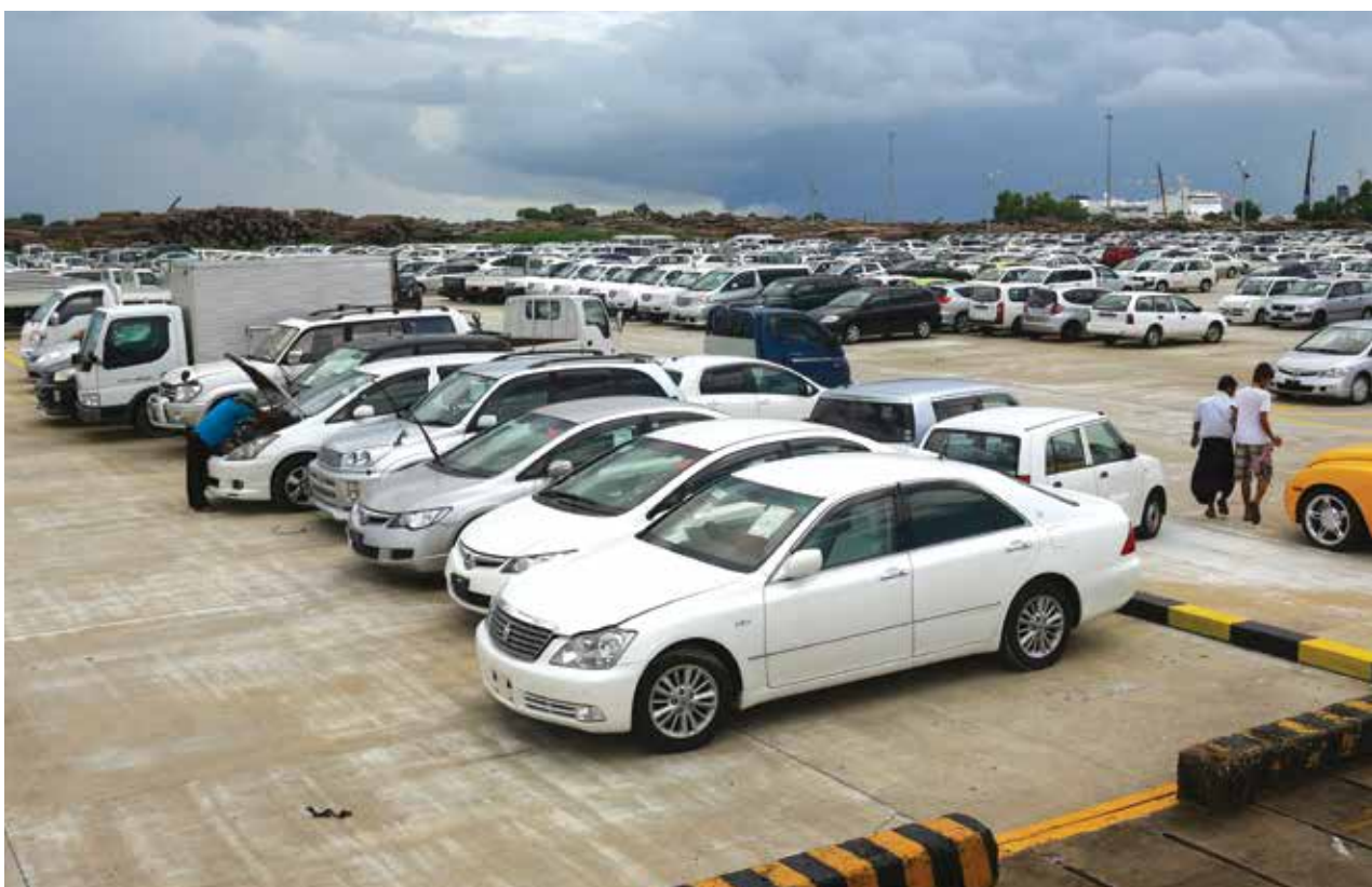
နိုင်ငံခြားမှ ရောက်ရှိလာသောကားများကို သီလဝါဆိပ်ကမ်း၌ တွေ့ရစဉ်