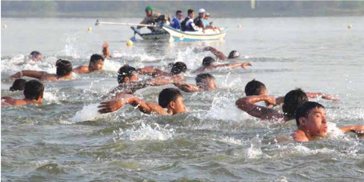
နေပြည်တော်တွင်ပြုလုပ်ခဲ့သည့် သုံးမျိုးစုံပြိုင်ပွဲလူရွေးပွဲ၌ ပြိုင်ပွဲဝင်များယှဉ်ပြိုင်နေစဉ်