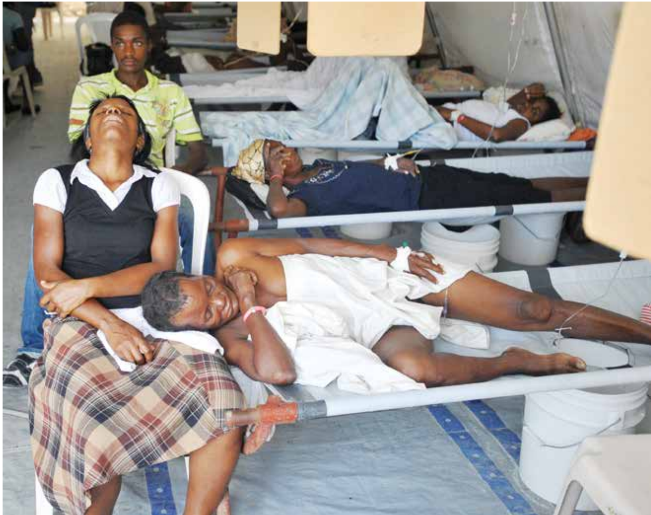
ဟေတီနိုင်ငံ၊ ဒယ်မတ်စ်ဒေသ၌ ကာလဝမ်းရောဂါကုသမှုခံယူရန် လူနာသစ်တစ်ဦးအား နယ်စည်းမခြားဆရာဝန်များအဖွဲ့ ဆေးခန်းသို့ ပို့ဆောင်ထားသည်ကို ၂၀၁၂ နိုဝင်ဘာ ၇ ရက်ကတစ်ပုံတွင် တွေ့ ရစဉ်

ကုလသမဂ္ဂက ကာလဝမ်းရောဂါ ဖြစ်ပွားခြင်း၏ အဓိကအရင်းအမြစ်ကို အတိအကျဖော်ထုတ်ရန် မဖြစ်နိုင်ကြောင်းနှင့် ယင်းအတွက် နှစ်နာကြေးပေးရန် တာဝန်ယူနိုင်ကြောင်း ပြောကြားသည်။