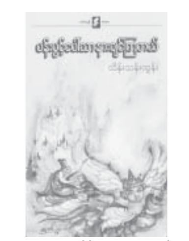
တန်ဖိုး - ၂၅၀၀ ကျပ်