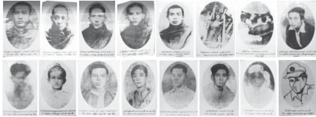
ဗိုလ်ဝင်းမောင်(၁၂)ရပ်မု

ကိုအောင်ကျော် သေဆုံးမှုကြောင့် မန္တလေးက ကျောင်းသားများဟာ မခံမရပ်နိုင်ဖြစ်ပြီး ဆန္ဒ