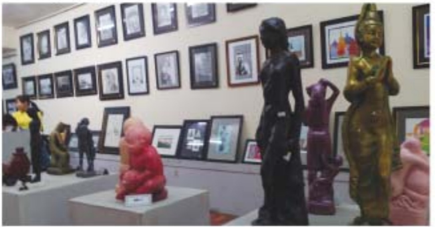
ပါဝင်ပြသသည်။ ပြပွဲတွင် ၁၂၂ ကား၊ မင် ငှက်ကား၊ ပတ်စတာယိုက် နှစ်ကား၊ ခေမဆေး ဂွက်ကား၊ ခေမဆေး အထူ သုံးကား၊ အခရစ်လစ် သုံးကားနှင့် ပလာစတောမြင့်ပြုလုပ်ထားသော ပန်းပုပုရင်

အမျိုးသားယဉ်ကျေးမှုနှင့် အနုပညာတက္ကသိုလ်(မန္တလေး) ၂၀၁၄-၂၀၁၅ပညာသင်နှစ် ပန်းချီပန်းပုကျောင်းသား ကျောင်းသူများ၏ မိုးဆက်သစ်ပန်းချီပန်းပုပြပွဲကို ဇူလိုင် ၂၉ရက်မှစတင်၍ မန္တလေးတောင်ပန်းချီပြခန်းတွင် ခင်းကျင်းပြသကြောင်း သိရသည်။ မိုးဆက်သစ်ပန်းချီပန်းပုပြပွဲ New Generationကို ၂၀၁၃-၂၀၁၄ ပညာသင်နှစ်မှစတင်ကျင်းပလာခဲ့ရာ ယခုပြပွဲ အပါအဝင် (၁၁)ကြိမ်မြောက် ပြသခြင်းဖြစ်သည်။ ယခုနှစ်ပြပွဲတွင် အနုပညာဌာနခွဲ(ပန်းချီ)မှ ကျောင်းသား ကျောင်းသူ ၄၉ဦးနှင့် အနုပညာဌာနခွဲ(ပန်းပု)မှ ကျောင်းသား၊ ကျောင်းသူ ၁၆ဦးတို့ ပါဝင်ပြသကြရာ ပထမနှစ်၊ ဒုတိယနှစ်၊ တတိယနှစ်၊ ပထမနှစ် (ဂုဏ်ထူးတန်း)၊ ဒုတိယနှစ်(ဂုဏ်ထူးတန်း)နှင့် ဒီပလိုမာသင်တန်းသား၊ သင်တန်းသူများ