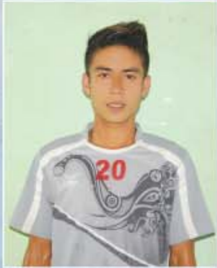
အောင်ကျော်

ထက်မြတ်ထွန်း ( ရတနာပုံလှလှဘောလုံးအသင်း )