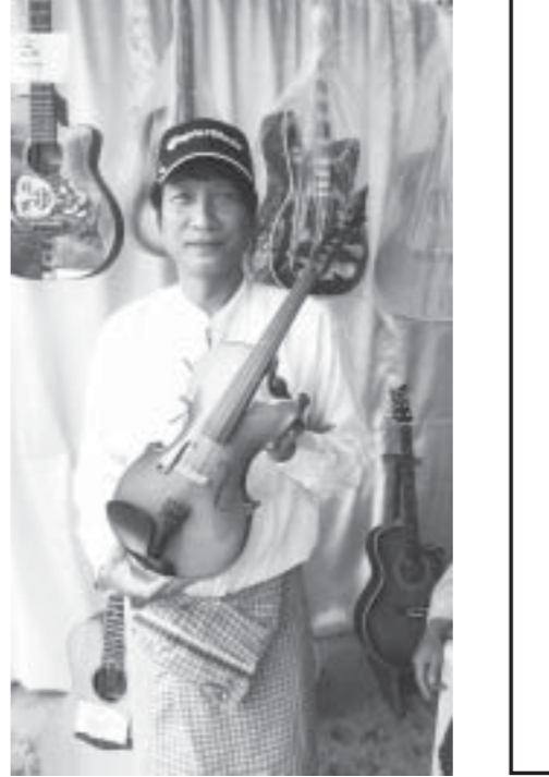
at mi&Z, m

အနစ် ၇၀၀ပြည့်ပွဲတော်ကျင်းပ ဖွင့်လှစ်ပြီးနောက် နိုင်ငံတော်သမ္မတဦးသိန်းစိန်အား ဘင်ခရာအဖွဲ့မှ စွမ်းရည်ပြတီးမှုတ်အလေးပြုခြင်း မန္တလေးအား/ကာသိပွဲမှ အားကစားစွမ်းရည်ပြသခြင်း၊ မြန်မာနိုင်ငံခြင်းလုံးအဖွဲ့ ခြင်းအားကစားမောင်မယ်များက ခြင်း