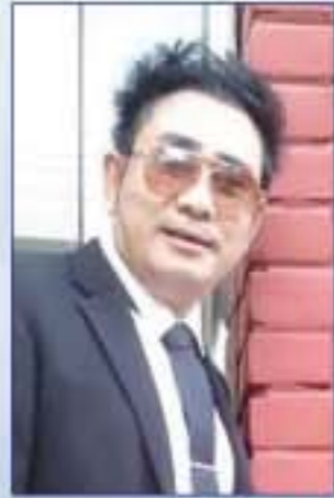
ဝင်းလင်းဆောင်

ဤစာအုပ်ကို လူတွေအားလုံးမှာ 'တစ်ရက်စာ' လုပ်ငန်းစဉ်တွေ ရှိကြတယ်။ အောင်မြင်နေတဲ့ လူတွေအားလုံးမှာ 'တစ်သက်စာ' လုပ်ငန်းစဉ်တွေ ရှိကြတယ်။ ဒါကြောင့် --