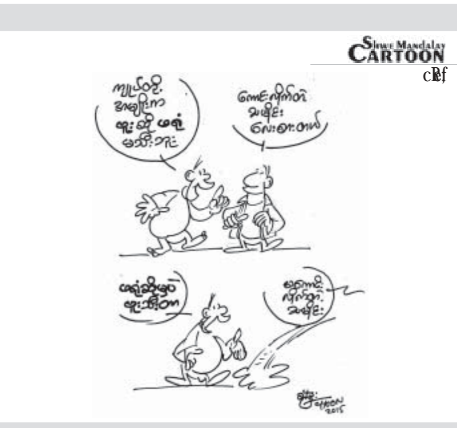
Shwe Mandalay Cartoon CBF