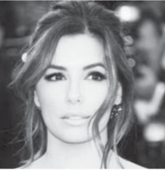
ထင်တယ်။ ပြီးတော့ ကျွန်မက ကျန်းမာရေးကိုလည်း ဂရုစိုက်တယ်။ အချိန်မှန်စားပြီး လေ့ကျင့်ခန်းလည်း လုပ်တယ်”ဟု Daily Mail Australia သို့ပြောကြားခဲ့သည်။

အီဗာလွန်ဂိုရီးအားက သူမအလိုချင်ဆုံးအရာမှာ အသက် ၂၀အရွယ်တုန်းက ခန္ဓာကိုယ်ပုံစံပင်ဖြစ်သည်။ “ ကျွန်မက အသက် လေးဆယ်ကျော်ဘဝမှာနေရတာ ပျော်ပါတယ်။ ဒါပေမဲ့ အသက် ၂၀ အရွယ်တုန်းက ခန္ဓာကိုယ်ပုံစံကို ပြန်လိုချင်ပါတယ်။ အသက်ကြီးလာတော့ ရင်ကျက်မှုက များလာပါတယ်။ ကျွန်မ အသက် ၄၀ကျော်ဘဝကို ပိုပြီးသဘောကျပါတယ်။ အသက်ကြီးလာတော့ အရာရာတိုင်းကို သတိထားမိလာတယ်။ ဒီလိုသတိထားမိတာကို ကျွန်မ