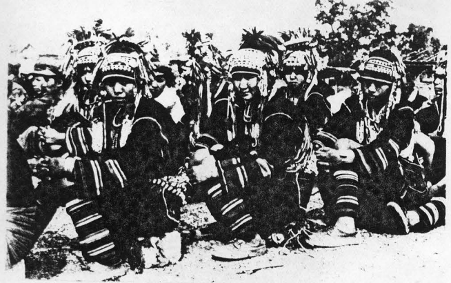
လူထုအစည်းအဝေးတက်ရောက်သူအချို့