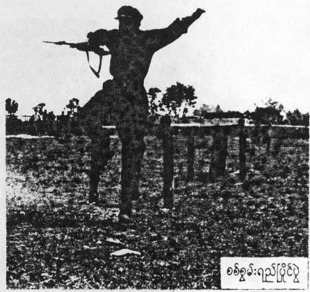
စစ်စွမ်းရည်ပြိုင်ပွဲ