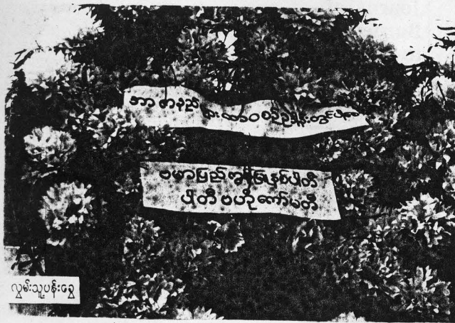
လွမ်းသူ့ပန်းတွေ