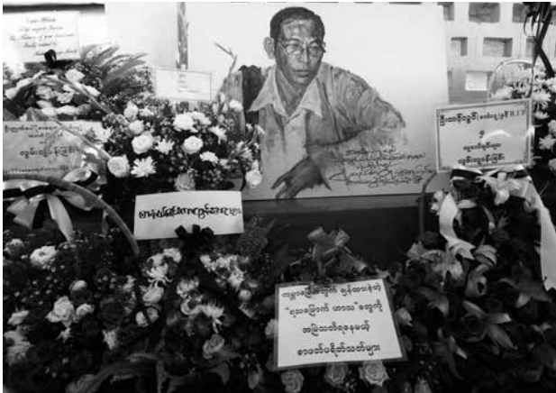
စာရေးဆရာမင်းလူ(ခ)ဦးညွှန်ပေါ်၏ ဈာပနအခမ်းအနား