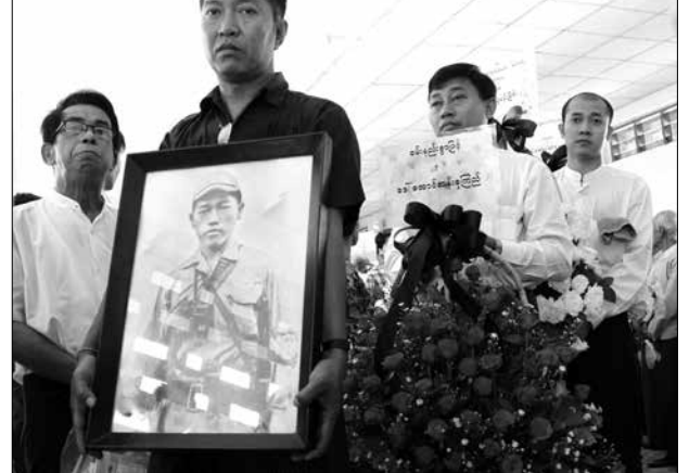
ရဲဘော်သုံးကျိပ်ထဲမှ နောက်ဆုံးကျန်ရစ်သူ ဗိုလ်ရဲထွဋ်၏ ဈာပန