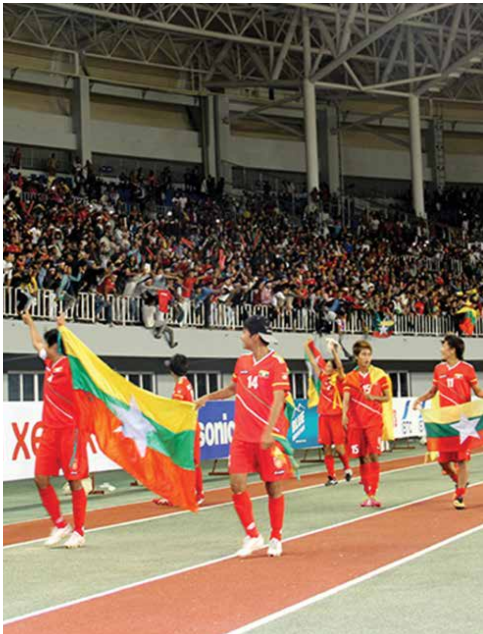
အားကစားသမားများထားရမည့်စိတ်ဓာတ်ကို အကောင်းဆုံးပြသခဲ့သော မြန်မာအမျိုးသမီးဘောလုံးအသင်း