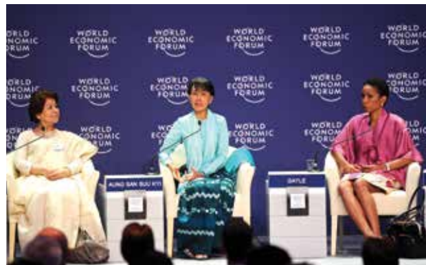
(၂၂)ကြိမ်မြောက် ကမ္ဘာ့စီးပွားရေးဖိုရမ်ကို မြန်မာနိုင်ငံတွင် ပထမဆုံးအကြိမ်အဖြစ် ဇွန်လ၅ရက်မှ ၇ရက်အထိ နေပြည်တော်၌ ကျင်းပနေစဉ်။