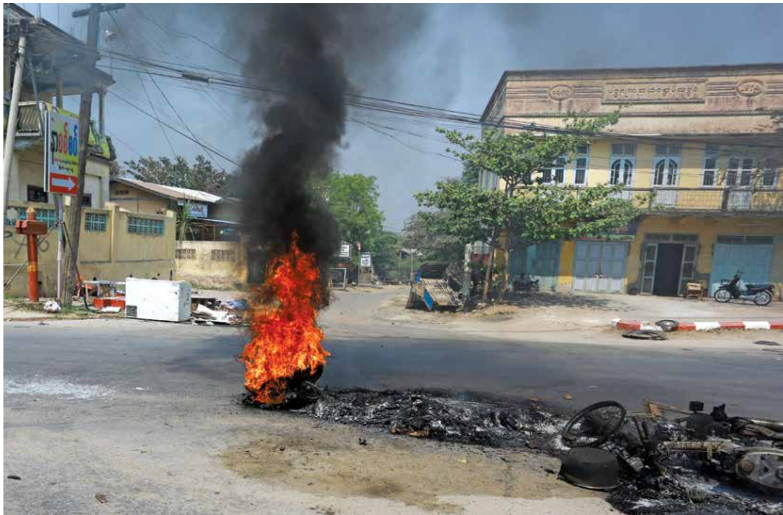
ကမ္ဘာတစ်ဝှမ်း တုန်လှုပ်ချောက်ချားသွားသည့် မိတ္ထီလာအကြမ်းဖက်မှု ဖြစ်ပွားနေစဉ် မြို့တစ်နေရာကို တွေ့ရစဉ်