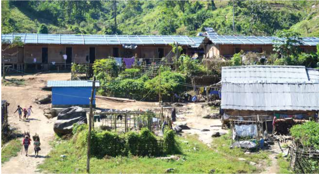
ကချင်ပြည်နယ်တစ်နေရာရှိ စစ်ပြေးဒုက္ခသည်စခန်းတစ်ခု

ကရင်အမျိုးသားအစည်းအရုံး (KNU) ဥက္ကဋ္ဌ ဝိုလ်ချုပ်ကြီးမှူး တူးဆေးဖိုးနှင့် မြန်မာ့တပ်မတော်