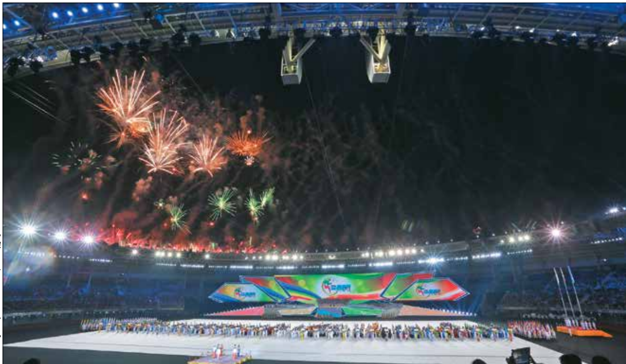
ဓာတ်ပုံ-ရေပေါင်မောင်(အမရပူရ)