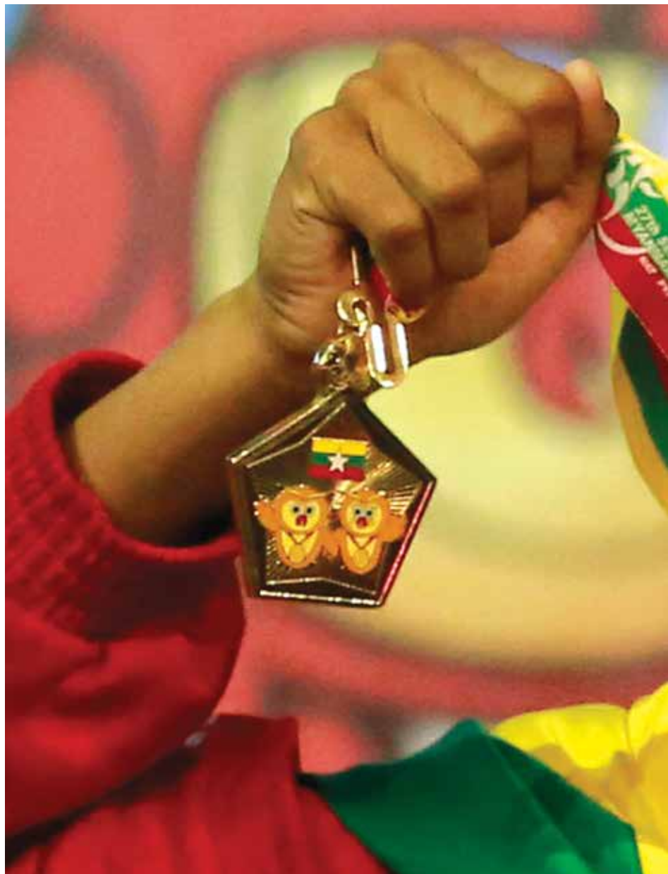
ရွှေဆုရမြန်မာ့ဂုဏ်ဆောင်ကစားသမားတစ်ဦး ရွှေတံဆိပ်ဆုပြသနေစဉ်

၂၀၁၃ အတွက် မြန်မာနိုင်ငံမှ အထင်ရှားဆုံးပုဂ္ဂိုလ် (Person of the Year)အဖြစ် (၂၇)ကြိမ်မြောက် ဆီးဂိမ်းပြိုင်ပွဲတွင် အိမ်ရှင်အတွက် ရွှေတံဆိပ်ဆု ၈၆ ခု ရယူပေးခဲ့သော အားကစားသမားများနှင့် မြန်မာအမျိုးသမီးဘောလုံးအသင်းကို 7Day News Journal က ပူးတွဲရွေးချယ်လိုက်ပါသည်။