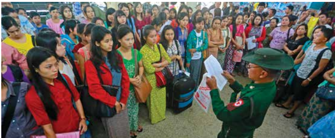
မြန်မာနိုင်ငံတွင် ပထမဆုံးအကြိမ်အဖြစ် ဘွဲ့ရအမျိုးသမီးများကို ဗိုလ်လောင်းအဖြစ် လျှောက်လွှာခေါ်ယူခဲ့သည်။