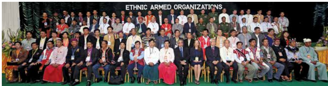
နှစ်ပေါင်း၆၀ကျော်အတွင်း ပထမဆုံးအကြိမ်အဖြစ် အစိုးရနှင့် တိုင်းရင်းသားလက်နက်ကိုင်အဖွဲ့ (၁၇)ဖွဲ့တို့ တစ်နေရာတည်း၊ တစ်ကြိမ်တည်းတွေ့ဆုံပြီး ငြိမ်းချမ်းရေး ဆွေးနွေးမှုအဖြစ် အောက်တိုဘာ၄ရက်၊ ၅ရက်တို့တွင် မြစ်ကြီးနားမြို့ မဗျယ်ခန်းမ၌ တွေ့ဆုံခဲ့သည်။