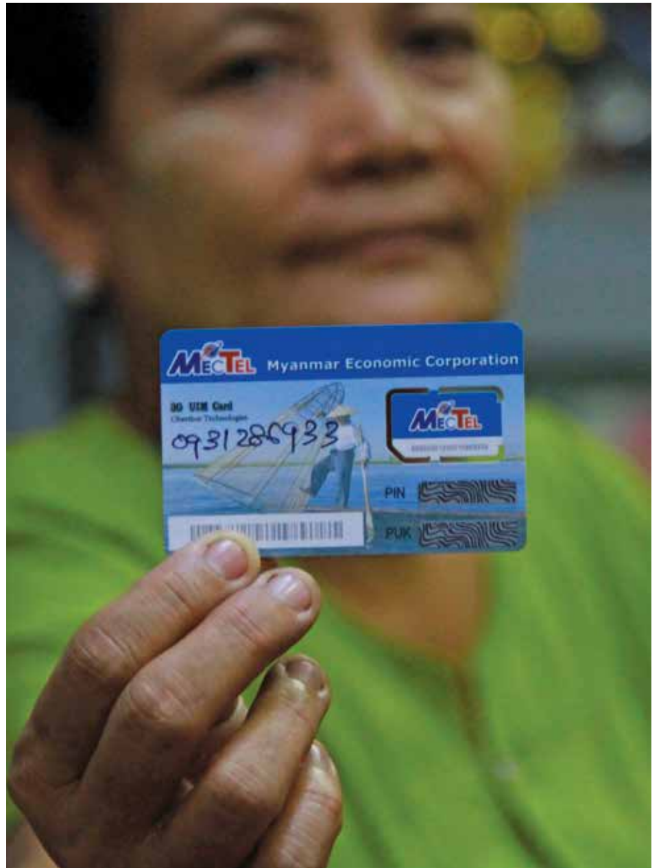
၁၅၀၀ တန်ဖုန်းကတ် မဲပေါက်သူတစ်ဦးက ကတ်ကို ပြသနေစဉ်

မြန်မာနိုင်ငံတွင် ဆက်သွယ်ရေးကွန်ရက် ချဲ့ထွင်ရန်အတွက် လည်း ဆက်သွယ်ရေးဝန်ဆောင်မှုလုပ်ငန်းလိုင်စင် နှစ်ခုကို ချထားပေးနိုင်ရန် ၂၀၂ ခုနှစ် ဇူလိုင်လအတွင်းက နိုင်ငံပိုင် သတင်းစာများတွင် တင်ဒါခေါ်ခဲ့သည်။ ခေါ်