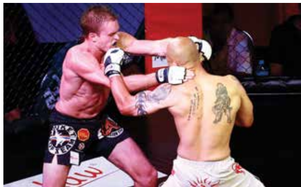
ကိုယ်ခံပညာရပ်ပေါင်းစုံ အသုံးပြုတိုက်ခိုက်သော အမ်အမ်အေပြိုင်ပွဲကို ပထမဆုံးအကြိမ်အဖြစ် ရန်ကုန်မြို့၌ ဩဂုတ်၃၀ရက်က ကျင်းပခဲ့သည်။