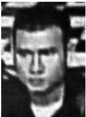
နေတိုး(ခ)စောရွှေထူး

ကြီး၊ တွံတေးမြို့နယ် ကားလမ်းပေါ်တွင် နိုဝင်ဘာ ၆ ရက်နေ့ခင်း အချိန်၌ ဆိုင်ကယ်စီးလာသည့် ဇနီးမောင်နှံနှစ်ဦးကို ကြိုးတပ်ခေါ်ကာ အက်ရှင်ဇာတ်ကားဆန်ဆန် ငွေကျပ်သိန်း ၂၀၀၀ တောင်းသည့် ပြန်ပေးဆွဲမှု တရားခံသုံးဦးတွင် ခေါင်းဆောင်ကို ယနေ့တိုင်ဖမ်းဆီးနိုင်ခြင်းမရှိသေးပေ။ ထို့အပြင် နိုဝင်ဘာ ၁၁ ရက် ည၌ သန်းခေါင်အချိန်တွင် မင်္ဂလာဒုံမြို့နယ် အတွင်း၌ ရာအိမ်မှူး၏ချွေးမနှင့် မြေးတို့နှစ်ဦးအား လည်ပင်းလှီးဖြတ်သတ်ခဲ့သည့် တရားခံမှာ လည်း ထွက်ပြေးလွတ်မြောက်နေဆဲဖြစ်သည်။