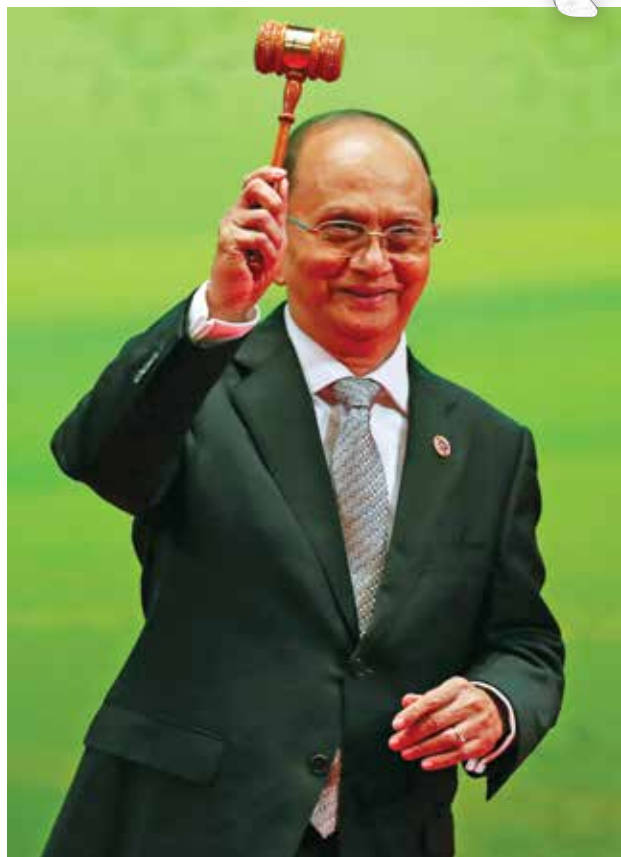
မြန်မာနိုင်ငံအတွက် ပထမဆုံးအကြိမ်အဖြစ် အာဆီယံအလှည့်ကျဥက္ကဋ္ဌတာဝန်ကို ဘရူနိုင်းနိုင်ငံထံမှ ၂၀၁၃အောက်တိုဘာ၁၀ရက်က လွှဲပြောင်းယူစဉ်။