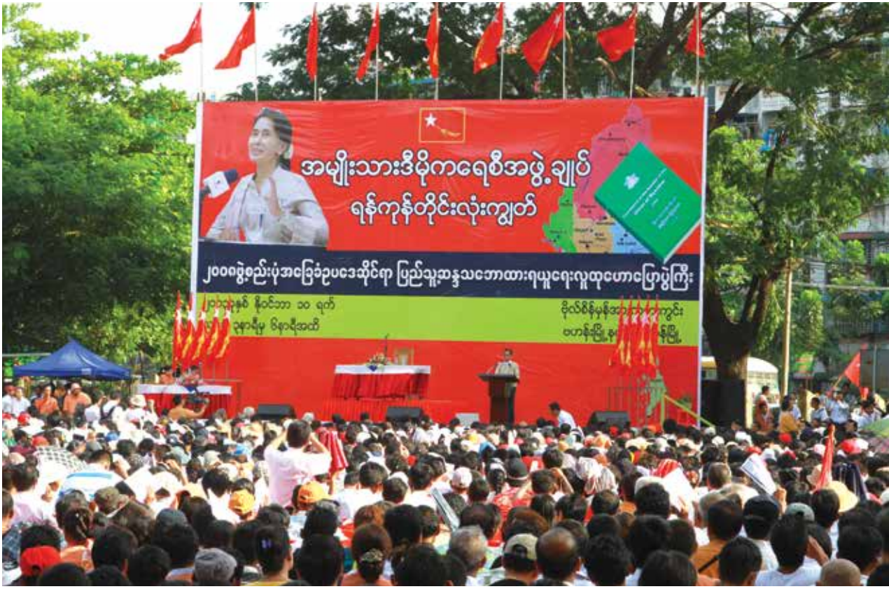
အခြေခံဥပဒေဆိုင်ရာ ပြည်သူ့ဆန္ဒသဘောထားရယူပွဲကို ဗဟန်းမြို့နယ်တွင် ကျင်းပစဉ်

အဆိုပါခြေလှမ်းသစ်နှင့်အ တူ ဒီမိုကရေစီပြုပြင်ပြောင်းလဲရေး တွင် လက်ရှိဖွဲ့စည်းပုံအခြေခံ ဥပ ဒေနှင့် ဆက်သွား၍ မရကြောင်း ကို အစိုးရအဖွဲ့အပါအဝင် အား လုံးက လက်ခံလာကြသော်လည်း အသစ်ပြန်လည်ရေးဆွဲမည် (သို့မ ဟုတ်) ပြင်ဆင်မည်ဆိုသော နည်း လမ်းများအပေါ်တွင် တိုင်းရင်း သားလက်နက်ကိုင် အဖွဲ့အစည်း များ အပါအဝင် ဒီမိုကရေစီ အင် အားစုများကြားထဲတွင်ပင် သ