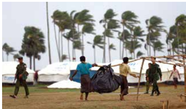
သဘာဝဘေးအန္တရာယ်နှင့်ပတ်သက်၍ အစိုးရအဆက်ဆက် ပထမဆုံးအကြိမ်အဖြစ် ပြင်ဆင်မှု အကောင်းဆုံးကို မဟာစင်၌ မြင်တွေ့ခဲ့ရသည်။