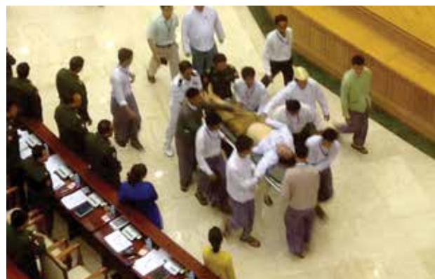
လွှတ်တော်အတွင်း ပထမဆုံးကွယ်လွန်သူအဖြစ် မှတ်တမ်းဝင်သွားသော ပြည်သူ့လွှတ်တော်ကိုယ်စားလှယ် ဦးအောင်ဆန်း။