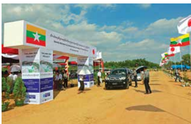
မြန်မာနိုင်ငံ၏ ပထမဆုံး အထူးစီးပွားရေးဇုန်ဖြစ်သော သီလဝါဇုန်၏ ပထမဆုံးဆင့်ကို ၂၀၁၃ နိုဝင်ဘာ၃၀ရက်က ဖွင့်လှစ်ခဲ့သည်။