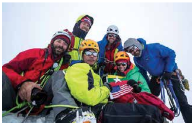
ဂမ်လန်ရာဇီတောင်ထိပ်သို့ မြန်မာ-အမေရိကန်ချစ်ကြည်ရေးတောင်တက်အဖွဲ့က ပထမဆုံးအကြိမ် စက်တင်ဘာ၇ရက်တွင် အောင်မြင်စွာတက်ရောက်နိုင်ခဲ့သည်။