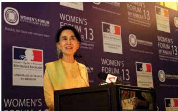
မြန်မာနိုင်ငံတွင် ပထမဆုံးအကြိမ်အဖြစ် ကမ္ဘာလုံးဆိုင်ရာ အမျိုးသမီးဖိုရမ်ကို ဒီဇင်ဘာ၆ရက်မှ ၇ရက်အထိ ရန်ကုန်မြို့၌ ကျင်းပခဲ့သည်။