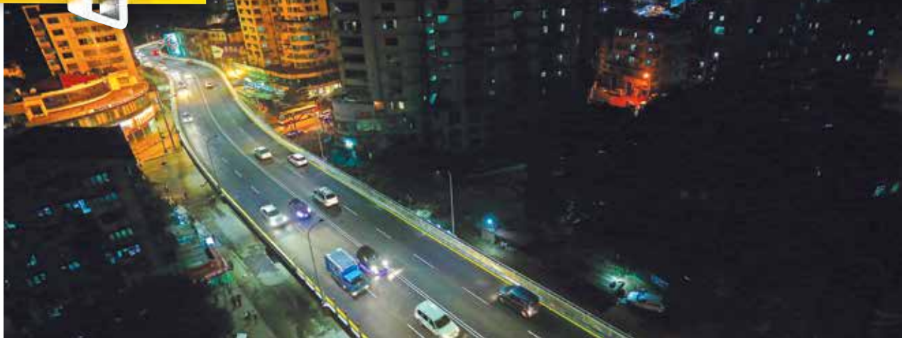
ပုဂ္ဂလိကကို လွှဲပြောင်း၍ ဆောက်လုပ်ခွင့်ပြုသော ပထမဆုံးဆုံးကျော်တံတားများအဖြစ် လှည်းတန်း၊ ဘုရင့်နောင်၊ ရွှေဝံတိုင်ဆုံးကျော်တံတားများကို ယခုနှစ်အတွင်း ဆက်တိုက်ဖွင့်လှစ်ခဲ့သည်။