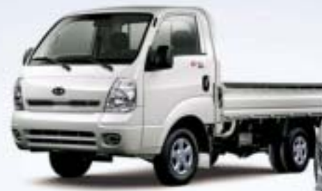
2.7 L(Diesel) 5 Speed Manual