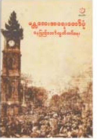
တန်ဖိုး - ၁၀၀ ကျပ်

သမိုင်း ပုတ်တမ်း စာတံပုံများ ဝေဝေ ဆာဆာ ပါဝင်သည်။