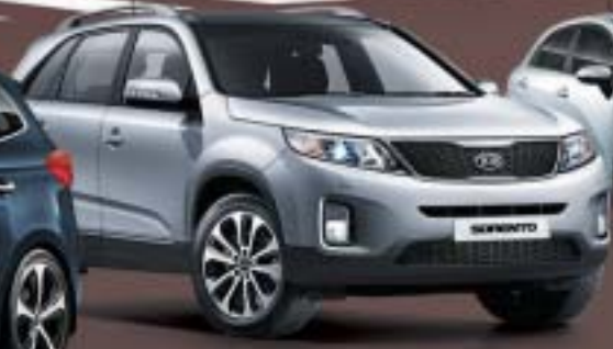
2.2 L(Diesel) 6 Speed Auto