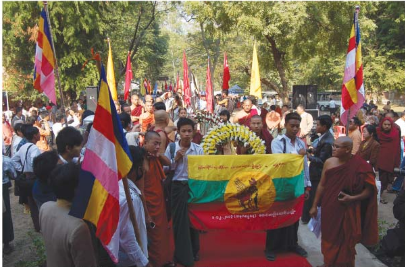
အာဇာနည်(၁၇)ဦးမိမိတို့ အဖွဲ့အစည်းအသီးသီးမှ ရဟန်းစုစု ပြည်သူများက လှမ်းသူ့ပန်းခွေများကိုဆောင် ချီတက်လာကြရုံပင်။