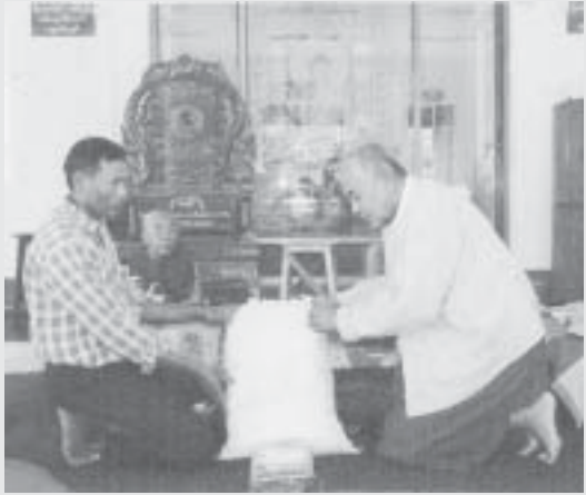
ဝက်မရွပ်ကျေးရွာဘုန်းတော်ကြီးသင်ပညာရေးကျောင်းသို့ အဝတ်အထည်များ လှူဒါန်းစဉ်

ပုဒ္ဓဘာသာ သာသနာပြန့်ပွားရေးအသင်း ရေနံချောင်းမြို့၊ အသင်းခွဲအမှတ်(၆၈)မှ လှုပ်ရှားဆောင်ရွက်မှုများ