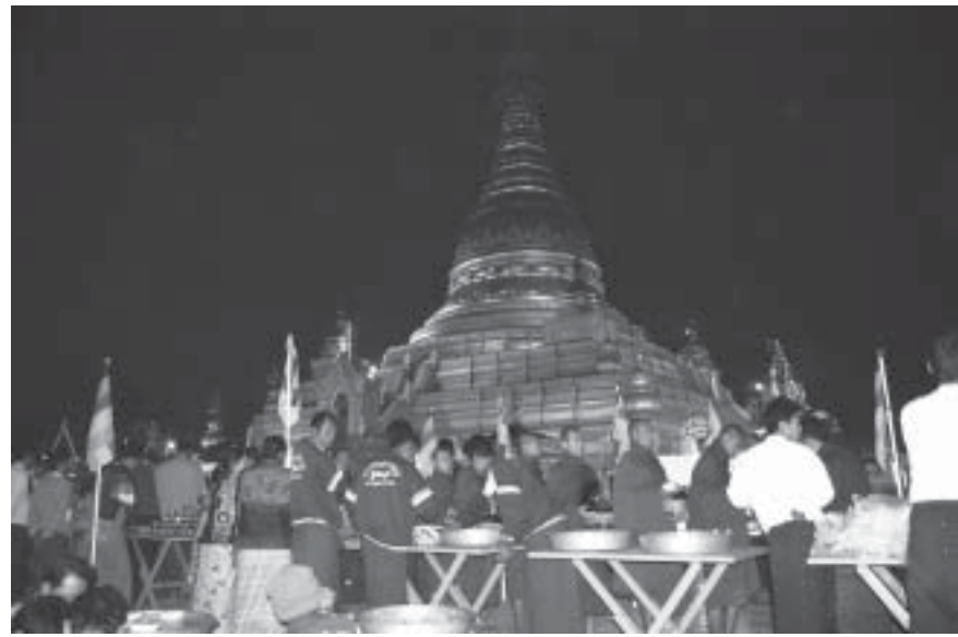
ဖေဖော်ဝါရီ ၂၁ရက် နံနက်ပိုင်းက အိမ်တော်ရာစေတီတော်ရင်ပြင်၌ ဆွမ်းလောင်းလှူဒါန်းပွဲ။