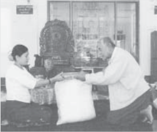
ဥမုင်ဘုန်းတော်ကြီးသင်ပညာရေးကျောင်းသို့ အဝတ်အထည်များ လှူဒါန်းစဉ်