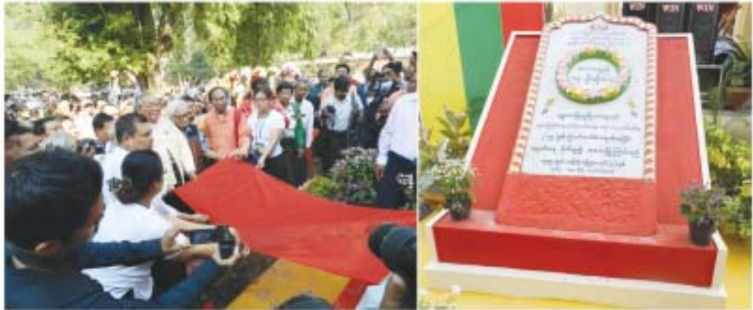
အာဇာနည် (၁၇)ဦး ဂုဏ်ပြုမော်ကွန်းကျောက်စာတိုင်ကို အမျိုးသားရေစိတ်ဓာတ်တက်ကြွစွာဖြင့် ဖွင့်လှစ်ပေးစဉ်