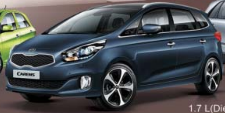
1.7 L(Diesel) 6 Speed Auto