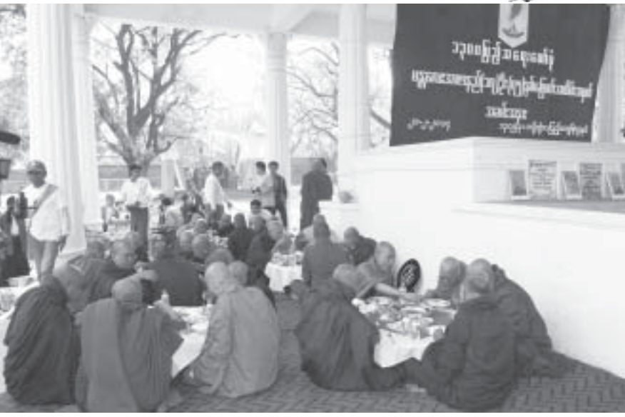
ဖေဖော်ဝါရီ ၂၁ရက် အာဇာနည်(၁၇)ဦးဗိမာန်တွင် သံဃာတော်များအား ဆွမ်းဆက်ကပ်လှူဒါန်းစဉ်။

ထို့နောက် ရှစ်လေးလုံးအရေးတော်ပုံတွင် အသက်သွေးချွေးပေးခဲ့ကြသူများအား ဂုဏ်ပြုသည့် အနေဖြင့် တစ်မိနစ်ငြိမ်သက် ပေးခဲ့ကြသည်။ ဆက် လက်၍ အစီအစဉ်အရ အာဇာနည်(၁၇)ဦး အမှတ် တရ ရုတ်ပြုမော်ကွန်းကျောက်စာတိုင်ဖွင့်ပွဲ