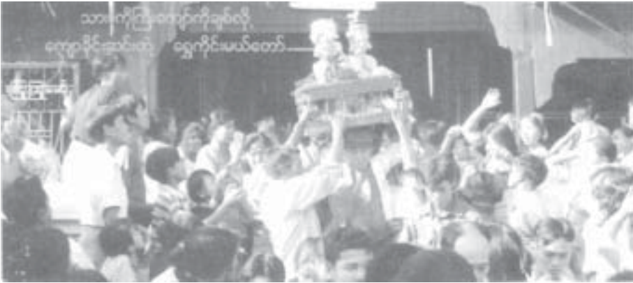
မိတ်ကပ်ပေးနေသည့် မိတ်ကပ်ပေးသူများ

ချင်းတွင်းမြစ်၏ အနောက်ဘက်ကမ်း ပခန်းငယ်တွင် ယာဉ်ညအိပ်ရပ်နားစခန်းရှိပြီး မျက်နှာချင်းဆိုင်အရှေ့ဘက်ကမ်းတွင် ထန်းတောရွာရှိသည်။ ထန်းတောရွာကိုဖြတ်ပြီးမှ ပခန်းပွဲကိုရောက်သည်။ ပွဲကျင်းပရာ ကူနီရွာရောက်လျှင် ထန်းပင်များ အပြိုင်အရိုင်းကြားက ပြာသာဒ်နှစ်ဆောင်ကိုမြင်ရပြီး ပွဲခင်းအဝမှာ လှည်းဝိုင်းကြီးက နှစ်စဉ် တမျှော်တခေါ်ပင်ဖြစ်သည်။