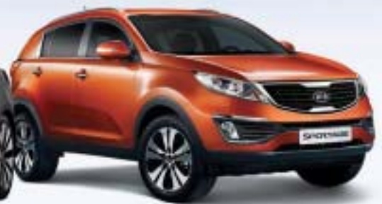
2.0 L(Diesel) 6 Speed Auto