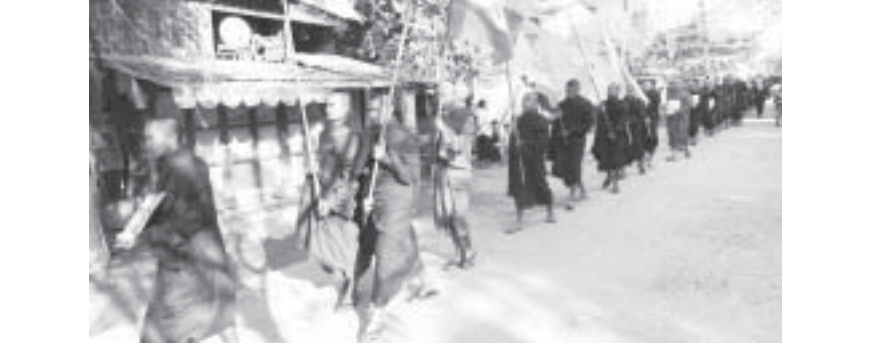
ဖေဖော်ဝါရီ ၂၁ရက် အာဇာနည်(၁၇)ဦးဗိမာန်သို့ ချီတက်လာသော သံဃာတော်များ