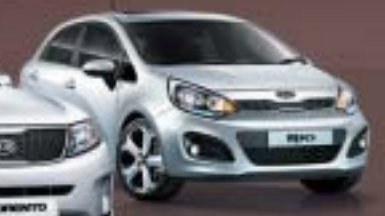
1.4 L(Petrol) 4 Speed Auto