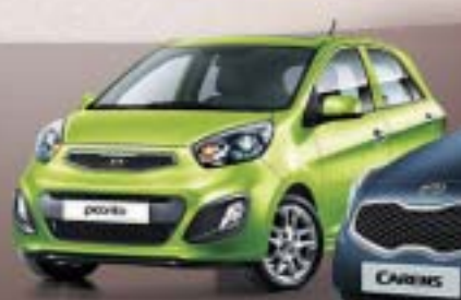
1.2 L(Petrol) 4 Speed Auto