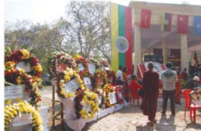
နယ်ပယ်အသီးသီးက လှမ်းသူ့ပန်းခွေများ အာဇာနည်မိမိတို့နှင့် ဖေဖော်ဝါရီ ၂၁ရက်ကတွေ့မြင်ရရုံပင်။