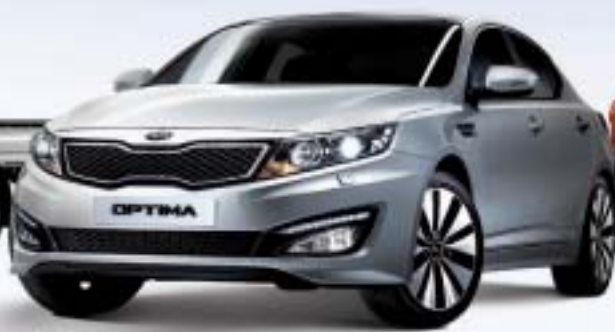
2.0 L(Petrol) 6 Speed Auto