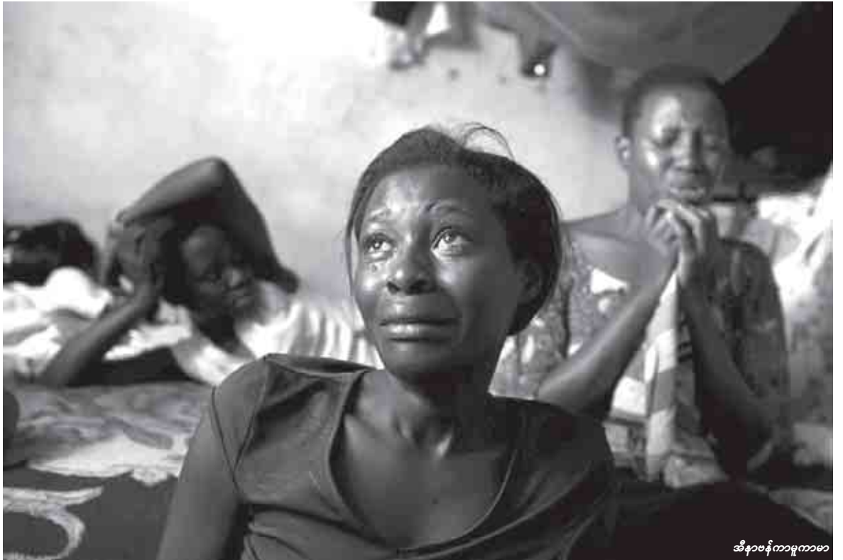
အိမ်နာမိတ်ကုသရုံ

သို့သော်ဆေးရုံတွင် ကာမုမာမာအတွက် ဖေးစရာဆေးမရှိပါ။ ကန်ပါလာမြို့ရှိ အခြားဆေးရုံများမှာလိုပင် လူနာသစ်များ အားလုံးမှာ ဆေးရရှိရန် စောင့်