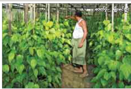
တင်ပို့- မျိုးစေ့ညှိ

မုံရွာကွမ်းဈေးကွက်သို့ ဝင်ရောက်လျက်ရှိသော ဘုတလင်၊ အရာတော်နှင့် ကနီနယ်များရှိ ကွမ်းခြံများမှာ နေပူချိန်မြင့်မားပြီး မေလအတွင်း မိုးရွာသွန်းမှုမရှိခဲ့ခြင်းကြောင့် ကွမ်းရွက်အထွက်နှုန်း