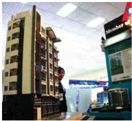
တပ်မတော်ပြင်ပဈေးကွက်၌ အိမ်ရာအရောင်းပြခန်းမှ ဖမ်းငယ်ပြကွက်တန်း စောတိုး - ဂျေမာင်းမာင်(ဆမရမရ)

တိုက်ခန်းများတွင် ကြုံတွေ့နေရသောရေပြဿနာသည် နှစ်စဉ်ထက် ပိုမိုခက်ခဲနေရပြီး ရေတစ်ထမ်းလျှင် အထပ်အလိုက် တန်ဖိုးထားမှုတို့က ပေးဝယ်နေရကြောင်း တိုက်ခန်းများ၏အရေပေါ်လေ့ကားတပ်ဆင်ထားမှု၊ အခန်းဖွဲ့စည်းမှုပုံစံများကြောင့်လည်း လူအများသည် အထပ်မြင့်များတွင်နေထိုင်ရန်အခက်တွေ့နေကြသည်။