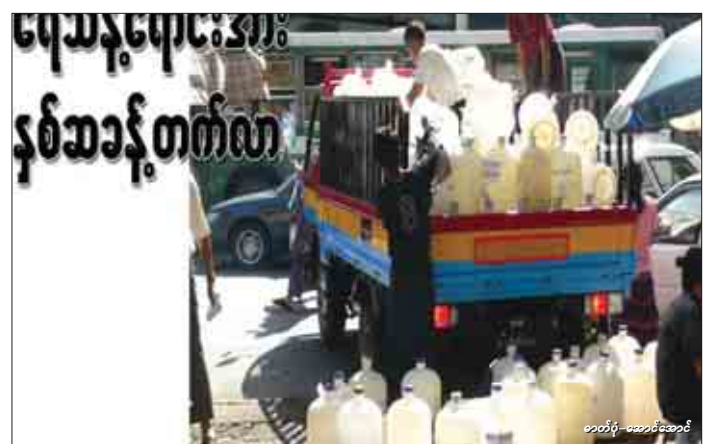
တက်ပု-အပူဖိုစေရန်(ဆရာဝန်)

မန္တလေး၊ မေ-၁၂ မန္တလေးမြို့တွင် ယခုရက်ပိုင်း အပူလွန်ကုသမှုပေးခြင်း အသက်အရွယ်ကြီးသူများ၊ အရက်အလွန်အကျွံသောက်သုံးသူများ၊ နေပူပူအတွင်း ဂရုမစိုက်ဘဲ နေထိုင်မှုများကြောင့် သေဆုံးမှုများ ဖြစ်ပေါ်လျက်ရှိသဖြင့် သက်ဆိုင်ရာရဲစခန်းနယ်မြေများက သေမှုသေခင်းအမှုဖွင့်ပြီး အရေးယူဆောင်ရွက်လျက်ရှိကြောင်း သိရသည်။ မန္တလေးမြို့အမှတ်(၅) ရဲစခန်းအပိုင်၊ အောင်မြင်သာစံမြို့နယ်၊ သီရိမာလာအနောက်ရပ်ကွက်၊ အကွက် ၂၂၀၊ မရမ်းခြံဆိပ်ကမ်းတွင် အမျိုးသမီးကြီးတစ်ဦးသည်မေ ၁၀ ရက်၊ ညနေ ၄ နာရီခန့်က သေဆုံးနေကြောင်း သတင်းရရှိသည်။ ရဲစခန်းမှူးနှင့် ရဲယာအဖွဲ့ဝင်များ၊ မရမ်းခြံဆိပ်ကမ်းမြို့ပတ်လမ်းရှိ လမ်းလယ်