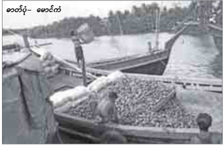
ဘက်လားဒေ့ရှ်- မောင်တော်

မောင်တော်၊ မေ- ၁၂ နှစ်စဉ်ဘက်လားဒေ့ရှ်နိုင်ငံမှ အ ဝယ်ရှိနေသော ရင်ကွဲသရက်သီး များကို မောင်တော်နယ်စပ် ကုန် သွယ်ရေးမှ စုပြုလ နောက်ဆုံး ပတ်မှ စတင်တင်ပို့နေပြီဖြစ်ပြီး ယခုနှစ်သရက်သီးရာသီအတွင်း တန်ချိန် ၁၀၀၀ ခန့်တင်ပို့ရန် မျှော်မှန်းထားကြောင်း သရက်သီး တင်ပို့သည့် ရိုးမအားမာန်ထရော ဖင်းကုမ္ပဏီမှ တာဝန်ရှိသူတစ်ဦး က 7Day News သို့ပြောသည်။ ယခုနှစ်တွင် ရခိုင်ပြည်နယ် အတွင်းရှိသရက်ခြံများ၌ သရက် သီးများ အထွက်ကောင်းနေပြီး ရာသီဥတု ဆက်လက်ကောင်းမွန်