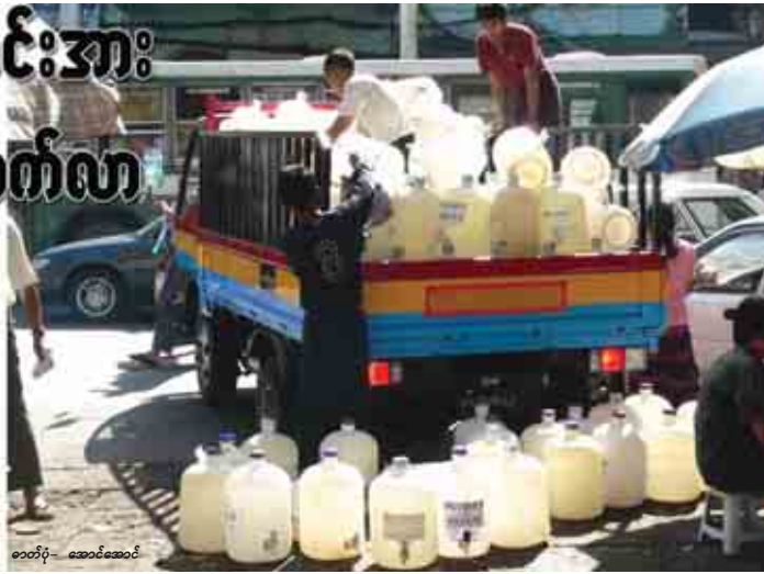
စောတိုး - ဆောင်ဆောင်

ရန်ကင်း၊ မေ - ၁၄ အပူချိန်နိမ့်စဉ်မြင့်တက်နေမှုကြောင့် ရေသန့်များရောင်းလိုအားကောင်းနေသော်လည်းကောင်း စားလှယ်များထံမှ လိုအပ်သလောက်မှာယူ၍မရဖြစ်နေကြောင်း ရေသန့်ဈေးကွက်မှ စုံစမ်းသိရသည်။