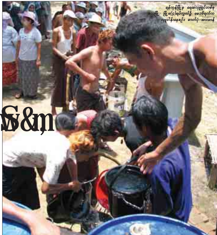
ရန်ကုန်မြို့မှ ရေအလျှင်တစ်စုအဖွဲ့ဖြင့် မြို့ပေါ်ရပ်ကွက်ရှိ မေခပ်ရက်ကလျာဒါနီနေ့စဉ်၊ စာတံပုံ-အားမာန်

၂၀၀၆ခုနှစ်မှစ၍ လူမှုနေ့လုပ်ငန်းများ တစ်စိုက်မတ်