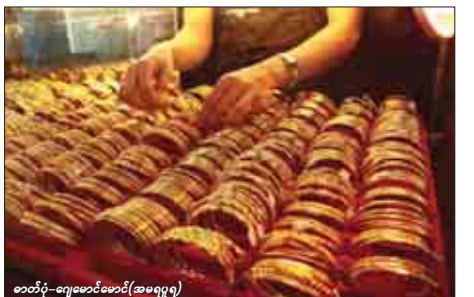
ဝတ်ပုံ-ကျေးဇူးတင်ပေးခြင်း(အမေရိကန်)

“ဈေးက အတက်ကြမ်းတော့ ရောင်းအားအနေနဲ့က ဝယ်တဲ့သူမရှိသလောက်ဘဲ။ ပြန်သွင်းတဲ့သူတွေများတယ်” ဟု ၂၉ လမ်းရှိ အောင်သမားရွှေဆိုင်တာဝန်ရှိသူတစ်ဦးက ပြောသည်။ ဈေးနှုန်းများမှာ ကမ္ဘာ့ရွှေဈေးမြင့်တက်ခြင်းကြောင့် ဖြစ်သော်လည်း အမေရိကန်ငွေဈေးအေးနေ၍ ပြည်တွင်းဈေးကွက်တွင် ဈေးအတက်နည်းနေသောကြောင့် ဒေါ်လာစွန်းတက်လာပါက လက်ရှိဈေးထက် မြင့်လာနိုင်ကြောင်း အထက်ပါ ပုဂ္ဂိုလ်က ပြောသည်။ “ရန်ကုန်ဝယ်လက်က တစ်ကျပ်သားကို ၆၂၀,၀၀၀ ကျော်လောက်ကတည်း က အဝယ်တော်တော်လျော့နေ ပြီ။ နယ်ဝယ်လက်ကဲ့ပဲ အားကိုးနေရတာ။ ဒါပေမဲ့ အခုဈေးကျတော့နယ်အဝယ်ကလည်း မရှိသလောက်နည်းသွားတယ်” ဟု လာသဖြ့်နယ်ရှိရွှေဆိုင်ပိုင်ရှင်တစ်ဦးက ပြောသည်။ “ဈေးကတော့ ကမ္ဘာ့ရွှေဈေး