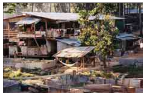
မလေးရှားရှိ ပြည်ပလုပ်သားများ၏ ကန်ထဲစခန်းအားဖြင့် ဆွေ့စုစဉ်။

မလေးရှားရှိ ကန်ထဲတွင် ရောက်ရှိနေပြီး အခက်အခဲနှင့်ရင်ဆိုင်နေရသော မြန်မာအလုပ်သမားများကို နှစ်နိုင်ငံအစိုးရအစီအစဉ်ဖြင့် ၂၀၀၉ စက်တင်ဘာလမှ ဖေဖော်ဝါရီလအထိ နေရပ်ပြန်နိုင်ရန် စီစဉ်ပေးခဲ့သည်။ ထိုသို့ကန်ထဲမှ အလုပ်သမား နေရပ်ပြန်နိုင်ရန် ဆောင်ရွက်ပေးခြင်းကို အောင်သန်းထိုက်ပြည်ပအလုပ်အကိုင် ရှာဖွေရေးအေဂျင်စီက ဝန်ဆောင်မှုပေးခဲ့သည်။ နှစ်နိုင်ငံအစိုးရအစီအစဉ်ဖြင့် ဆောင်ရွက်နေသော ကာလက အလုပ်သမားတစ်ဦးလျှင် လေယာဉ်လက်မှတ်နှင့် ဝန်ဆောင်ခ စုစုပေါင်း ရင်းဂစ် ၅၅၀ ဖြင့် ဝန်ဆောင်ပေးခဲ့