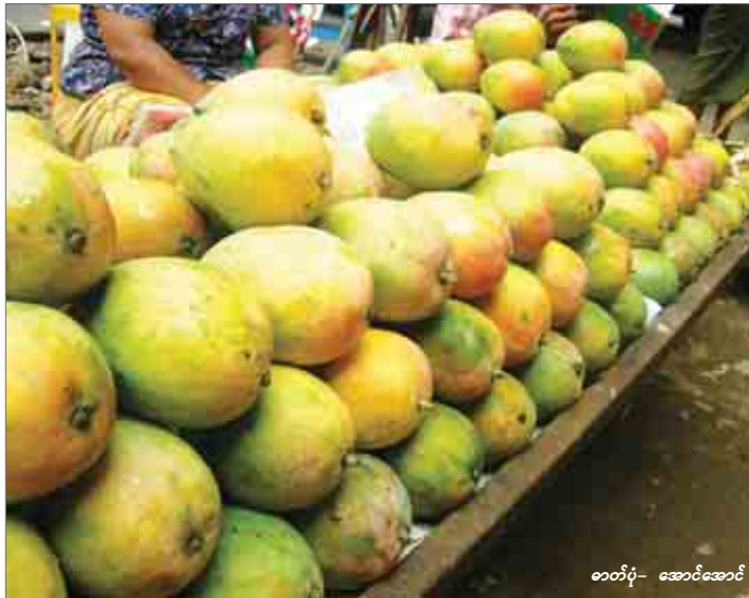
တင်ပို့- ဆောင်ရွက်

“သရက်သီး အိတ်စွပ်ကာ ကိုမနှစ်ကစပြီး FAO နဲ့ ကျွန်တော်တို့ မြန်မာ့စိုက်ပျိုးရေး လုပ်ငန်းတို့ ပူးပေါင်းဆောင်ရွက်ခဲ့ပါတယ်။ ဒီနှစ်တော့ ဆောင်ရွက်ပေးမယ့်အတွက် သဘောပေါက်လာပြီး အိတ်စွပ်သန့်လေးက အထိ ဝယ်ယူသုံးစွဲခဲ့တယ်လို့ သိရတယ်။ တရုတ်ဈေး