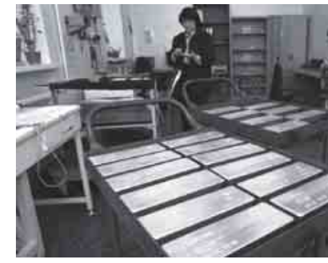
ဒေါ်လာ ၁၂၅၄ ဒသမ ၅ နှုန်းဖြစ်သည်။ နယူးယောက်ဈေးကွက်တွင် ၁၂၅၆ ဒသမ ၄ အထိဈေးပေါက်ခဲ့သည်။ ရွှေဈေးသည် ယခုနှစ်အ

လည်း ကမ္ဘာ့ငွေကြေးများ လုံခြုံစိတ်ချရမှုအပေါ် စိုးရိမ်မှုများ ရှိလာခဲ့ပြီး ရွှေ ဝယ်ယူစုဆောင်းမှုများပြားလာ၍ ရွှေဈေးများ မြင့်တက်လာခြင်းဖြစ်သည်။ ရွှေအတိုးဈေးနှုန်းသည် ယူဂိုစတလင်ပေါင်နှင့် ဆွစ်ဇာလန်ဖရန်ငွေများဖြင့် ဝယ်ယူရာ၌ သမိုင်းတွင် အမြင့်ဆုံးဈေးသို့ ရောက်ရှိခဲ့သည်။ ရွှေဈေးမှာ လက်ငင်းဝယ်ယူပါက လန်ဒန်တွင်တစ်အောင်စလျှင် ကန်ဒေါ်လာ ၁၂၅၅ ဒသမ ၆၈ နှုန်းဖြစ်ပြီး တစ်လဆိုင်ဝယ်ယူပါက ကန်