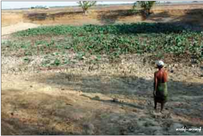
ဝေတံပုံ-အာမာန်

ရန်ကုန်တိုင်းအတွင်း ယခင် ကခရိုင်အလိုက် ရေတွင်းရေကန် ပေါင်း ၃၀၉ ကန်အထိရှိခဲ့သည်။ ရာသီဥတုအပူချိန် မြင့်မားမှု ကြောင့် ရေတွင်းရေကန်ပေါင်း ၁၇၄ ကန်အထိ ရေခန်းခြောက်မှု များရှိခဲ့ရာ မြို့တော်စည်ပင်နှင့် သက်ဆိုင်ရာဌာနများပူးပေါင်းမှု မြင့် ရေကန် ၅၇ ကန် တူးဖော်ခြင်း၊ ရေကန်တောင်းများ ပြန်လည်ဖြည့်ဆည်းမှု ၆၅ ကန်နှင့် အစီစီစဉ်အသစ် ၁၁၀ တို့ကို ပေါင်းပြန်လည်တူးဖော်လုပ်ကိုင် လျက်ရှိကြောင်း သိရသည်။