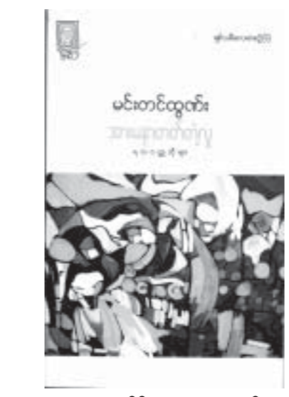
တန်ဖိုး - ၂၀၀၀ ကျပ်

ကောင်းဇော်စာပေမှ စာရေးဆရာမင်းတင်ထွန်း၏ အားမနာတတ်တဲ့လူ ရသဝတ္ထုတိုများစာအုပ်ကို ပထမအကြိမ်ထုတ်ဝေသည်။ ကြိမ်လုံး၊ ရောဂါ၊ အားမနာတတ်တဲ့ကောင်း၊ အနိပ်တော်၊ မျှော်လင့်ခြင်း ဝိုးတပါး၊ ကျွန်တော့်တပည့်က ကျွန်တော့်ဆရာ၊ မန်ကျည်းကိုးပင်၊ ကချေသည်၊ မိန့်ကောင်း၊ အလယ်ကလူစကားဝဲ၏၊ မှောင်မှောင်သည်ဝတ္ထုတို ၁၁ ပုဒ်ပါ ဝင်သည်။