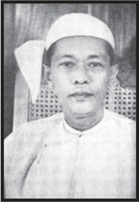
ပညာရေးဝန်ကြီး ဦးသန်းအောင်