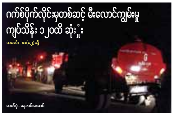
ဂက်စ်ပိုက်လိုင်းမှတစ်ဆင့် မီးလောင်ကျွမ်းမှု ကျပ်သိန်း ၁၂၀၀ သုံးစွဲ သတင်း - စာ(၁၂) သို့