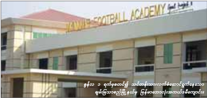
ဧက ၅၅ ရှိသော ဘောလုံးကွင်းတည်ဆောက်ရန်အတွက် ချမ်းမြသာစည်မြို့နယ်မှ ငွေရွှေဝါလမ်းကြားအတွင်း တည်ဆောက်မည်ဖြစ်ကြောင်း မန္တလေးတိုင်းဒေသကြီးဘောလုံးအဖွဲ့ချုပ်အတွင်းရေးမှူးကပြောကြားသည်။

နိုင်ငံတကာအဆင့်မီ ဘောလုံးကွင်းသည် မြန်မာနိုင်ငံ အိုလံပစ်ကောင်စီ၏ လမ်းညွှန်ချက်အရ နိုင်ငံတော်၏ အားကစားအဆင့်အတန်းမြှင့်တင်ရာတွင် အထက်မြန်မာပြည် အမျိုးသားအားကစားဥယျာဉ်စီမံကိန်း(မန္တလေး) တည်ဆောက်ရေးစီမံကိန်းတွင်ပါဝင်ခဲ့သည့်မန္တလေးမြို့၊ ချမ်းမြသာစည်မြို့နယ် သို့မဟုတ် လမ်းမတော်ဘက် ၆၈ လမ်းနှင့် ၇၃ လမ်းကြား၊ သင်္ဃာတန်းနှင့် ငွေရွှေဝါလမ်းကြား ခြေစက ၁၈၄ ဒသမ ဥဒေသတွင် တည်ဆောက်ရန်လျာထားပြီး နိုင်ငံတကာအဆင့်မီ ဘောလုံးကွင်းမှာ ၅၅ ဧကခန့် တည်ဆောက်ရန်လျာထားကြောင်း မန္တလေးတိုင်းဒေသကြီးဘောလုံးအဖွဲ့ချုပ်အတွင်းရေးမှူးကပြောကြားသည်။