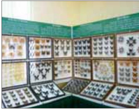
ပြင်ဦးလွင်မြို့ အမျိုးသားကန်တော်ကြီးဥယျာဉ်အတွင်း ဖွင့်လှစ်ထားသည့် လိပ်ပြာပြတိုက်အတွင်းရှိရှားပါးလိပ်ပြာများကိုတွေ့ရစဉ်။

ပြတိုက်အတွင်းဓာတ်ပုံရိုက်ကူးခြင်းကိုကန့်သတ်ထားပြီး ရိုက်ကူးရန် လိုအပ်ပါက လိပ်ပြာများမှာမီးရောင်ကြောင့် အရောင်ပြောင်းနိုင်သဖြင့် ဖလက်ရှမ်းကိုပိတ်၍ရိုက်ရန် မေတ္တာရပ်ခံထားကြောင်း သိရသည်။