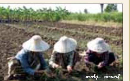
၀၁၀၀၀- အားမာနီ

မယ့် မြေနီရွာကလယ်ကွက်တွေက သဲမြေဆိုတော့ရေဝပ်ဘူး။ ချက်ချင်းရေဆင်းသွားတာဆိုတော့ အပျက်အစီးမရှိပါဘူး။ မိုးကြက်သွန်တွေအချို့ နေရာတွေပျက်တယ်ဆိုပေမယ့် မုံရွာမှာဆောင်းကြက်သွန် အဓိကစိုက်ကြပြီးကြတာဆိုတော့ ကြက်သွန်ဈေးတော့မထိခိုက်ပါဘူး။ လောလောဆယ် မိုးရွာတာကြောင့် ဆောင်းကြက်သွန်လောင်လက်တွေ ပျက်စီးတာရှိလို့ ဈေးနည်းနည်းတက်သွားတယ်”ဟု မုံရွာမြို့နယ်အတွင်း ကြက်သွန်အများဆုံးစိုက်ပျိုးရာမြေနီကျေးရွာမှ ကြက်သွန်စိုက် တောင်သူတစ်ဦးကပြောသည်။ “ကြက်သွန်ခင်းတွေက ရေဝပ်တဲ့နေရာတွေကတော့ ရေဝပ်မဟုတ်တော့ပေမယ့် အပင်တွေအမြိတ်ပုံတာပုပ်နဲ့ ပျက်ကုန်ပြီး ကျန်းကျတဲ့နေရာတွေကတော့ ရေဆင်းကောင်းတဲ့စိုက်ခင်းတွေကအပျက်အစီးနည်းတယ်။ နောက်ထပ် မိုးကြက်သွန်ပျက်စီးလည်းမလွယ်ဘူးဆိုတော့ ဆောင်းကြက်သွန်အတွက် ပျိုးထောင်တဲ့သူတွေထောင်နေပြီး ကြက်သွန်ဈေးက စောစောပိုင်းက တစ်ဝါသာနှစ်ရာဝန်းကျင်ကနေ ငါးရာဝန်းကျင်အထိ ဈေးတက်