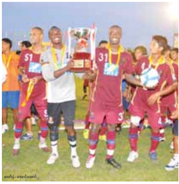
တတိယ-ဆောင်ဆောင်

MFF Cup ရှုံးထွက်ပြိုင်ပွဲတွင် ချန်ပီယံဖြစ်ခဲ့သည့် ဥဿာယူနိုက်တက်အသင်းသည် ဆုကြေးငွေကျပ်သိန်း ၃၀၀ ရရှိခဲ့ပြီး၊ ဒုတိယရရှိခဲ့သည့် ဆောက်သမားမြန်မာအသင်းက ကျပ်သိန်း ၁၀၀ ရရှိခဲ့ကြောင်း သိရှိရသည်။