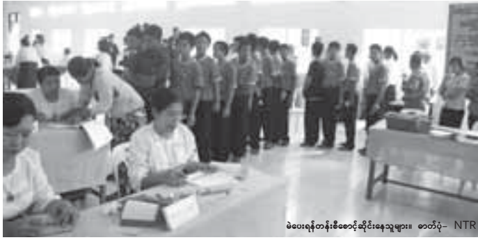
မဲပေးရန်တန်းစီစောင့်ဆိုင်းနေသူများ။ စတိပုံ - NTR

ကျောက်တံတားမြို့နယ် အချိန်က နံနက် ၅ နာရီ ၅၅ မိနစ်၊ နေရာက ရန်ကုန်မြို့၊ ဆူးလေဘုရားလမ်းမပေါ်ရှိ မီးသတ်ဦးစီးဌာနမြေညီထပ်တွင် ဖြစ်သည်။ မီးသတ်ဝန်ထမ်းများဖြင့် ဝန်ထမ်းများ၊ တိုက်ပုံအဖြူ ပုဆိုးအစိမ်းများကို ဝတ်ဆင်ထားသော ပြည်ထောင်စုကြံ့ခိုင်ရေးနှင့် ဖွံ့ဖြိုးရေးပါတီမှလူများစုဝေးနေသည့် အဆိုပါနေရာမှာ ကျောက်တံတားမြို့နယ် မဲဆန္ဒနယ်အမှတ် (၅) တွင်ပါဝင်သည့် (၁)ရပ်ကွက်မှ မဲရုံအမှတ်(၁)ဖြစ်သည်။