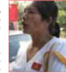
အောင်သိန်းလင်းမှ ပထမ၊ သူမက ဒုတိယနှင့် ရှုံးနိမ့်ခဲ့သည်ဟု ကာယကံရှင်ကပြောသည်။

ရော့ ပါတီထဲမှာရှိပါတယ်။ အဲဒီတော့ ပါတီက နောက်၅ နှစ်လောက် ဆက်လက်ရပ်တည်ခွင့် ရမှာပေါ့။ အဲဒီအတွင်းမှာ ပြည်သူ့ကို အကျိုးပြုမယ့် အရာအားလုံး ဆက်လုပ်သွားမှာပေါ့။ မှတ်ချက်- ဒေါ်ကနိုးခန့်ဒိမ်းက ဒီမိုကရေစီပါတီ တောင်ငူကွယ်လွန်သူ ပြည်သူ့လွှတ်တော်အတွက် ဝင်ရောက်ယှဉ်ပြိုင်ခြင်းဖြစ်ကာ နိုင်ငံဘာ ၇ ရက်ခန့်ရောက်ပြီးချိန်တွင် ပြည်ခိုင်ဖြိုးပါတီမှ ဦး