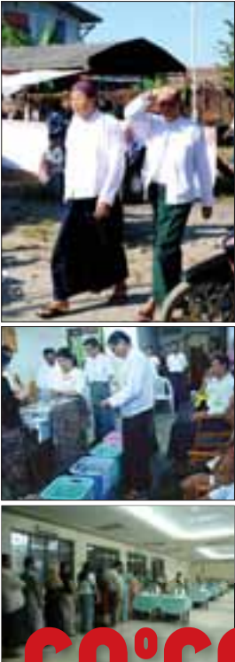
တောင်ဥက္ကလာမမြို့နယ် မိရ်တစ်ခုမှ မိပေးအပြီးထွက်လာသည့် ရခိုင်လူမျိုး မိခင်နှစ်ဦးအား နှစ်ဦးအား တွေ့ရစဉ်၊ တာဝန်ပုံ - ချောမောင်မောင် (အမရပူရ)