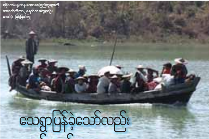
ရခိုင်ကမ်းရိုးတန်းဒေသနေ ပြည်သူများကို အောက်တိုဘာ ၂၉ရက်က တွေ့ရဦး တက်ပုံ ဖြစ်ကြောင်း