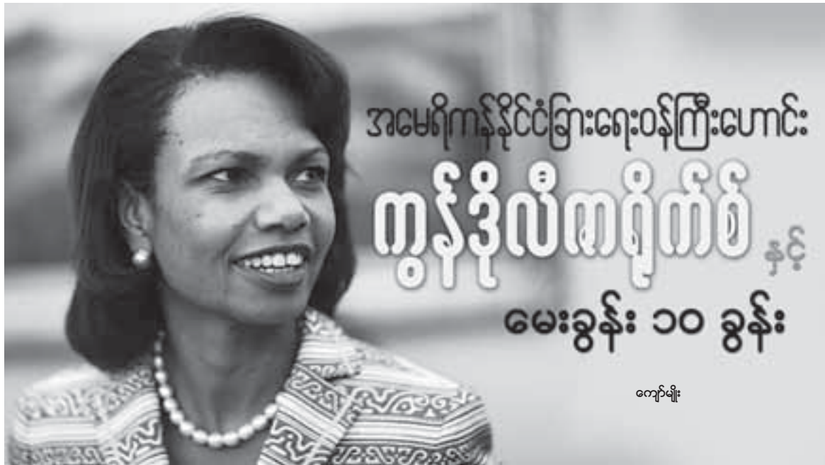
ကျော်မျိုး

ယခင်အမေရိကန်နိုင်ငံခြားရေးဝန်ကြီးဟောင်း တွန့်ခိုလီစာရိုက်စံဟာ သမ္မတဘုရားလက်ထက်မှာ ကျော်ကြားတဲ့ အမေရိကန်အမျိုးသမီးနိုင်ငံရေးသမားများထဲမှာ တစ်ဦးအပါအဝင်ဖြစ်ခဲ့ပါတယ်။ မစ္စရိုက်စ်ဟာ မျိုးရိုးအရလည်း လူမည်းသွေးနေတဲ့ အာဖရိကန်-အမေရိကန်နွယ်ဖွားတစ်ဦးဖြစ်ပြီး စစ်အေးခေတ်အတွင်း ကြီးပြင်းလာခဲ့သလို ဆိုဗီယက်ယူနီယံ အကြောင်းလေ့လာကာ ဆိုဗီယက်ရေးရာ ကျွမ်းကျင်သူတစ်ဦးအဖြစ်လည်း လုပ်ကိုင်လာခဲ့သူဖြစ်ပါတယ်။ ဒါ့အပြင် မစ္စရိုက်စ်ဟာ ရာထူးက အနားယူခဲ့ပေမယ့်လည်း အဆင့်မြင့် ထိပ်တန်းသံအမတ်တစ်ဦးဖြစ်ခဲ့တဲ့ သူမရဲ့ ကမ္ဘာ့ရေးရာအမြင်တွေကလည်း အလေးထားဖွယ်ဖြစ်နေပါပြီ။ ယခုဖော်ပြလိုက်တာကတော့ တိုင်းမမဂ္ဂဇင်းကြီးမှာ ပါဝင်နေကျဖြစ်တဲ့ မေးခွန်း ၁၀ ခုကဏ္ဍမှာ စာဖတ်ပရိသတ်များမေးပြီး မစ္စရိုက်စ်ကဖြေထားတဲ့ အဖြေများပါ။