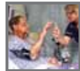
စာ-သူသေဆုံးမှုတစ်ဆင့် တိုးလာသည့် လေဖြတ်ရောဂါ မှု

ကမ္ဘာ့ကလေးမဂ္ဂဇင်းအဖွဲ့ကြီးက ၁၉၉၁ခုနှစ်မှစ၍ နှစ်စဉ် အောက်တိုဘာ ၁ရက်နေ့အား ကမ္ဘာ့သက်ကြီးရွယ်အိုများနေ့အဖြစ် သတ်မှတ်ပြီး ယနေ့အချိန်တွင် ပွဲပြီးဆဲနိုင်ငံများ၌ ဖွံ့ဖြိုးပြုနိုင်ငံများထက် အသက်၆၀ကျော် လူကြီးသူမများအရေအတွက် သိသိသာသာတိုးတက်လာ ကြောင်းသိရသည်။