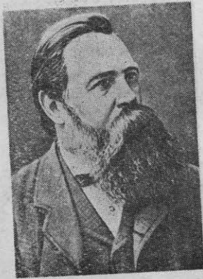
ဖရက်ဒရစ်-အိန်ဂယ်