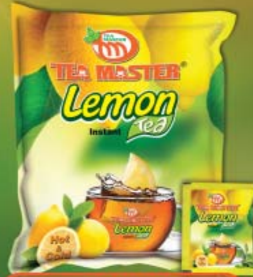
လိမ္မော်တီး

Superior quality better taste performance.