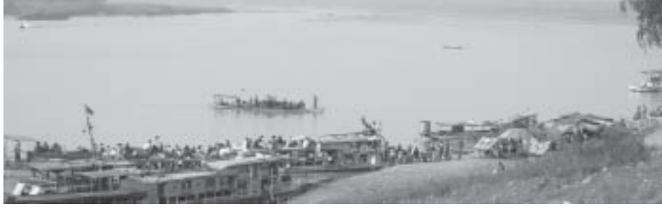
at mi&Z, sm

အထက်ချင်းတွင်းဒေသ ဟုမ္မလင်းမြို့မှ ခန္တီးမြို့သို့ မော်တော်ကားလမ်းနှင့် ချင်းတွင်းမြစ် ရေကြောင်းလမ်းဖြင့်သွားလာနိုင်ရာ ဟုမ္မလင်း-ခန္တီး ကားလမ်းမှာ တစ်နှစ်ပတ်လုံးသွားလာနိုင်ခြင်း မရှိသည့်အပြင် ပွင့်လင်းရာသီမှာပင်ကားများသွားလာရန် လမ်းကြောင်းချောမွေ့ခြင်းမရှိသဖြင့် ဟုမ္မလင်း-ခန္တီးအသွားအပြန် ခရီးသည်အများစုမှာ ချင်းတွင်းမြစ်ကြောင်းအတိုင်း အမြန်ရေယာဉ်များဖြင့်သာ သွားလာမှုများကြောင်း ဟုမ္မလင်းမြို့၊ စပေါင်းအမြန်ရေယာဉ်အသင်းမှ တာဝန်ရှိသူတစ်ဦးကပြောသည်။ ဟုမ္မလင်းနှင့် ခန္တီးမြို့မှာ ကားလမ်းခရီး၌ သက္ကယ်ကျင်းဖောင်းပြင်၊ ဟုမ္မလင်း၊ ခန္တီး မဟာဗျူဟာလမ်းမကြီးအတိုင်း သွားလာနိုင်သည်။ ကားလမ်းမိုင် ၁၃၆မိုင် ၄၈မိုင်ရှိရာ ကားလမ်းမှာ အဖာခံလမ်းနှင့် မြေသားလမ်းသာဖြစ်သဖြင့် မိုးရာသီတွင် သွားလာရန်ခက်ခဲသည့်အပြင် လမ်းပေါ်ရှိ ချောင်း၊ မြောင်းများမှာလည်း သစ်သားတံတားနှင့်ယာယီ တံတားများသာရှိနေဆဲဖြစ်၍ လိုင်းကားများ ရှိသော်လည်း သွားလာရေးအဆင်ပြေချောမွေ့သည့် ရေလမ်းခရီးကိုသာ အားကိုးသွားလာသူများသည်။