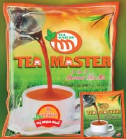
လက်ဖက်ရည်