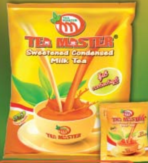
နို့ဆီလက်ဖက်ရည်