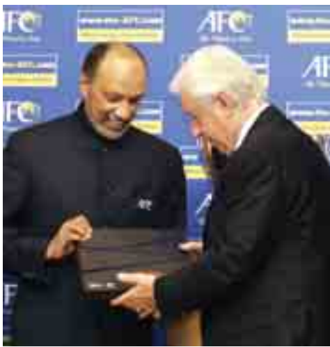
ပွဲကို ကျွန်တော်ဝင်ပြိုင်မှာ မဟုတ်ပါဘူး။ နောက်ထပ်ရာထူးသက်တမ်း အသစ်အတွက် ဆပ်ဘလတ္တာ အရွေးခံနိုင်အောင် ထောက်ခံသွား

သို့သော် ဘင်ဟမ်းမန်းက အေအက်ဖ်စီသတင်းသို့ "ကျွန်တော် ရှင်းရှင်းလင်းလင်းပြောပါရစေ။ လာမယ့်နှစ် ဖီဖာဥက္ကဋ္ဌရွေးကောက်