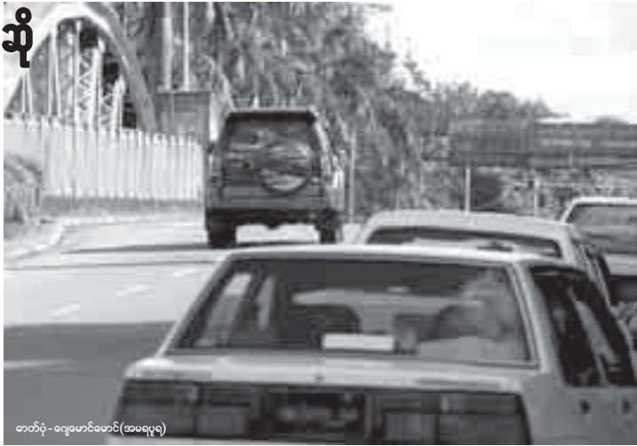
တာဝန်ရှိသူတစ်ဦးက ပြောကြားသည်။

သိမ့်သိမ့်စိုး ရန်ကုန်၊ ဩဂုတ် - ၂၅ လိုင်စင်မဲကားများကို တရားဝင် လိုင်စင်ပြုလုပ်ရာတွင် ပေးဆောင် ရသော အခွန် ၈၅ ရာခိုင်နှုန်းကို လျှော့ချမည်ဟု သတင်းများထွက် ပေါ်နေသော်လည်း ၎င်းနှုန်းထား ကိုလျှော့ချရန်မရှိကြောင်း ရန် ကုန်တိုင်း အခွန်ဦးစီးဌာနမှ တာ ဝန်ရှိသူတစ်ဦးက ပြောကြား သည်။