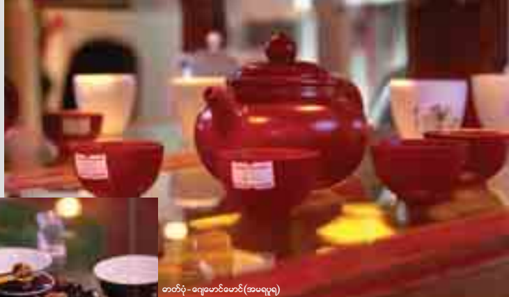
တတိယ-ဈေးမောင်းမောင်း (အမပူရ)

အရေပါလှပါတယ်။ ဒီတစ်ပတ်မှာတော့ တန့်ယန်းလက်ဖက်ခြောက် ကောင်းကောင်းနဲ့ ရေခဲကုန်း၊ ရေခဲကုန်းခွက်လှလှလေးတွေပါတစ်ပါတည်း ဝယ်ယူနိုင်မယ့်နေရာကိုဈေးဝယ်ထွက်ဖို့ လမ်းညွှန်ပေးချင်ပါတယ်။