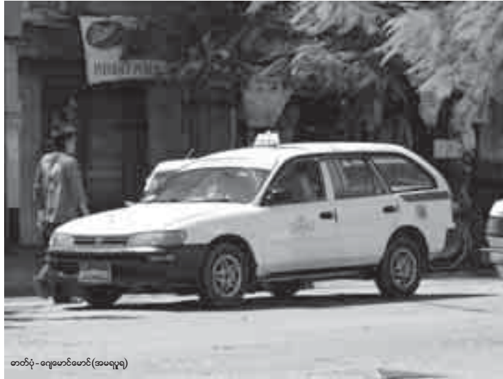
တတိံ - ရေပေါင်မောင်(အမရပူရ)

ကို ငှားရမ်းစီးနင်းနေကြတဲ့ ခရီးသည်တွေ အလွယ်တကူငှားရမ်းစီးနင်းနိုင်ဖို့အတွက်ကို ရည်ရွယ်ပြီး မြို့တွင်းမှာ ဂိတ်ငါးခု သတ်မှတ်ပြေးဆွဲသွားဖို့ စီစဉ်တာပါ” ဟု တာဝန်ရှိသူတစ်ဦးက ပြောသည်။ စက်တင်ဘာလလယ်ခန့်တွင် သတ်မှတ်ထားသည့် ဂိတ်ငါးခုမှ စတင်ပြေးဆွဲသွားမည်ဖြစ်ပြီး တာဝန်ရှိသူရရှိ ယဉ်ကျေးမှုပြတိုက်ဂိတ်တွင် အစီးရေ ၂၀၀၊ ရွှေမန်းသူကားဝင်းတွင် အစီးရေ ၁၀၀၊ အောင်မင်္ဂလာကားဝင်းတွင် အစီးရေ ၅၀ နှင့် ဂမ်းနား