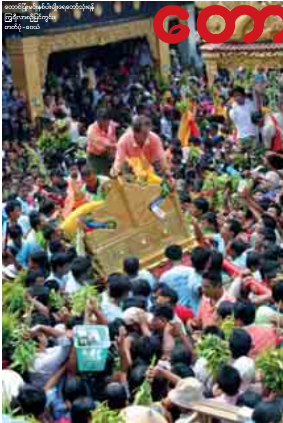
ထောင်ပြုံးမင်းနတ်မိရိုးရေတော်သုံးရန် ကြိုဆိုလာစဉ်ပြင်းကွင်း၊ တတိယ-ဝေယံ

အားလုံး၏မျက်နှာပေါ်တွင် မျှော်လင့်ခြင်းများ ယုံကြည်ခြင်းများသည် သူတို့ထံမှစွေးစက်များနှင့်အတူ တလက်လက် တောက်ပနေကြသည်။