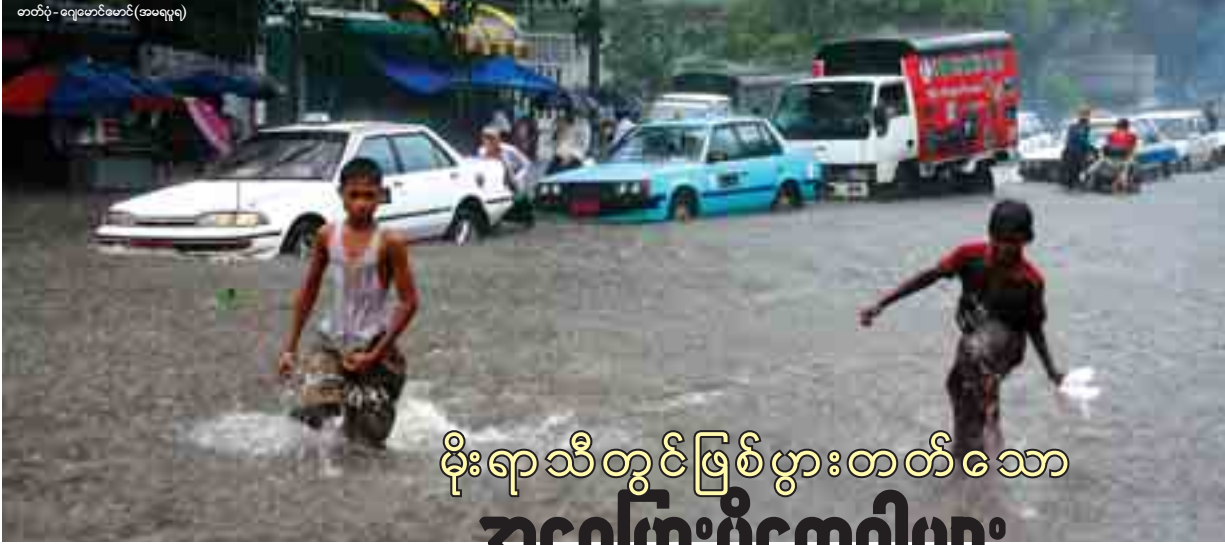
တတ်ပုံ - ရေတော်စောင် (အမရပူရ)