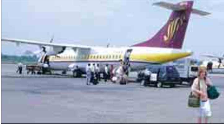
“ဟူး” ဟု အဆိုပါ လေကြောင်းလိုင်းတာဝန်ရှိသူက ပြောသည်။ အဆိုပါလေကြောင်းလိုင်း၏ လက်မှတ်အရောင်းကိုယ်စားလှယ် ရရှိထားသော ကုမ္ပဏီများကမူ ခရီးစဉ်ကို စက်တင်ဘာလဆန်းမှ စ၍ ပျံသန်းမည်ဖြစ်ကြောင်း ပြောသည်။ အဲမန္တလေး လေကြောင်းလိုင်းသည် လေယာဉ်ဖြင့် ပြည်တွင်းခရီးစဉ်အား ဇူလိုင်လနောက်ဆုံးပတ်မှစ၍ ရပ်နားထားခဲ့သည်။