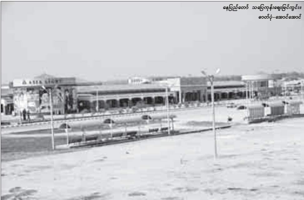
နေပြည်တော် သပြေကုန်းဈေးခြံကွင်း။

နေပြည်တော်၊ ဩဂုတ် - ၂၅ လာမည့် ရွေးကောက်ပွဲအပြီး တက်လာမည့် အစိုးရသစ်လက်ထက်တွင် နိုင်ငံတော် သမ္မတ၏ တိုက်ရိုက် အုပ်ချုပ်မှုအောက်ရှိနေမည့် ပြည်ထောင်စုနယ်မြေဖြစ်သော နေပြည်တော်တွင် ယခု မိုးရာသီကာလအတွင်း အိမ်ခြံမြေအရောင်းဈေးကွက် လှုပ်လှုပ်ရှားရှားဖြစ်လာခဲ့ပြီး ဖြစ်ပေါ်ခဲ့သည့် အရောင်းအဝယ်များတွင် ရေရှည်ရေတိုကာလဖြင့် ရင်းနှီးမြှုပ်နှံသူများ၏ဝယ်ယူမှုပိုများကြောင်း ဒေသခံပြည်သူများနှင့် အကျိုးဆောင်များထံမှ စုံစမ်းသိရှိရသည်။