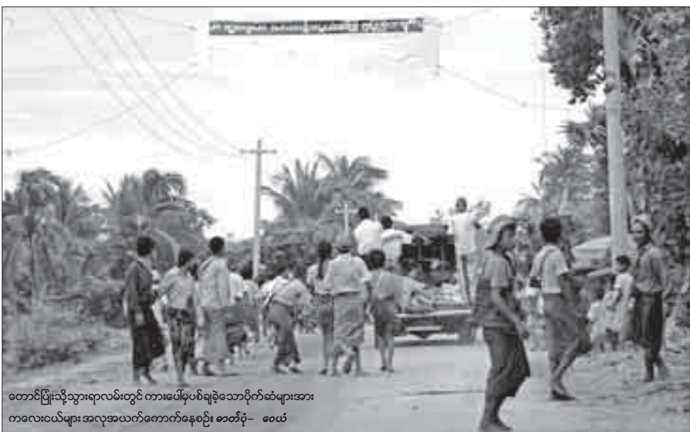
တောင်ပြုံးသို့သွားရာလမ်းတွင် ကားပေါ်မှပစ်ချခဲ့သောပိုက်ဆံများအား ကလေးငယ်များ အလုအယက်တောက်နေပုံကို

ဇေယျ ရန်ကုန်၊ ဩဂုတ်-၂၇ တောင်ပြုံးမင်းနှစ်ပါး ပွဲတော်တွင် ယာဉ်အန္တရာယ်မဖြစ်ပေါ်စေရေးအတွက် ပိုက်ဆံတောင်းခံသူများ အားယာဉ်ပေါ်မှာ ပိုက်ဆံစွန့်ကြဲခြင်းများကို တရားဝင်တားမြစ်ထားသော်လည်း လိုက်နာမှု မရှိကြောင်းသိရသည်။