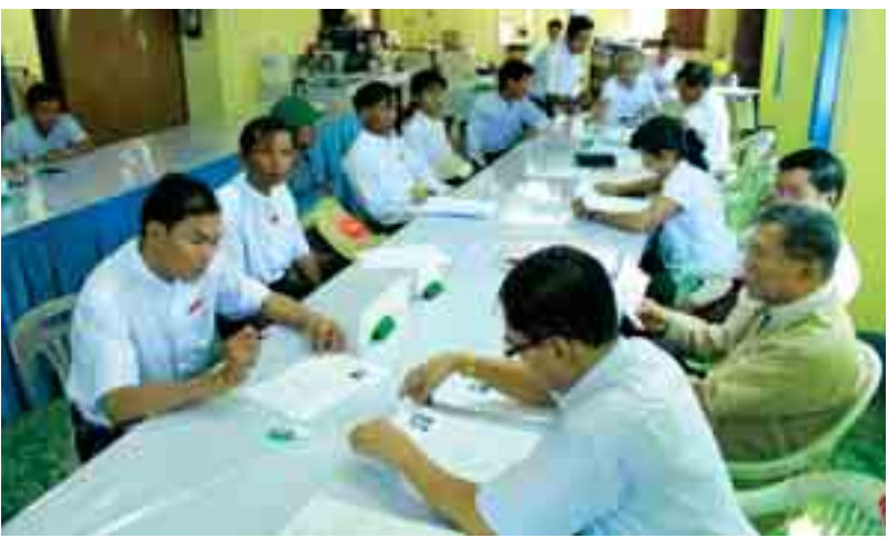
ကိုယ်စားလှယ်လောင်းစာရင်းတင်သွင်းရမည့် နောက်ဆုံးရက်ဖြစ်သော ဩဂုတ်လ ၃၀ ရက်တွင် အနောက်ပိုင်းခရိုင်ရွေးကောက်ပွဲစရိုက်ကော်မရှင်ရုံးတွင် လာရောက်စာရင်းသွင်းနေကြသည့် ပါတီများမှ ကိုယ်စားလှယ်လောင်းများအား တွေ့ရစဉ်။