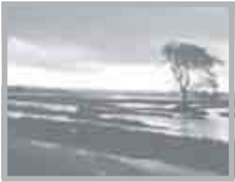
ဘက်လားပင်လယ်အော်အခြေအနေ

ကပ္ပလီပင်လယ်ပြင်နှင့် ဘက်လားပင်လယ်အော်တို့တွင် မုတ်သုံလေ အားအသင့်အတင့်မှ အားကောင်းနိုင်ပါသည်။