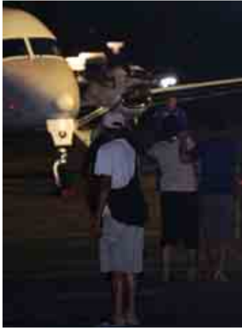
ဖောက်ခွဲရေးပစ္စည်းများနှင့် လက် နက်ခဲယမ်းများကို ဖမ်းဆီးရမိခဲ့ ကြောင်းအင်ဒိုနီးရှားရဲတပ်ဖွဲ့က ပြောကြားသည်။

ယမန်နှစ်အတွင်း အင်ဒိုနီးရှားရဲတပ်ဖွဲ့များ၏ စီးနင်းတိုက် ခိုက်မှုများကြောင့် ဗိုလာမင်တောင် နှင့် ခူလ်မာတင်တို့ သေဆုံးခဲ့ပြီး နောက်ယခုဖမ်းဆီးမှုမှာ တတိယ အကြိမ်မြောက် နာမည်ကြီးအ ကြမ်းဖက်သမားတစ်ဦးကိုတိုက် ခိုက်ဖမ်းဆီးမိခြင်း ဖြစ်သည်။ ဂျာဗားကျွန်းအလယ်ပိုင်း ကွန်ဂရန်ဂန်ရွာရှိ ၎င်းတို့ဌာနရမ်း နေထိုင်သော နေအိမ်တစ်လုံး အားဝင်ရောက် စီးနင်းတိုက်ခိုက် ခဲ့ပြီးနောက် ဆူနာတာနှင့် အ ပေါင်းအပါနှစ်ဦးကို ဖမ်းဆီးရမိခဲ့ ကြောင်းအမျိုးသားရဲတပ်ဖွဲ့ပြော ရေးဆိုခွင့်ရှိသူ ဗိုလ်မှူးချုပ် အက် ဒဝပ်အာရီတိုနန်က အေပီသတင်း ဌာနအားပြောကြားသည်။ ကျော ပိုးအိတ်တစ်လုံးထဲတွင်လည်း ဗုံး တစ်လုံးနှင့် ခြောက်လုံးပြူးသေ နတ်အများအပြားတွေ့ရှိခဲ့ကြောင်း ၎င်းကဆက်လက်ပြောကြားသည်။ အနီးအနားရွာတစ်ရွာအား ဝင်ရောက်စီးနင်းရာတွင်လည်း