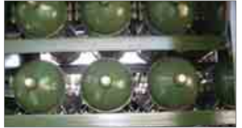
မြောက်ဥက္ကလာပမြို့နယ် ရဲစခန်း မင်္ဂလာဒုံမြို့နယ်ရဲစခန်းမှတာဝန်သို့ လွှဲပြောင်းထားကြောင်း ရှိသူတစ်ဦးကပြောသည်။

ကားပေါ်မှာ ဆေးလိပ်သောက်တာတွေဟာ အလွန်အန္တရာယ်ရှိတဲ့အတွက် မပြုလုပ်သင့်ပါဘူး”ဟု မြောက်ဥက္ကလာပ မြို့နယ်နေသူတစ်ဦးကပြောသည်။ အဆိုပါဖြစ်စဉ်နှင့် ပတ်သက်၍ မင်္ဂလာဒုံရဲစခန်းမှ အမှုဖွင့်အရေးယူဆောင်ရွက်ခဲ့ပြီး ယင်းအမှုနှင့် ပတ်သက်၍ သက်ဆိုင်ရာ