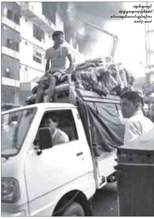
ဈေးမီးများတွင် ဆုံးရှုံးမှုအများဆုံးဖြစ်သော မင်္ဂလာဈေးစီးလောင်ကျွမ်းစဉ်က။ စတုဂံ-စတယ်

အဓိကအားဖြင့် ဈေးများအတွင်း၌ မီးလောင်မှုများမဖြစ်ပွားစေရန် ဖယောင်းတိုင်မီးနှင့် အမွှေးတိုင်မီးထွန်းခြင်းများကို မပြုလုပ်စေရန် ဆောင်ရွက်လျက်ရှိကြောင်း ဈေးတာဝန်ခံရုံးများမှ စုံစမ်းသိရသည်။