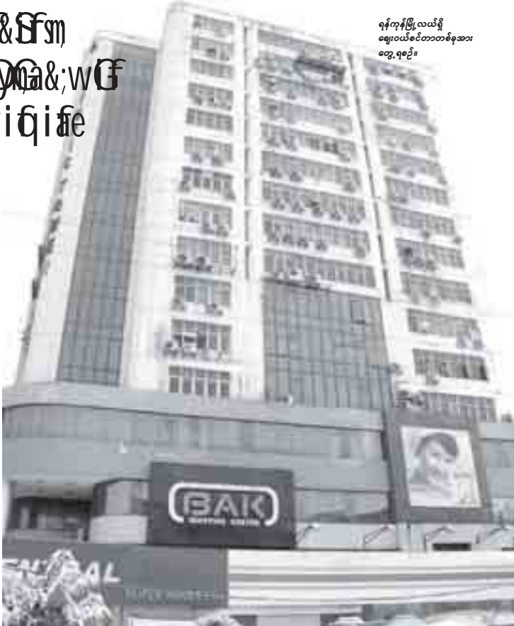
ရန်ကုန်မြို့လယ်ရှိ ဈေးဝယ်စင်တာတစ်ခုအား တွေ့ရစဉ်။

“သူတို့က ပထမ မြို့လယ်မှာ ဝိတာ ၅၀၀၀ မြေကွက်ရှိမရှိကိုမေးတယ်။ ဒီအကျယ်အဝန်းက ရန်ကုန်မြို့တွင်းမှာ အတော်ရှားတယ်။ ပြီးတော့ ဒီမှာ မြေဝယ်ရင်ဘယ်လောက် ငှားမယ်ဆိုရင် ဘယ်လောက်ရှိသလဲဆိုတာကိုလည်း မေးတယ်။ ဒီမှာရှိတဲ့ မြေကွက်တွေ အဆောက်အအုံတွေကိုလည်း သီးသန့်အချိန်ပေးပြီး လေ့လာသွားတယ်”ဟု အထက်ပါပုဂ္ဂိုလ်ကရှင်းပြသည်။ ငှားကဲ့သို့ ပြည်ပလုပ်ငန်းရှင်များက ပြည်တွင်း အိမ်၊ ခြံ၊ မြေလုပ်ငန်းများတွင် ရင်းနှီးမြှုပ်နှံရန်စုံစမ်းမှုရှိနေသော်လည်း ယခင်