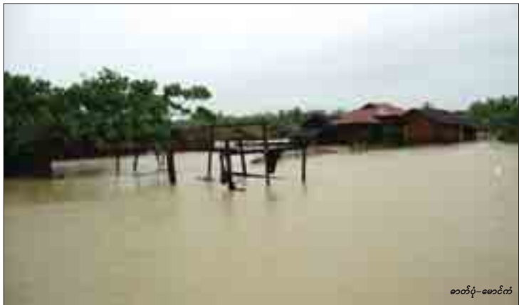
စာတံပုံ-မောင်ကံ

ar0i fr&f &eU&fZ&F23 ဂျပန်နိုင်ငံအစိုးရသည် ဂျပန်အပြည်ပြည်ဆိုင်ရာပူးပေါင်းဆောင်ရွက်ရေးအေဂျင်စီ (JICA)မှတစ်ဆင့် ဂျပန်ယန်း၁၀သန်း(အမေရိကန်ဒေါ်လာ ၁၁၀,၀၀၀)နီးပါး တန်ဖိုးရှိ ရေလှောင်ကန် ၁၅ခု၊ ရေသန့်စင်စက် ၁၅ခု၊ မီးစက် ၂၅လုံး၊ ယာယီတံ၁၀လုံး စသည့်ပစ္စည်းများကို ပြီးခဲ့သည့်ရက်ပိုင်းအတွင်း ရခိုင်ပြည်နယ်၌မိုးသည်ထန်စွာရွာသွန်းကာ မြေပြို၊ ရေကြီးမှုဖြစ်