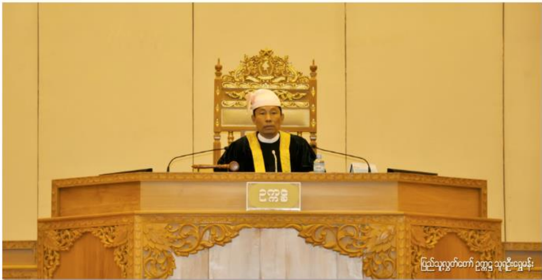
ပြည်သူ့လွှတ်တော် ဥက္ကဋ္ဌ သူရဦးရွှေမန်း

အမှတ် ( ၁ ) ၊ ၂၀၁၂ ခု နှစ် ၊ ဇန်နဝါရီလ ( ၁၀ ) ရက် ၊ တနင်္လာနေ့