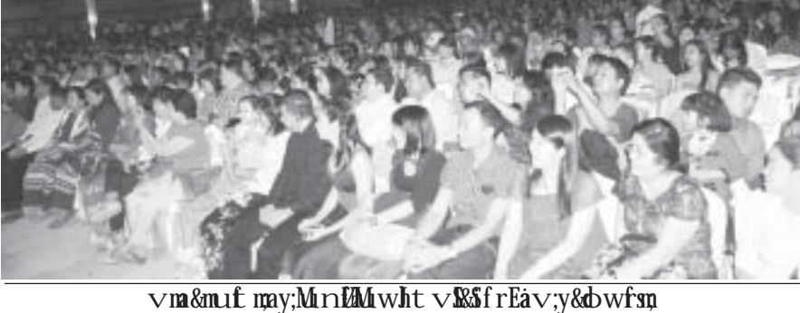
အိမ်ထောင်ရေးအဖွဲ့အစည်းများ

လွင်တို့ကလည်း မြေဖြူကြွကြွတေးသီချင်းများဖြင့် ကပြ ဖျော်ဖြေပေးပြီးနောက် သရုပ်ဆောင်များစွာ ပါဝင်သော ပုခိုင်းသီးWedding တစ်ခန်းရပ်ပြ ဇာတ်ဖြင့် ကပြဖျော်ဖြေပေးသည်။ ပဒေသာကပွဲ သို့ မန္တလေးပရိသတ် ၂၀၀၀ကျော် တက်ရောက် ကြည့်ရှုအားပေးကြပြီး ကပြနေစဉ်အတွင်း အလှူ ငွေ ကျပ် သိန်းနှစ်ထောင်ကျော်ရရှိခဲ့ကြောင်းသိ ရသည်။ SM-D, SM-K