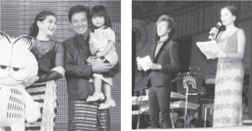
အိမ်ထောင်ရေးအဖွဲ့အစည်းများ