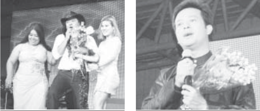
အိမ်ထောင်ရေးအဖွဲ့အစည်းများ