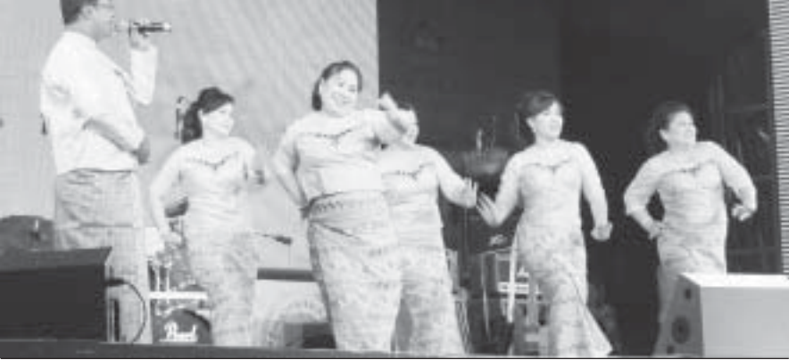
အိမ်ထောင်ရေးအဖွဲ့အစည်းများ