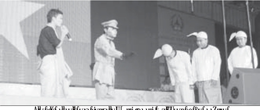
အိမ်ထောင်ရေးအဖွဲ့အစည်းများ