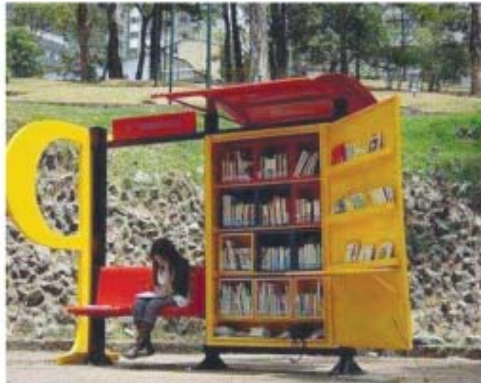
ကားမှတ်တိုင် စာကြည့်တိုက်