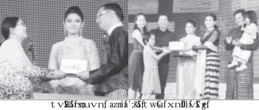
အိမ်ထောင်ရေးအဖွဲ့အစည်းများ