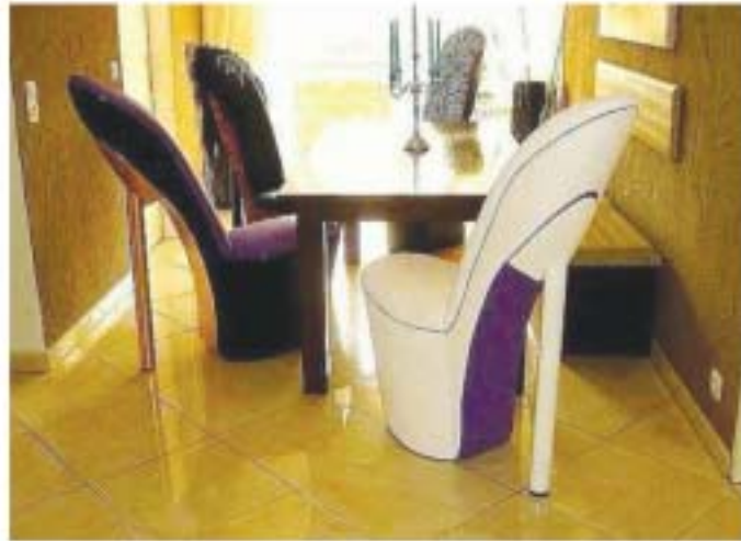
ခေါက်မိနပ် ထိုင်ခုံ