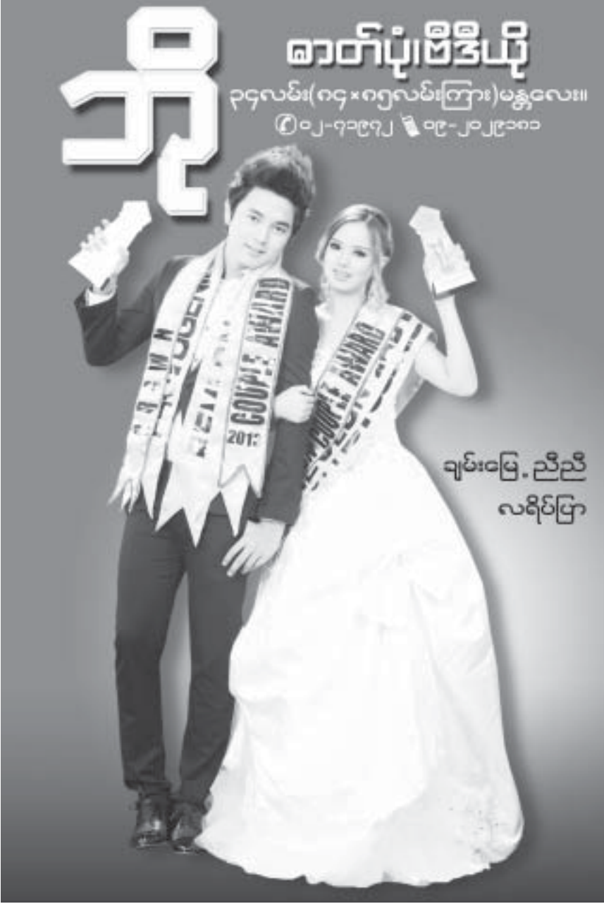
ချမ်းမြေ့ ညီညီ လရိပ်ပြာ

မန်းရတနာပုံလေကြောင်းလိုင်း ကုမ္ပဏီလီမိတက်ကို ၂၀၁၃ ခုနှစ် ဇူလိုင်လတွင် ရင်းနှီးမြှုပ်နှံမှုနှင့် ကုမ္ပဏီများ ညွှန်ကြားမှုဦးစီးဌာနက မှတ်ပုံတင်ပေးခဲ့ပြီး ပြည်တွင်းပြည်ပလေကြောင်းပျံသန်းရေးဝန်ဆောင်မှုလုပ်ငန်းအား မန္တလေးအပြည်ပြည်ဆိုင်ရာလေဆိပ်ကိုအခြေစိုက်၍ လုပ်ကိုင်ဆောင်ရွက်ရန် မြန်မာနိုင်ငံရင်းနှီးမြှုပ်နှံမှုကော်မရှင်က ၂၀၁၄ခုနှစ် ဇန်နဝါရီလ ၂၇ ရက်တွင် ခွင့်ပြုမိန့်ထုတ်ပေးခဲ့သည်။