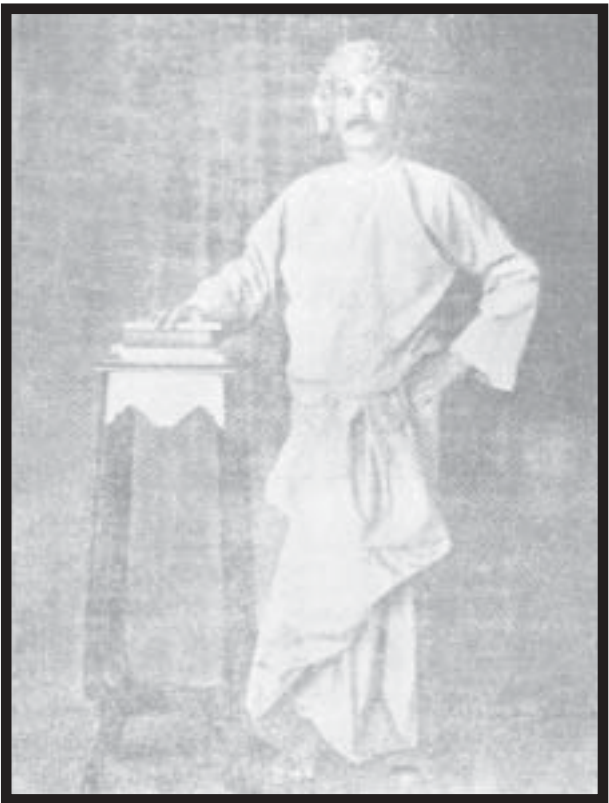
နောက်လာတဲ့ မောင်ပု လဲ(လည်း) ဘမော်ထက်က