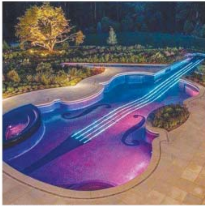
တယောရေကူးကန်