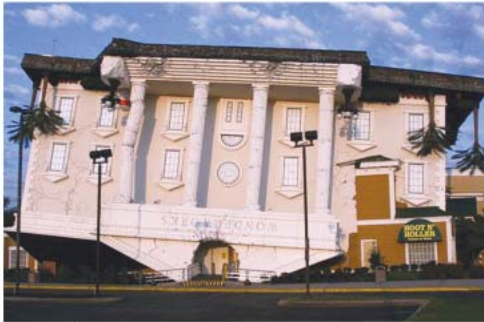
တောင်တိုး အလုပ်ရုံ