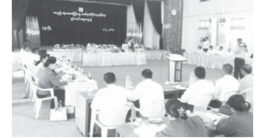
မုံရွာမြို့နယ်အစိုးရအဖွဲ့ဝင်များက အနည်းဆုံးအခကြေးငွေသတ်မှတ်ရေးဆိုင်ရာ ရှင်းလင်းဆွေးနွေးပွဲကို မတ် ၄ ရက်၊ အင်္ဂါနေ့နံနက်ပိုင်းက မုံရွာမြို့ မြို့တော်ခန်းမ၌ကျင်းပခဲ့သည်။

အလုပ်သမားများအား အလွန်နည်းပါးသော အခကြေးငွေပေးခြင်းမှ ကာကွယ်ရန် လက်ရှိရရှိနေသော လုပ်ခထက်လျော့နည်းမှုမရှိသော အခကြေးငွေသတ်မှတ်ပေးနိုင်ရန်နှင့် လုပ်ငန်းခွင်အေးချမ်းသာယာရေးကို အားပေးအထောက်အကူပြုနိုင်ရေးအတွက် အလုပ်ရှင်များက မမျှတသောလုပ်အားခပေးခြင်းမှ ကာကွယ်ရန်ဟူသော ရည်ရွယ်ချက်များဖြင့် အနည်းဆုံးအခကြေးငွေသတ်မှတ်ရေးဆိုင်ရာ ရှင်းလင်းဆွေးနွေးပွဲကို မတ် ၄ ရက်၊ အင်္ဂါနေ့နံနက်ပိုင်းက မုံရွာမြို့ မြို့တော်ခန်းမ၌ကျင်းပခဲ့သည်။ အဆိုပါ ရှင်းလင်း ဆွေးနွေးပွဲတွင် အနည်းဆုံးအခကြေးငွေသတ်မှတ်ရေးဆိုင်ရာ အမျိုးသားကော်မတီ ဒုတိယဥက္ကဋ္ဌ အလုပ်သမား၊ အလုပ်အကိုင်နှင့် လူမှုဖူလုံရေး ဝန်ကြီးဌာန ပြည်ထောင်စုဝန်ကြီးမှ (၂၀၁၃ ခုနှစ် ဇူလိုင်လ ၁၂ ရက်)နေ့တွင် လက်မှတ်ရေးထိုး ထုတ်ပြန်ခဲ့သည်။ ထို့နောက် အနည်းဆုံးအခကြေးငွေ သတ်မှတ်နိုင်ရေးဆိုင်ရာ အမျိုးသားကော်မတီဖွဲ့စည်းခြင်း၊ ပြည်ထောင်စုနယ်မြေ၊ တိုင်းဒေသကြီး၊ ပြည်နယ်အနည်းဆုံးအခကြေးငွေသတ်မှတ်နိုင်ရေးဆိုင်ရာ ကော်မတီများကို ဖွဲ့စည်းလျက်ရှိကြောင်း သိရသည်။ ရန်ကုန်၊ မန္တလေးနှင့် အခြားတိုင်းဒေသကြီးနှင့် ပြည်နယ်များတွင်လည်းစီမံချက်ဖြင့် အလုပ်ရှင်၊ အလုပ်သမားတွေဆုံဆွေးနွေးပွဲများ ဆောင်ရွက်ပြီး ILO, MMRD, MDRI တို့မှ ရန်ကုန်၊ မန္တလေး၊ ပဲခူးတိုင်းဒေသကြီးများတွင် စာရင်းစစ်တမ်းများကောက်ယူလျက်ရှိကြောင်း သိရသည်။