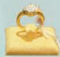
400000 Ks ဝန်းကျင်