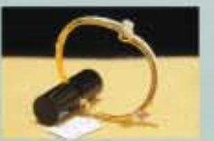
1100000 Ks ဝန်းကျင်