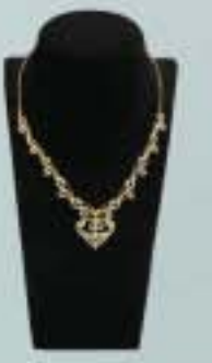
3600000 Ks ဝန်းကျင်