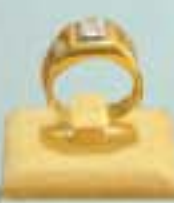
500000 Ks ဝန်းကျင်