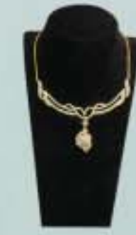
4400000 Ks ဝန်းကျင်